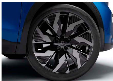
20" könnyűfém CASTELLET keréktárcsa