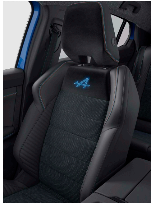
Alcantara bőr ülésbőrbevonat természetes forrásokból származó műbőr betétekkel Alpine kék / fehér / piros varrásokkal