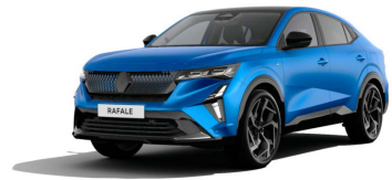
Matt Alpine kék