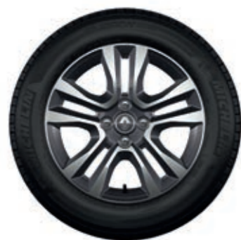
Rines de aluminio bitono diamantado de 16"