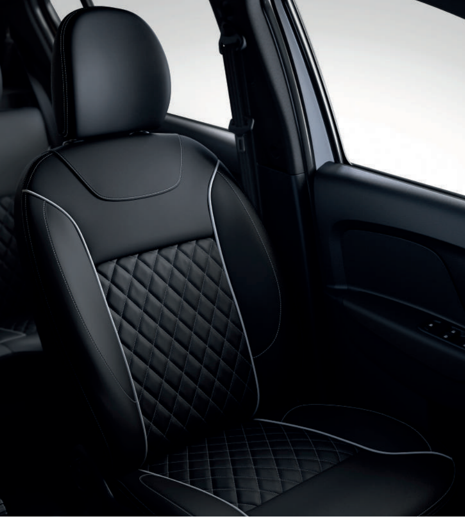
vestiduras de asiento de piel sintética A/A automático