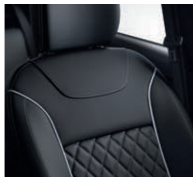
vestiduras de asiento de piel sintética