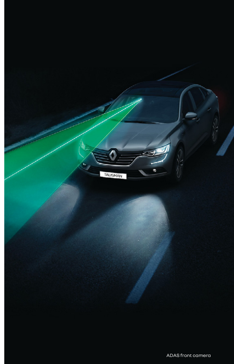
ADAS front camera