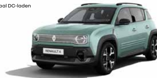
150 pk comfort range techno vanaf € 34.990