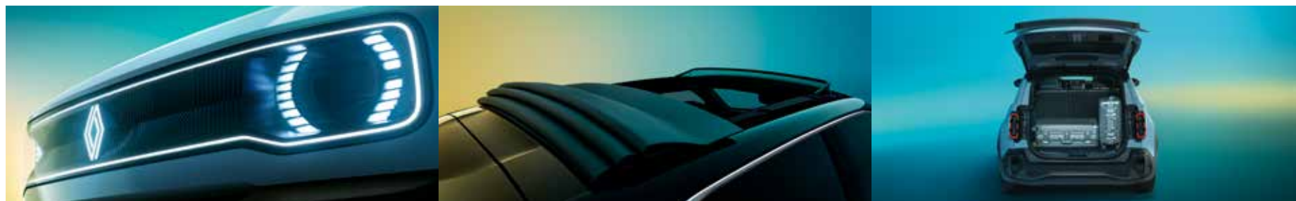
canvas dak 'plein sud'™ later beschikbaar