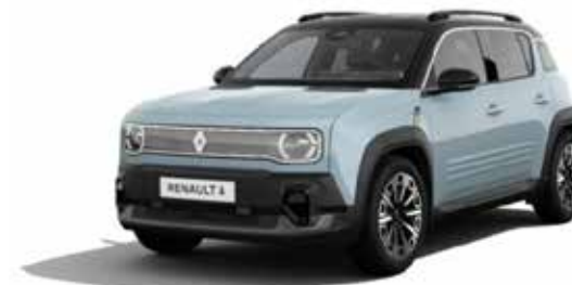
150 pk comfort range iconic vanaf € 36.490