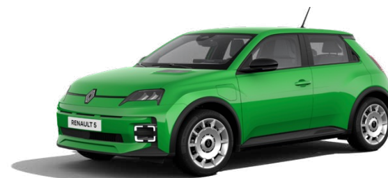
95 pk urban range FIVE vanaf € 24.990