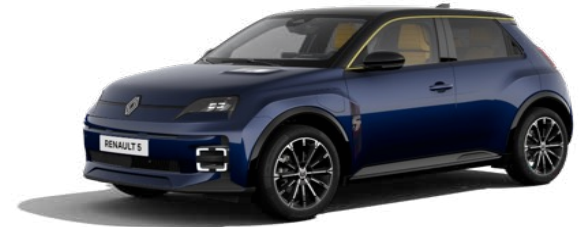
120 pk urban range iconic cinq vanaf € 31.790 150 pk comfort range iconic cinq vanaf € 34.790