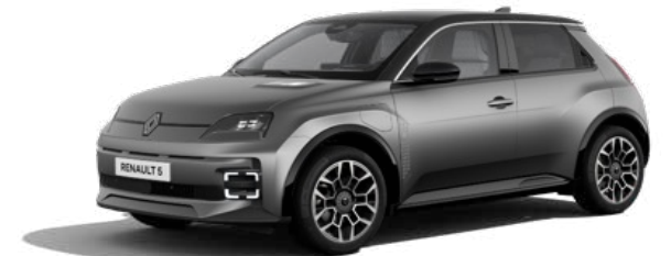
150 pk comfort range Roland-Garros vanaf € 36.290