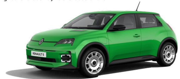
120 pk urban range evolution vanaf € 27.990