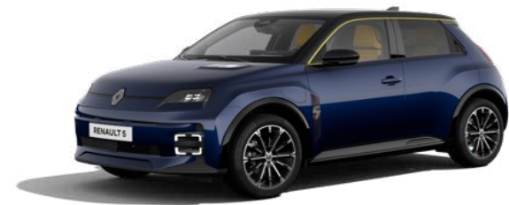
120 pk urban range iconic cinq vanaf € 31.490 150 pk comfort range iconic cinq vanaf € 34.490