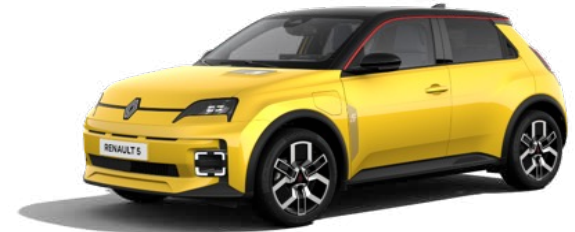
120 pk urban range techno vanaf € 29.990 150 pk comfort range techno vanaf € 32.990