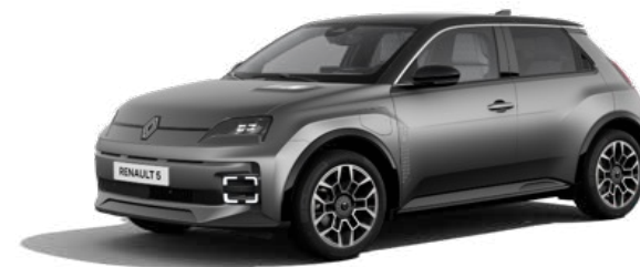
150 pk comfort range Roland-Garros vanaf € 35.990