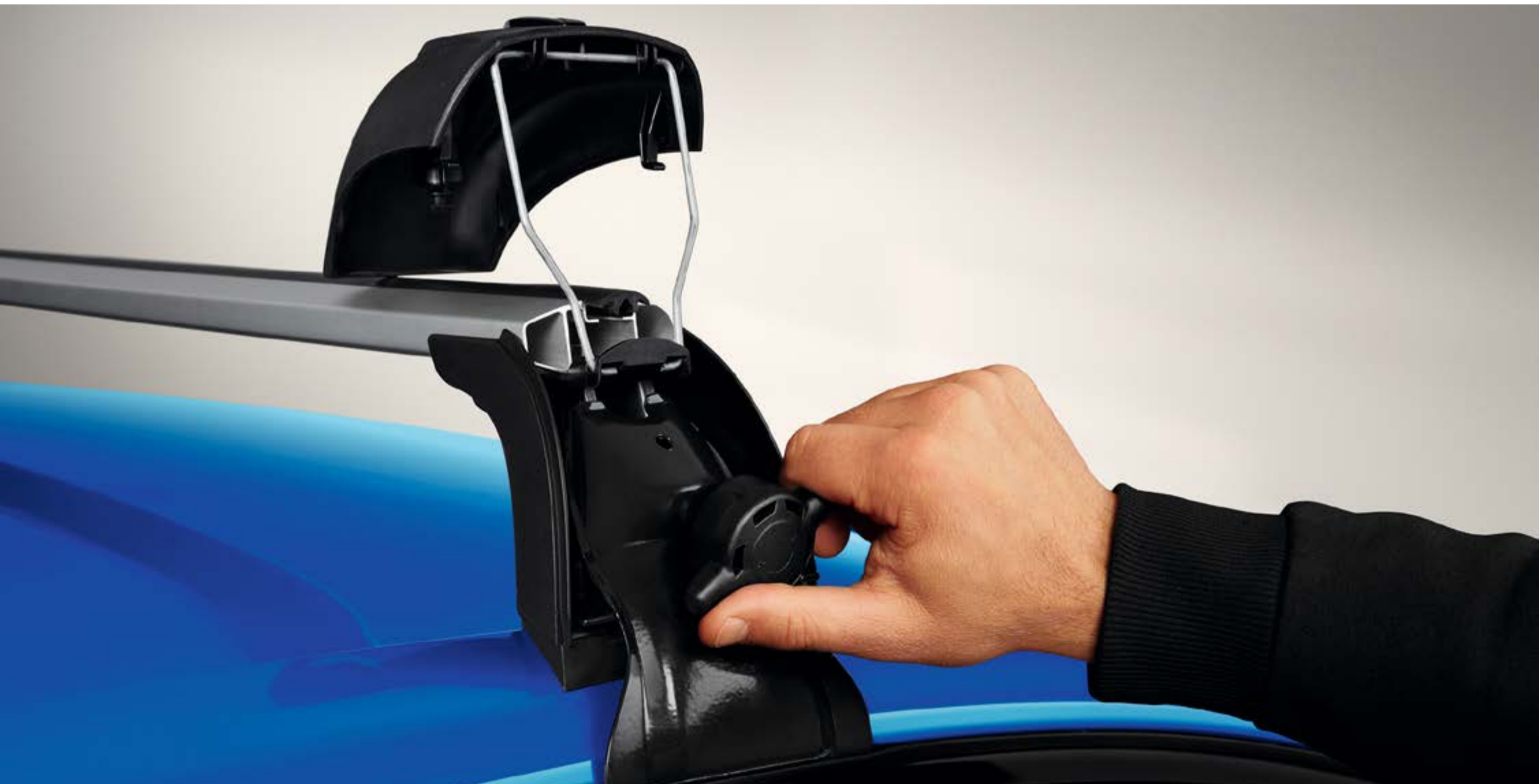
aluminiowe poprzeczki dachowe QuickFix

Poświęć mniej czasu na przygotowania do podróży, a więcej na to, co kochasz najbardziej. Dzięki systemowi quickfix montaż poprzeczek dachowych jest błyskawiczny i nie wymaga użycia narzędzi.