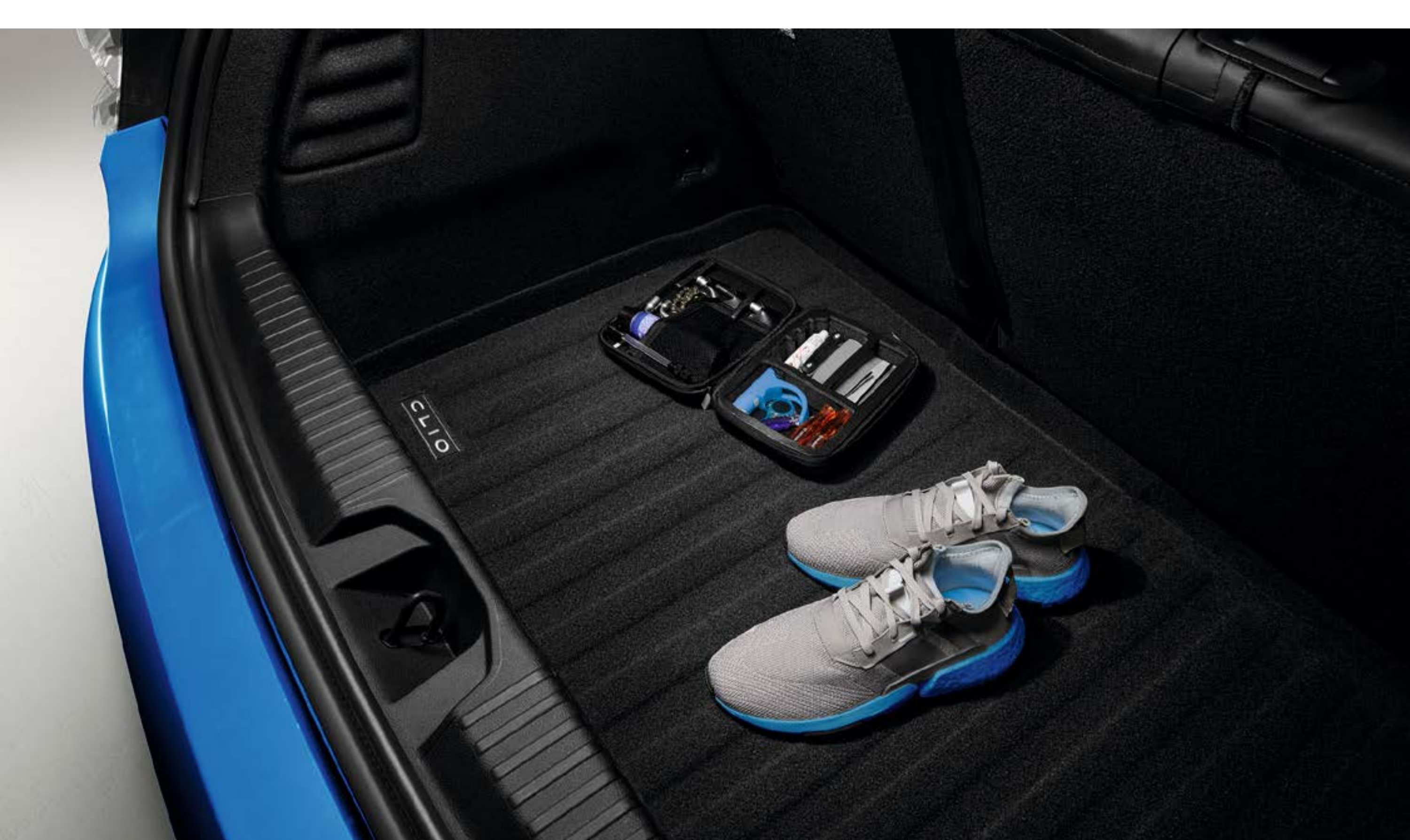
dwustronny wkład do bagażnika

Ten dwustronny wkład, wykonany z wodoodpornego materiału, idealnie dopasowuje się do kształtu bagażnika, a dzięki podwyższonym krawędziom doskonale sprawdzi się w codziennym użytkowaniu i zapewni skuteczną ochronę przestrzeni bagażowej Twojego Renault Clio.