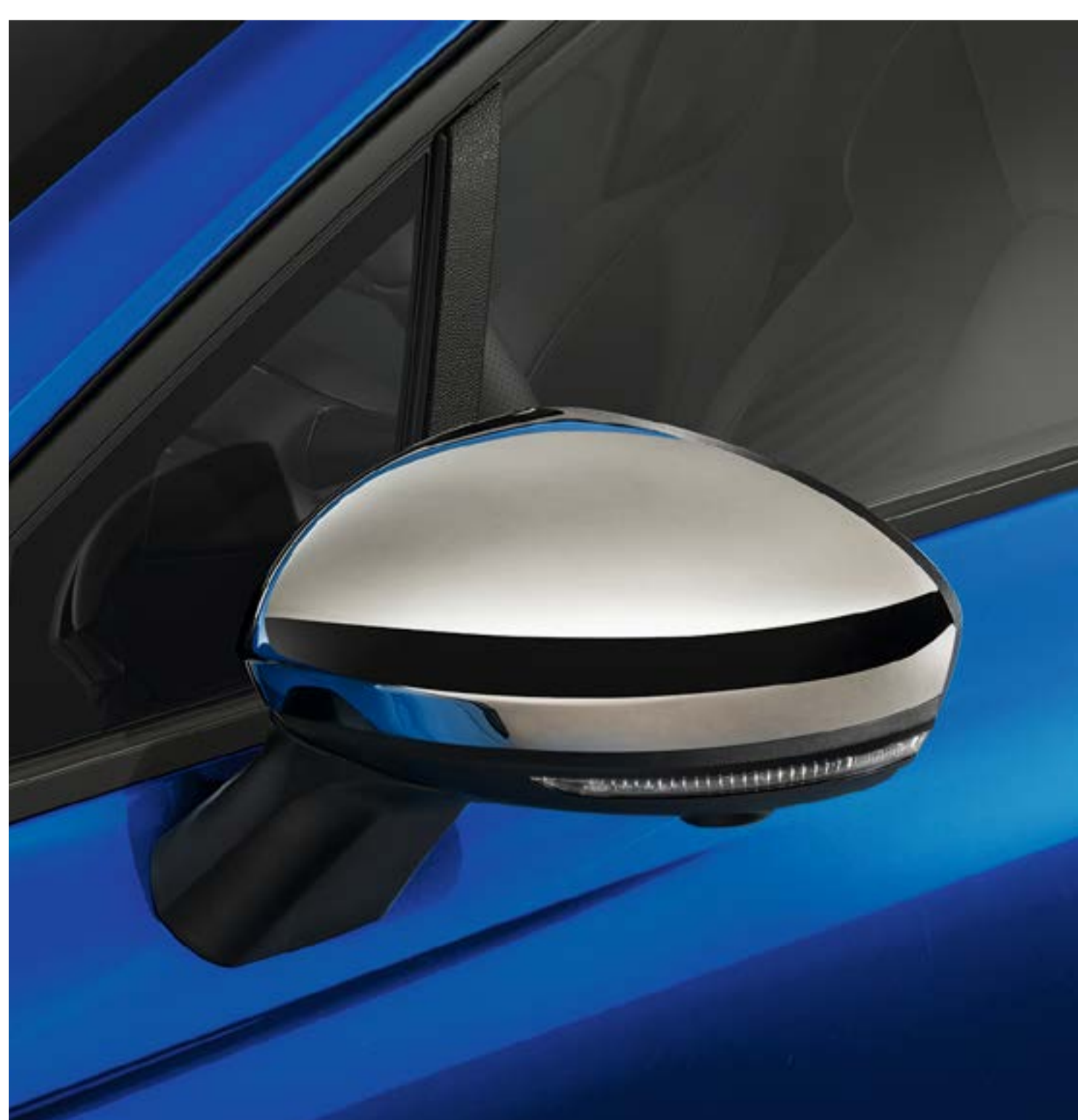
chromowane obudowy lusterek bocznych