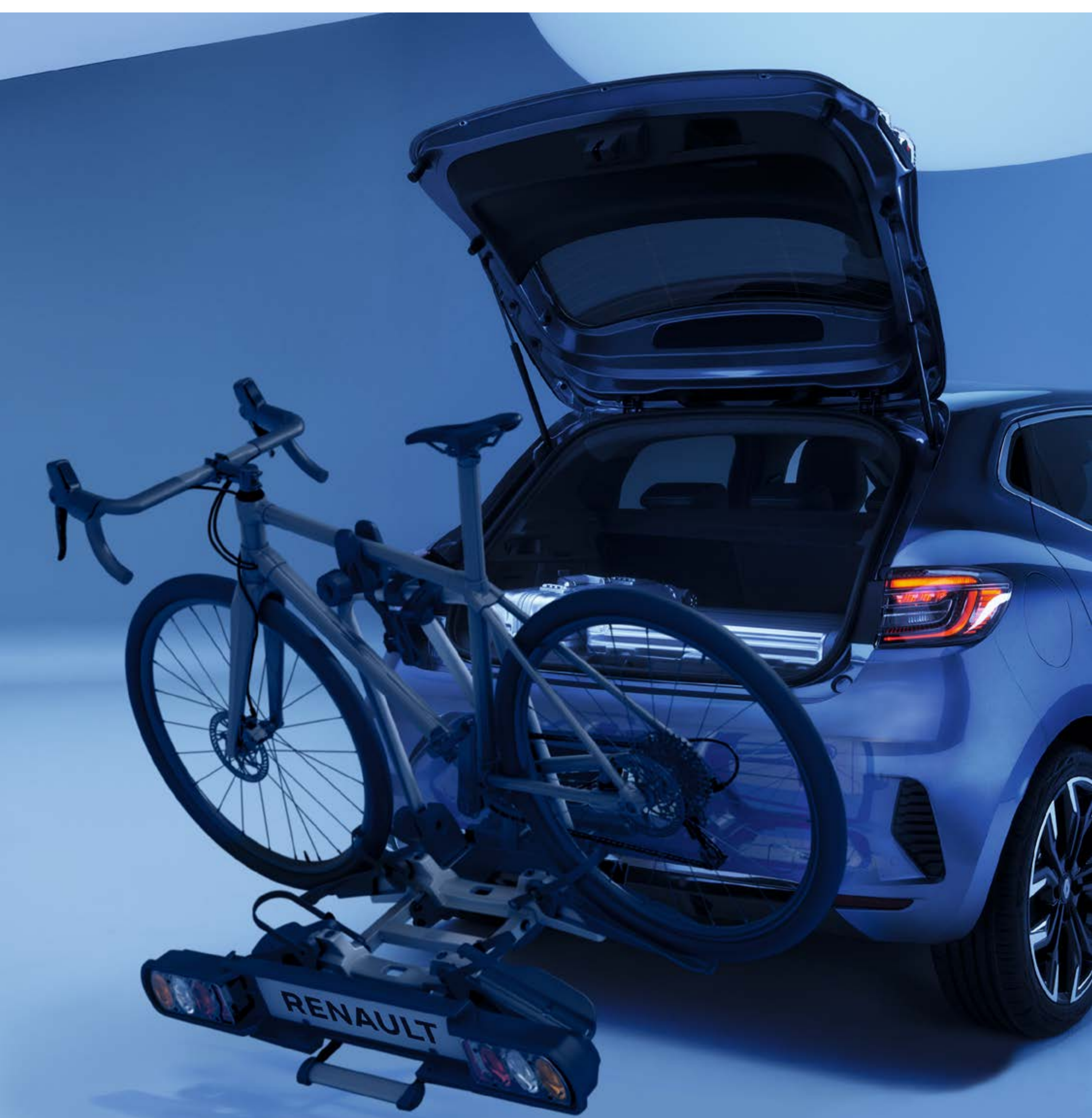
bagażnik rowerowy zamontowany na półautomatycznym haku holowniczym

Dzięki naszym hakom holowniczym transport i holowanie jeszcze nigdy nie były takie proste. Składany, odchylany bagażnik na rowery można zamontować na półautomatycznym haku holowniczym. Dostęp do bagażnika samochodu jest możliwy, nawet kiedy na stelażu są rowery.