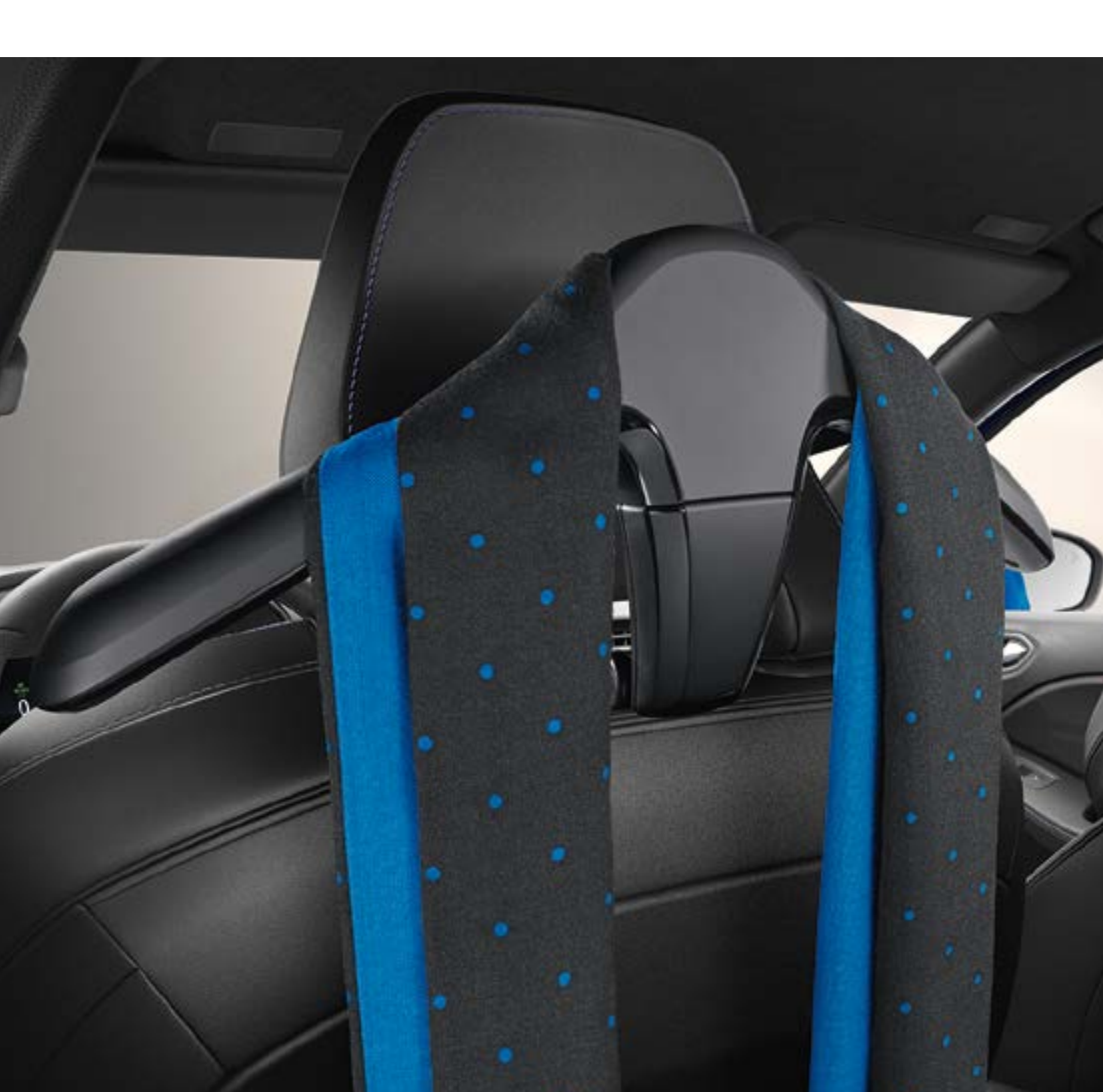
wieszak na ubrania – element systemu wielofunkcyjnego

Mamy dla Ciebie dwie dobre rady, które sprawdzą się na co dzień i ułatwią podróżowanie – zawsze odwieszaj swoje ubranie na wieszak przystosowany specjalnie do tego celu. Dzięki ładowarce bezprzewodowej w każdej chwili możesz doładować telefon podczas podróży.