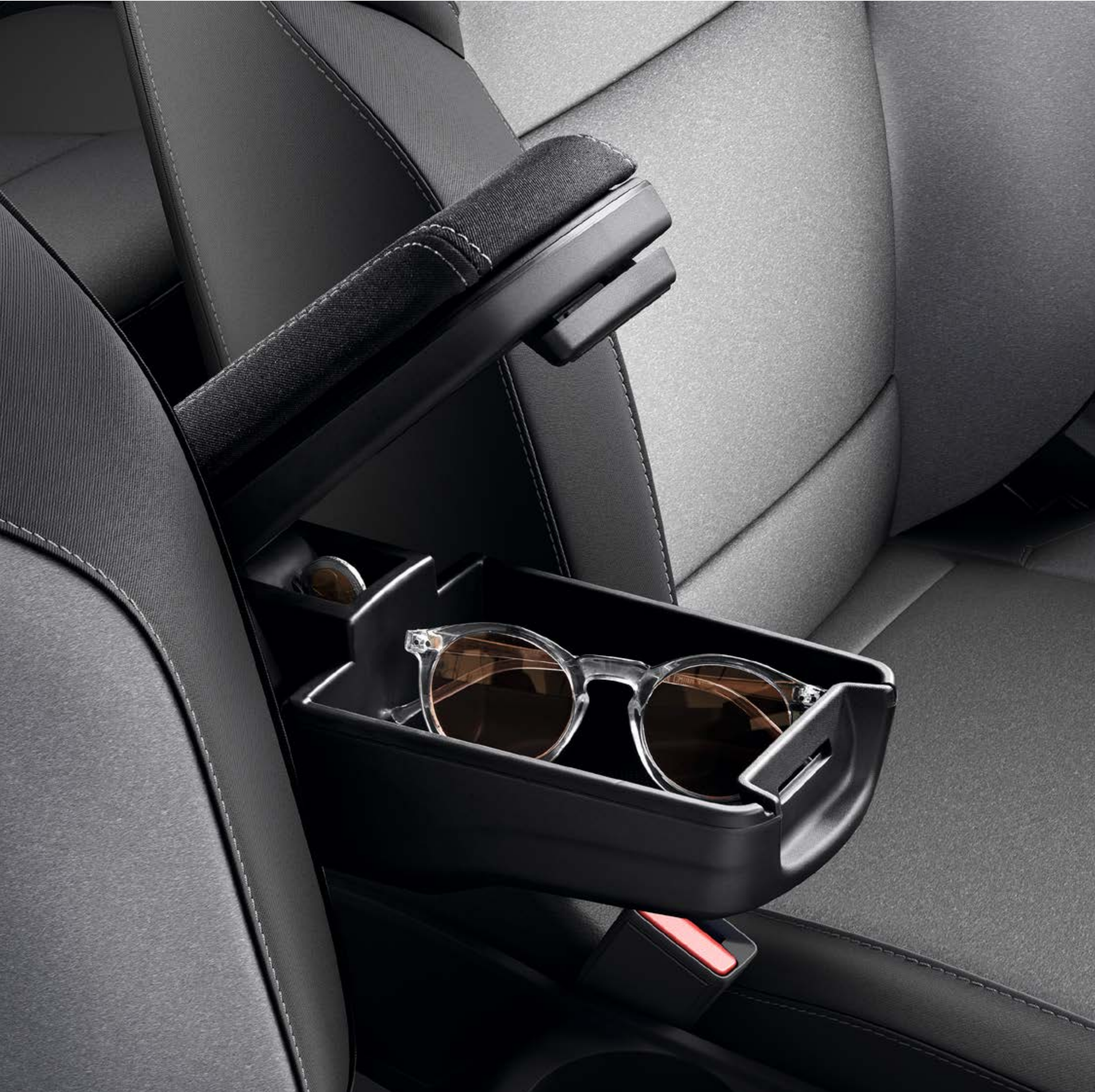
przedni podłokietnik (1)

Bardzo szeroka gama eleganckich i funkcjonalnych akcesoriów, które uprzyjemnią Ci każdą podróż. Na przykład centralny podłokietnik – zapewni nie tylko dodatkowy komfort, lecz także może stać się praktycznym schowkiem.