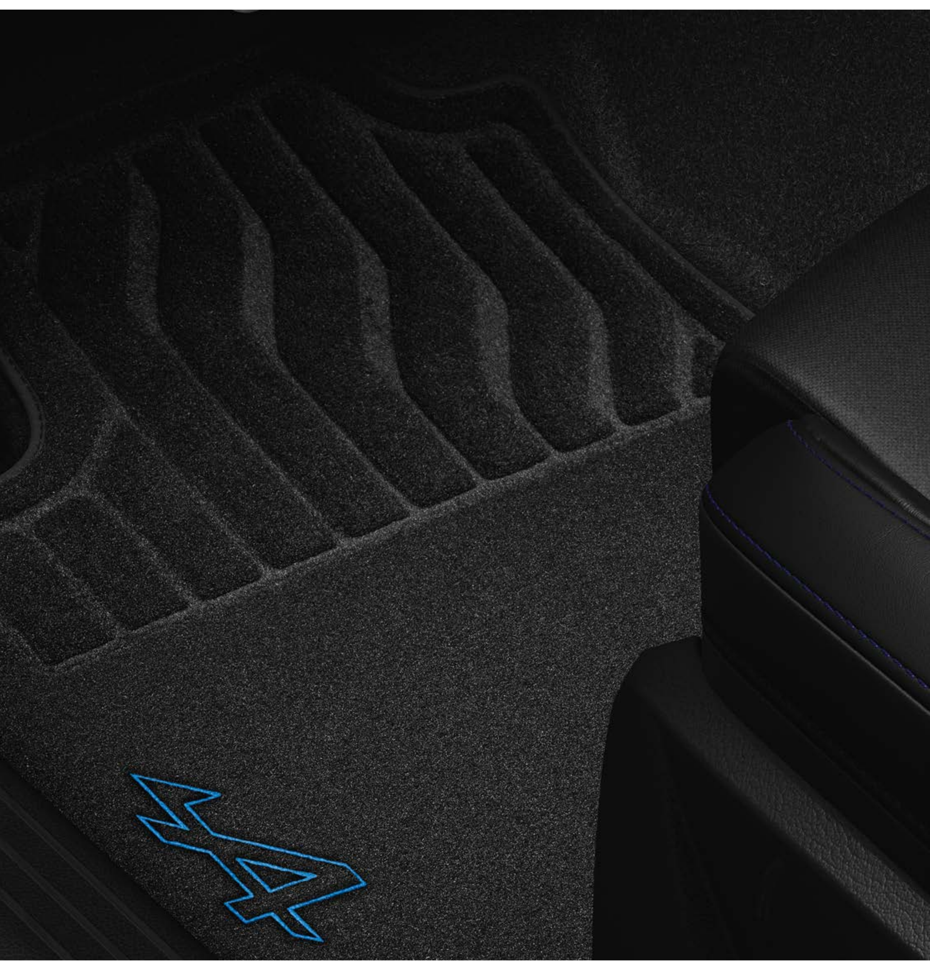
dywaniki esprit Alpine

Dywaniki esprit Alpine dodadzą wnętrzu sportowego charakteru.