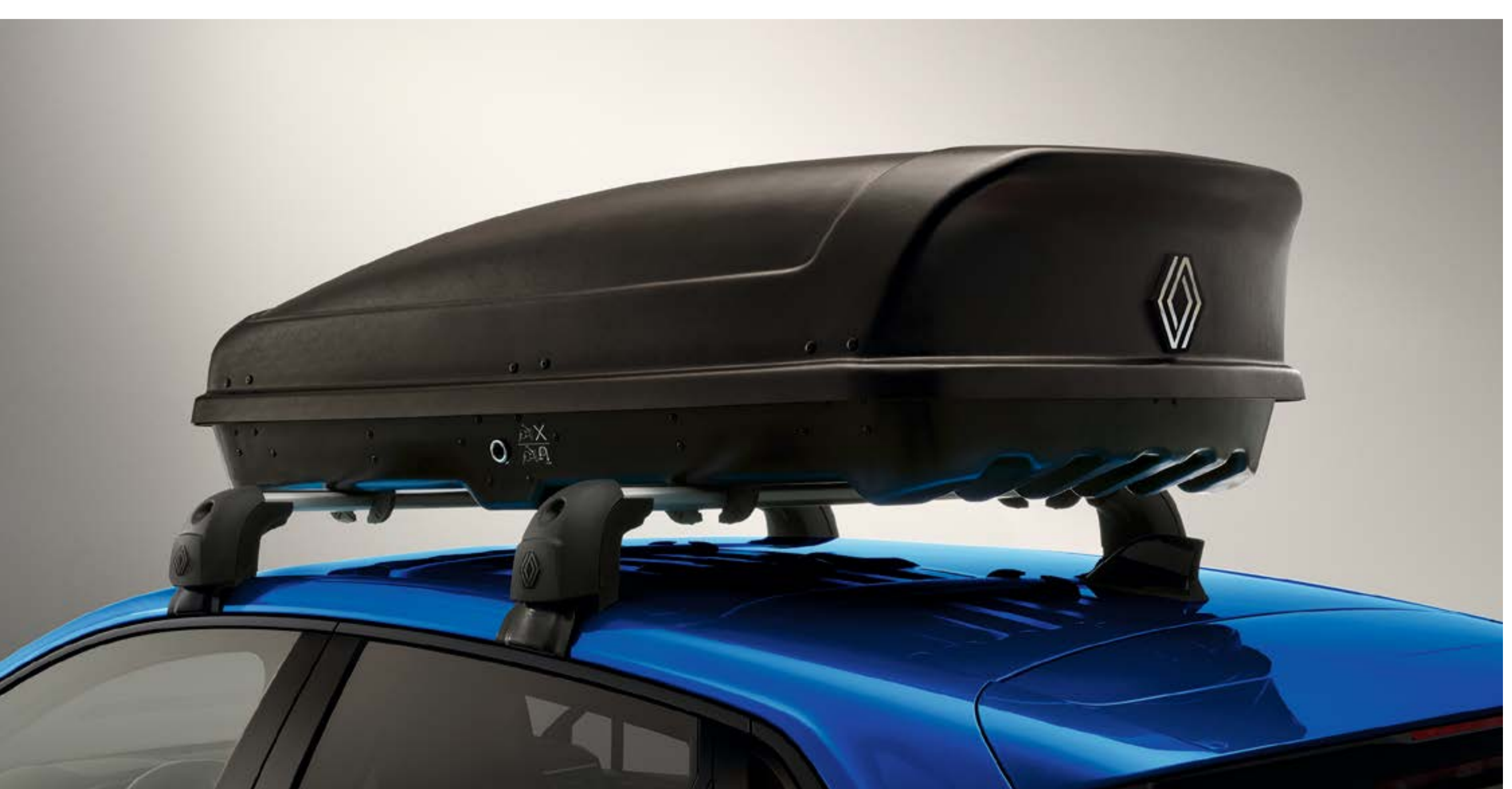
kufer dachowy - 380 l

Zapewnij sobie większą przestrzeń ładunkową, dzięki łatwemu w mocowaniu kufrom dachowym i uchwytom na narty.