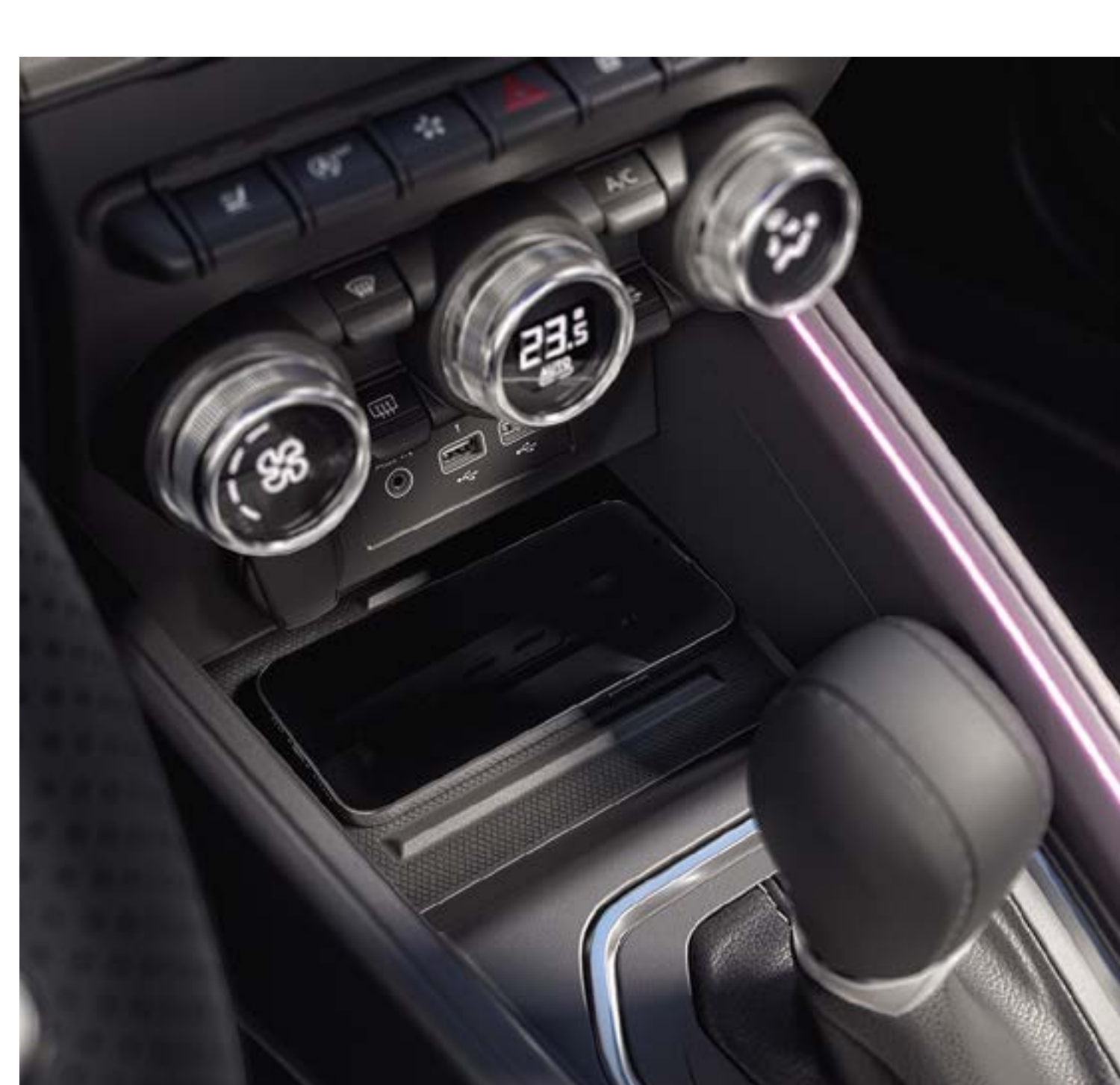
bezprzewodowa ładowarka (1)

Chroń się przed słońcem i podróżuj komfortowo w dyskretnie zacienionym wnętrzu dzięki naszym osłonom przeciwsłonecznym na szyby boczne i tylną szybę.