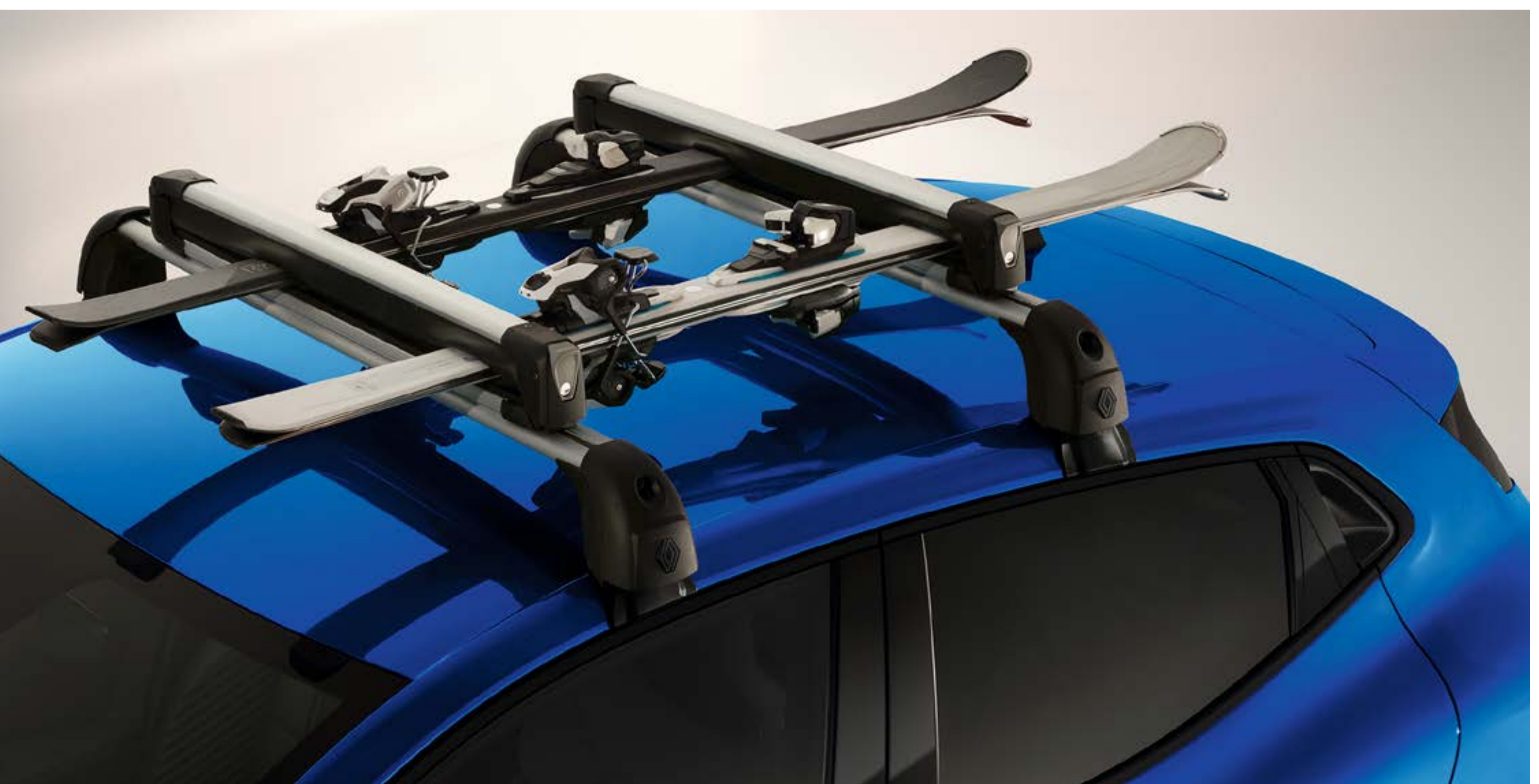
uchwyt na narty - 4 pary nart / 2 deski snowboardowe - zdjęcie niewiążące