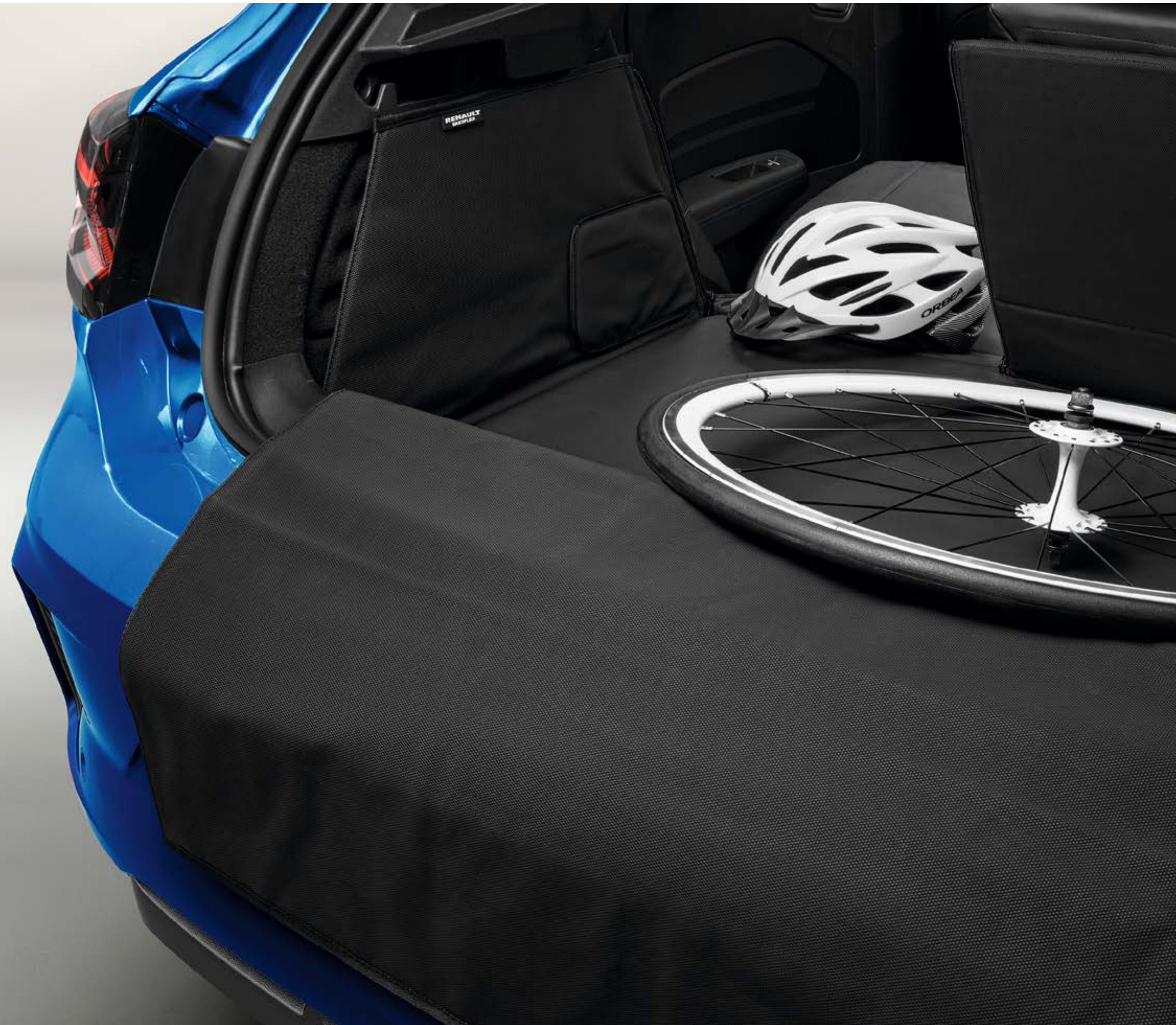
modułowe zabezpieczenie bagażnika easyflex

Mimo upływu czasu Twoje Nowe Renault Clio E-Tech full hybrid będzie wyglądało zawsze świeżo i pięknie dzięki zabezpieczeniu bagażnika wodoodporną, składaną matą easyflex, która dokładnie zakryje całą powierzchnię przestrzeni bagażowej, a w razie potrzeby ochroni również próg bagażnika. Zapewni bezpieczne przewożenie nawet dużych i zabrudzonych przedmiotów.