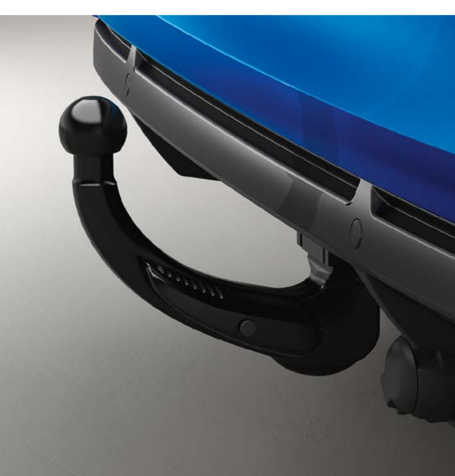
hak holowniczy demontowany bez użycia narzędzi swan neck towbar