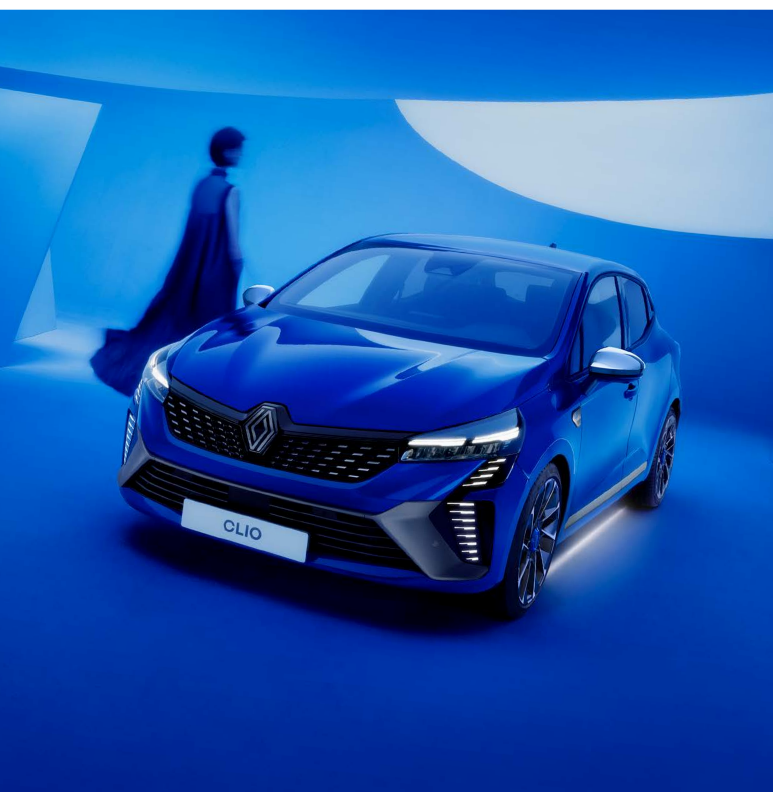
shark fin antenna, chrome door mirror shells and underbody approach light

Już nigdy nie będziesz miał trudności z odnalezieniem samochodu na słabo oświetlonym parkingu. Gdy będziesz się zbliżać do niego, rozpoznasz go od razu – oświetlenie LED pod podwoziem i światła mijania włączą się automatycznie. Antena w kształcie płetwy rekina, chromowane obudowy lusterek bocznych i oświetlenie powitalne pod podwoziem.