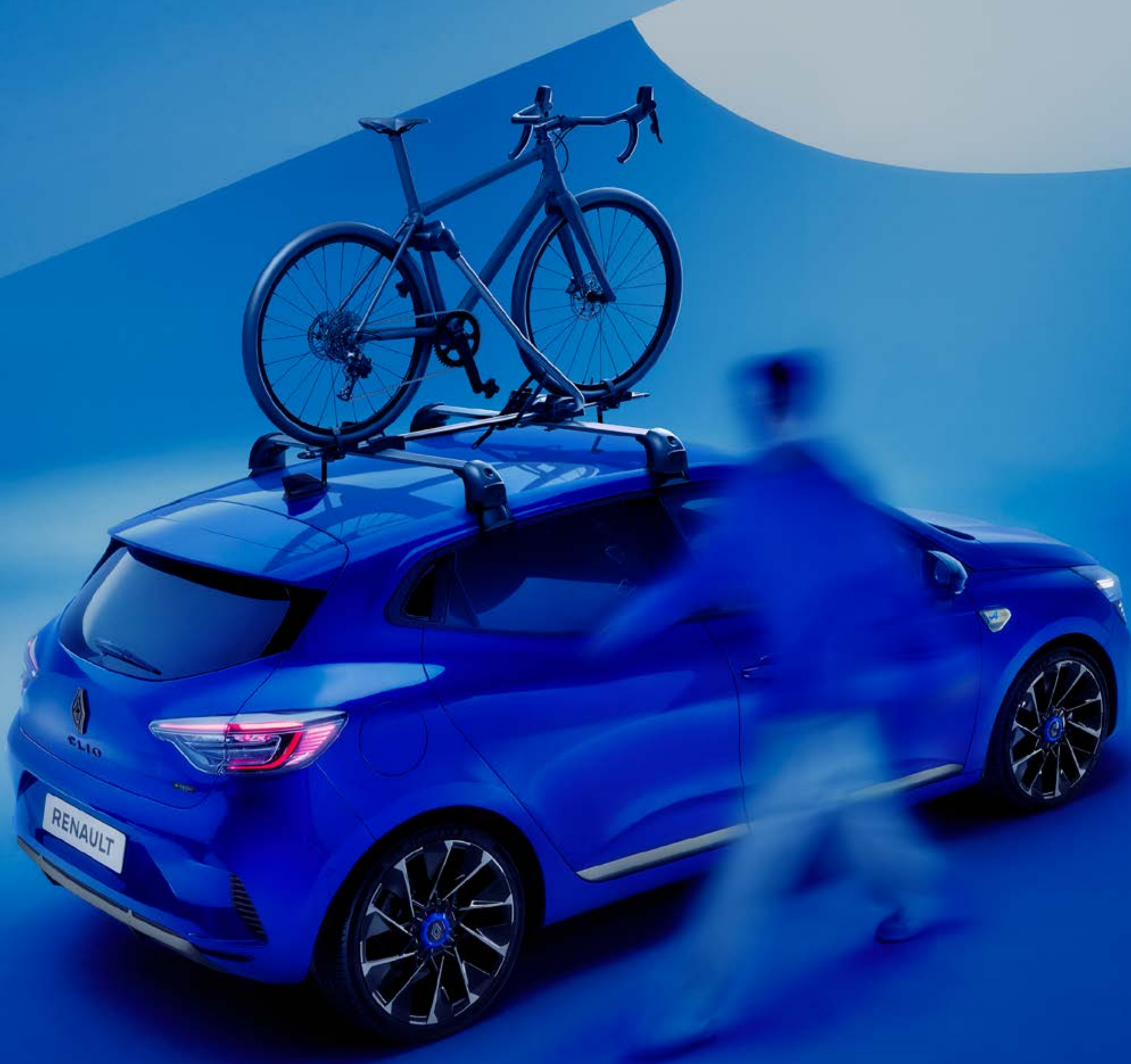
uchwyt rowerowy montowany na aluminiowych poprzeczkach dachowych quickfix

Bezpiecznie przewieziesz swój rower dzięki praktycznemu uchwytowi rowerowemu. Ruszaj w podróż z poczuciem pełnego spokoju ducha.