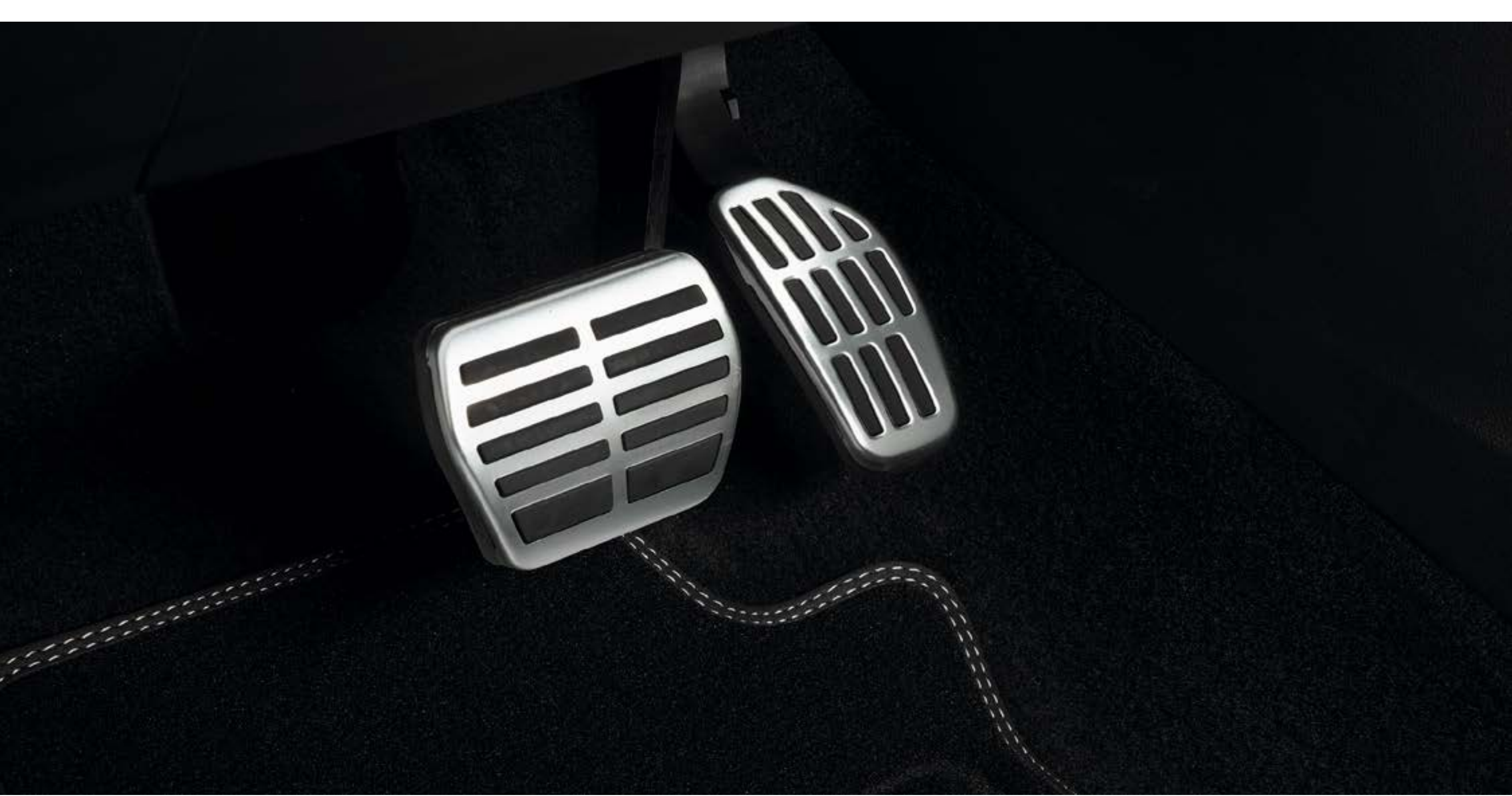
aluminiowe sportowe nakładki na pedały – w wersji z automatyczną skrzynią biegów (1)(2)

Podkreśl dynamiczny charakter wnętrza dzięki aluminiowym nakładkom na pedały.