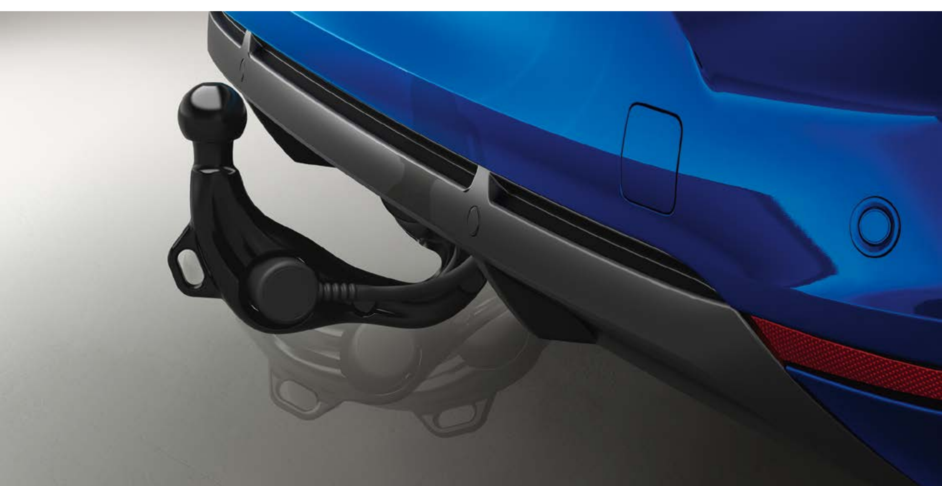
składany półautomatyczny hak holowniczy

Po złożeniu, które zajmuje zaledwie kilka sekund, półautomatyczny hak holowniczy staje się zupełnie niewidoczny.