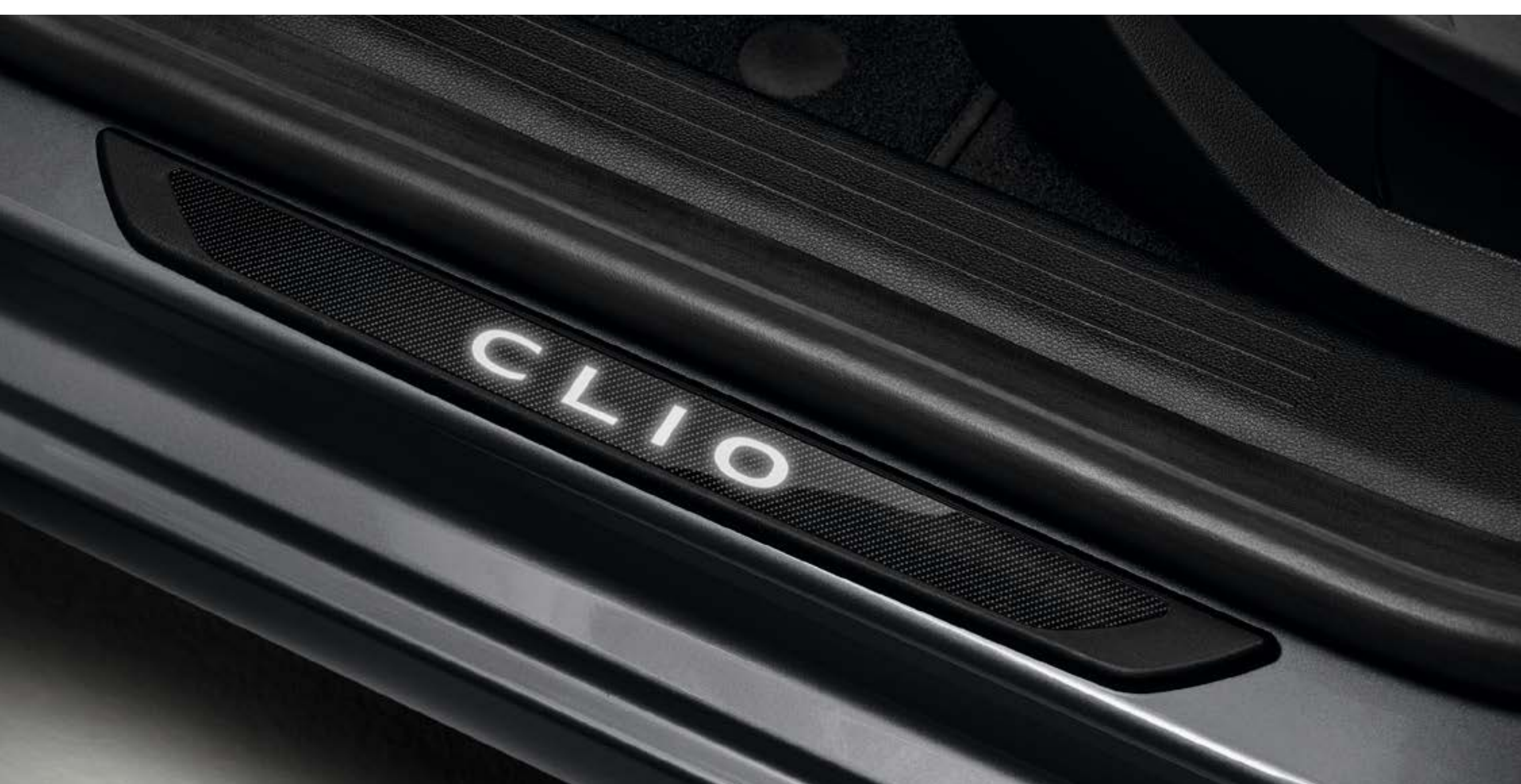
podświetlane listwy progowe Clio (1)

Podświetlane listwy progowe potęgują wrażenie ekskluzywności, a jednocześnie skutecznie chronią próg drzwi twojego Clio.