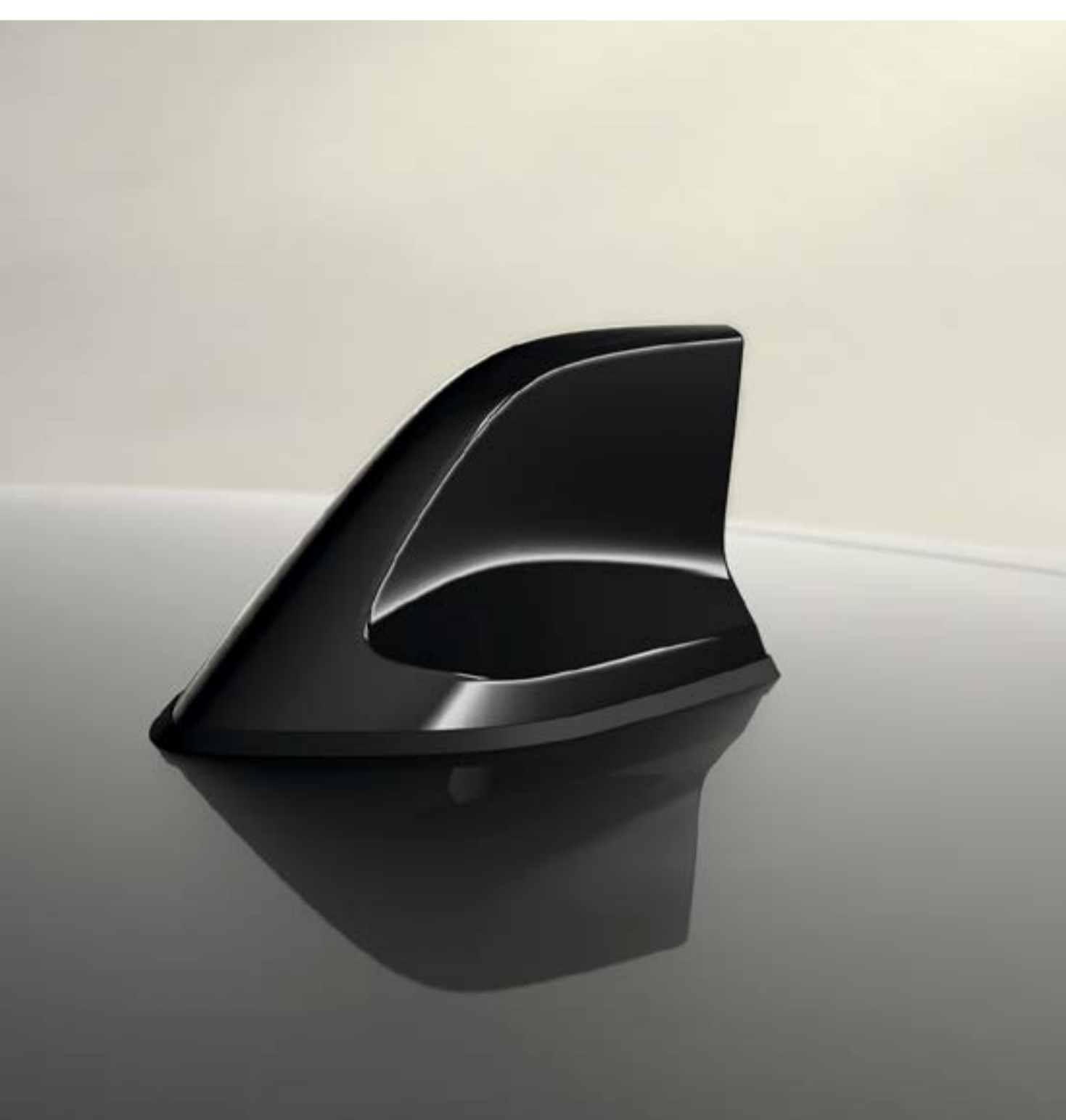
antena w kształcie płetwy rekina (1)

Wyraź siebie i postaw na unikatowy miejski styl – wybierz chromowane obudowy lusterek bocznych i antenę typu „płetwa rekina”.