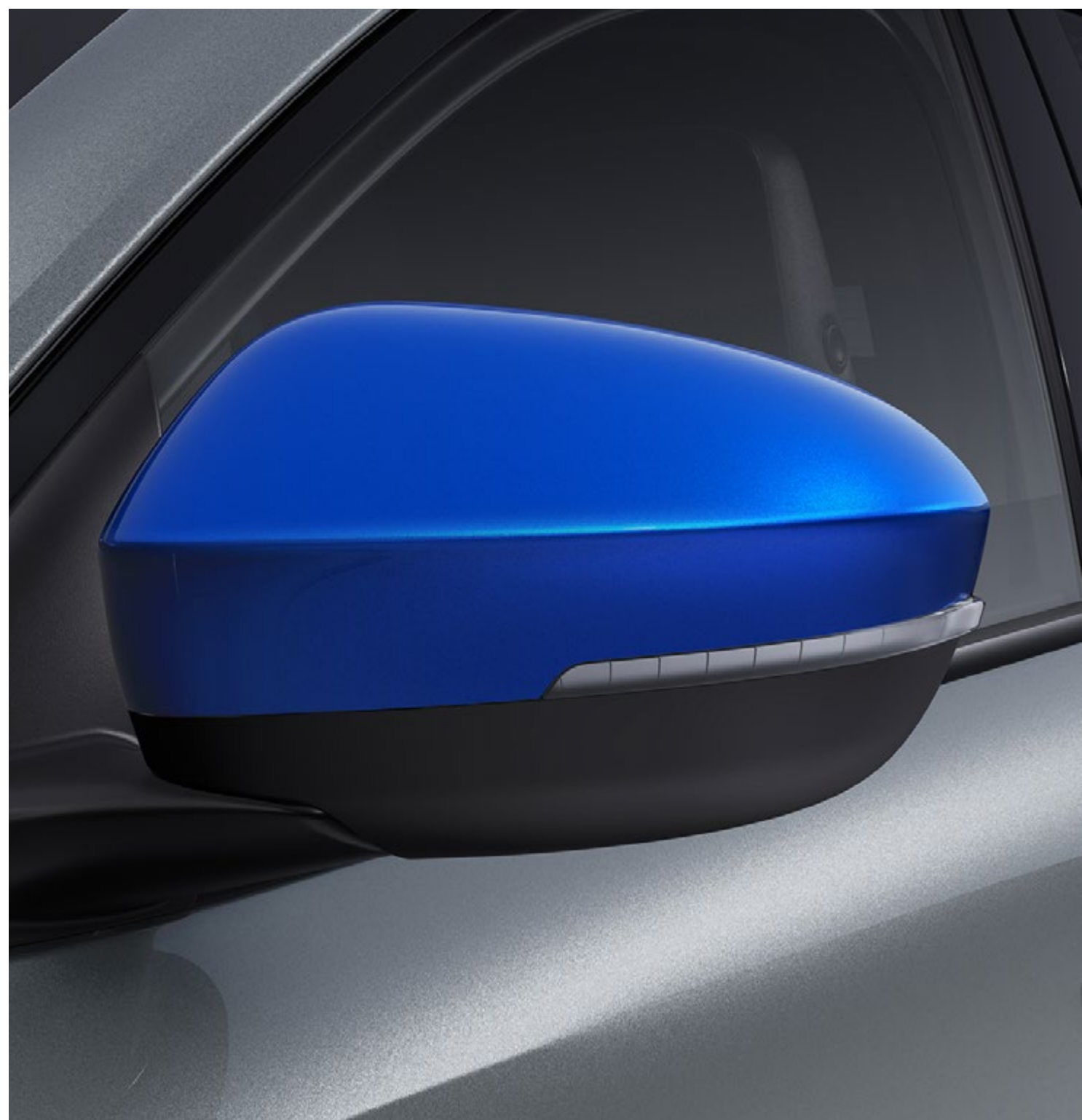
obudowy bocznych lusterek w kolorze niebieskim sommet