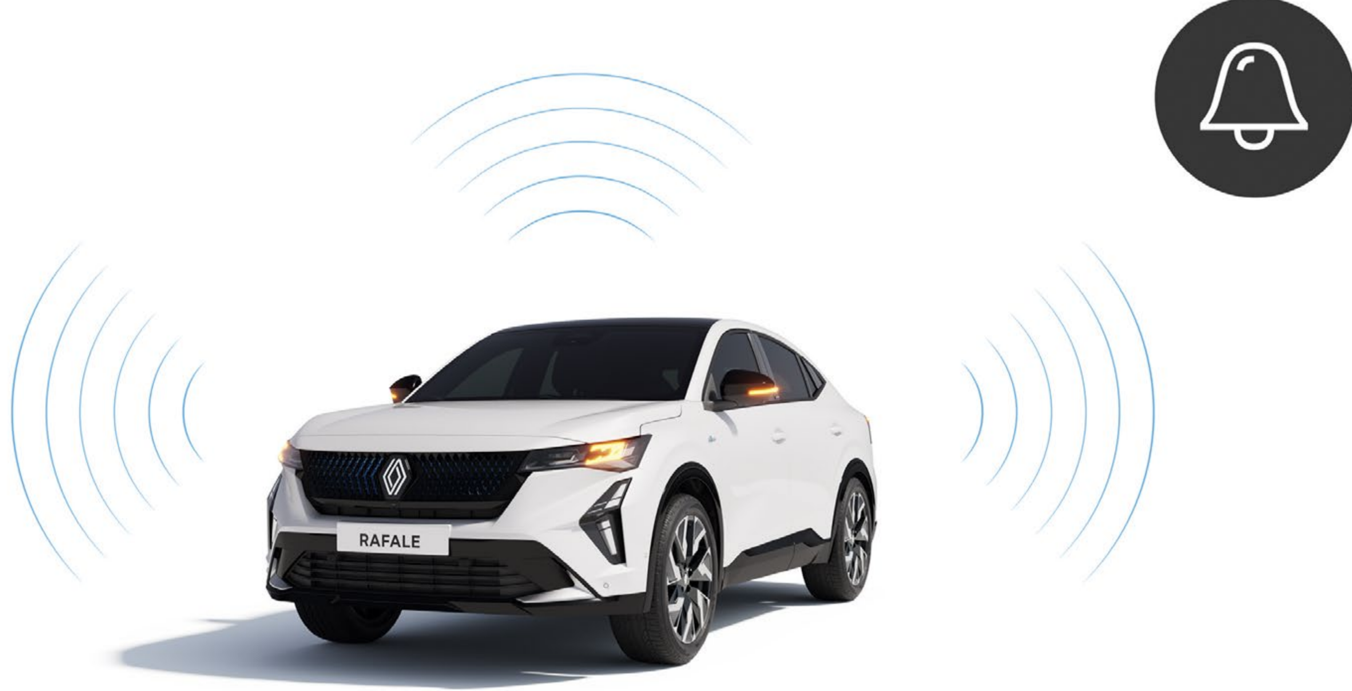
alarm zbliżeniowy i objętościowy

Wyposaż swój samochód w alarm wykrywający wszelkie próby otwarcia drzwi lub włamania. Zwiększ dodatkowo swoje bezpieczeństwo instalując gaśnicę przy miejscu kierowcy, aby w razie potrzeby móc jej szybko użyć.