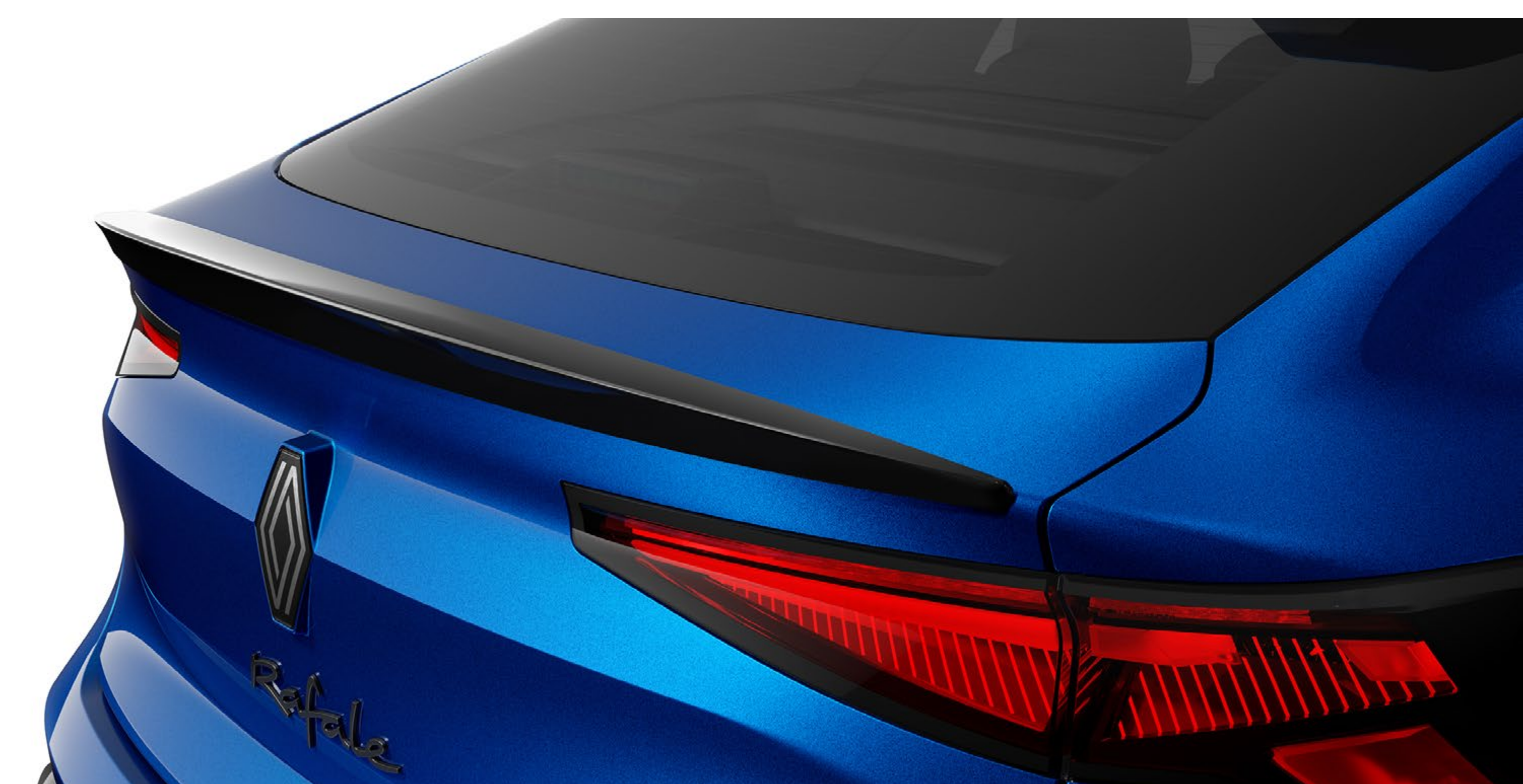
spojler pokrywy bagażnika

Wykończony w czarnym, błyszczącym kolorze, wysmukły, aerodynamiczny spojler wzmacnia sportową linię pokrywy bagażnika.