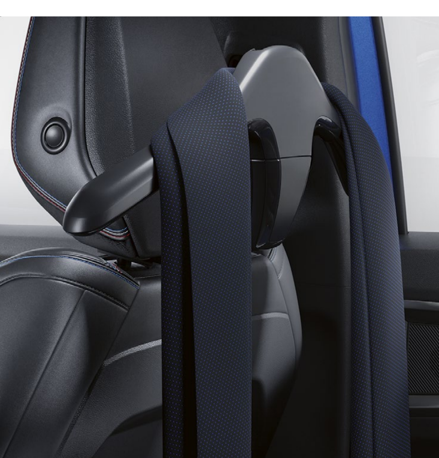
wieszak na ubrania – element systemu wielofunkcyjnego

Wieszak, dający się łatwo mocować do przednich zagłówków, na czas podróży jest idealnym miejscem na kurtkę czy bluzę. To praktyczne akcesorium daje się błyskawicznie zastąpić zaczepem na torbę lub dodatkowym składanym stolikiem.