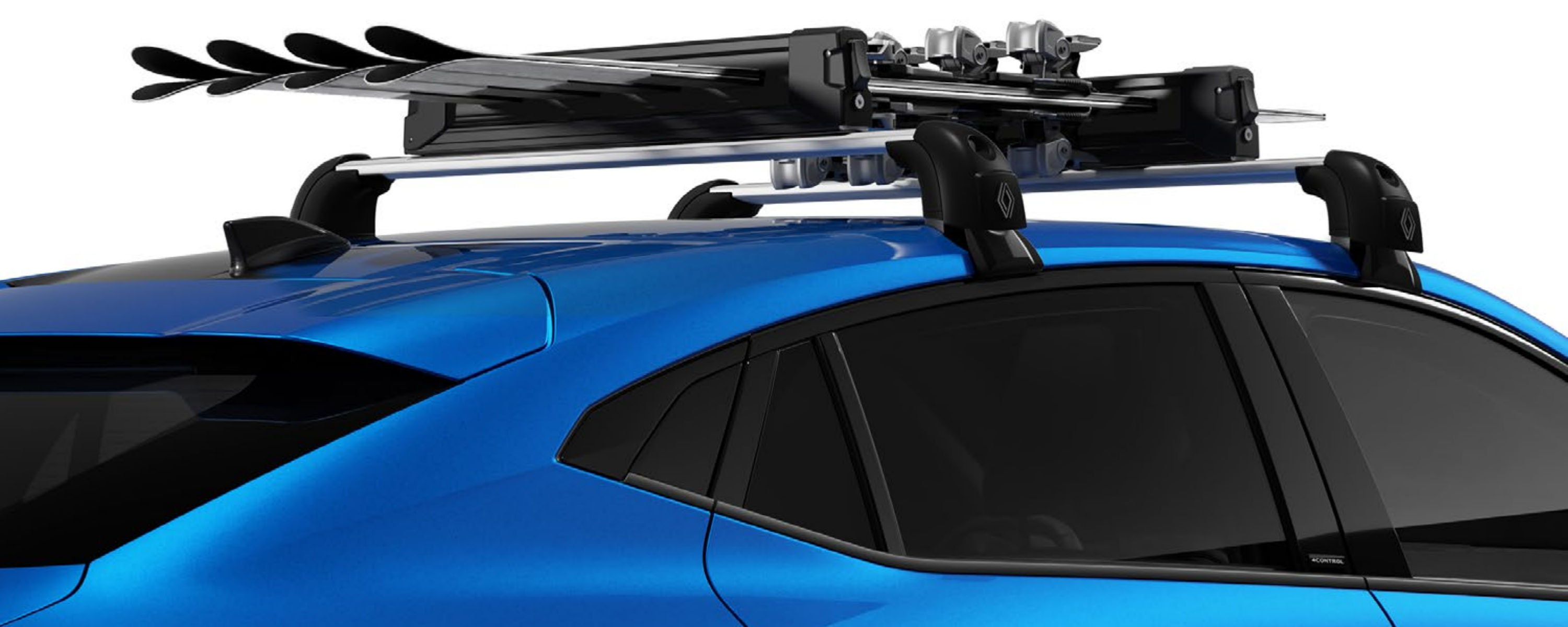
poprzeczki dachowe QuickFix i bagażnik na 4 pary nart

Gama sztywnych, zamykanych na klucz boksów dachowych Renault umożliwia załadunek bagaży o objętości do 630 litrów. Boksy pomieszczą dodatkowy bagaż, dzięki czemu zachowasz w kabinie warunki godne auta klasy premium.