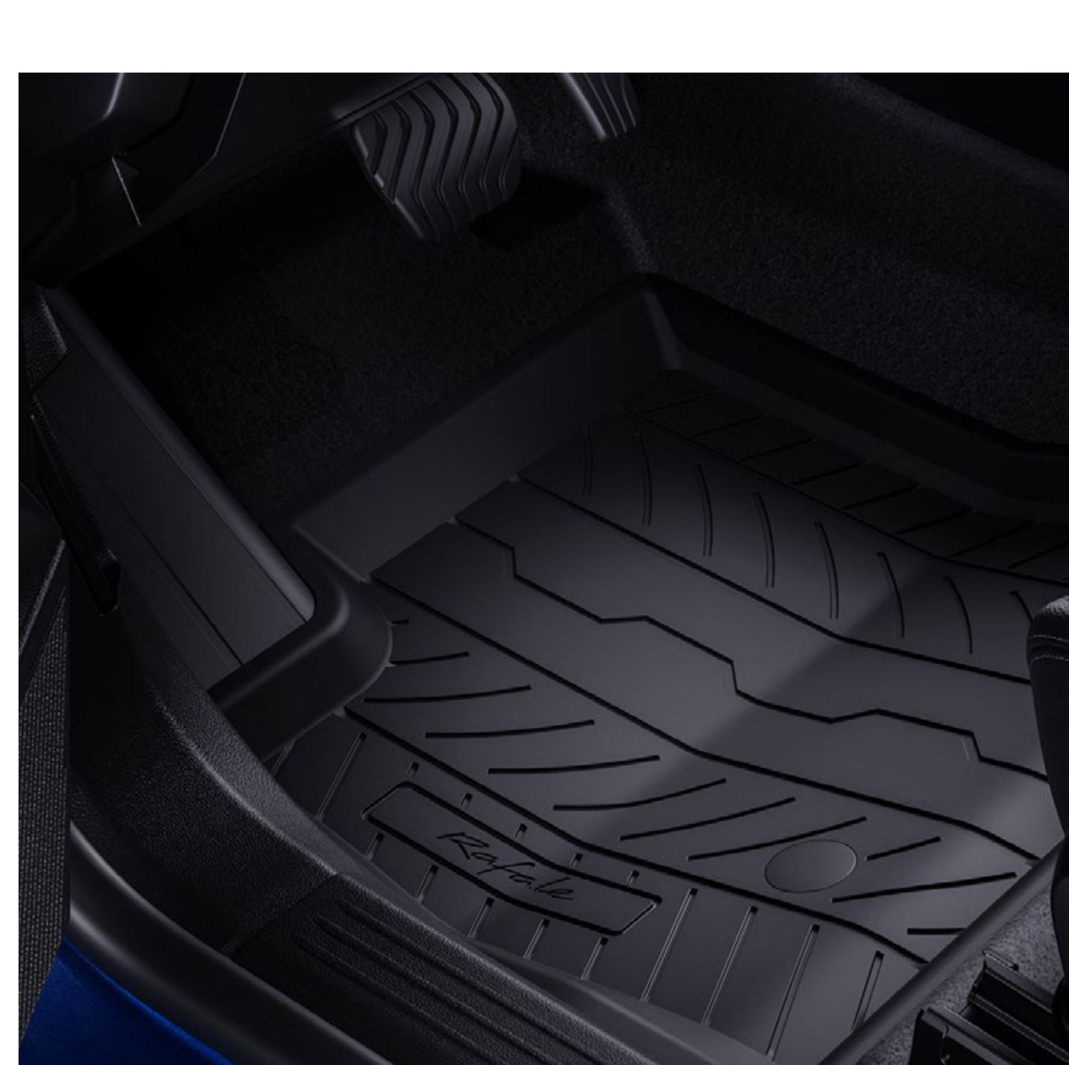
gumowe dywaniki podłogowe