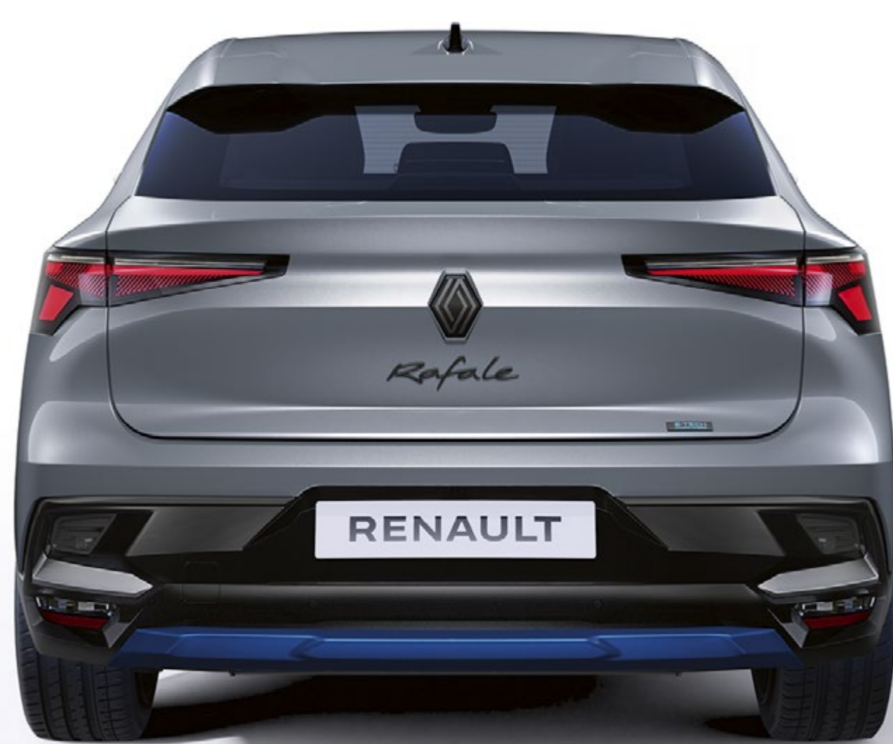
pakiet personalizacji w kolorze niebieskim sommet - widok przodu i tyłu nadwozia