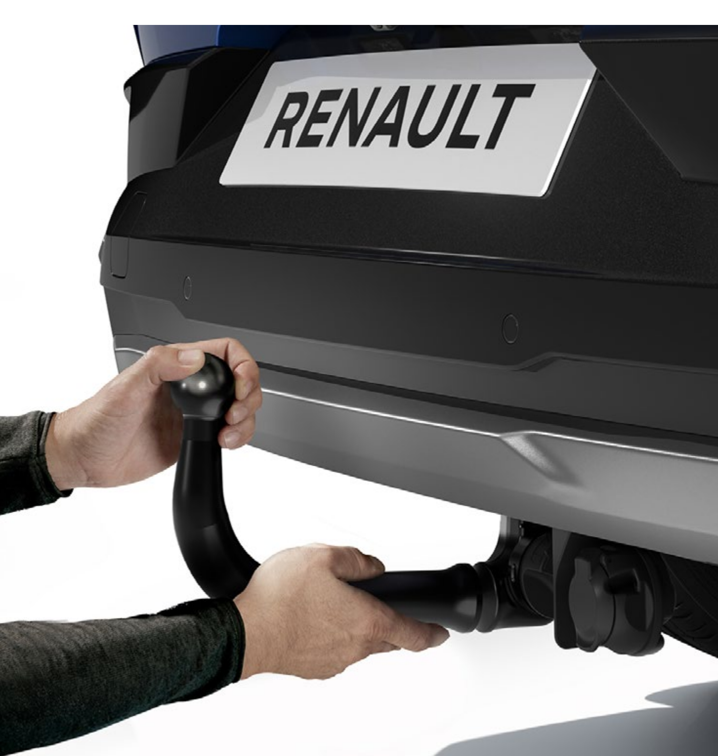
hak holowniczy do demontażu bez użycia narzędzi

W przypadku sporadycznego używania warto wybrać hak holowniczy z główką, którą można zdemontować bez użycia narzędzi. W przypadku częstego używania korzystniej jest wybrać prosty i skuteczny jednoczęściowy hak holowniczy.