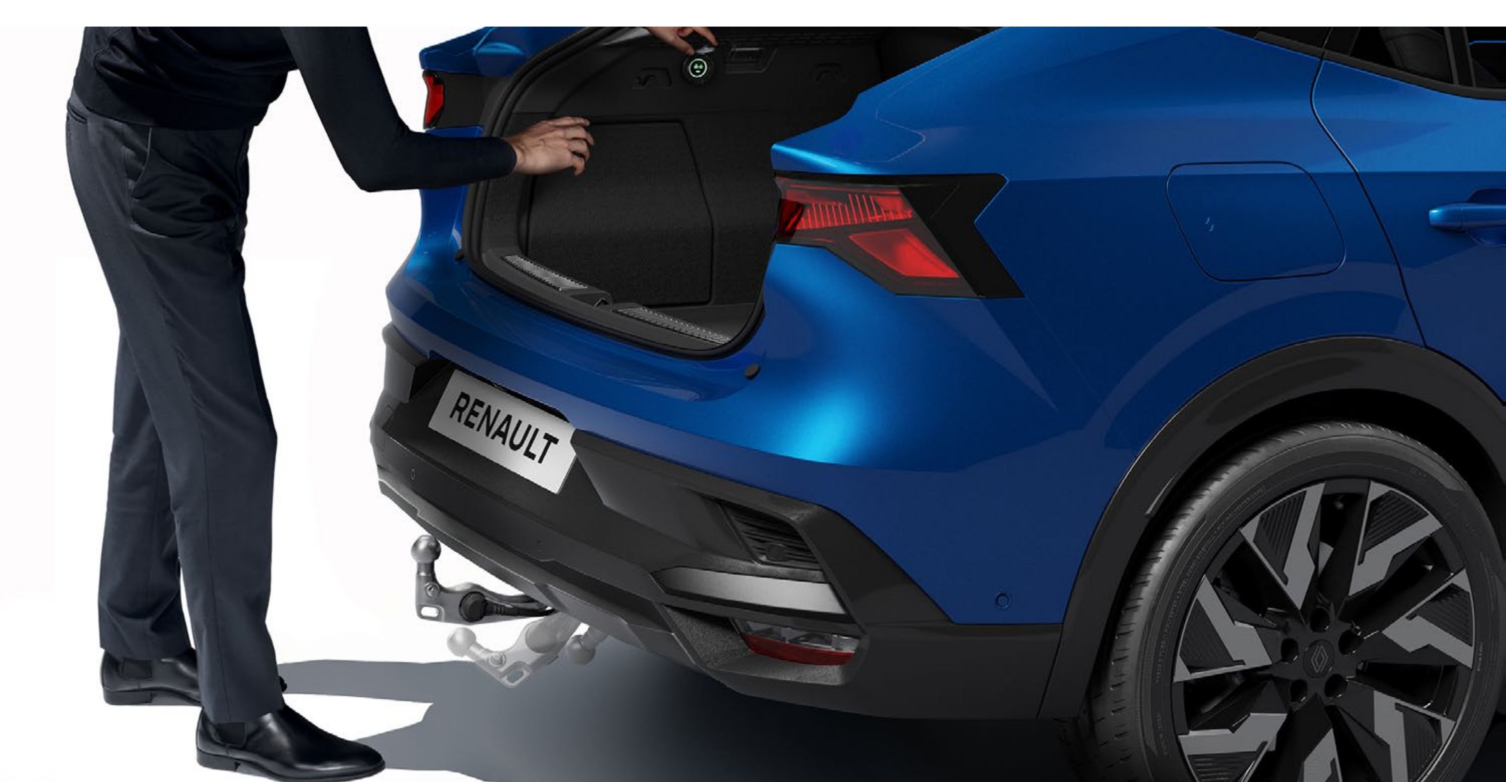
chowany, elektryczny hak holowniczy

Elektryczny, chowany hak holowniczy nie zakłóca designu twojego samochodu: jego główka chowa się w ciągu kilku sekund poprzez naciśnięcie przycisku umieszczonego w bagażniku.