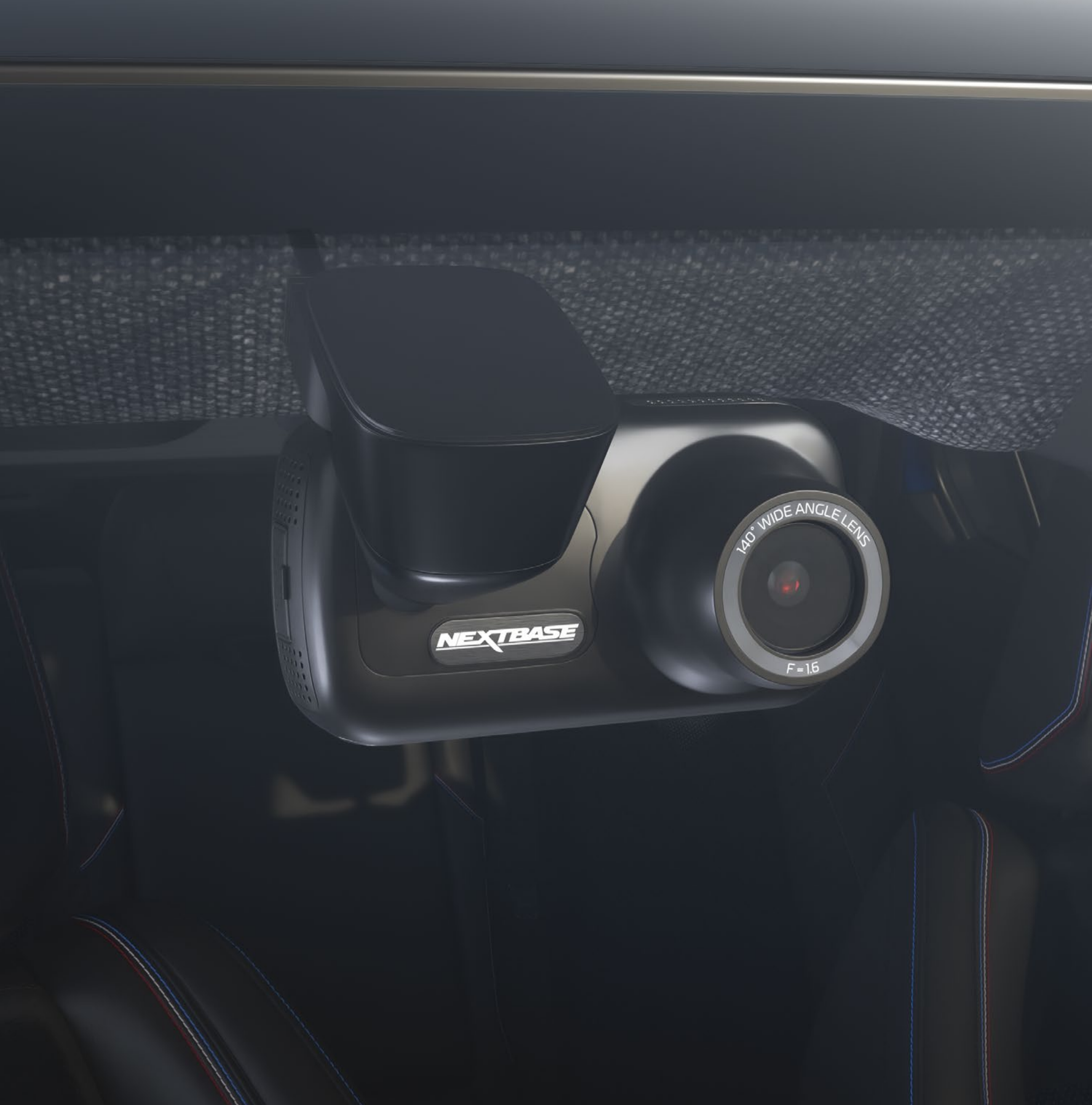
kamera pokładowa dashcam

Dyskretna kamera pokładowa dashcam, doskonale zintegrowana z kabiną, rejestruje przebieg każdej podróży i w razie potrzeby dostarcza najlepsze świadectwo zaistniałych zdarzeń.