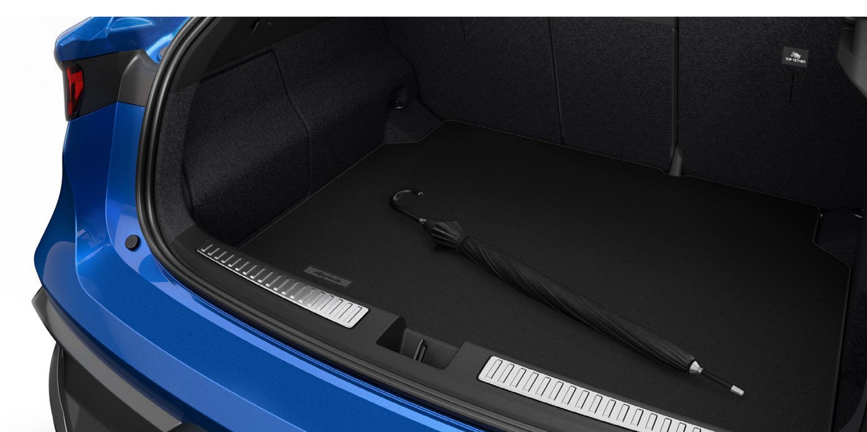
tekstylny wkład bagażnika premium

Tekstylny wkład bagażnika premium jest eleganckim wykończeniem i chroni wykładzinę bagażnika. Jest spersonalizowany i opatrzony napisem Rafale.