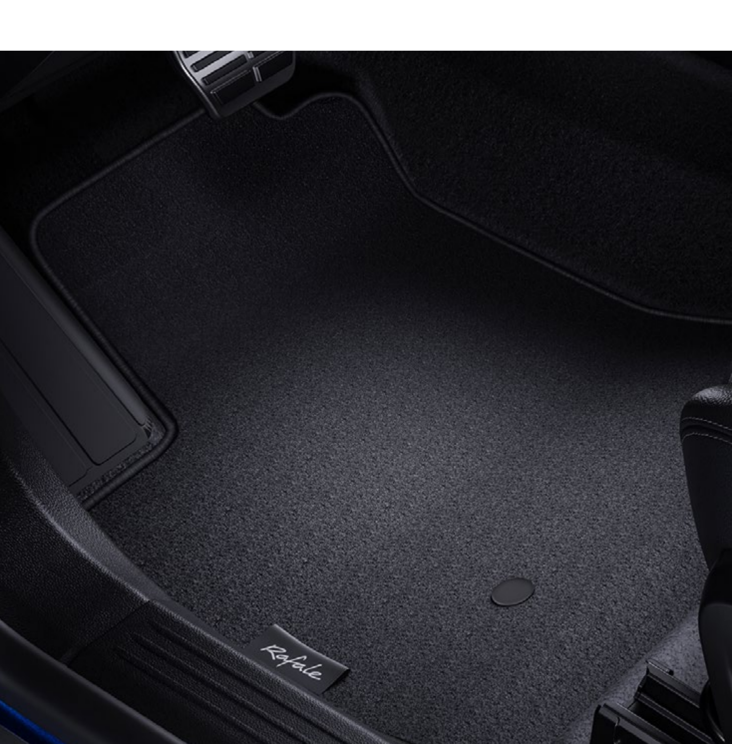
tekstylne dywaniki podłogowe confort

Wodoszczelne i łatwe w utrzymaniu gumowe dywaniki przednie i tylne chronią podłogę przed wilgocią i brudem. Dla zapewnienia eleganckiej ochrony wybierz tekstylne dywaniki podłogowe.