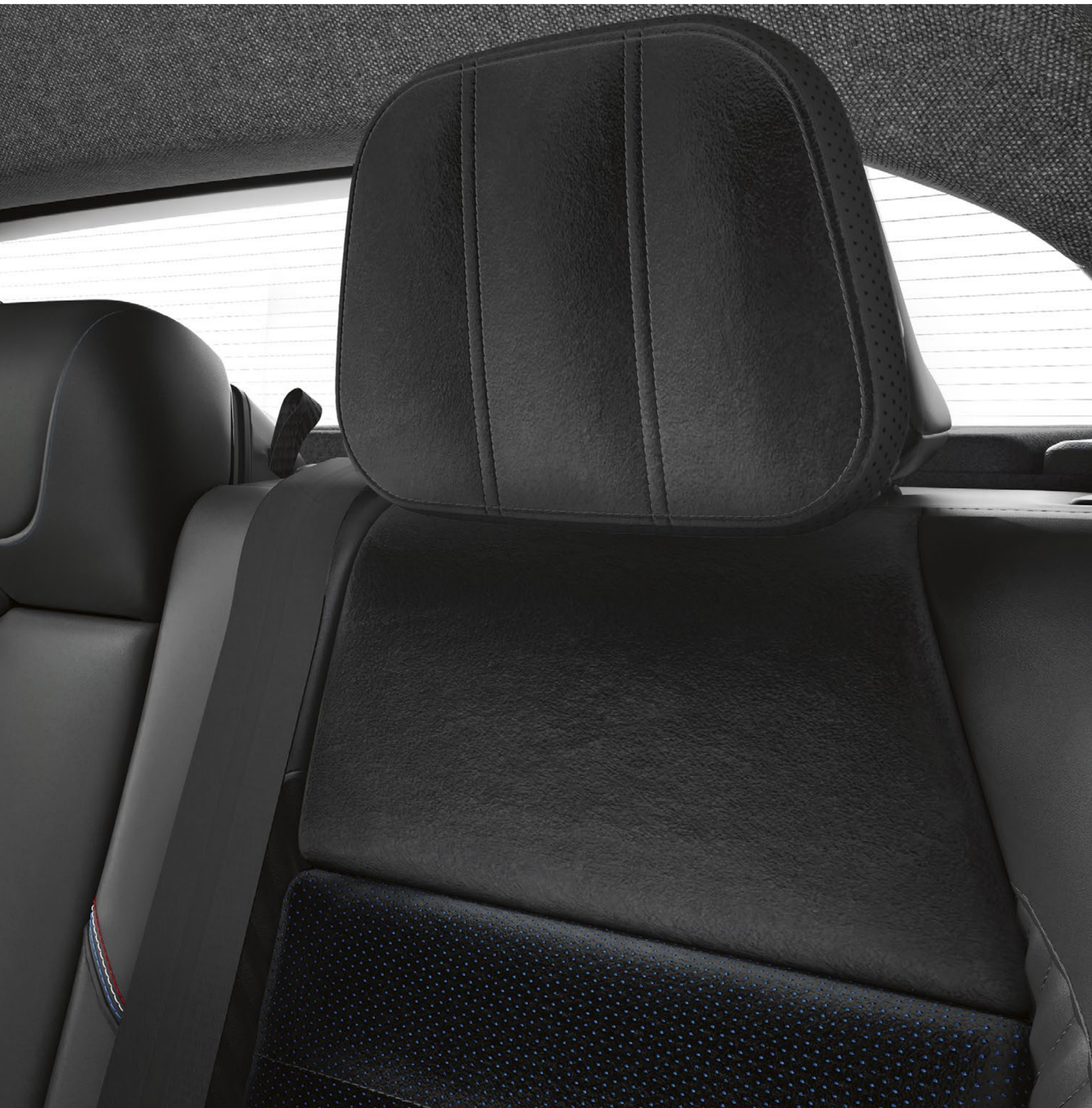
czarne poduszki grand confort na zagłówkach tylnych siedzeń

Poduszki zagłówków zapewniają skuteczne podparcie i dobre samopoczucie pasażerom na tylnych siedzeniach, a ich wykończenie z Alcantary® dodaje elegancji wnętrzu.