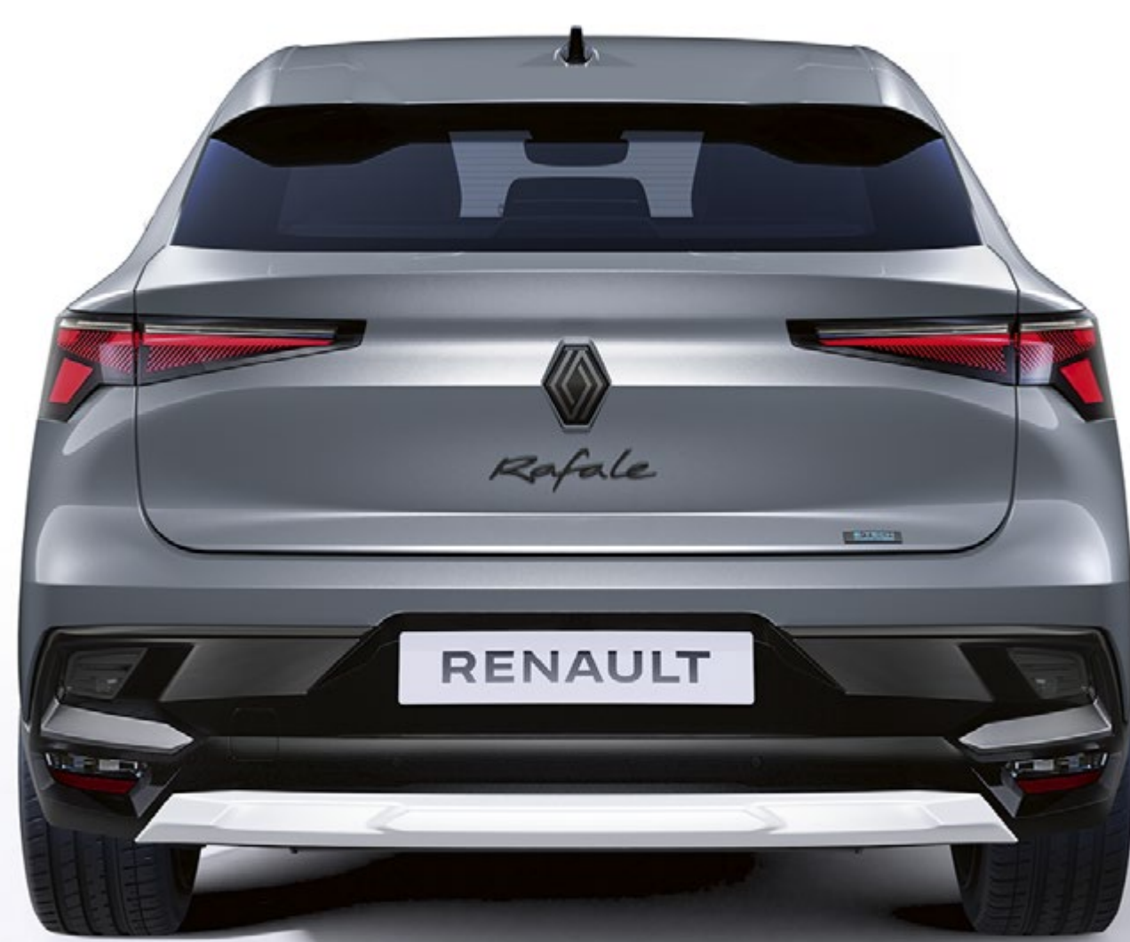
pakiet personalizacji w kolorze biała perła matowa - widok przodu i tyłu nadwozia

Obudowy bocznych lusterek wykończone w kolorze białym lub niebieskim dodają nadwoziu wyrafinowania.