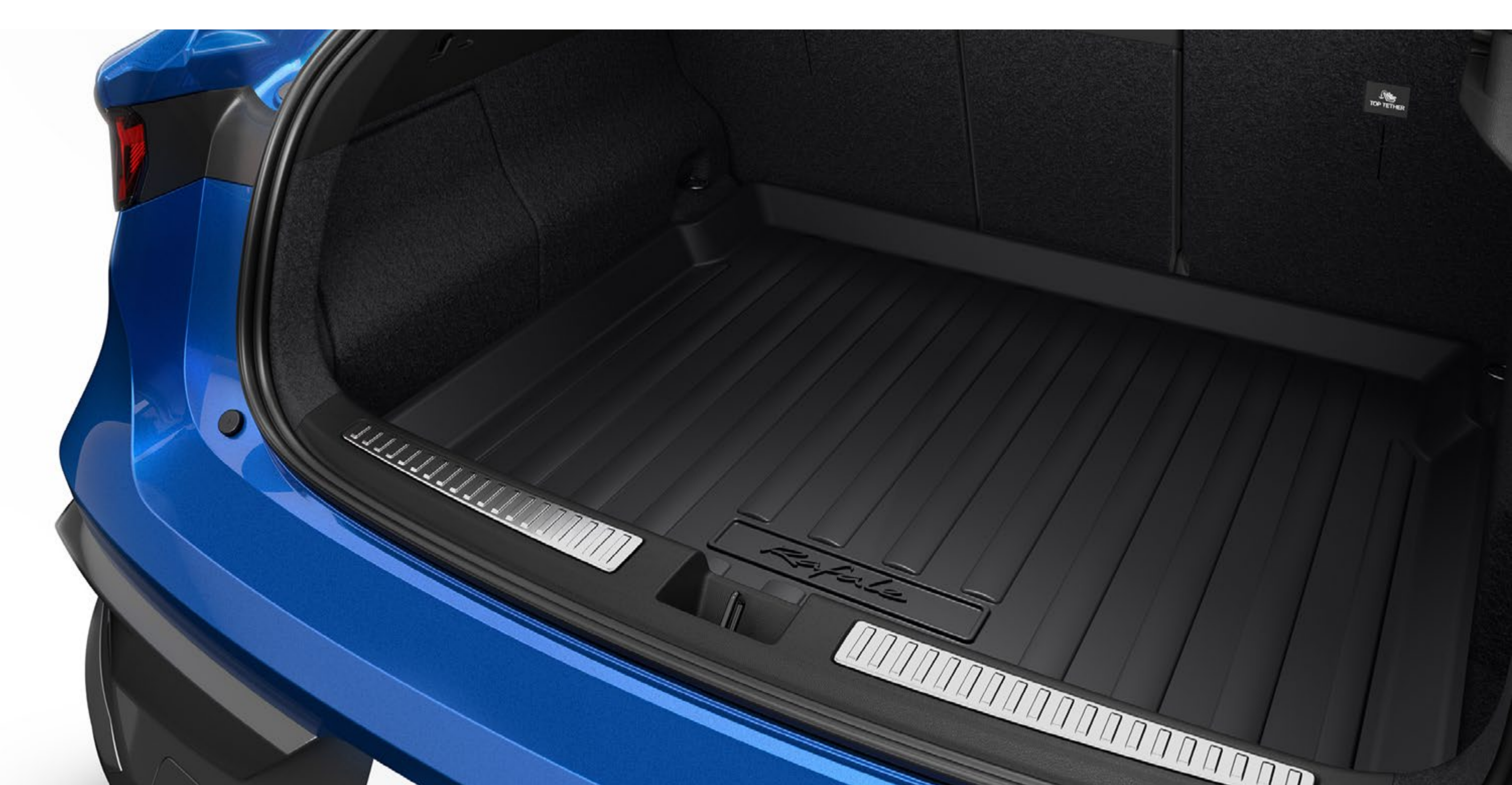
wkład ochronny na podłogę bagażnika

Przewoź brudne buty lub mokre przedmioty na wodoszczelnym, półsztywnym wkładzie ochronnym bagażnika. Dzięki wysokim brzegom zapewnia skuteczną ochronę wykładziny bagażnika.