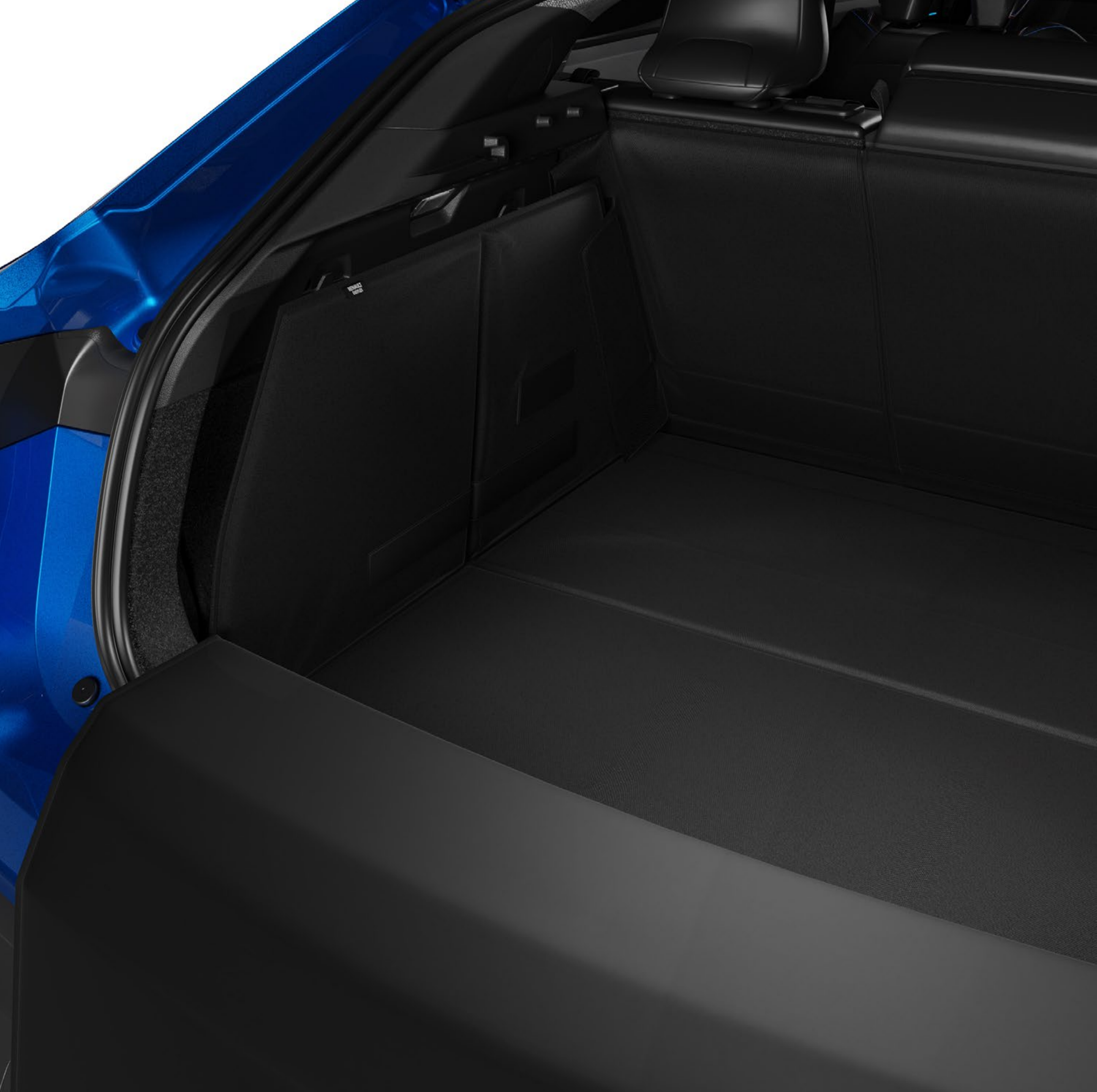
składana mata do bagażnika Easyflex

Ciesz się bez ograniczeń aktywnością na świeżym powietrzu dzięki składanej, nieprzemakalnej i antypoślizgowej macie ochronnej Easyflex. Ta modułowa mata daje się dopasować do wszystkich konfiguracji tylnej kanapy, dzięki czemu możliwy jest przewóz wielkogabarytowych i brudzących przedmiotów.