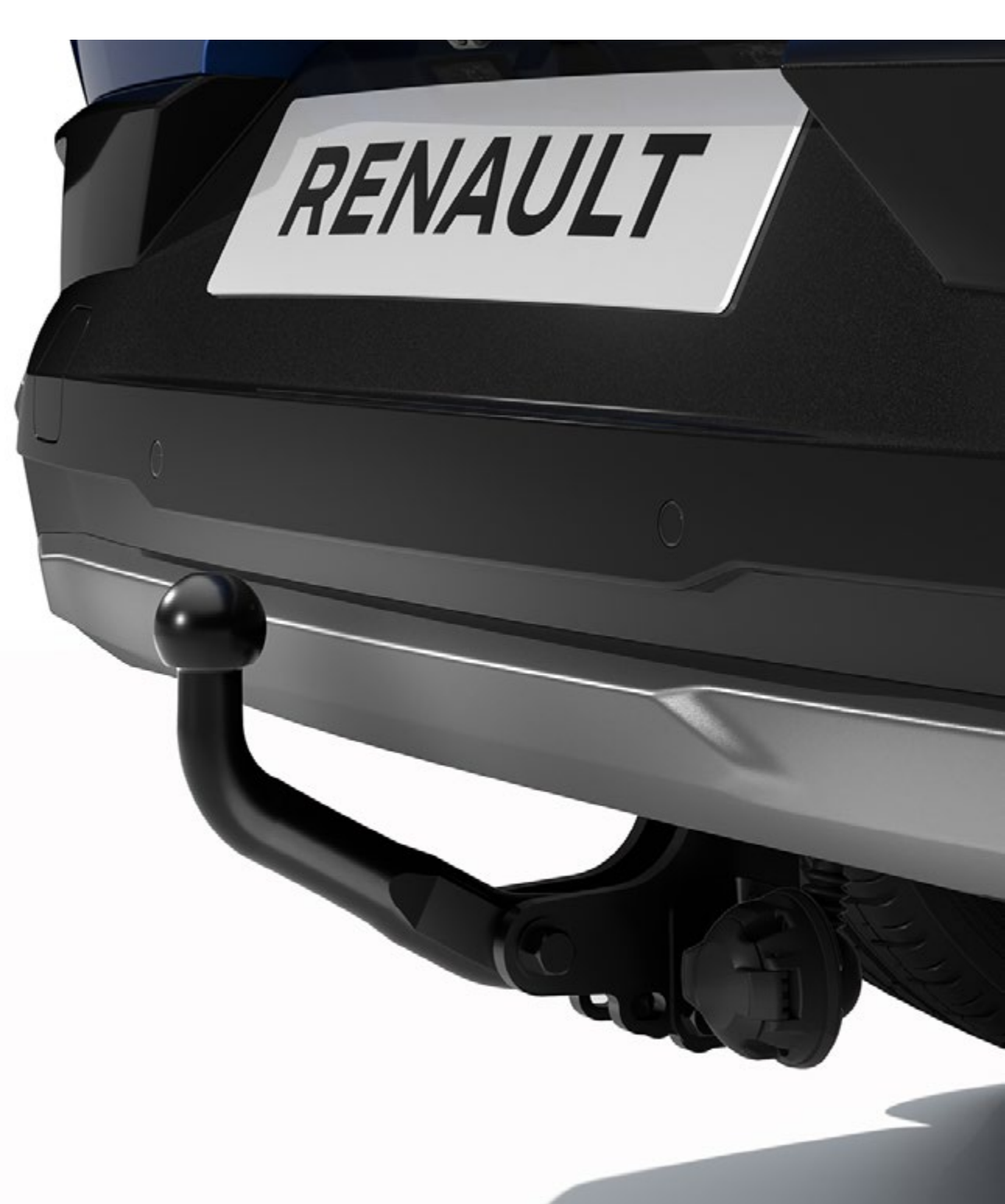
jednoczęściowy hak holowniczy