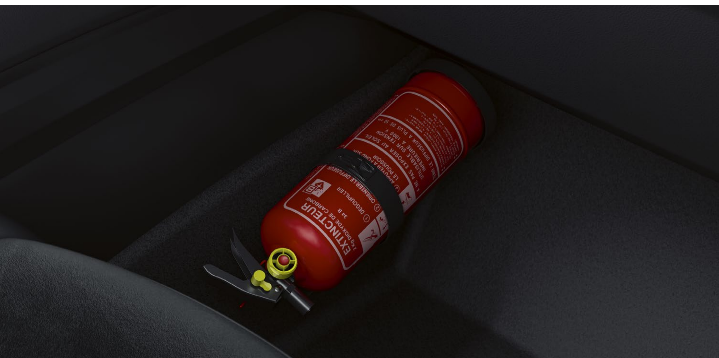
gaśnica 1 kg z manometrem

Wyposaż swoje Renault Rafale w specjalnie przystosowane łańcuchy śniegowe: dzięki intuicyjnemu montażowi dają się one łatwo zakładać i zapewniają optymalną przyczepność na trudnych trasach.