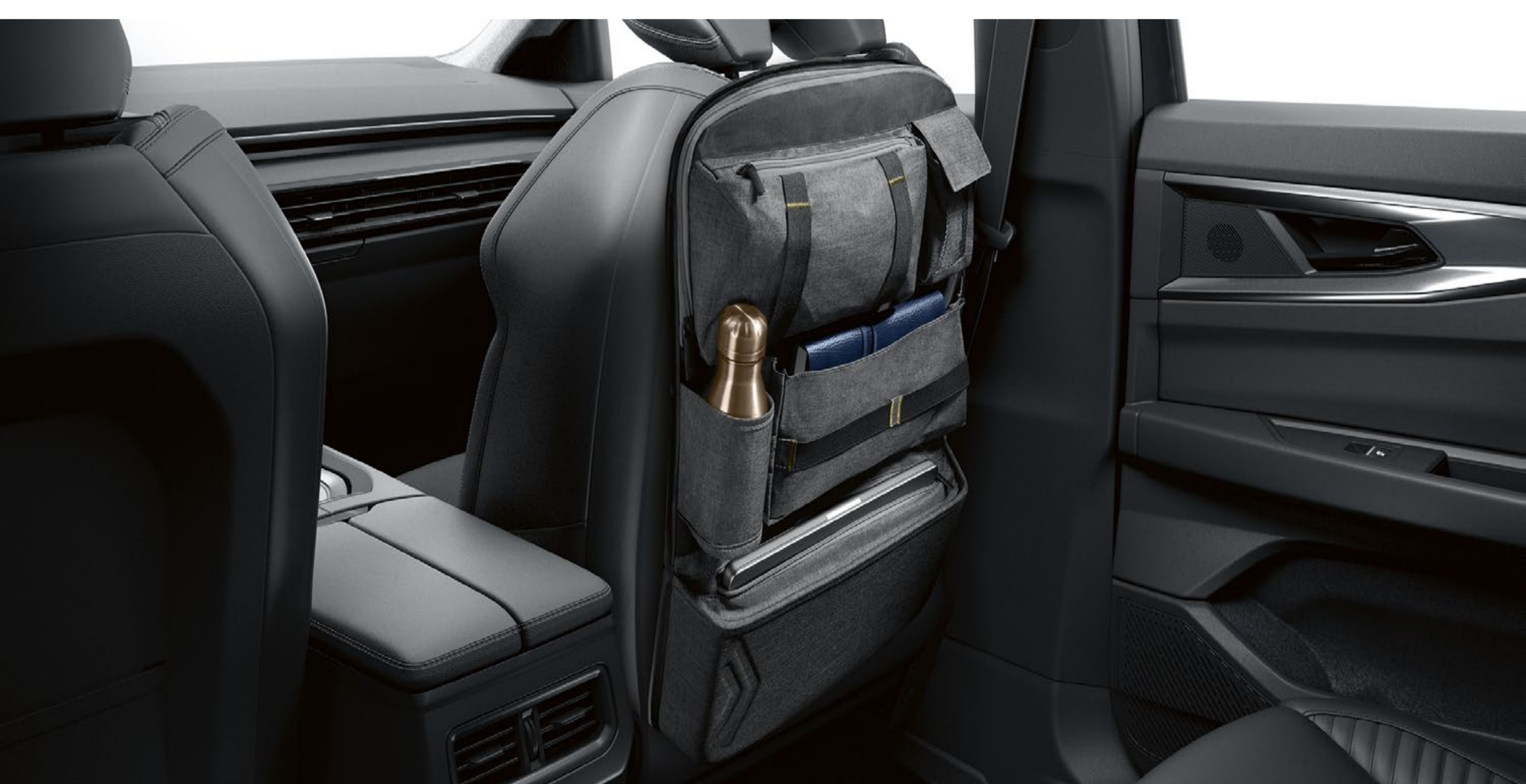
wielofunkcyjny organizer mocowany do zagłówka przedniego fotela

Wielofunkcyjny organizer, mocowany na tylnej stronie przedniego fotela, ma pięć kieszeni na przedmioty codziennego użytku oraz miejsce na cyfrowy tablet. Jest wykończony w kolorze szarym melanżowym, ma złote przeszycia i jest ozdobiony logo Renault.