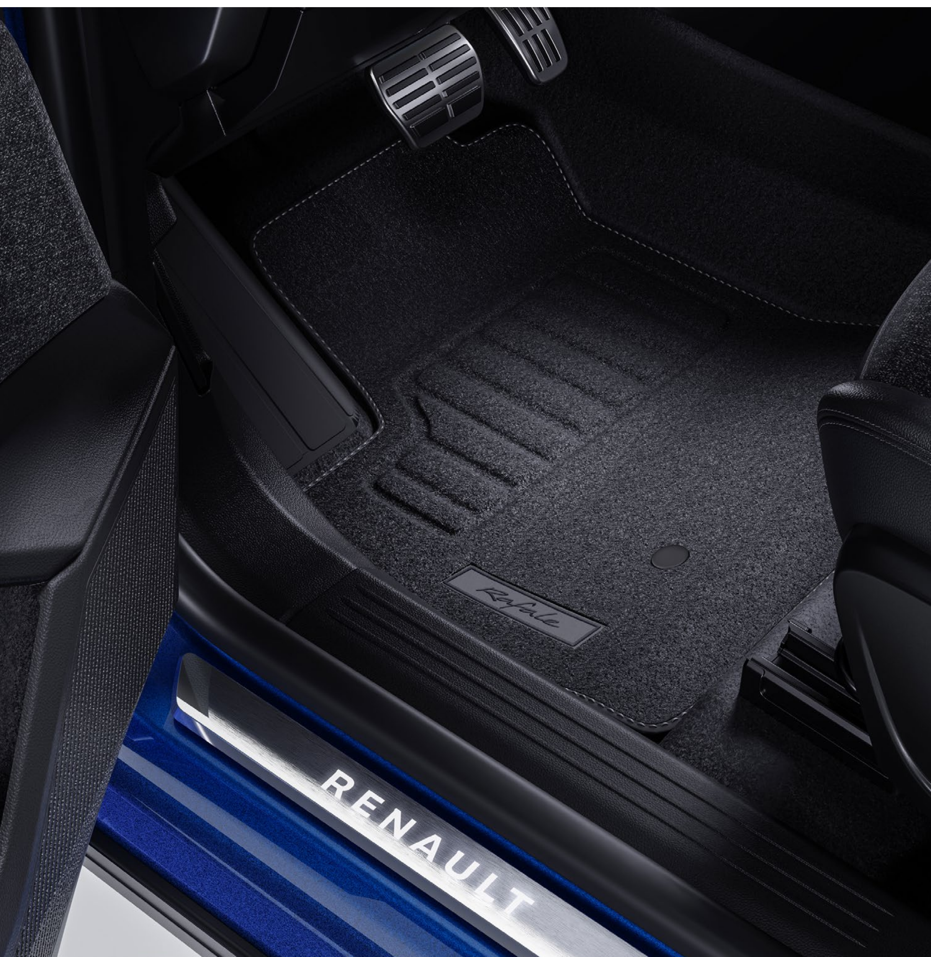
podświetlane nakładki progów Renault, sportowe pedały i tekstylne dywaniki podłogowe premium

Podświetlane nakładki progów, opatrzone napisem Renault, tworzą stylowe wykończenie przednich drzwi. Aluminiowe pedały dodają wnętrzu sportowego charakteru.