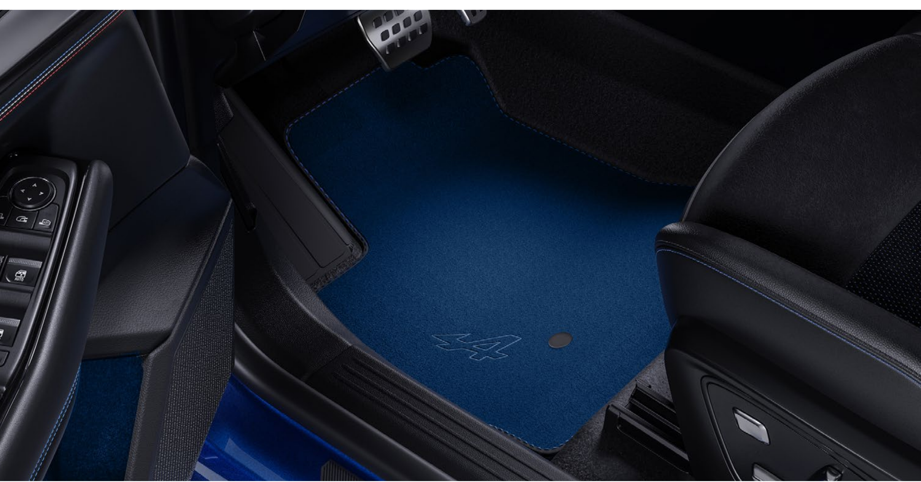
Tekstylne dywaniki podłogowe Alpine

Stwórz nastrój Alpine w kabinie dzięki zestawowi dywaników premium, opatrzonych haftowanym napisem Alpine, w niebieskim kolorze i z niebieskimi przeszyciami.