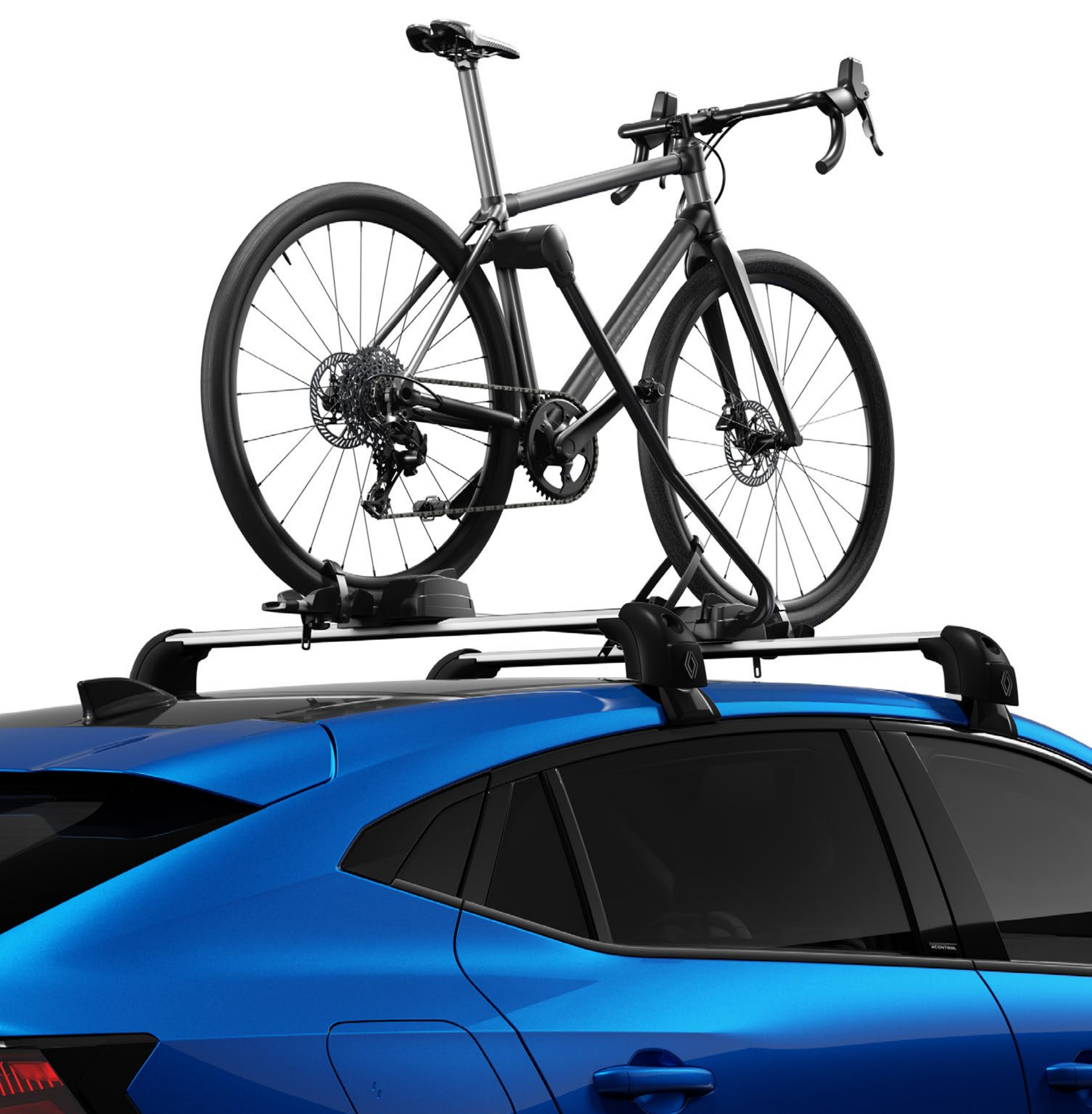
bagażnik rowerowy mocowany na poprzeczkach dachowych

Gdy wyjeżdżasz czy to na łono natury w weekend, czy to w dalszą podróż, możesz podróżować w pełni bezpiecznie – zamocuj z łatwością swoje rowery, deski kitesurfingowe i snowboardowe bądź narty na poprzeczkach dachowych.