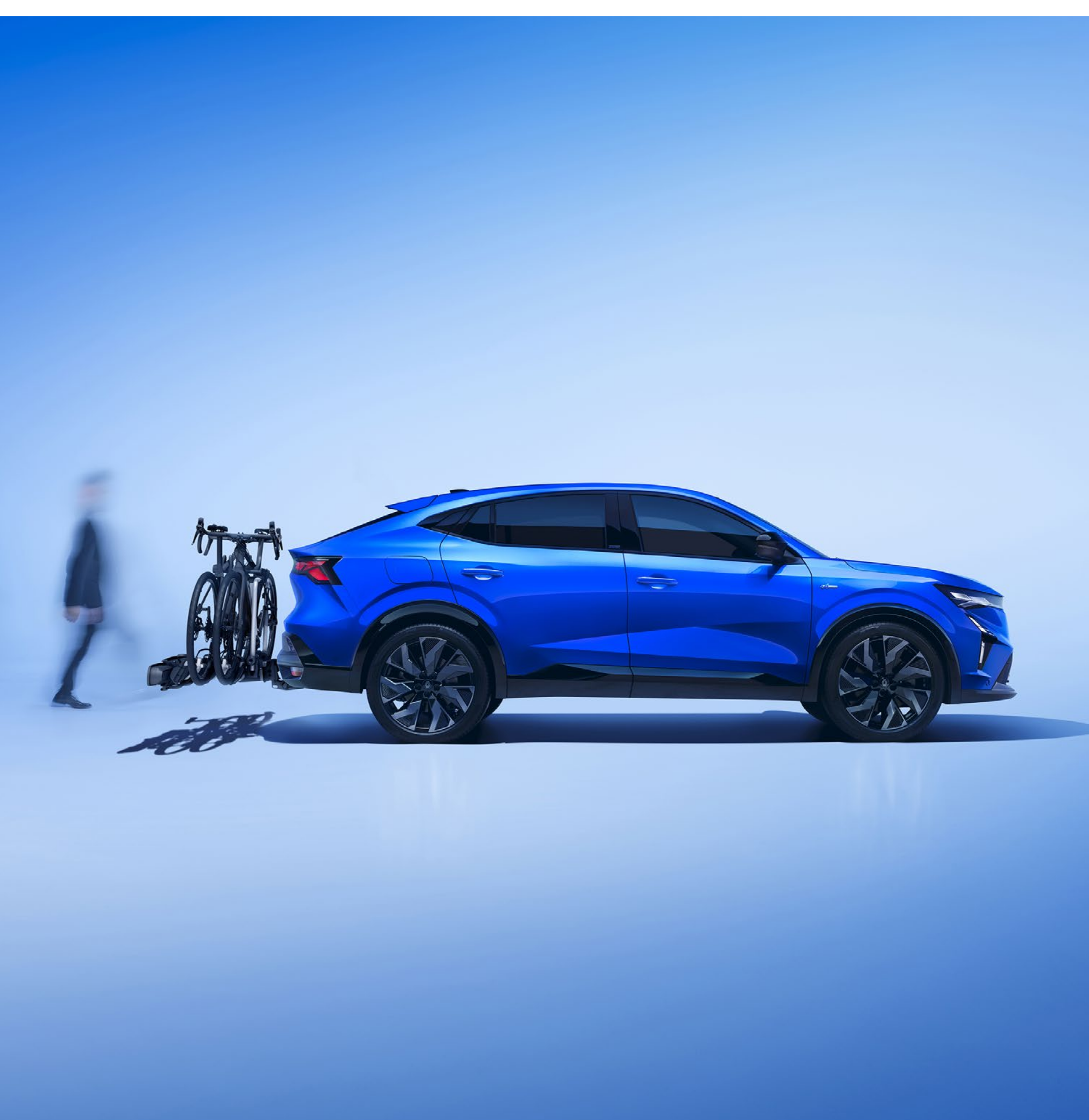
elektryczny, chowany hak holowniczy i mocowany na haku bagażnik na 3 rowery

Skorzystaj z gamy haków holowniczych stworzonych wyłącznie na potrzeby Renault Rafale.