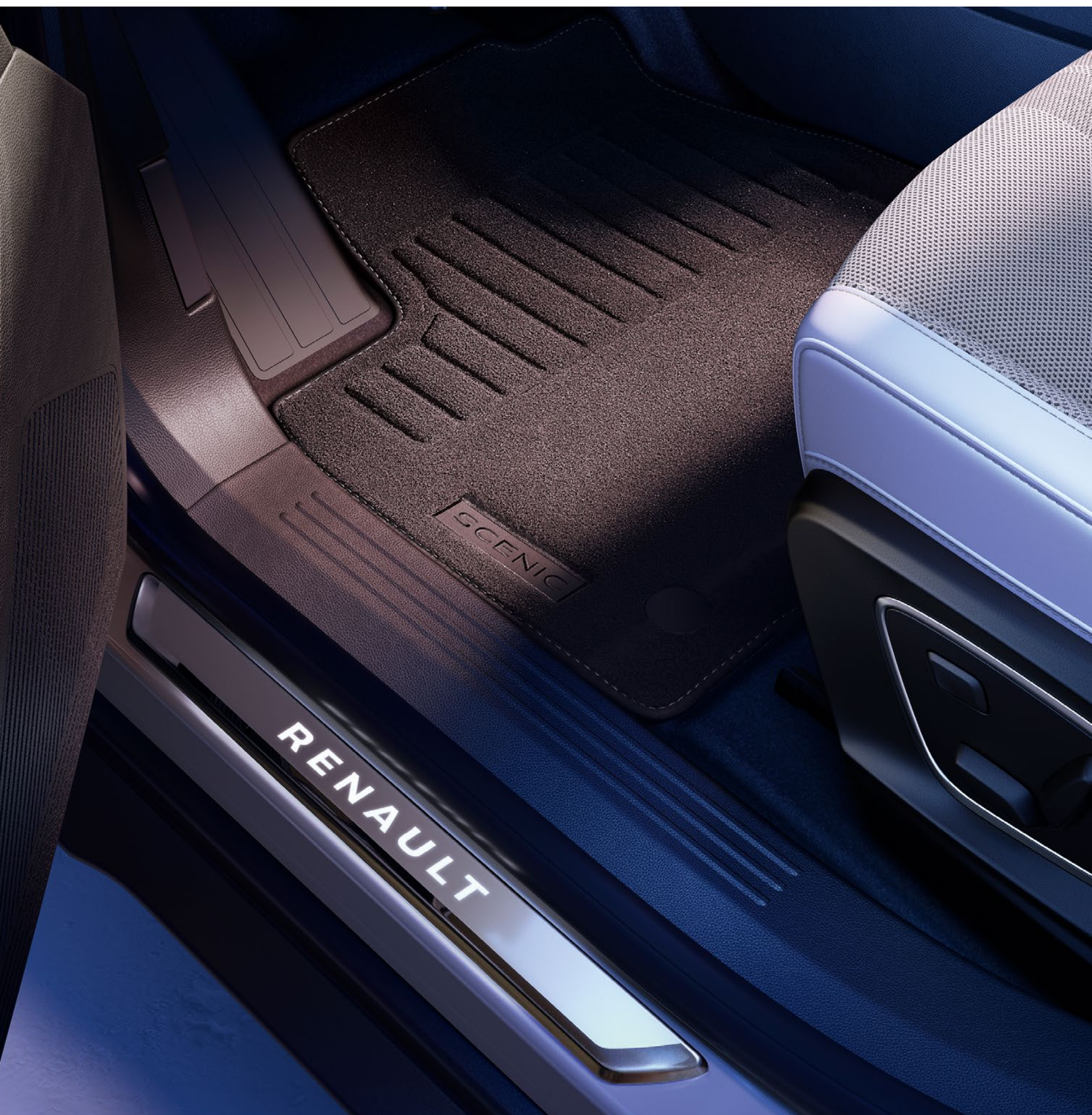
dywaniki tekstylne premium i podświetlane nakładki progowe Renault

Nakładki progowe ze szcztokowanego aluminium z podświetlanym napisem „Renault” oraz tekstylne dywaniki podłogowe premium ochronią i uatrakcyjnią wnętrze samochodu.