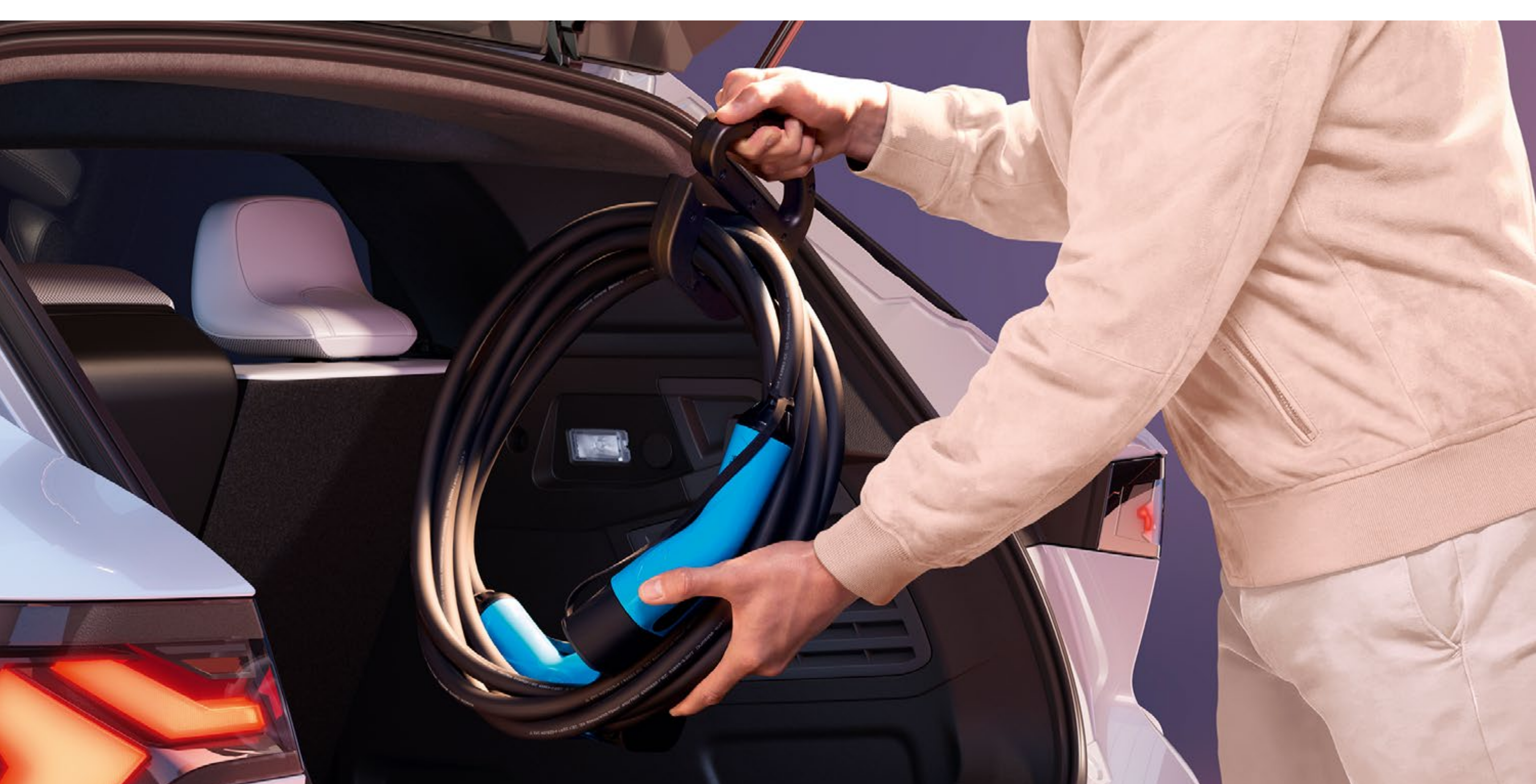
uchwyt do przenoszenia kabli do ładowania

Praktyczny i dyskretny uchwyt ułatwi wyjmowanie i wkładanie kabli do ładowania z/do bagażnika. Opaskę na kabel można wykorzystać na przykład do jego zawieszenia w czasie ładowania.