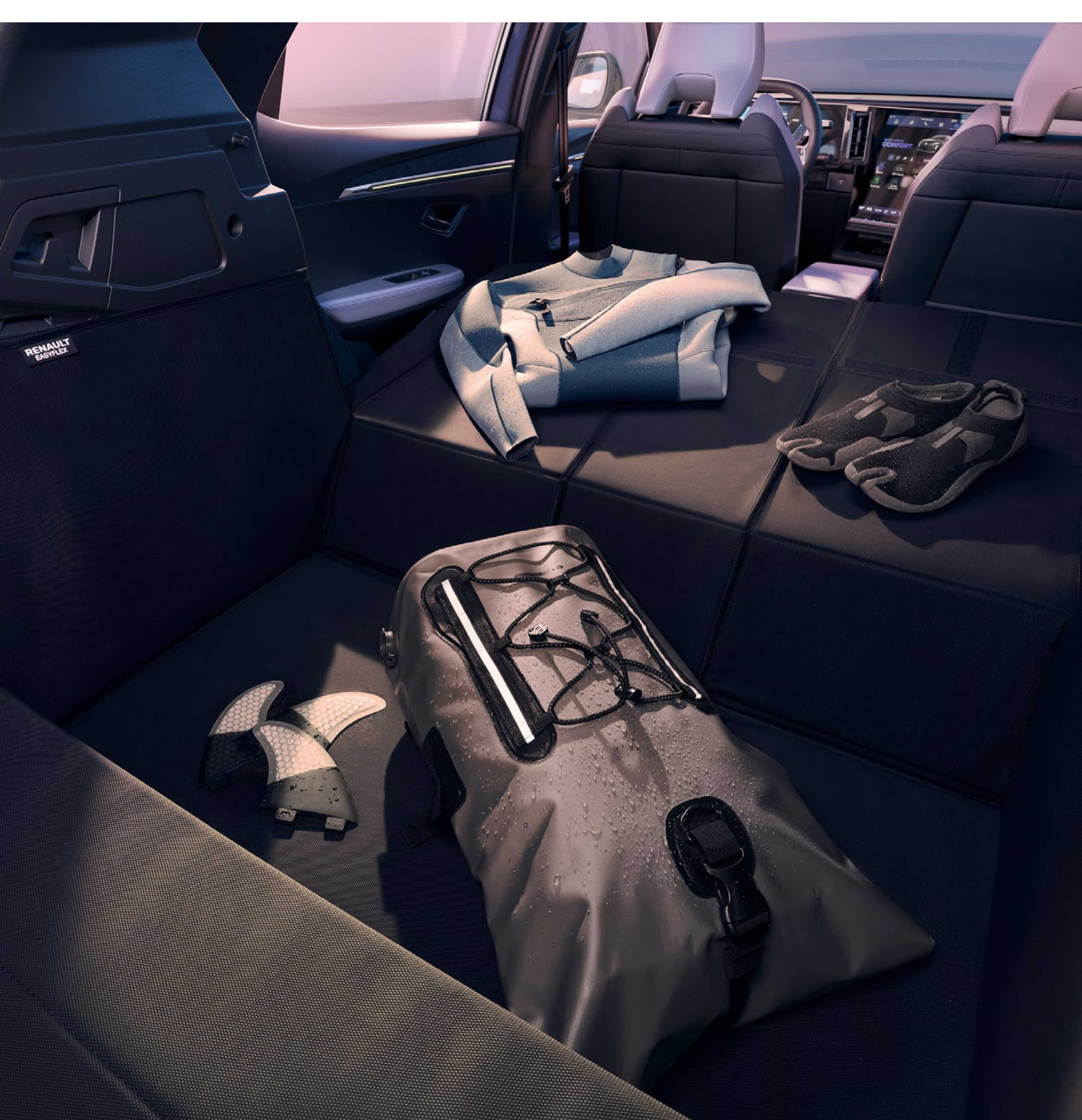
modułowe zabezpieczenie bagażnika easyflex

Maty różnego typu, dopasowane wymiarami do wnętrza, zabezpieczą wnętrze kabiny i bagażnika przed zabrudzeniami. Antypoślizgowe i wodoodporne modułowe zabezpieczenie bagażnika easyflex ochroni jego wnętrze przy przewożeniu zabrudzonych przedmiotów. Można nim przykryć także złożone oparcia tylnej kanapy.