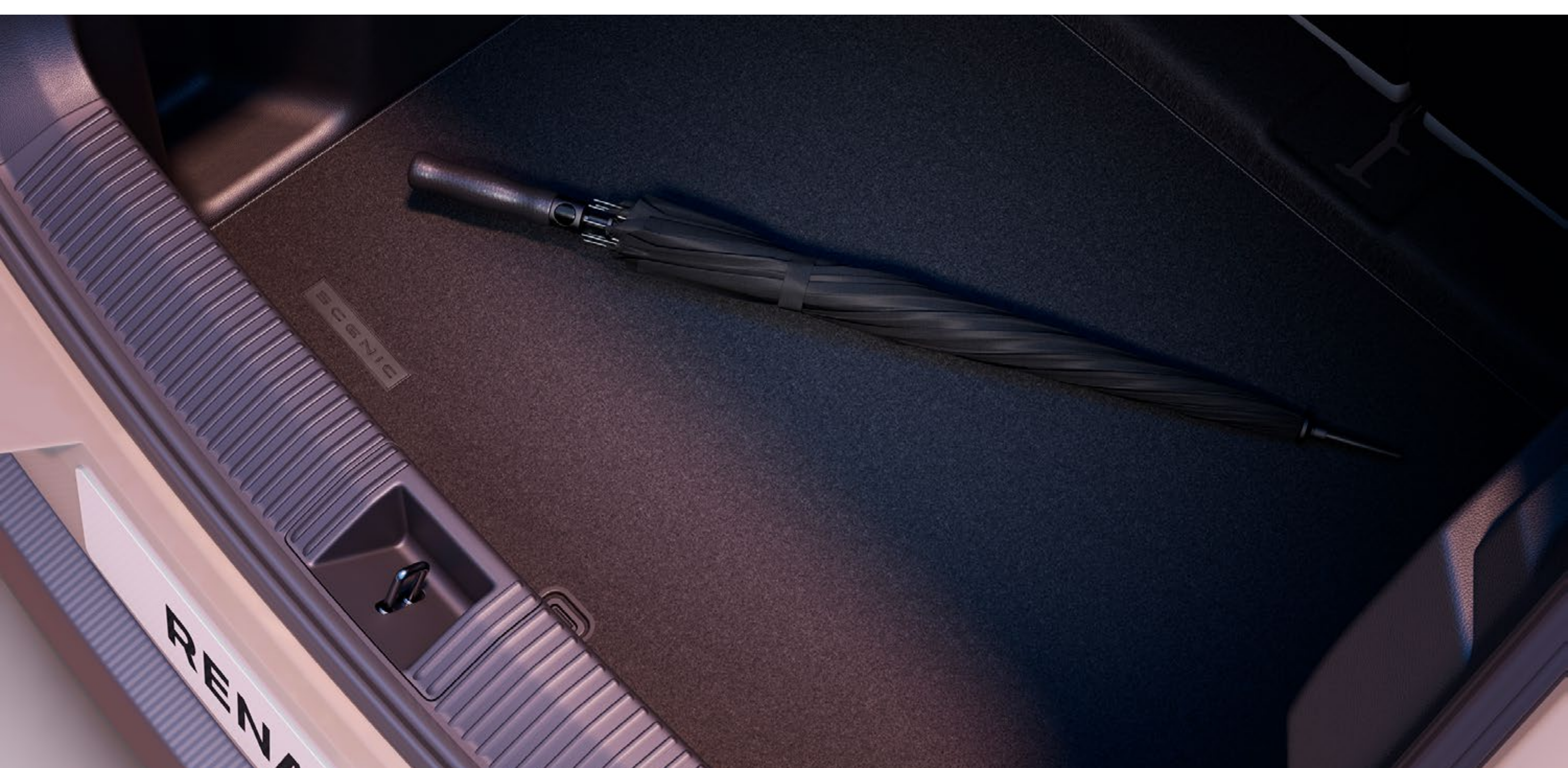
mata do bagażnika premium

Mata klasy premium zabezpieczy oryginalną wykładzinę bagażnika przed problematycznym ładunkiem.