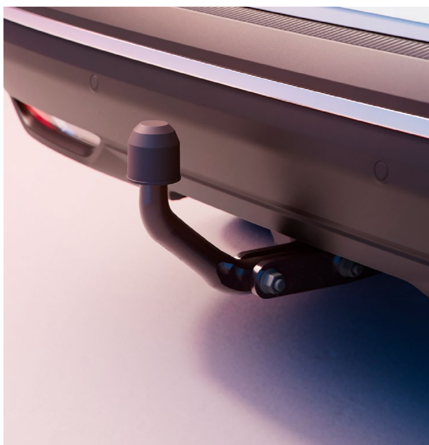
jednoelementowy hak holowniczy