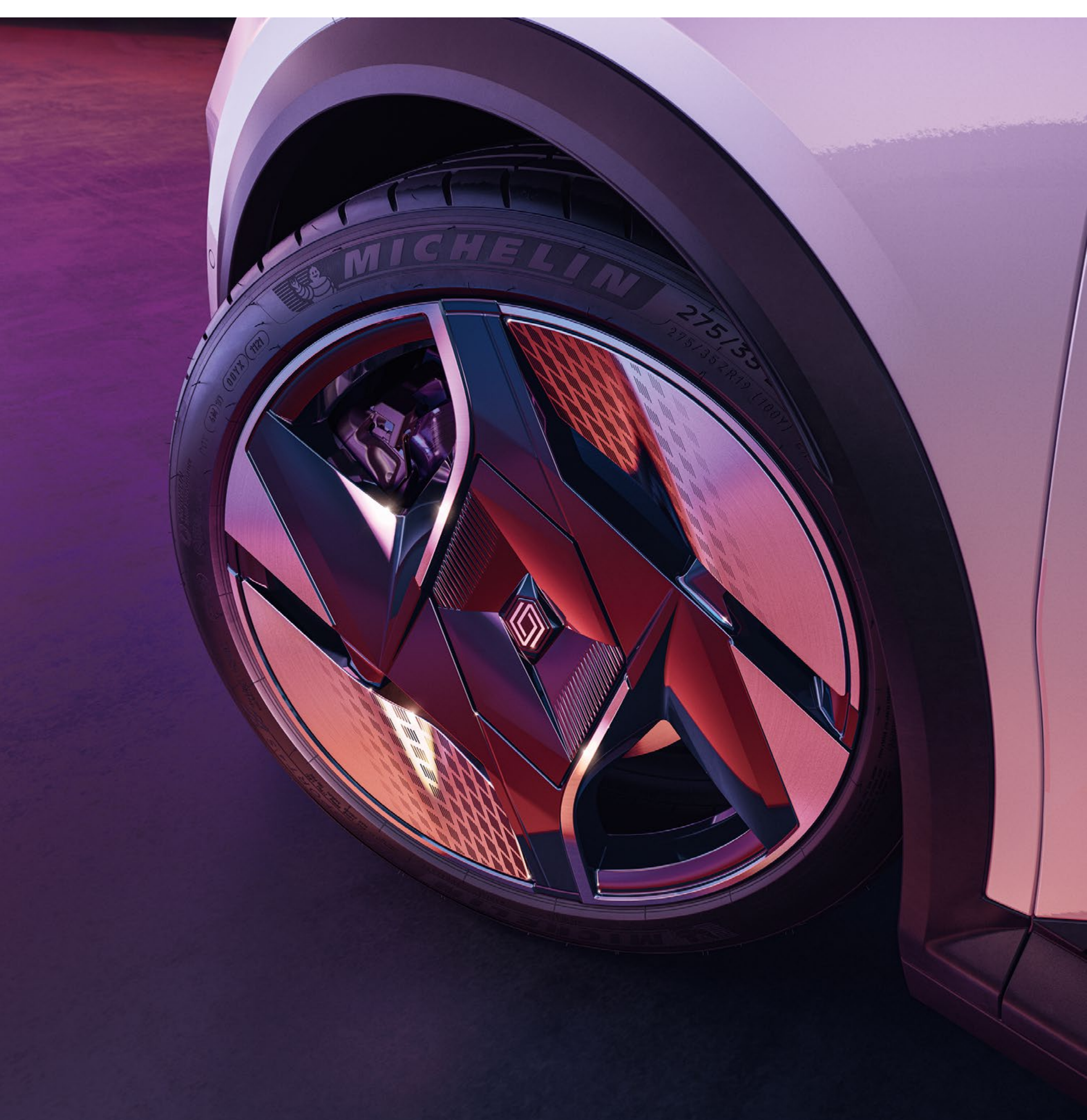
nakrętki zabezpieczające do obręczy kół z lekkiego stopu

Nakrętki zabezpieczające do kół zapewnią spokój i odstraszają amatorów cudzej własności.