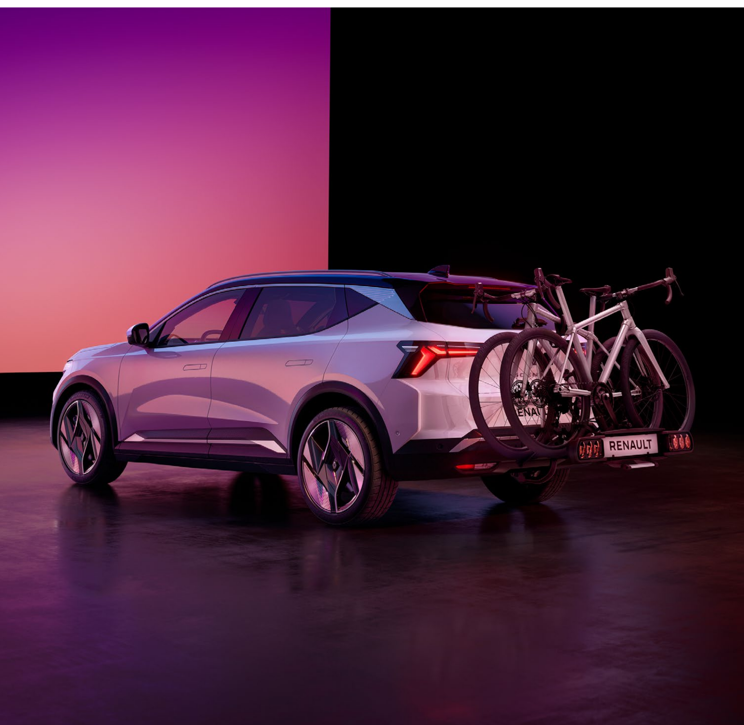
hak holowniczy demontowany bez użycia narzędzi i bagażnik na 2 rowery

Renault Scenic E-Tech electric może holować przyczepę o masie do 1,1 t. Na zaczepie holowniczym można także zamontować bagażnik rowerowy (obciążenie pionowe do 75 kg).