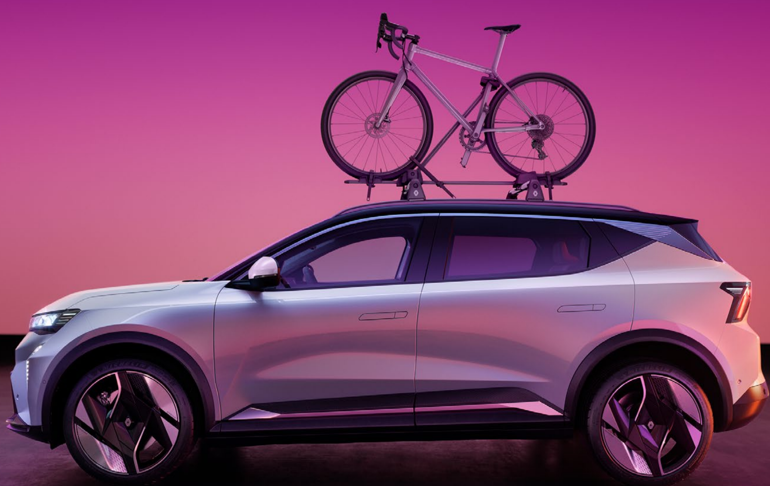
bagażnik rowerowy montowany na dachu

Akcesoria transportowe przydadzą się na rodzinnej wycieczce lub wyprawie w nieznane oraz umożliwią łatwe i bezpieczne przewożenie rowerów na dachu.