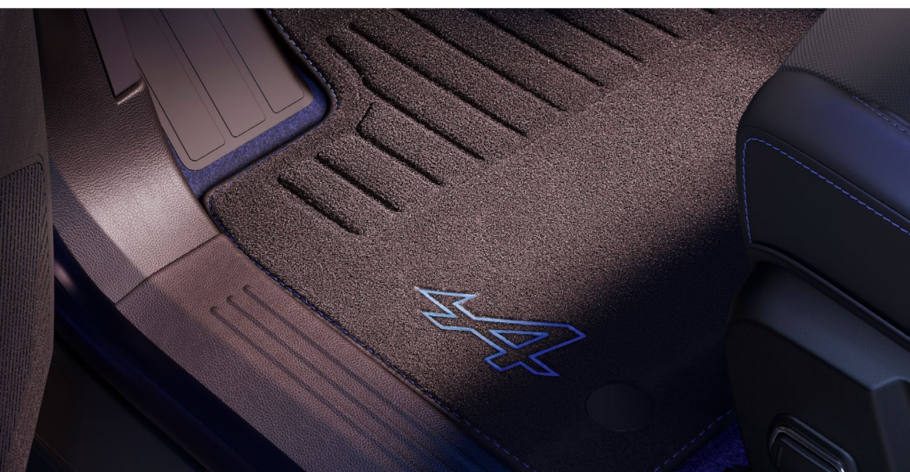
dywaniki esprit Alpine

Dywaniki premium z haftowanym kultowym logo marki Alpine podkreślą sportowy charakter Renault Scenic E-Tech electric.