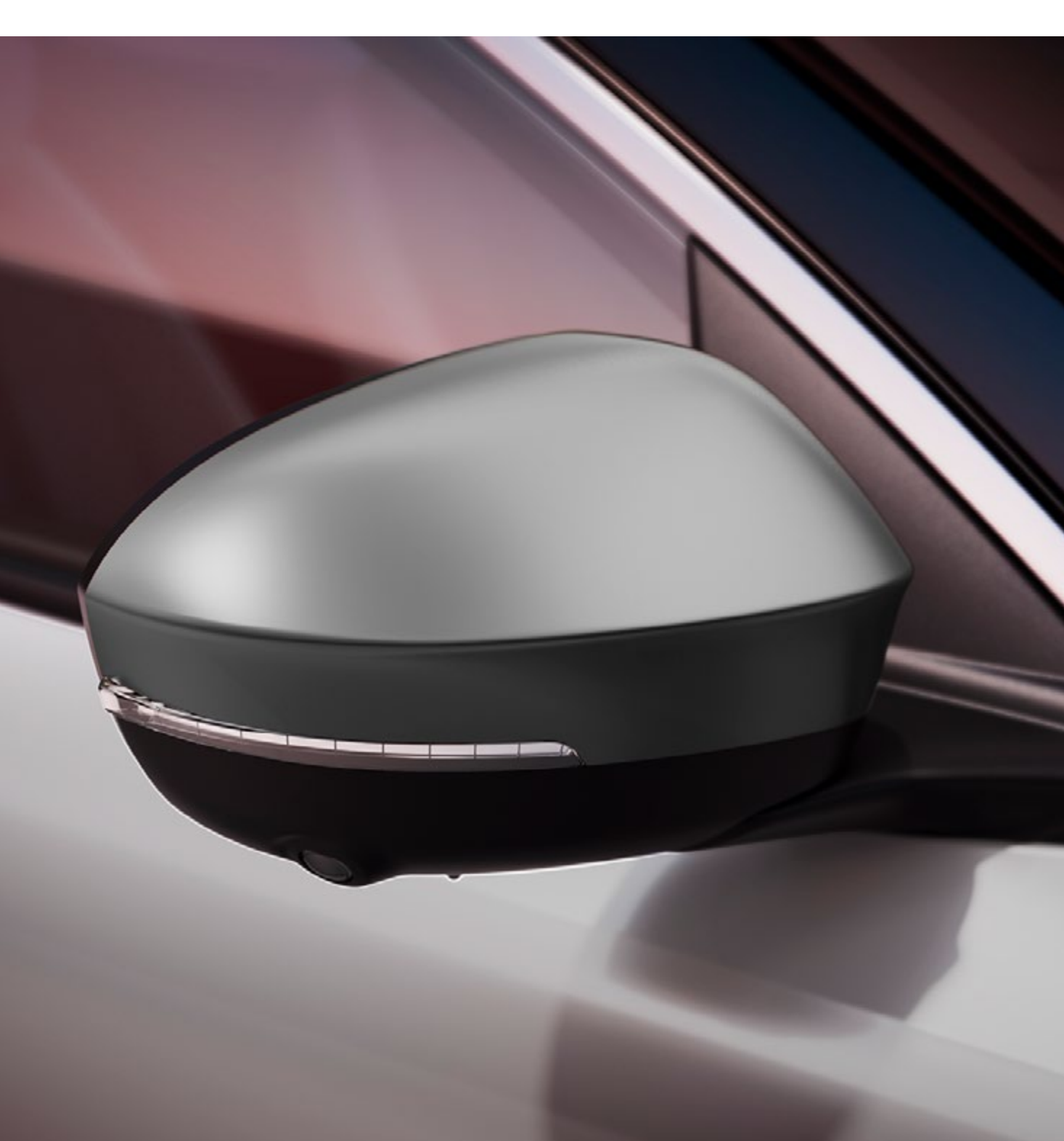
szary matowy metal