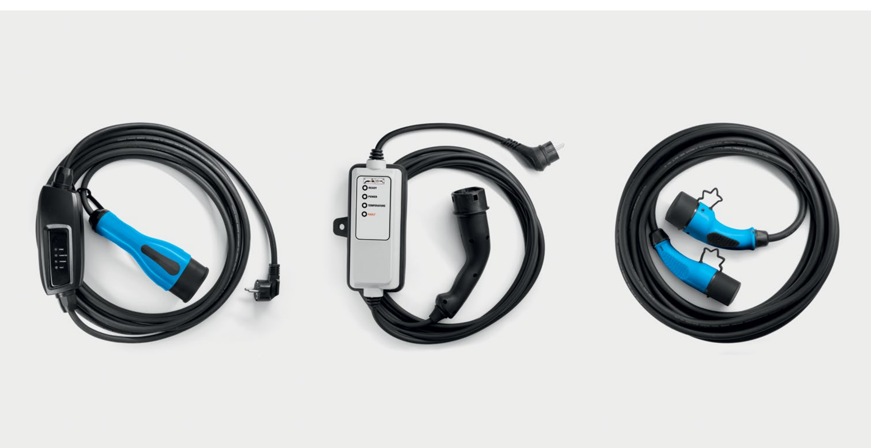
kabel do domowego gniazdka, kabel „flexicharger” i kabel „Wallbox”

Kabel typu „flexicharger” umożliwia ładowanie samochodu ze wzmocnionego gniazdka domowego (2 h = 50 km), dostępny jest też kabel do standardowych domowych gniazdek (3 h 20 min = 50 km). Planując długie podróże, warto zaopatrzyć się w kabel ładowania typu 2 do ładowarek ściennych Wallbox, za pomocą którego można pobierać prąd z publicznej lub domowej stacji ładowania.