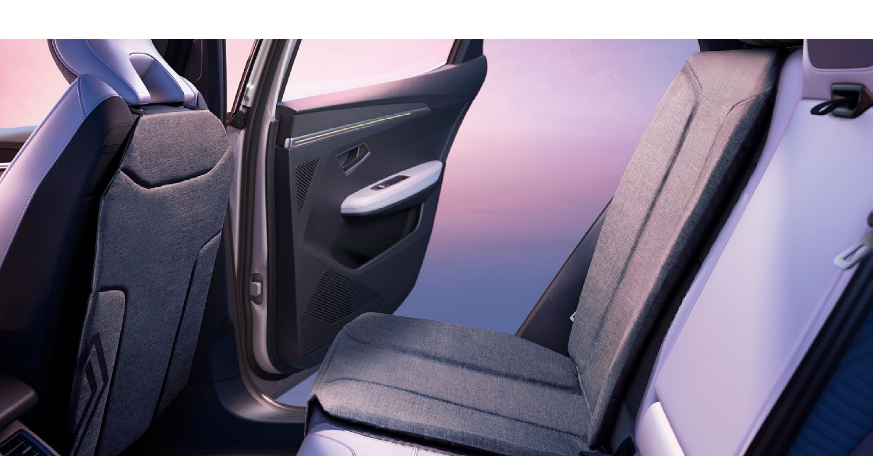
pokrowce ochronne na tylne siedzenia

Dwuczęściowa mata zabezpieczająca fotel chroni tył oparcia przedniego fotela przed zabrudzonymi dziecięcymi bucikami oraz osłania tapicerkę tylnej kanapy pod fotelikiem dziecięcym.