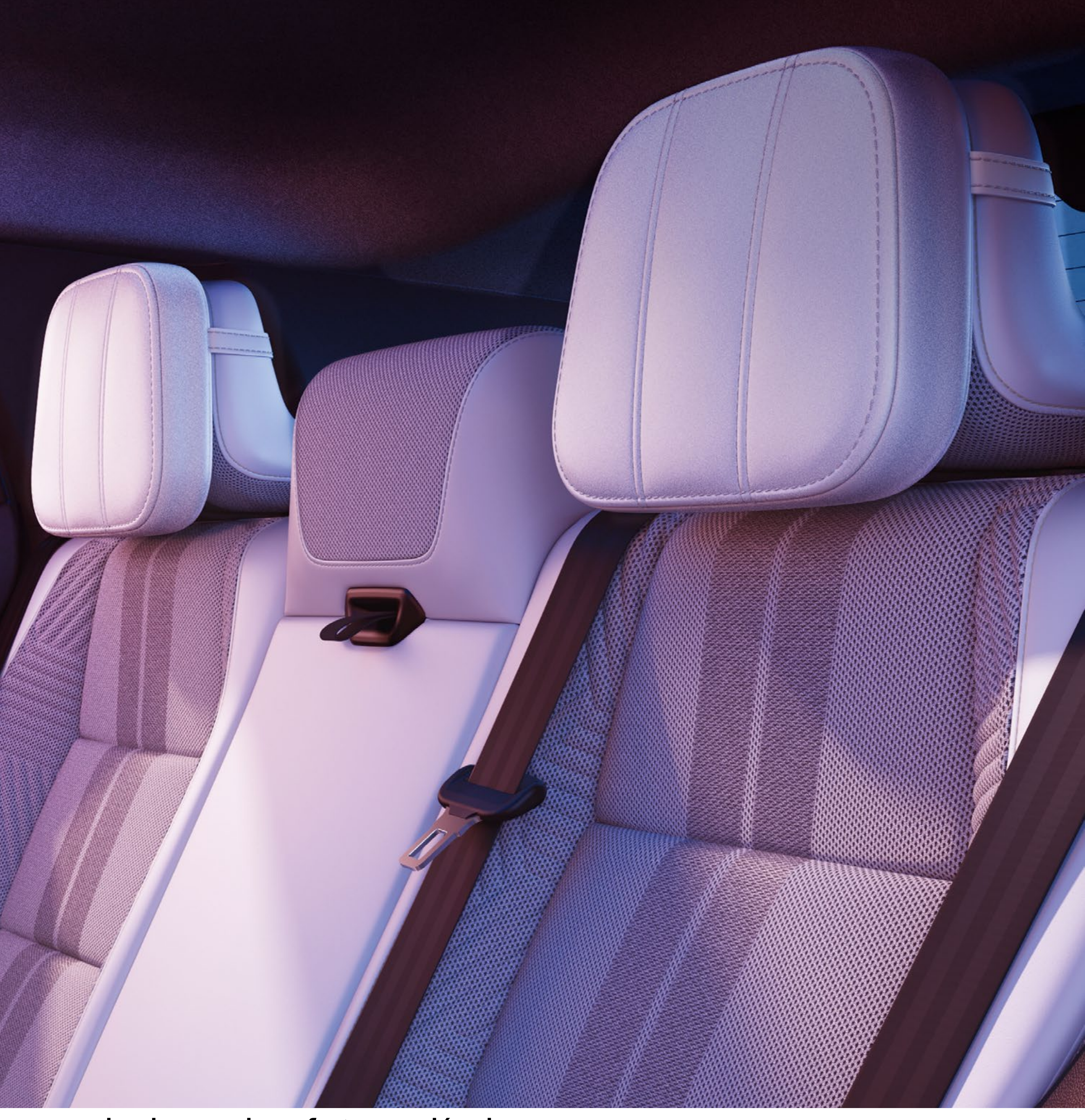
poduszka grand comfort na zagłówek

Za pomocą naszych akcesoriów zoptymalizujesz przestrzeń i zapewnisz wygodę swoim pasażerom. Komfortowe poduszki na tylne zagłówki stanowią dodatkowe podparcie i podnoszą wygodę podróżowania, a przy tym są ciekawym dodatkiem stylistycznym.