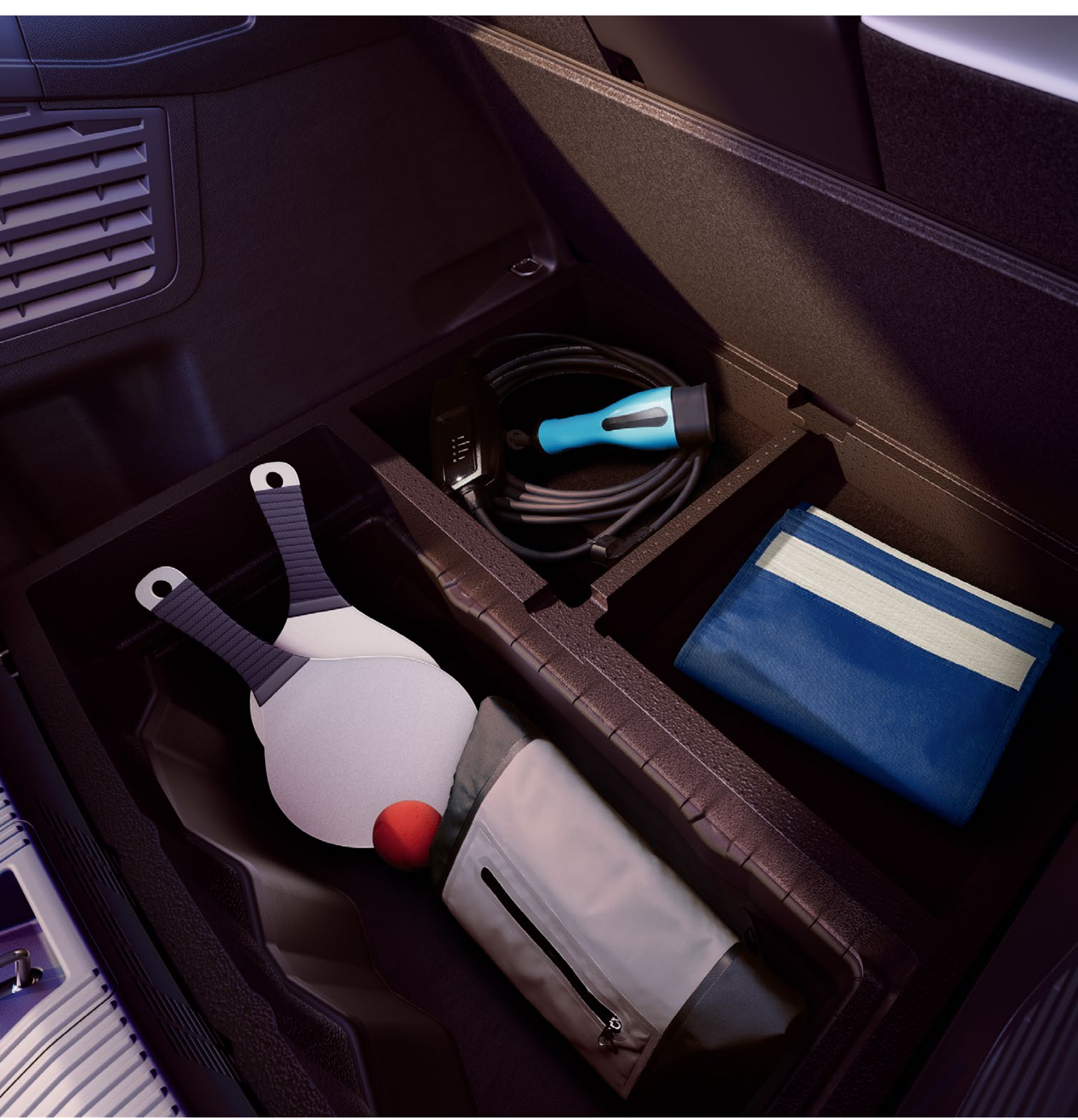
podwójna podłoga ze schowkiem na dodatkowe kable

Podwójna podłoga, podwójna korzyść: mimo umieszczonej wyżej podłogi całkowita pojemność bagażnika nie ulega zmniejszeniu, a przewożone przedmioty są uporządkowane i łatwiej dostępne.