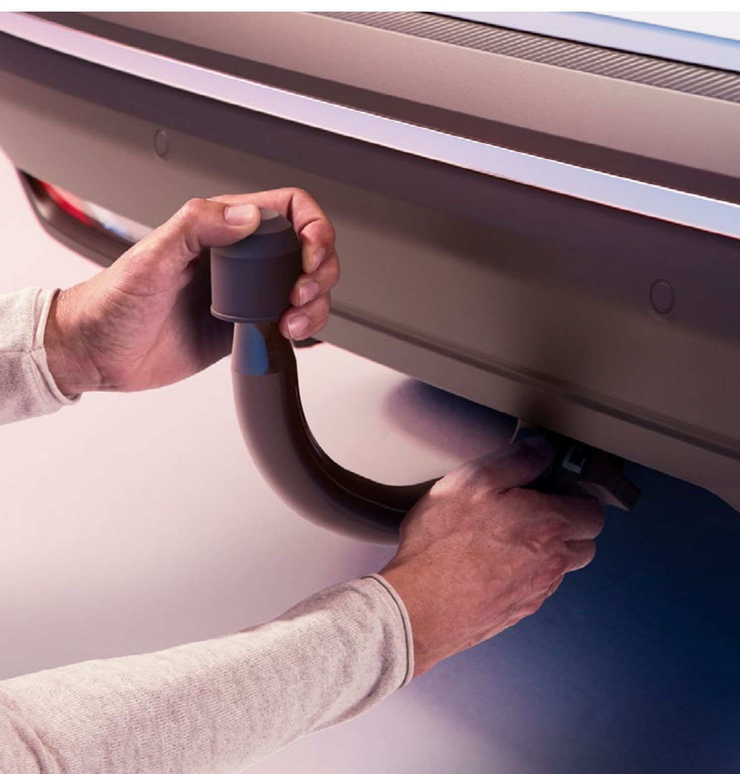
hak holowniczy demontowany bez użycia narzędzi

Hak holowniczy demontowany bez użycia narzędzi jest bardzo łatwy w użyciu i nie zakłóca estetyki pojazdu. Po zdemontowaniu kuli jest praktycznie niewidoczny.