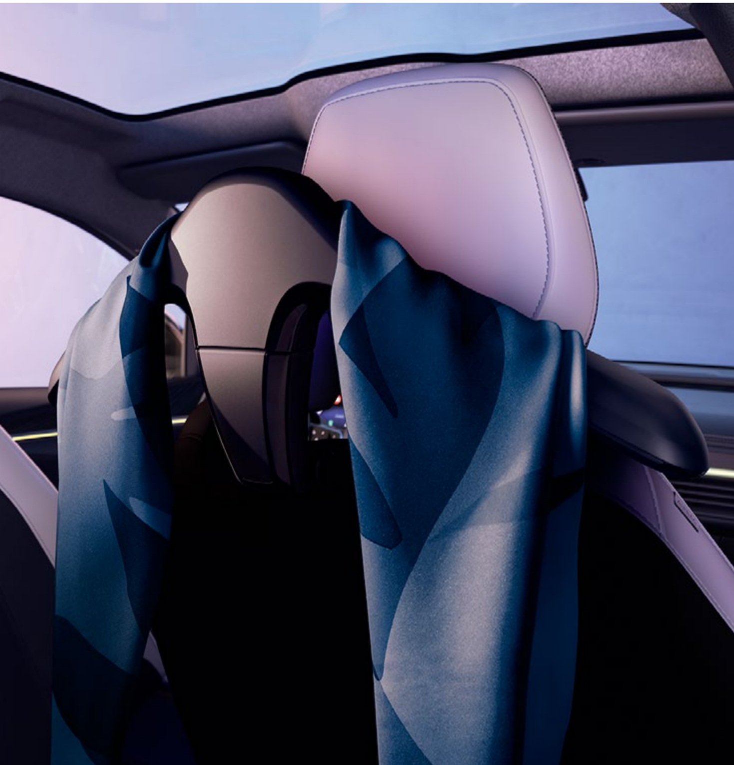
wieszak na ubrania – element systemu wielofunkcyjnego

Okrycie wierzchnie zdjęte na czas podróży możesz odwiesić na wieszak mocowany z tyłu oparcia przedniego fotela. Po zdemontowaniu wieszaka w tym samym uchwycie można zamocować haczyk na siatkę z zakupami lub składany stolik, idealny na książkę, smartfon czy butelkę.