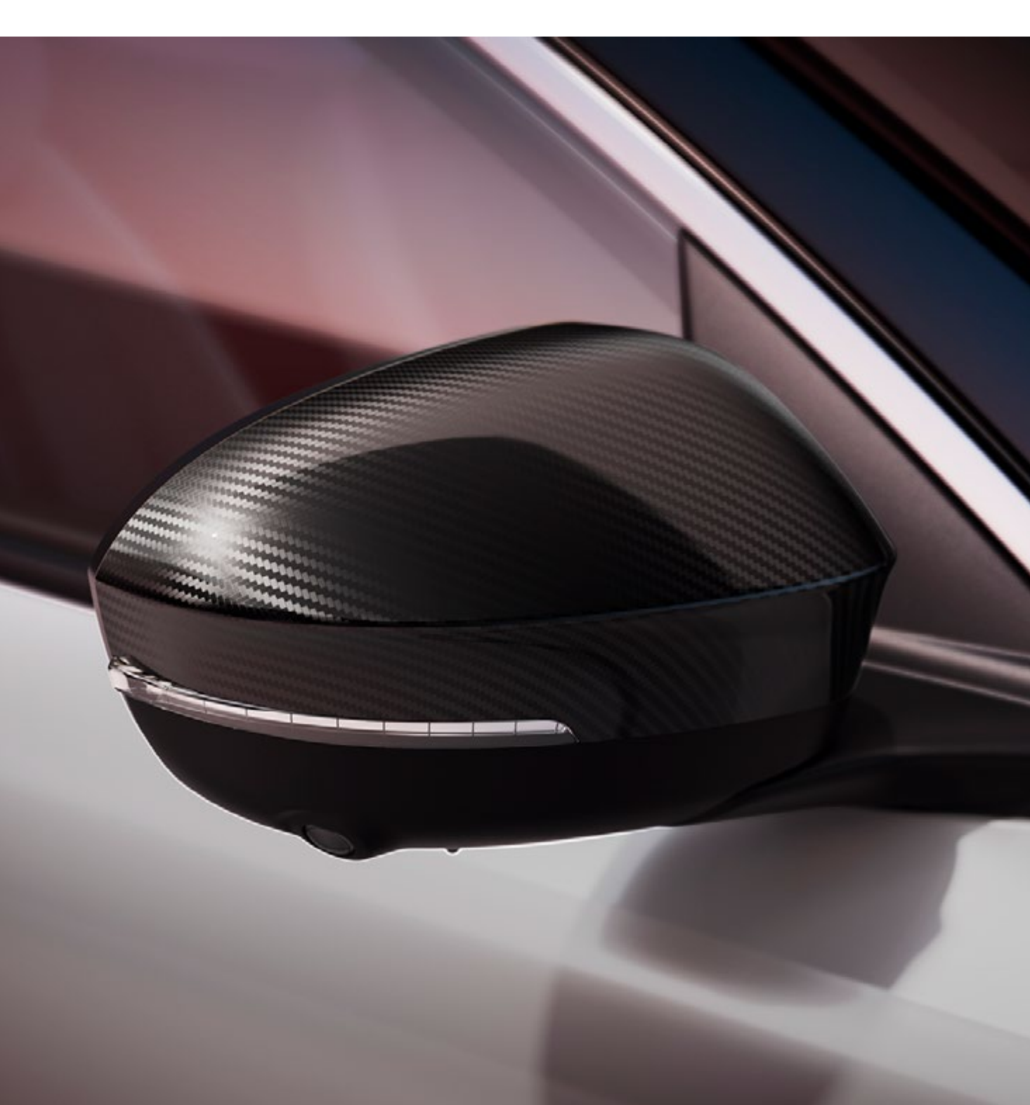
efekt włókna węglowego

Obudowy lusterek bocznych są dostępne w wersji z efektem włókna węglowego, ze złotymi akcentami oraz w kolorze szarego matowego metalu lub jasnoszarym.