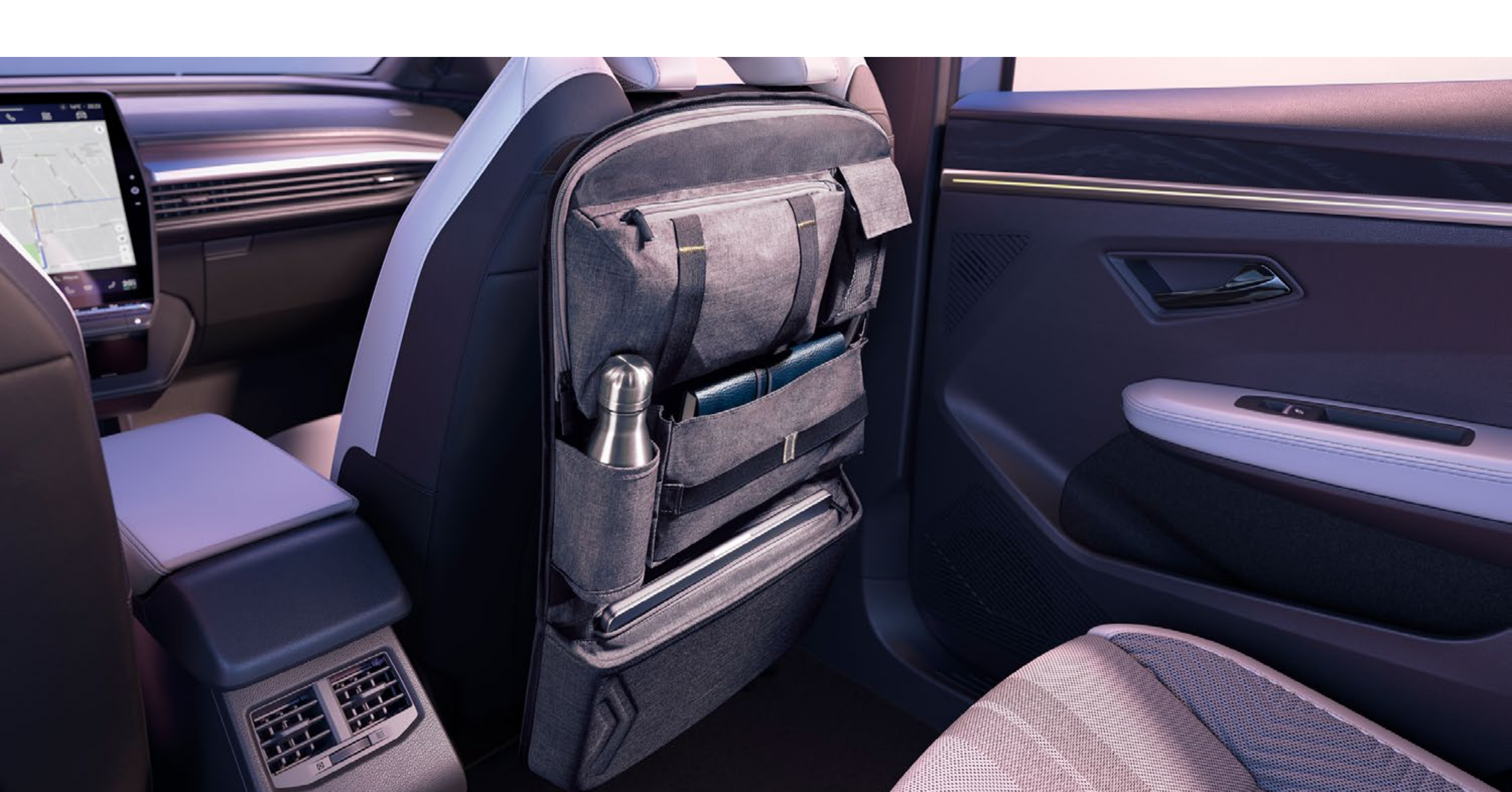
wielofunkcyjny organizer na oparcie przedniego fotela

Organizer mocowany z tyłu oparcia przedniego fotela ma sześć kieszeni na przedmioty różnej wielkości oraz specjalną kieszeń na tablet.