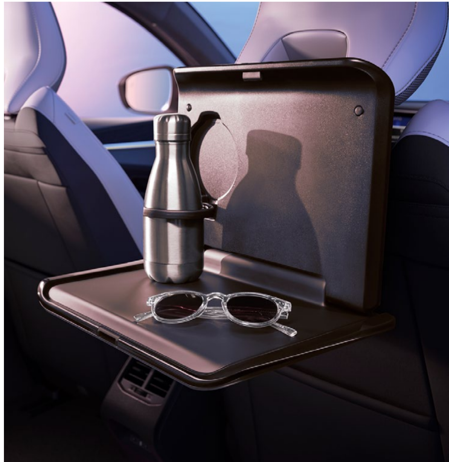
składany stolik – element systemu wielofunkcyjnego