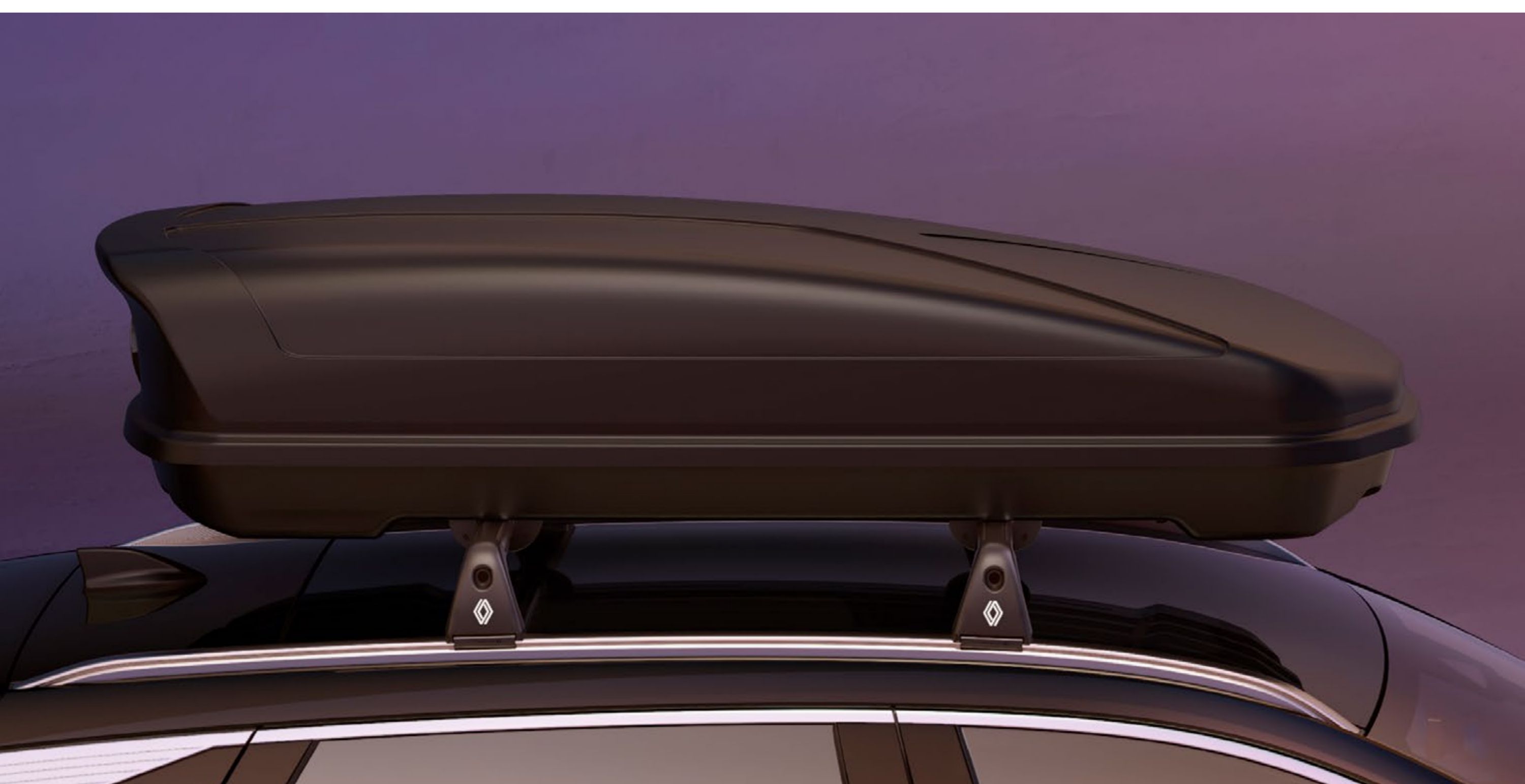
480litrowy kufer dachowy Renault montowany na poprzeczkach dachowych

Na poprzeczkach dachowych można zamontować bagażnik do przewozu rowerów lub nart, lub zamykany kufer dachowy. Akcesoria te są kompatybilne z panoramicznym dachem i łatwe do zamontowania bez użycia narzędzi.