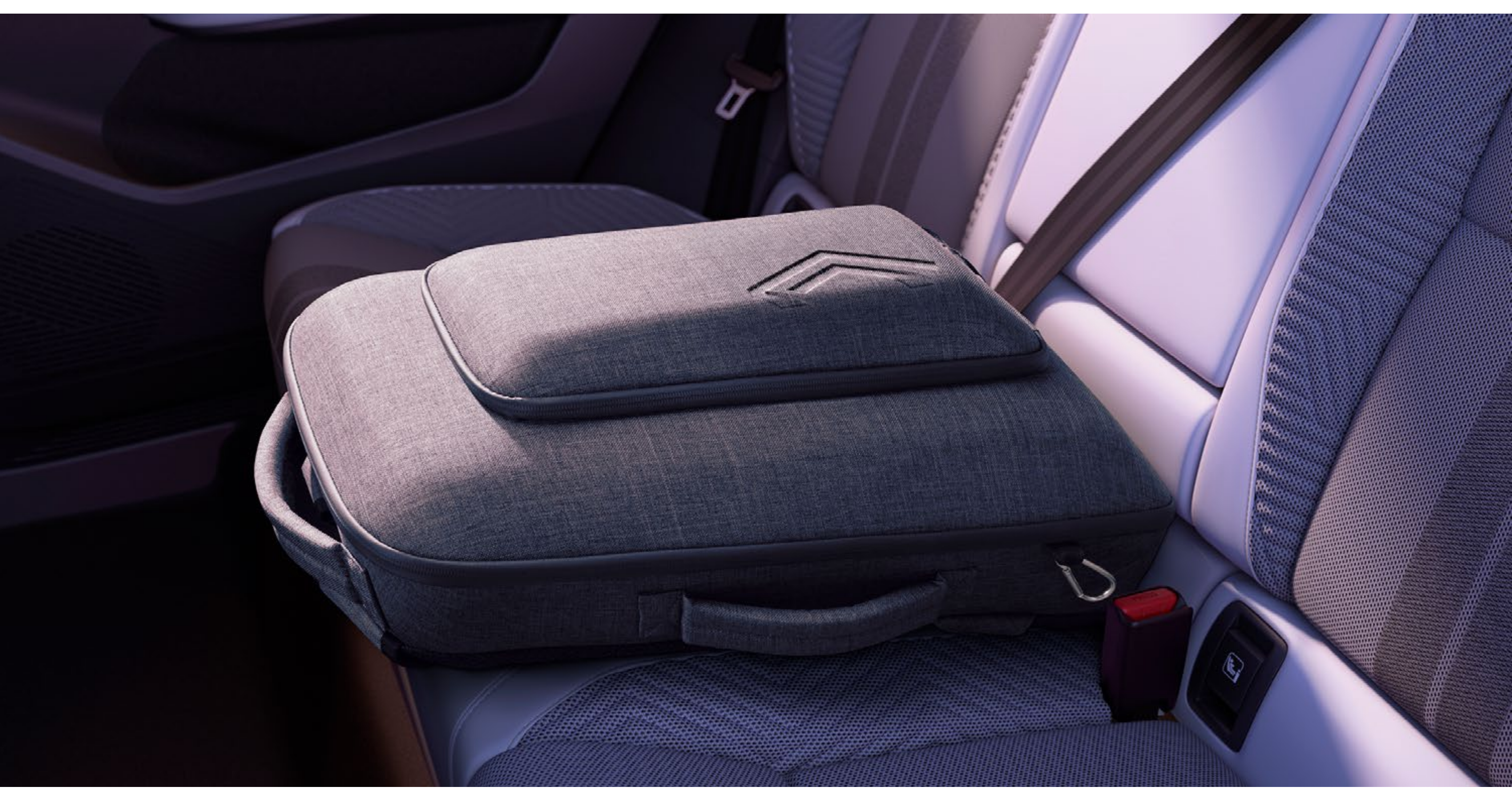
wyjmowany tylny podłokietnik, schowek i plecak w jednym

Podłokietnik dla pasażerów tylnych siedzeń jest jednocześnie dodatkowym zamykanym schowkiem. Można go także zabrać z samochodu i nosić jako plecak z rzeczami niezbędnymi na spacerze z rodziną.