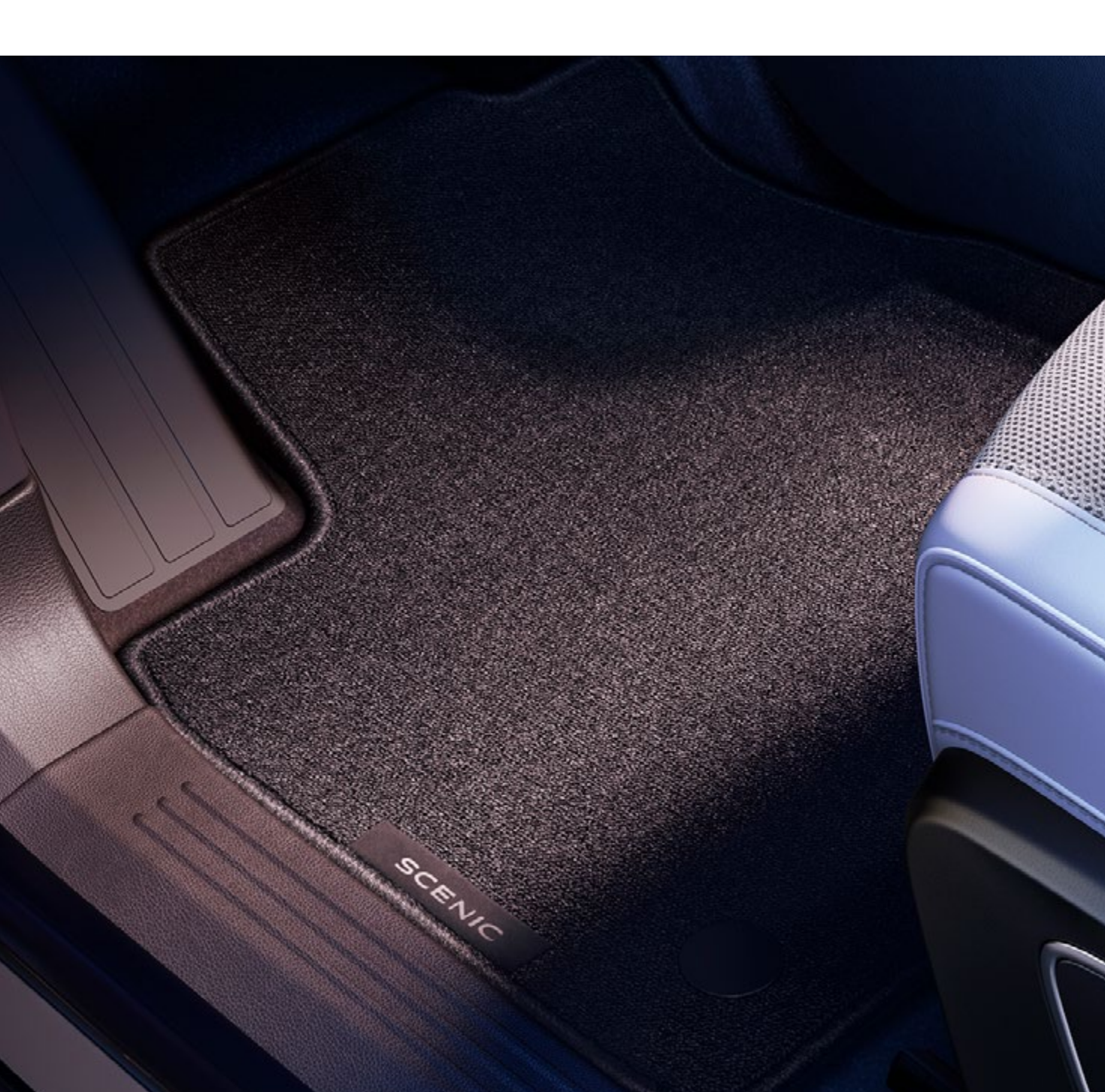
dywaniki tekstylne comfort

Wyjątkowo wytrzymałe dywaniki tekstylne lub wodoodporne dywaniki gumowe z podwyższonymi krawędziami zapewnią najlepszą możliwą ochronę przedziału pasażerskiego.