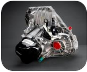
Caixas de velocidades