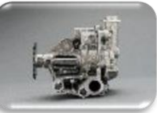
Bombas de óleo