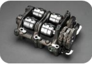
Árvore de equilibragem