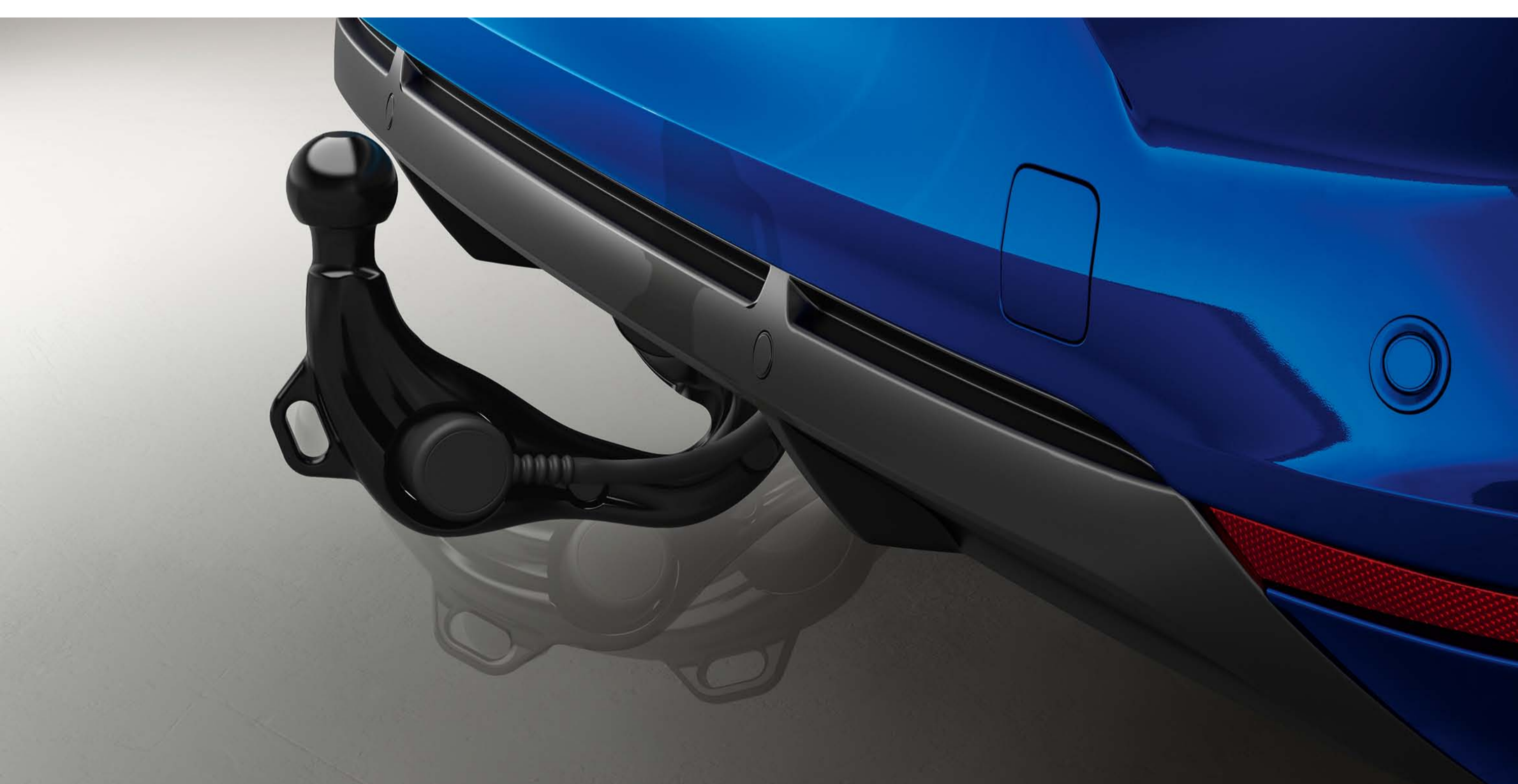
gancho de reboque retrátil semielétrico

Retrátil e semielétrico, o gancho de reboque expande-se num piscar de olhos e torna-se «invisível» quando está recolhido.