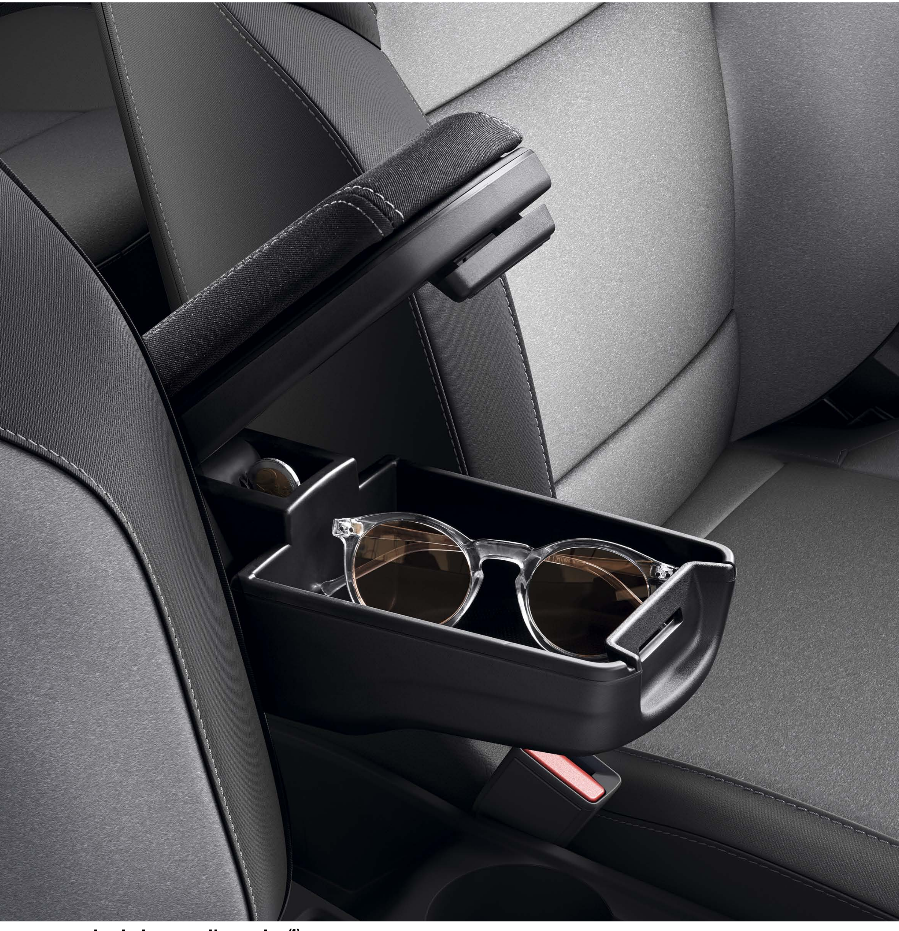
apoio de braço dianteiro (1)

Os equipamentos elegantes e funcionais da nossa gama de acessórios interiores foram concebidos para tornar as suas viagens ainda mais agradáveis... como este apoio de braço central que oferece igualmente mais um espaço de arrumação.