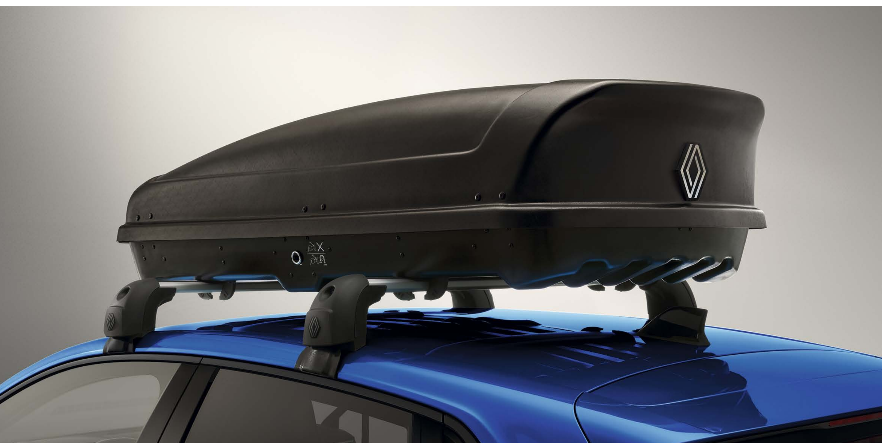
bagageira de tejadilho rígida de 380 litros

Aumente a capacidade de carga do seu Renault Clio com as nossas bagageiras de tejadilho ou os nossos porta-esquis e fixe-os com toda a simplicidade.