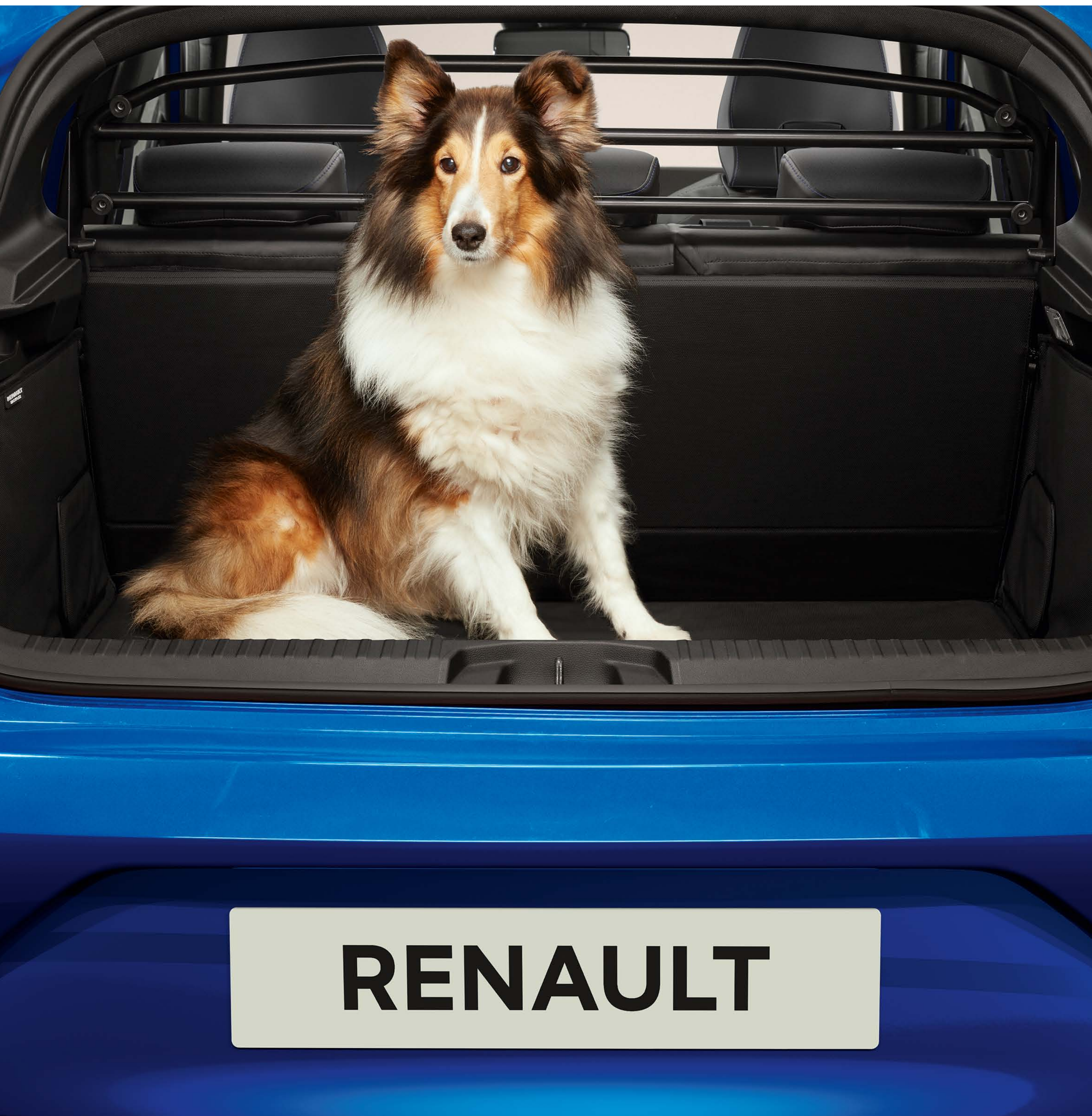
grelha de separação

Com o Novo Renault Clio E-Tech full hybrid, a prioridade é a sua tranquilidade e a dos seus passageiros. Descubra uma gama de equipamentos à sua imagem, como a grelha de separação que isola o habitáculo da bagageira.