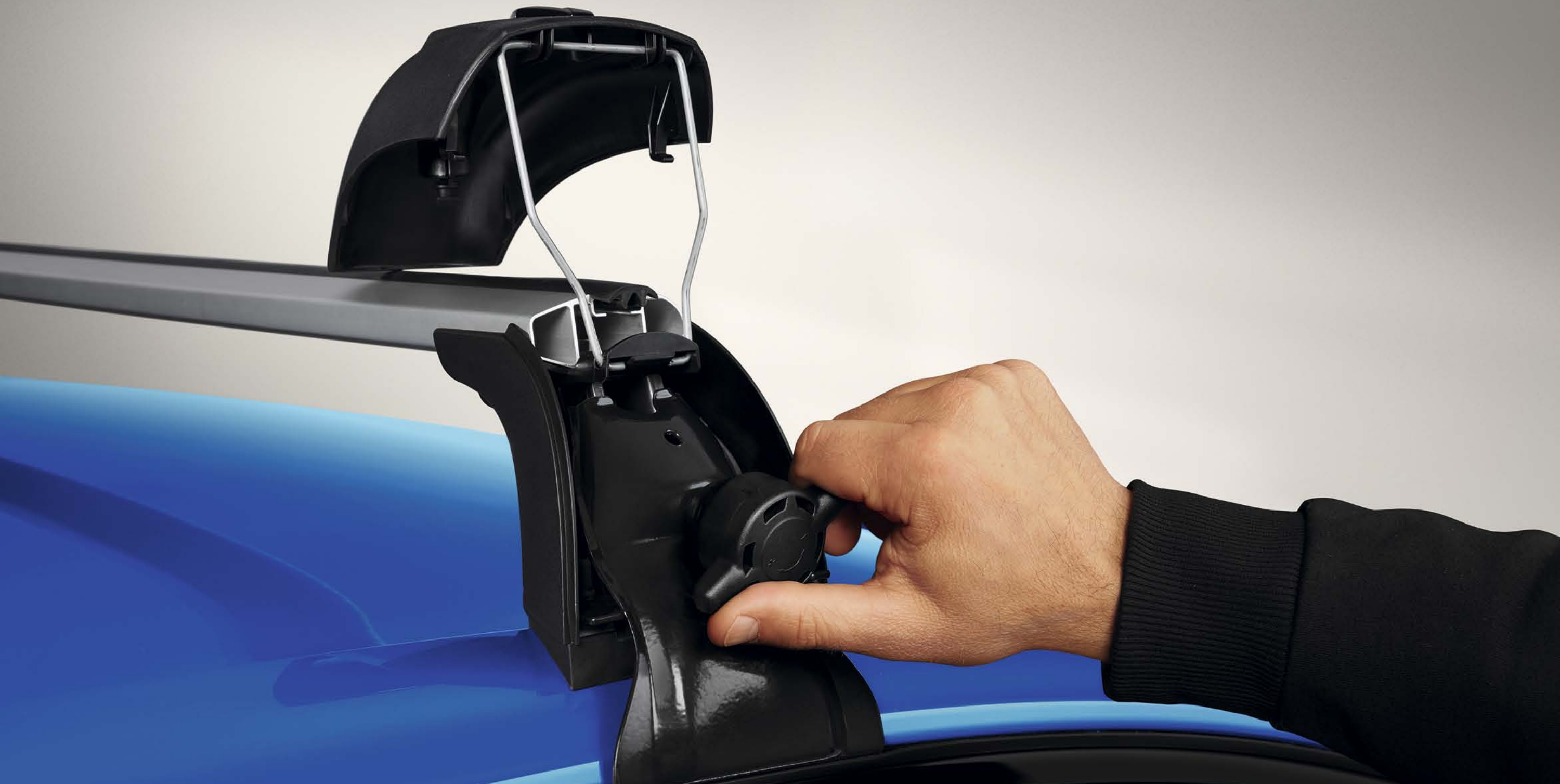
barras de tejadilho quickfix em alumínio

Passe menos tempo a carregar o seu veículo e comece mais cedo a desfrutar dos seus momentos de lazer. Graças ao sistema quickfix, as barras de tejadilho instalam-se num piscar de olhos e sem ferramentas.