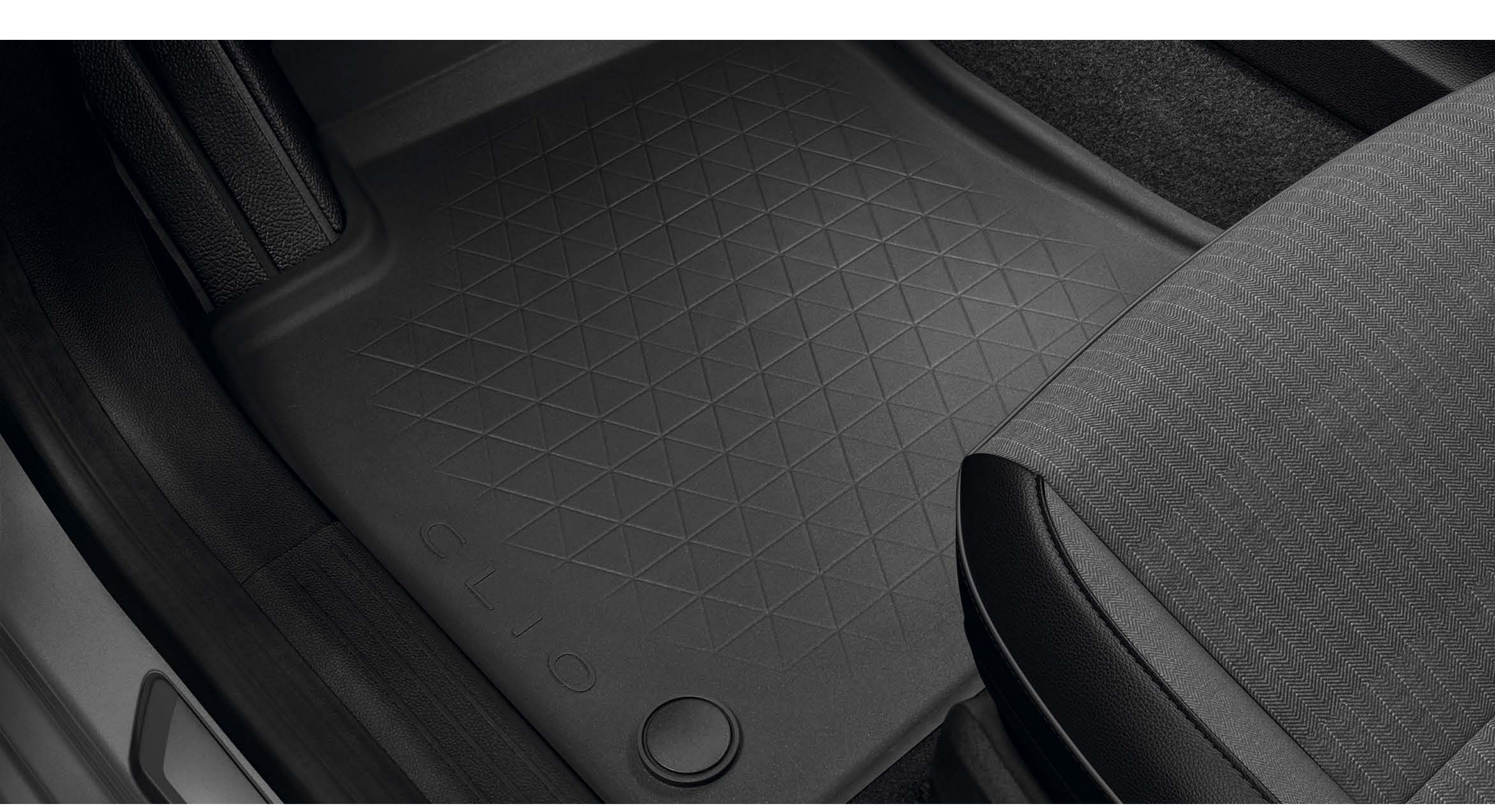
tapetes em borracha

O conjunto de tapetes em borracha, especialmente concebidos para o seu veículo, garantem a melhor proteção do habitáculo.