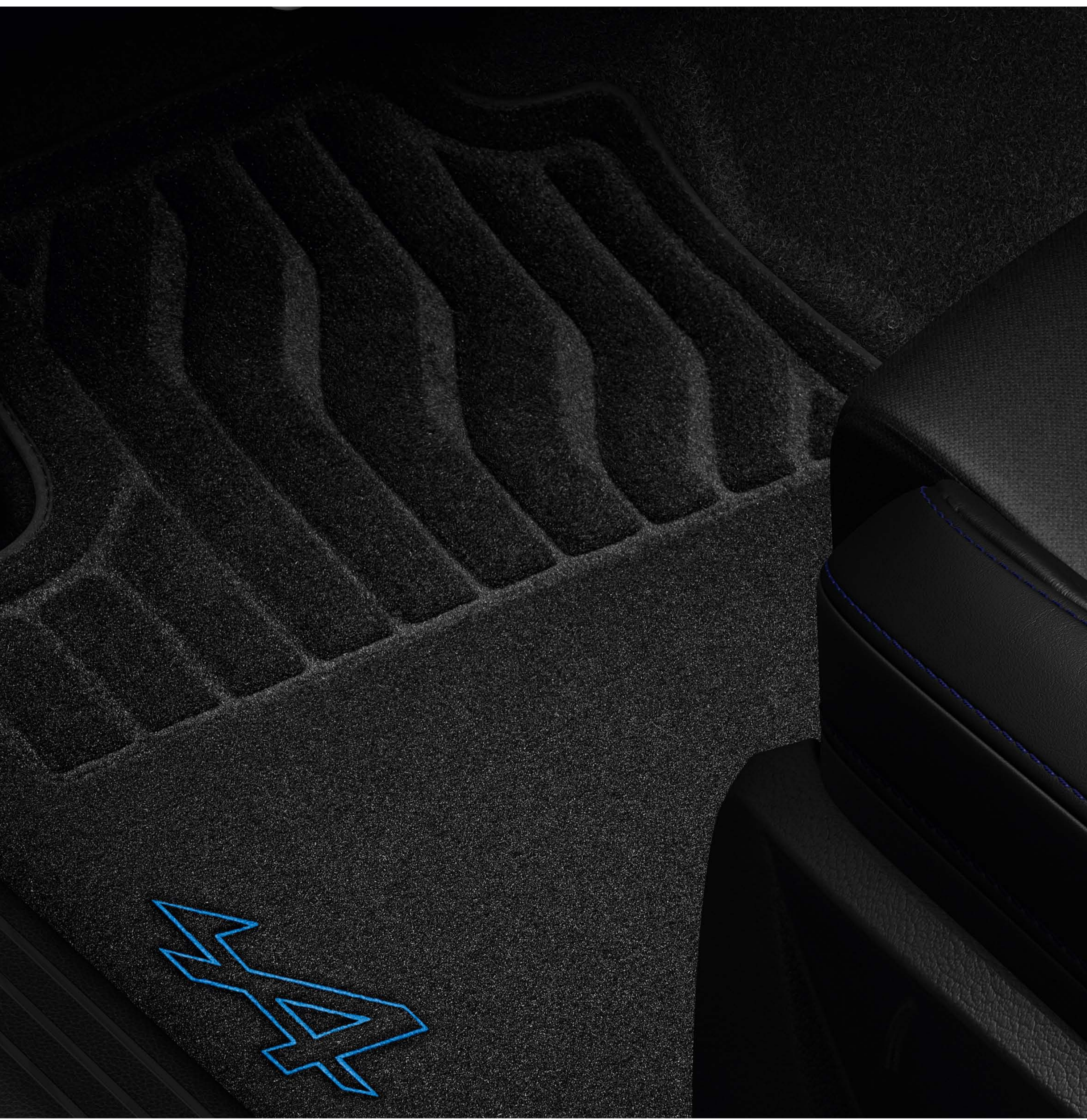
tapetes de habitáculo esprit Alpine

Os tapetes esprit Alpine conferem um toque desportivo ao interior do seu Renault Clio.