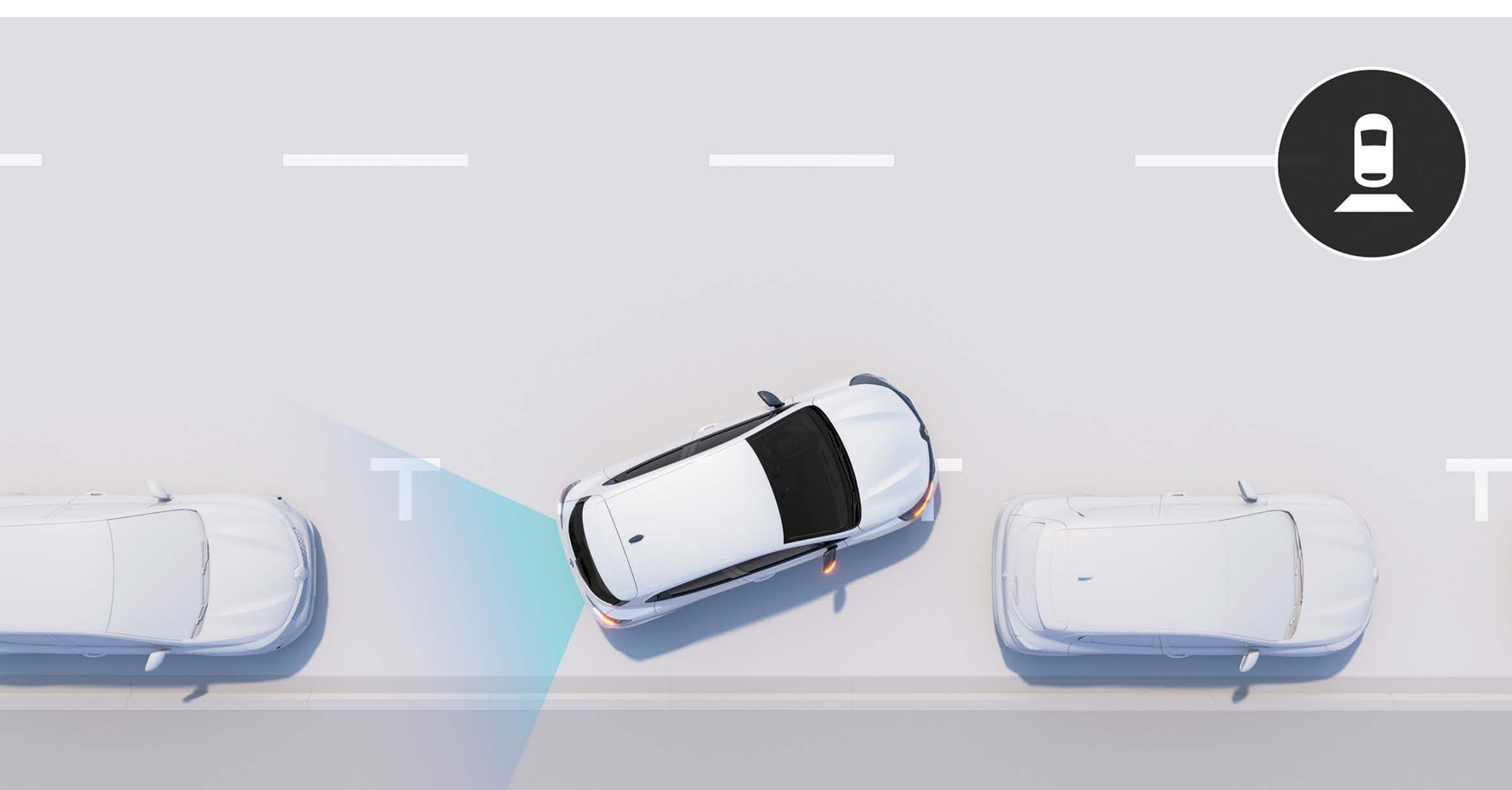
câmara de marcha-atrás (1)

Beneficie da câmara de marcha-atrás que simplifica as suas manobras em marcha-atrás.