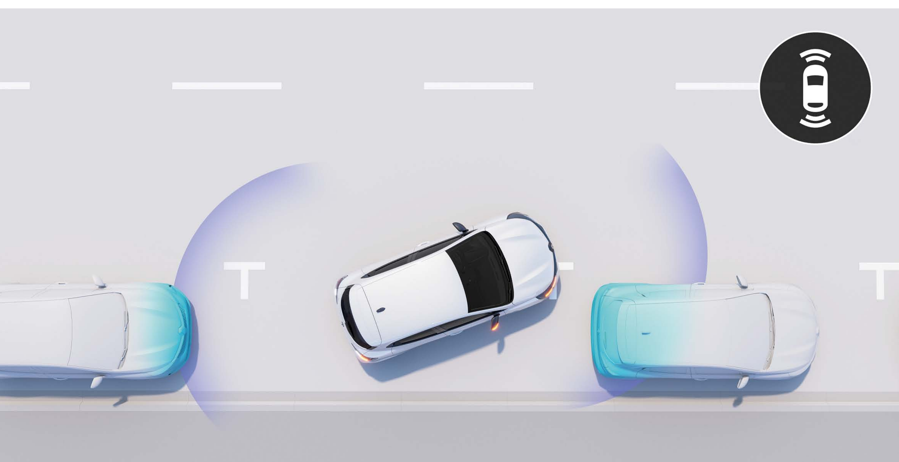
sistema de ajuda ao estacionamento dianteiro e traseiro

Uma ajuda preciosa para efetuar qualquer manobra com toda a serenidade. Os sensores detetam qualquer obstáculo à frente ou atrás do veículo e o sistema avisa-o através de um sinal sonoro.