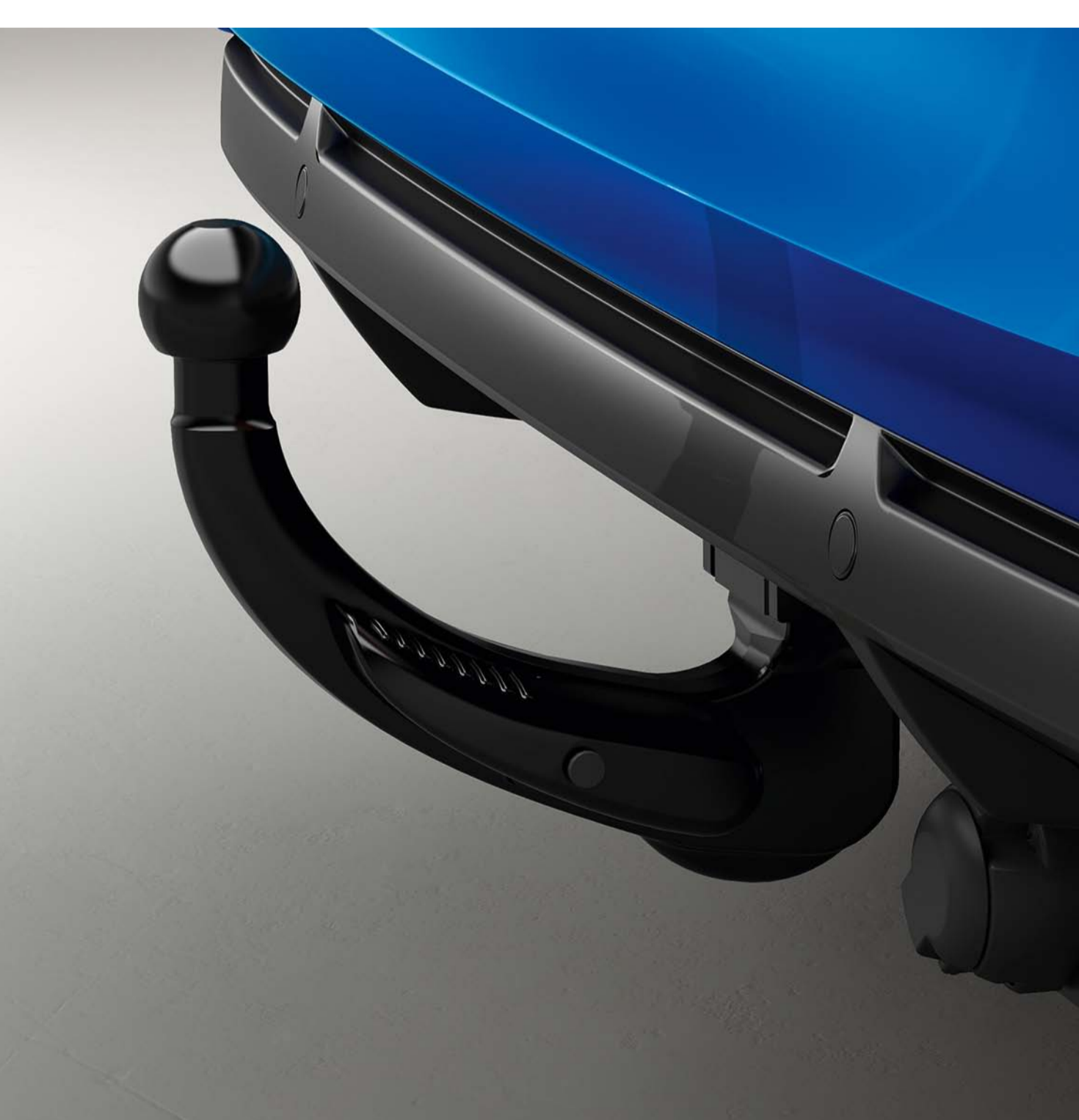
gancho de reboque desmontável sem ferramentas