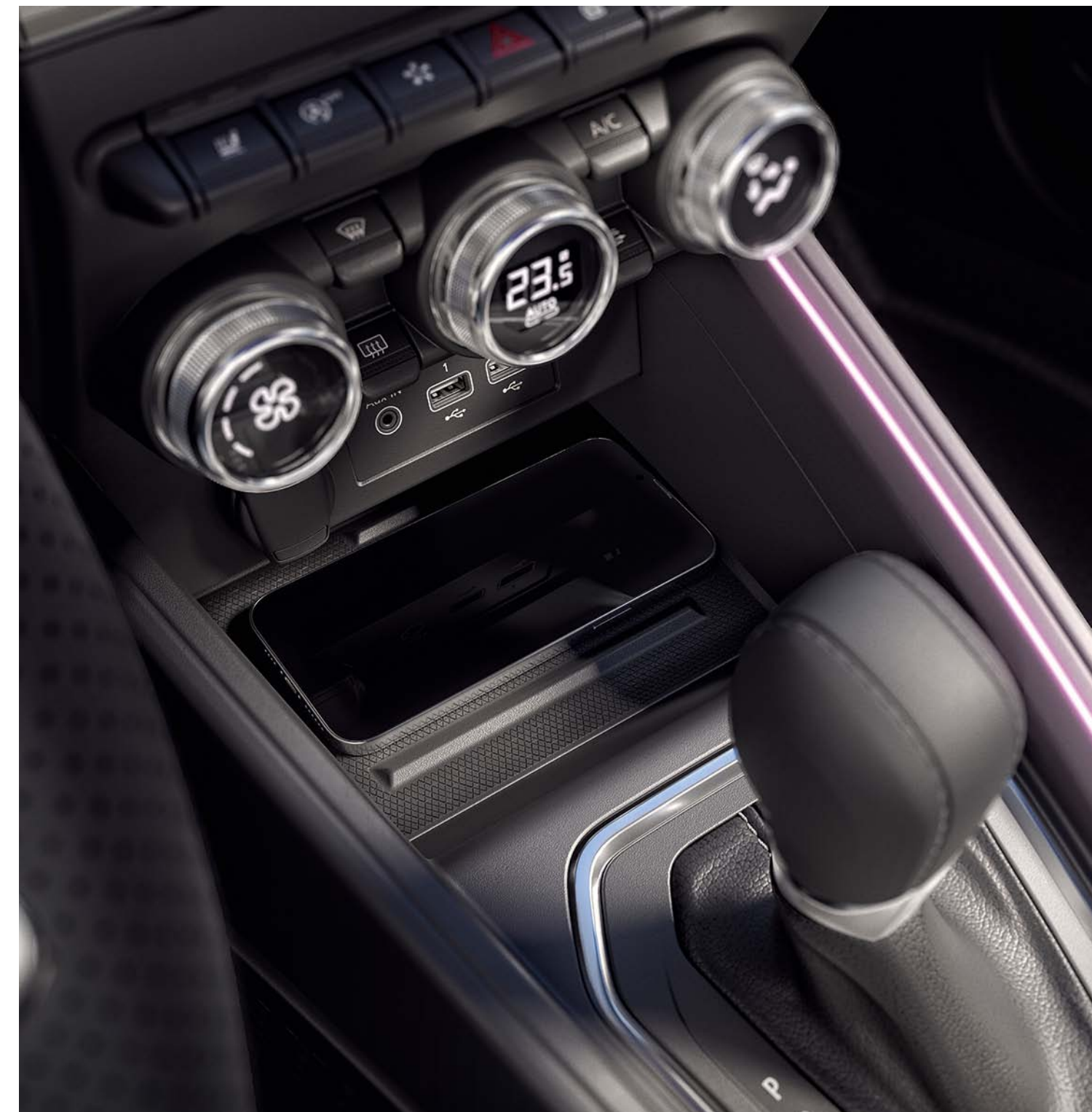
carregador por indução (1)

Para aumentar o conforto a bordo, escureça o interior com as cortinas para-sol para os vidros traseiros e óculo traseiro.