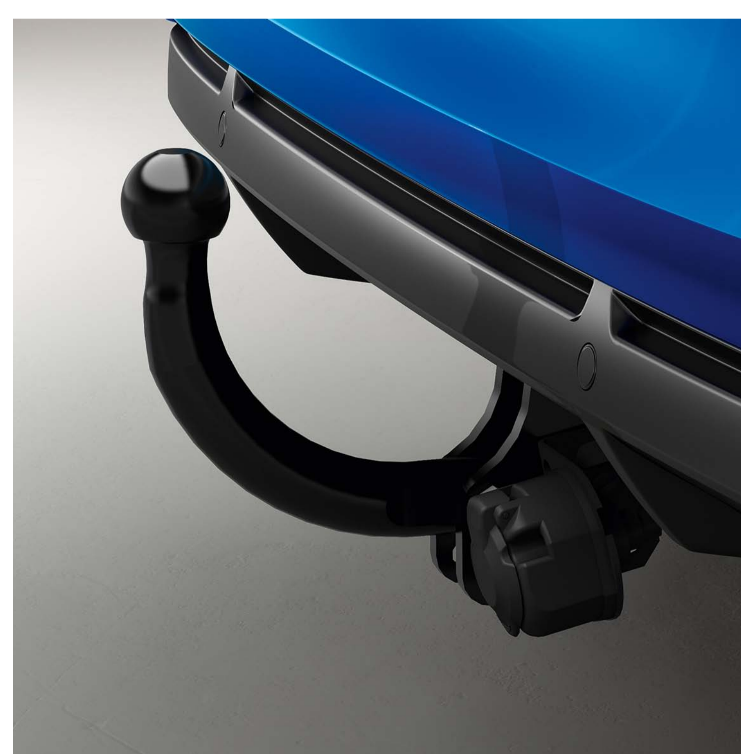
gancho de reboque pescoço de cisne