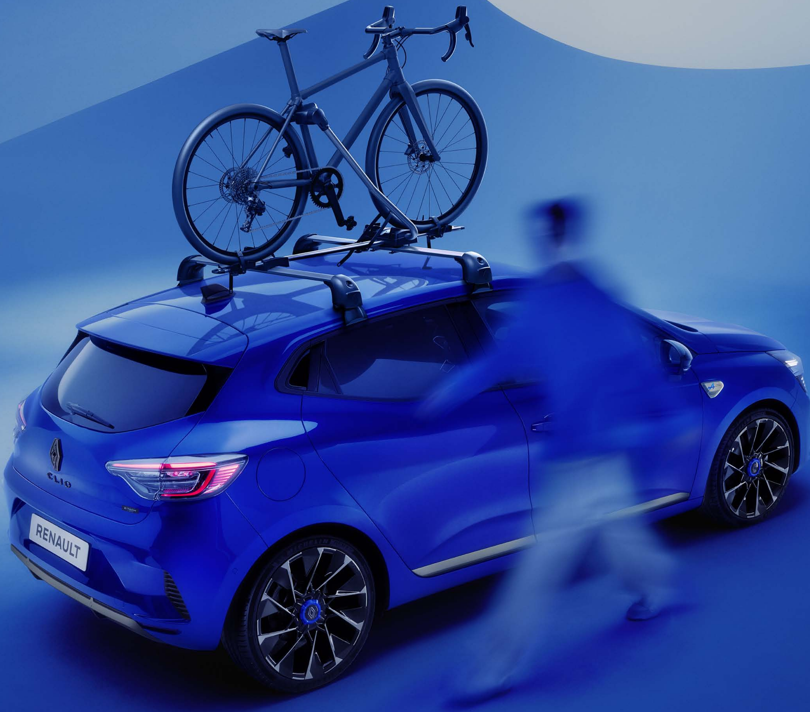
porta-bicicletas nas barras de tejadilho quickfix em alumínio

Este porta-bicicletas permite transportar a sua bicicleta com toda a segurança. Inicie a viagem tranquilamente.