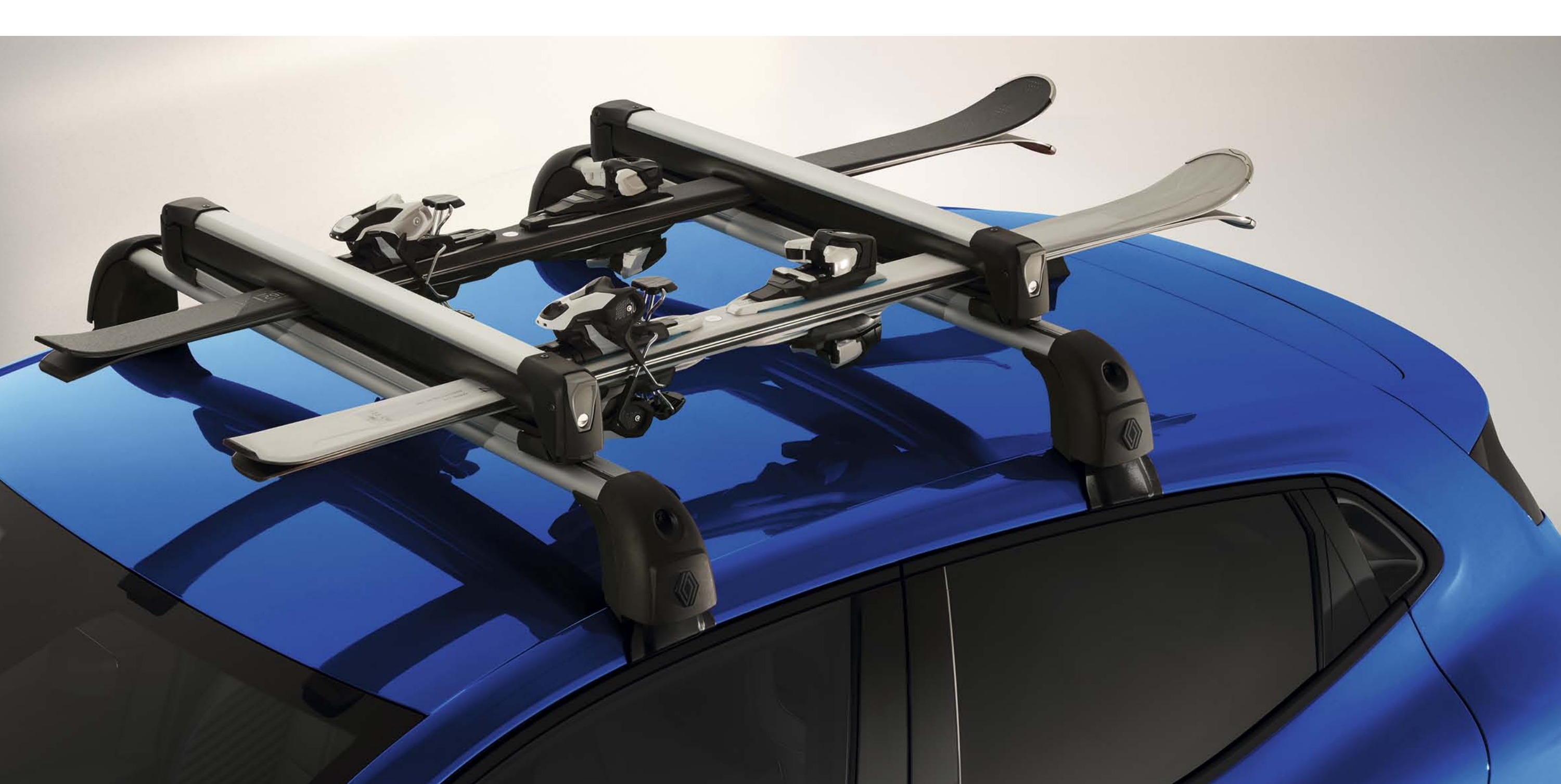
porta-esquis para 4 pares de esquis/2 snowboards - foto não contratual