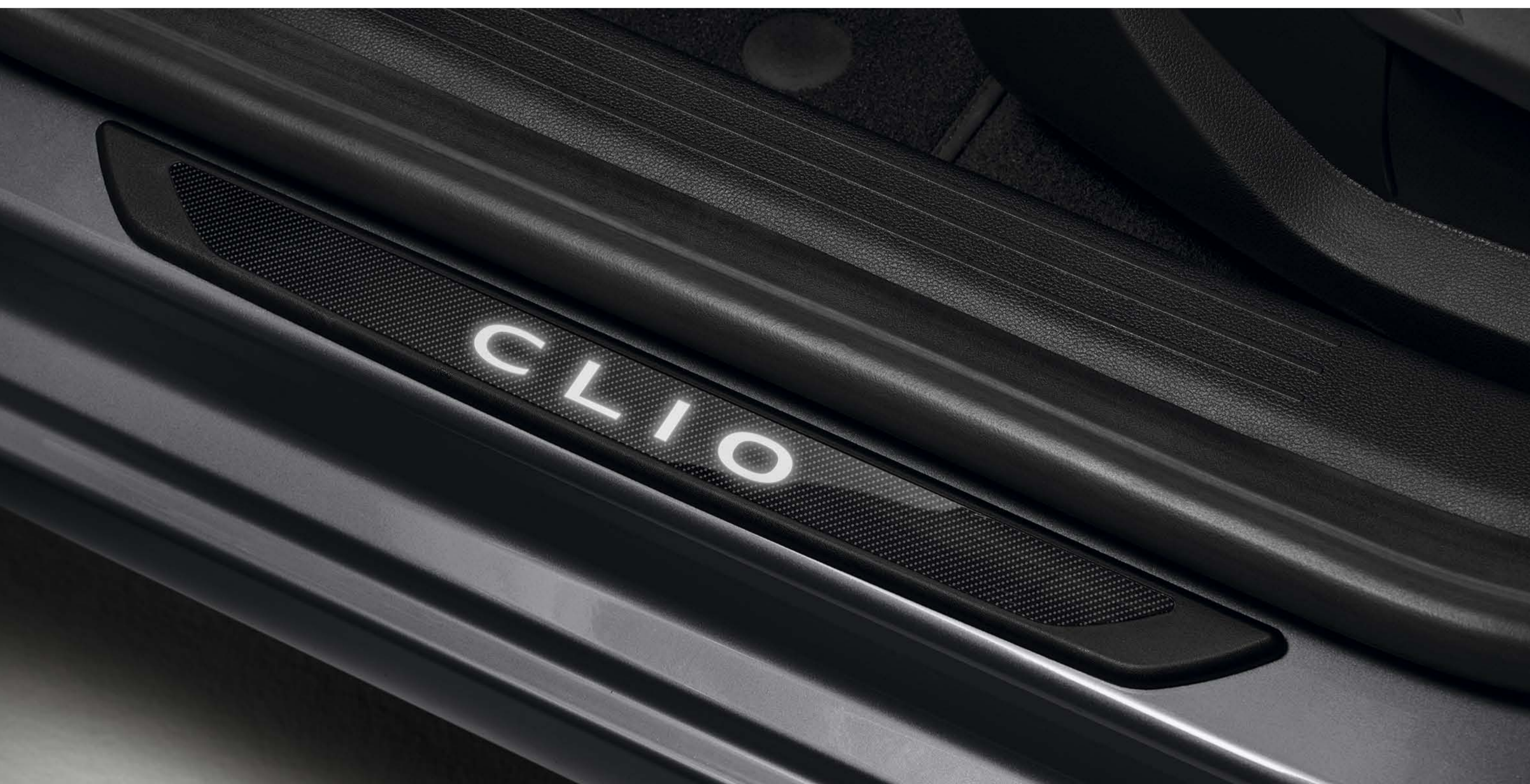
soleiras de porta iluminadas Clio (1)

As soleiras de porta Clio iluminadas irão fazê-lo viver uma experiência mais exclusiva, ao mesmo tempo que protegem as embaladeiras.