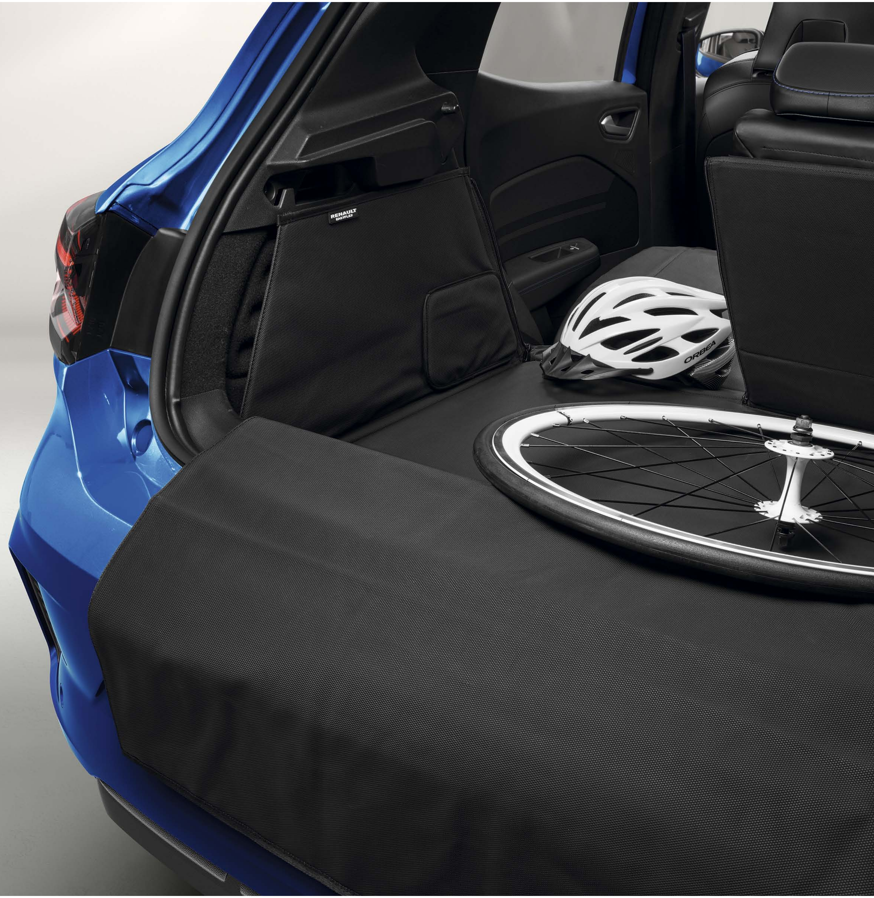
proteção de bagageira modulável easyflex

Preserve, dia após dia, o brilho do seu Novo Renault Clio E-Tech full hybrid com a proteção de bagageira easyflex que cobre integralmente a soleira da bagageira e o espaço de carga. Impermeável e modulável, é ideal para transportar objetos volumosos e sujos.