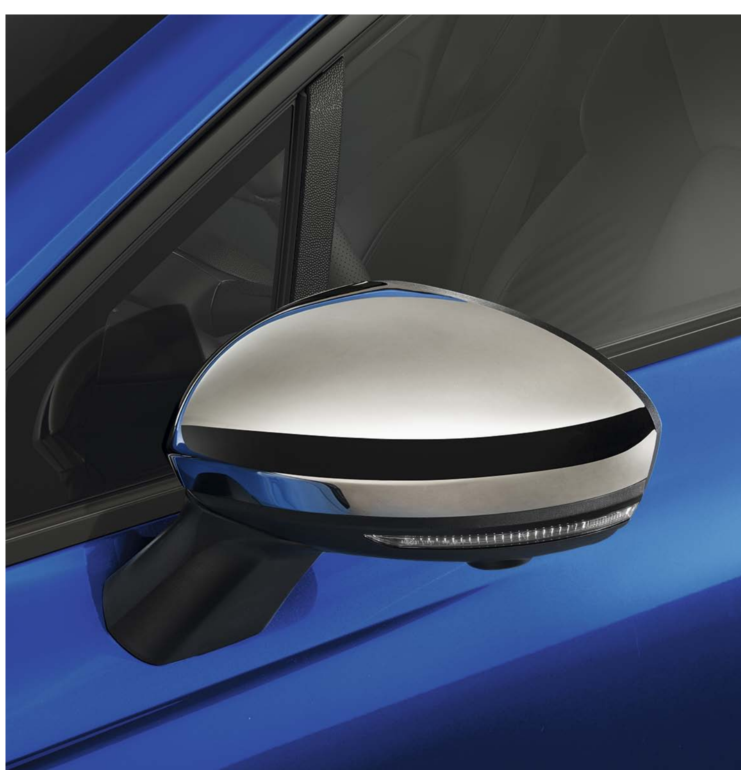
capas de retrovisores cromadas