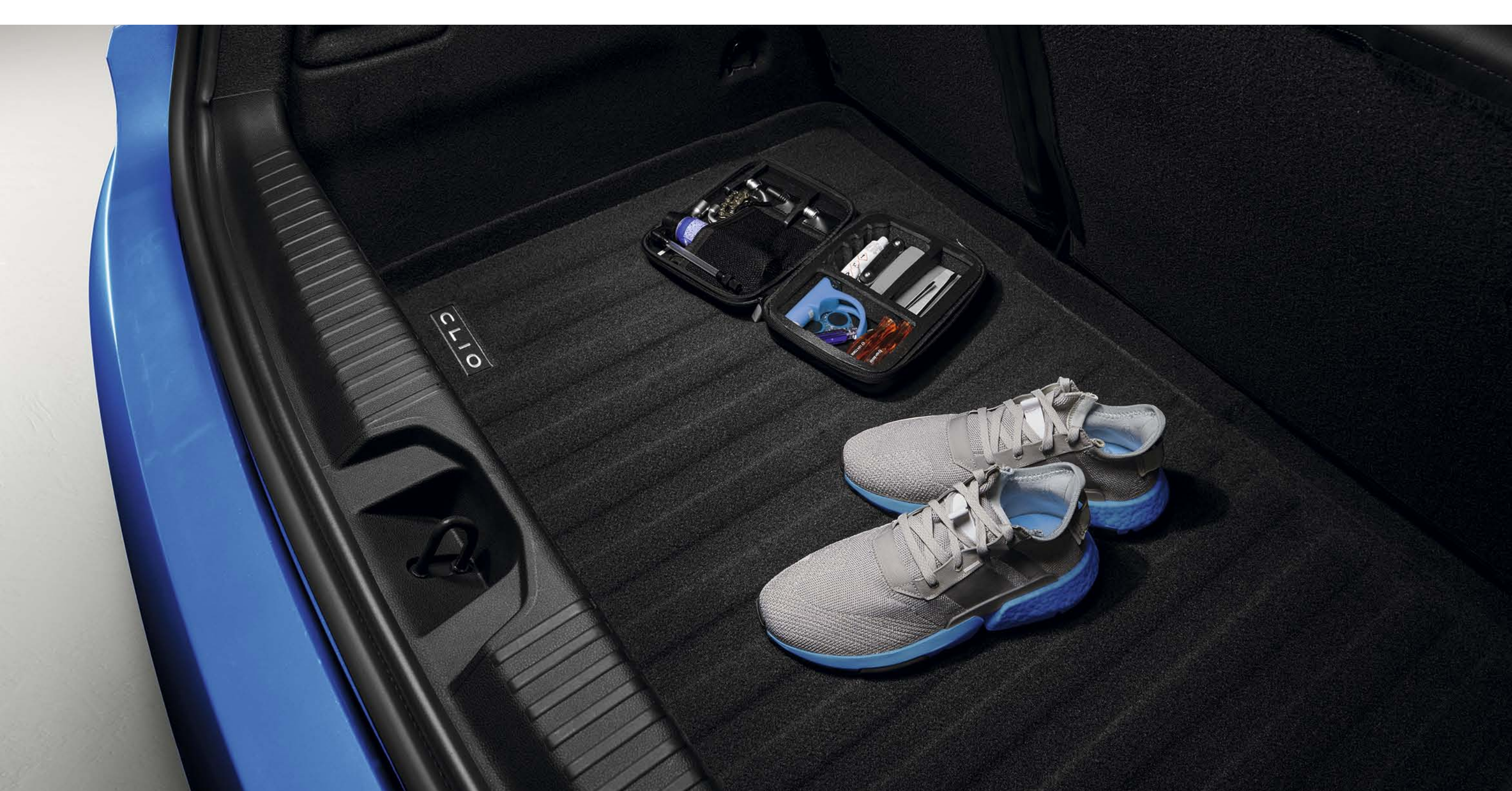
caixa de fundo de bagageira reversível

Esta caixa fundo de bagageira à prova de água e concebida por medida, reversível e com rebordos elevados fará do seu Renault Clio um veículo à prova das exigências do dia a dia.