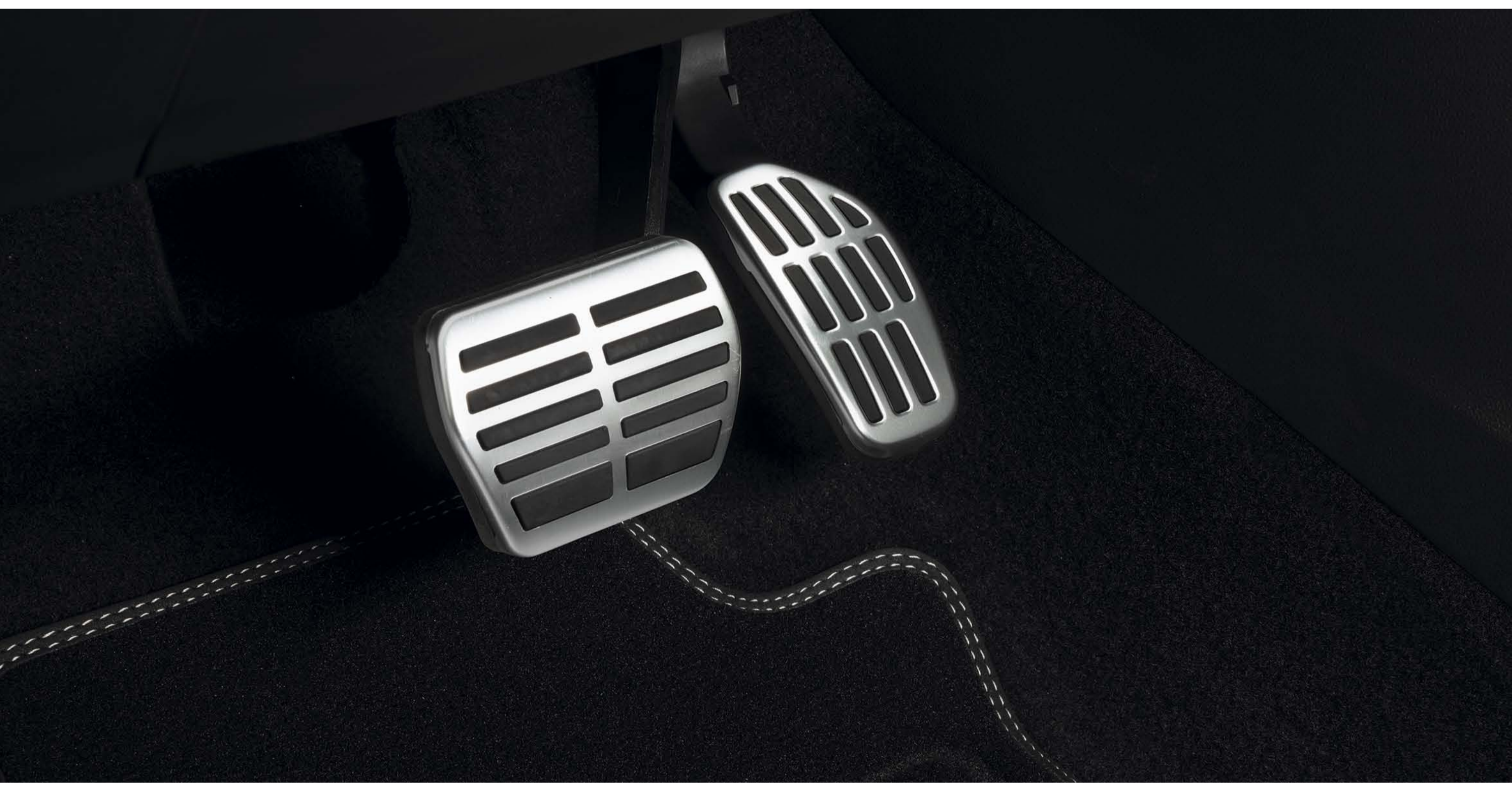
pedais desportivos em alumínio (1)(2)

Reforce o carácter dinâmico a bordo com os pedais desportivos em alumínio.