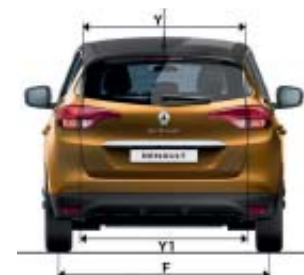
GRAND SCENIC 7 LUGARES