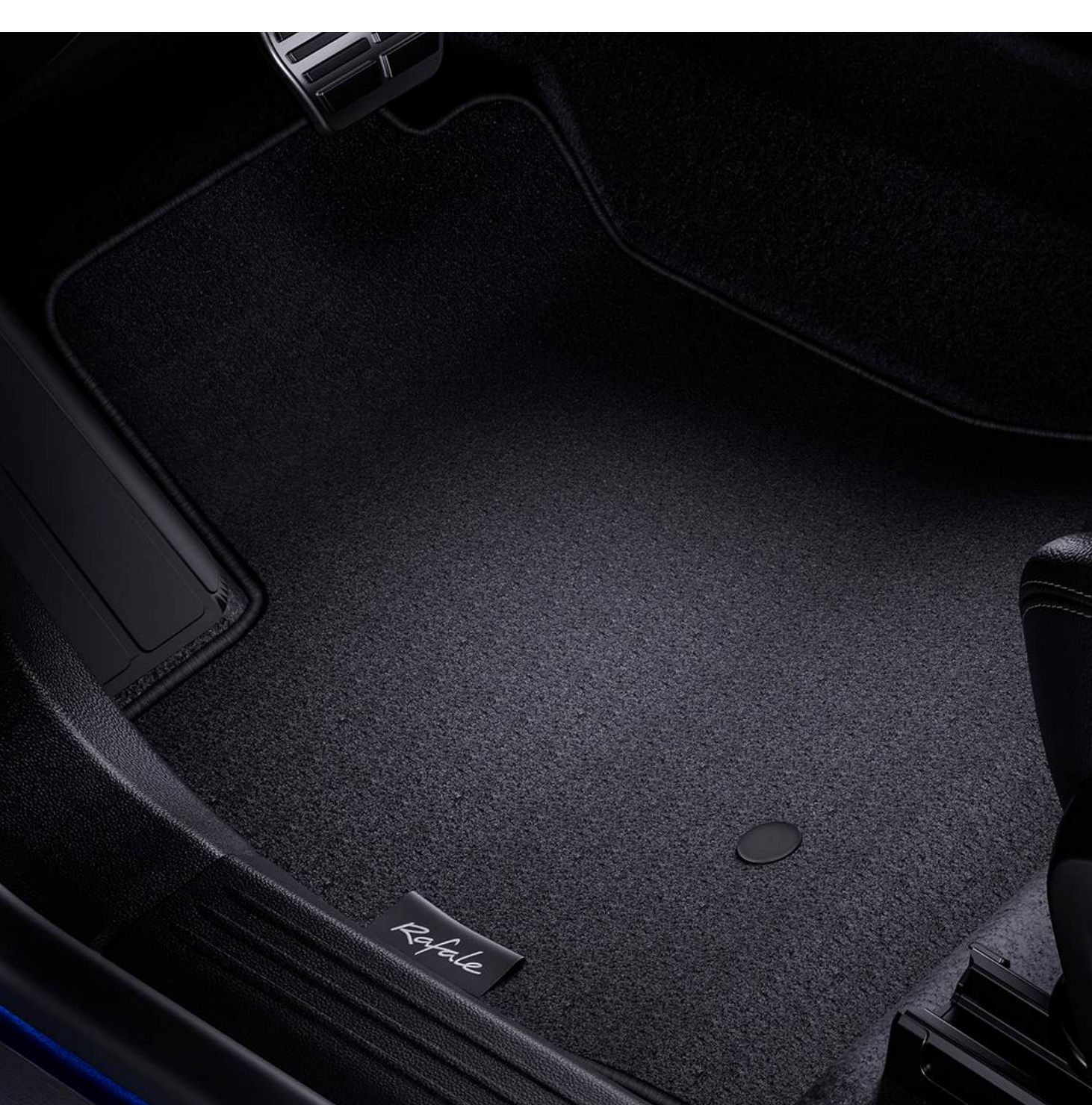
covoraș confort din material textil

Impermeabile și ușor de întreținut, covorașele din cauciuc din față și din spate protejează podeaua de umezeală și murdărie. Pentru o protecție cu stil, alege covorașele din material textil.