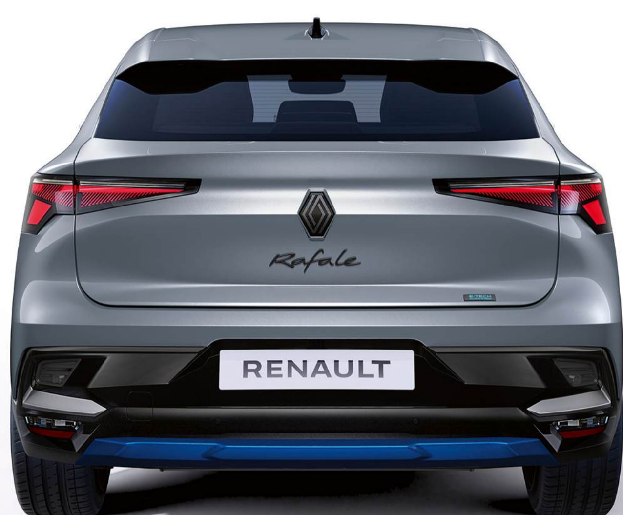
pachet de personalizare albastru summit, vedere din față și din spate