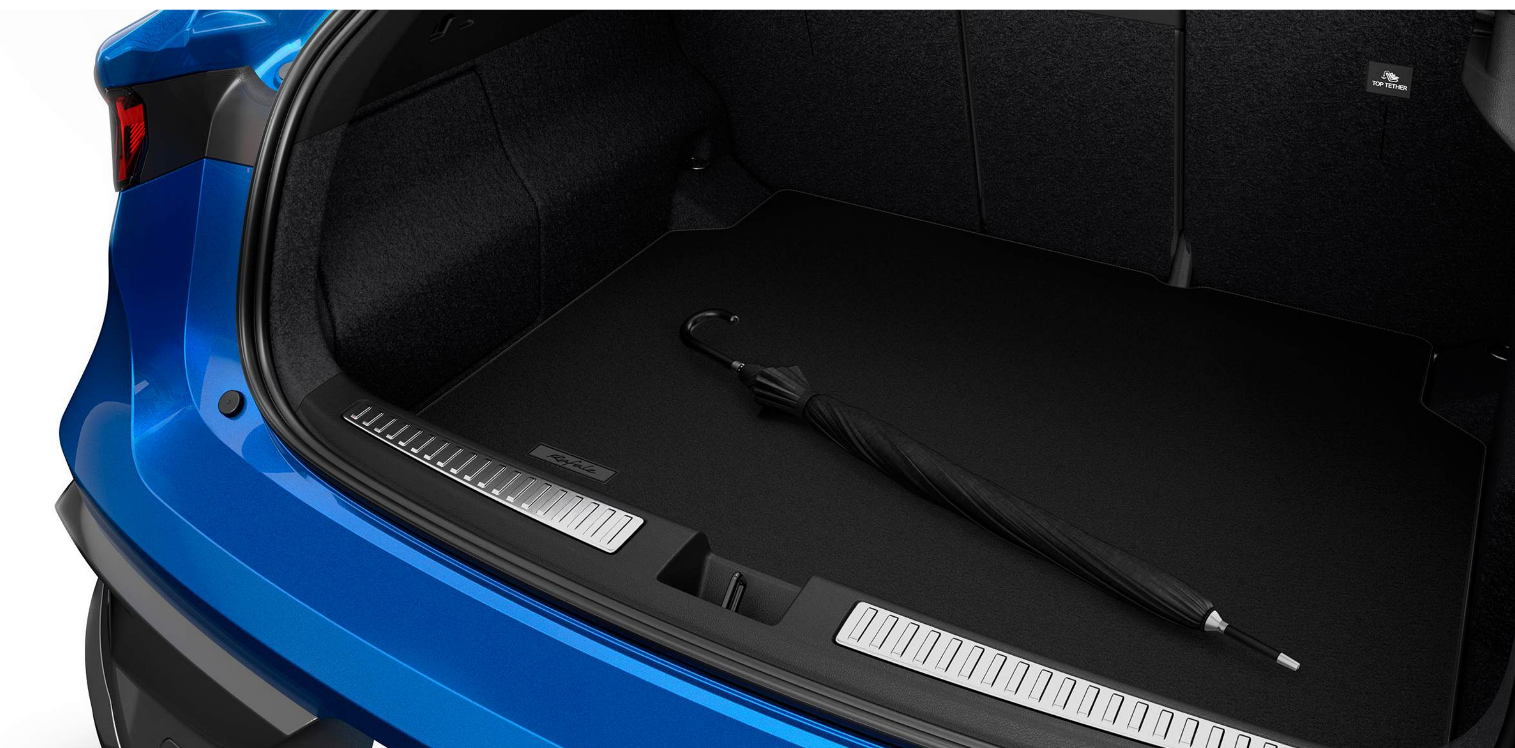
covoraș premium pentru portbagaj

Covorașul premium din material textil pentru portbagaj împodobește și protejează cu eleganță mocheta portbagajului. Este personalizat cu sigla Rafale.