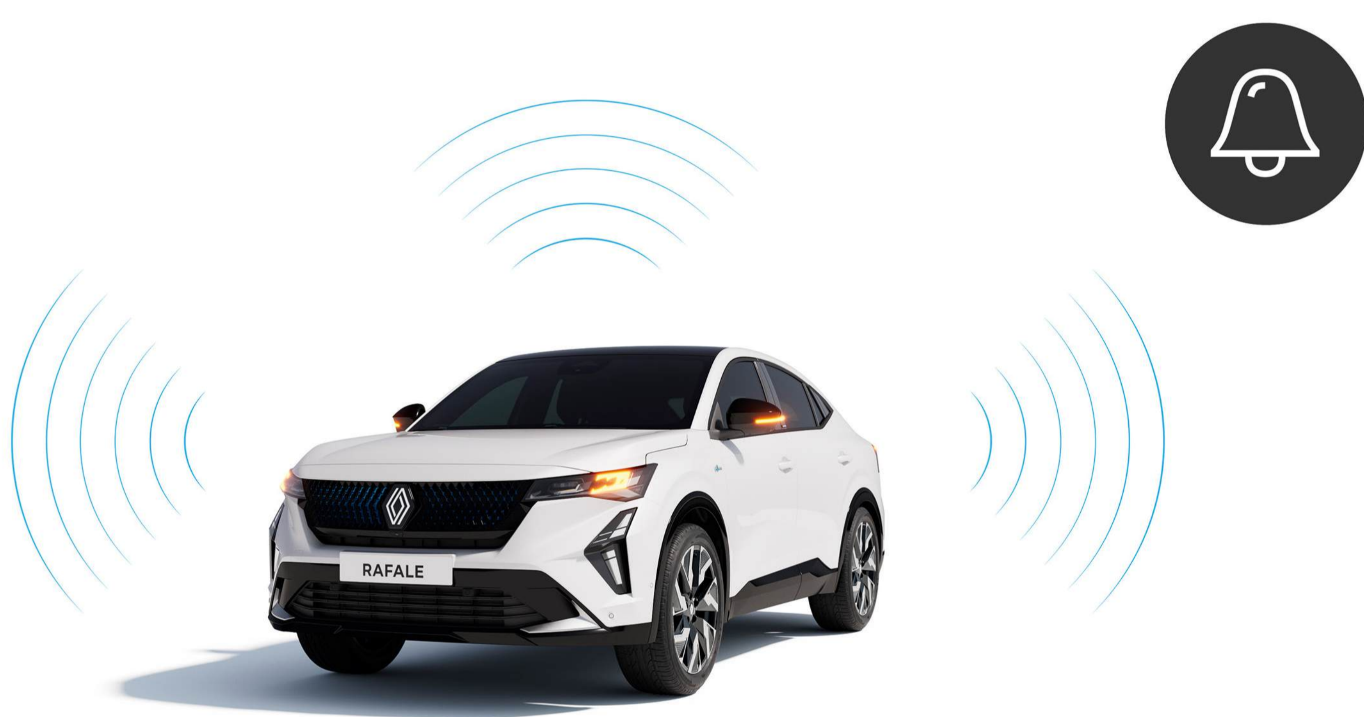
alarmă perimetrală și volumetrică

Sporește siguranța cu un extingtor în postul de conducere pe care îl poți accesa și folosi rapid dacă este necesar.