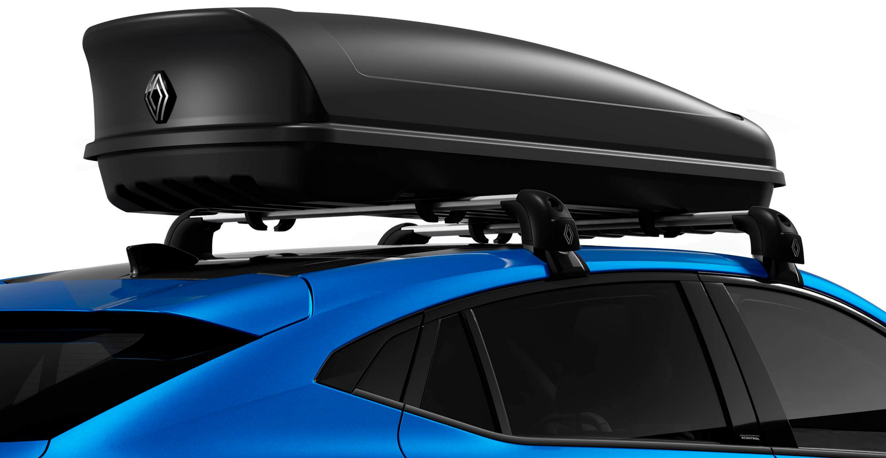
portbagaj de acoperiș Renault de 480 L montat pe barele de pavilion

Portbagajele de acoperiș din gama Renault au o capacitate de transport de până la 630 L. Rigide și cu posibilitate de încuiere, acestea mențin atmosfera premium la bordul vehiculului permițând transportul unor bagaje suplimentare.