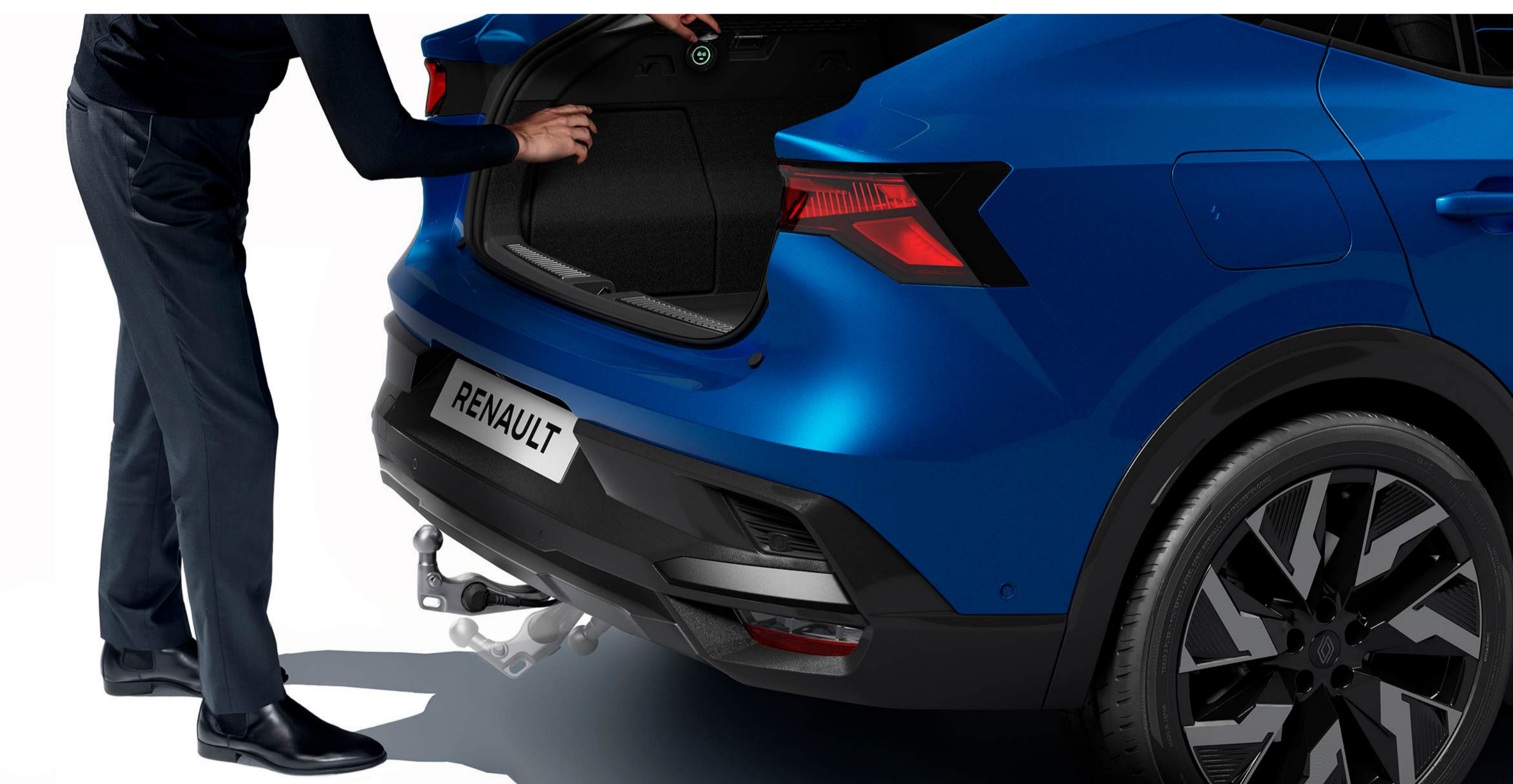
cârlig de remorcare retractabil electric

Cârligul de remorcare retractabil electric păstrează neschimbat designul vehiculului; articulația sferică se retractează în câteva secunde prin simpla apăsare a unui buton situat în portbagaj.