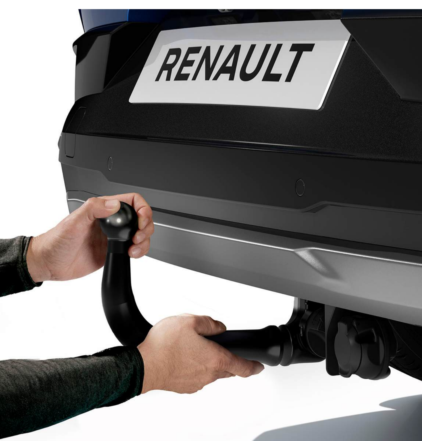
cârlig de remorcare detașabil fără unelte

Pentru utilizare ocazională, folosește cârligul de remorcare cu articulație sferică demontabil fără unelte. Pentru utilizare frecventă, alege cârligul de remorcare gât-de-lebădă simplu și eficient.