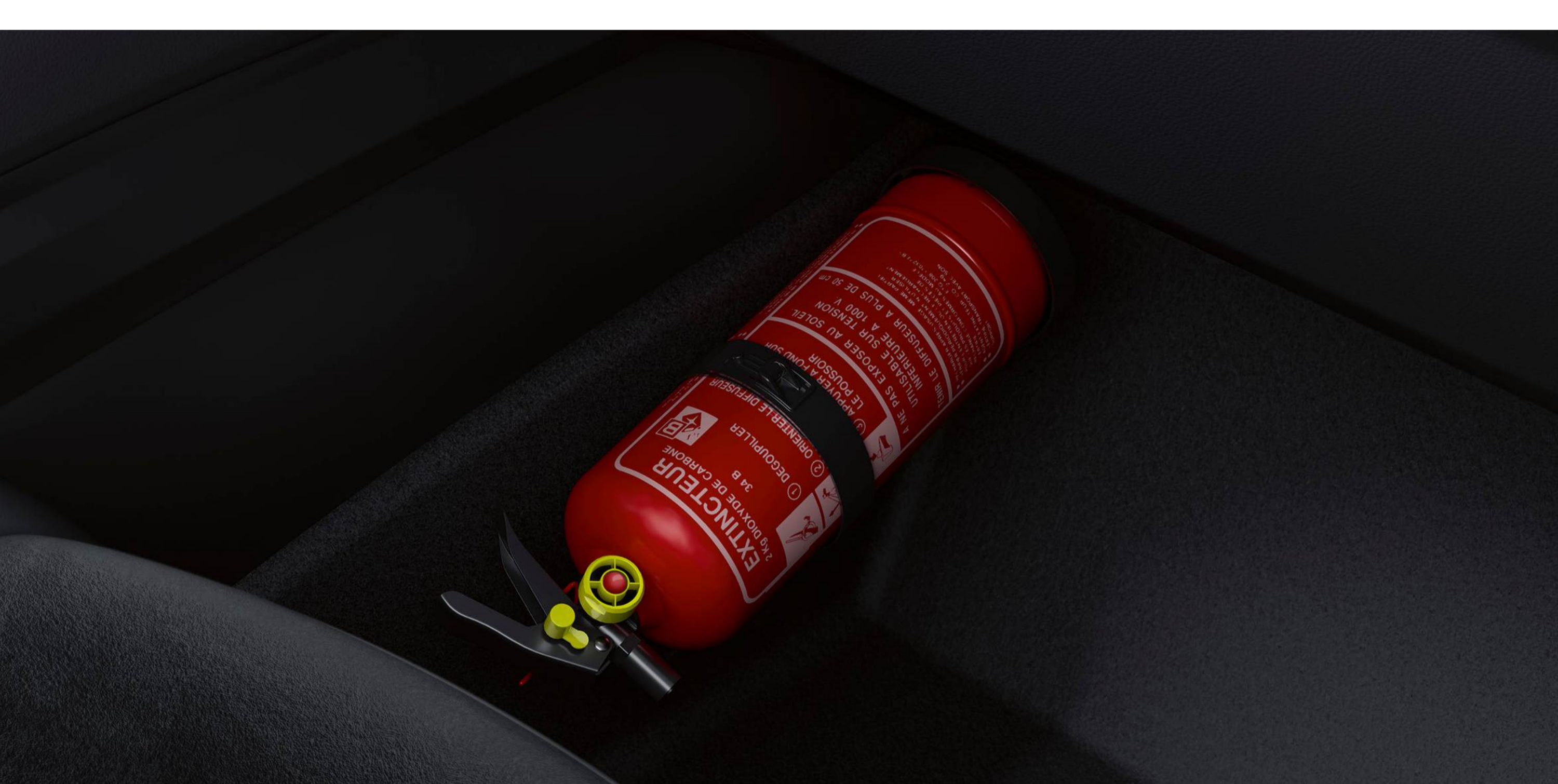
extingtor de 1 kg cu manometru

Echipează vehiculul Renault Rafale cu lanțuri antiderapante adaptate; foarte ușor de montat, acestea asigură o aderență optimă pe suprafețe dificile.