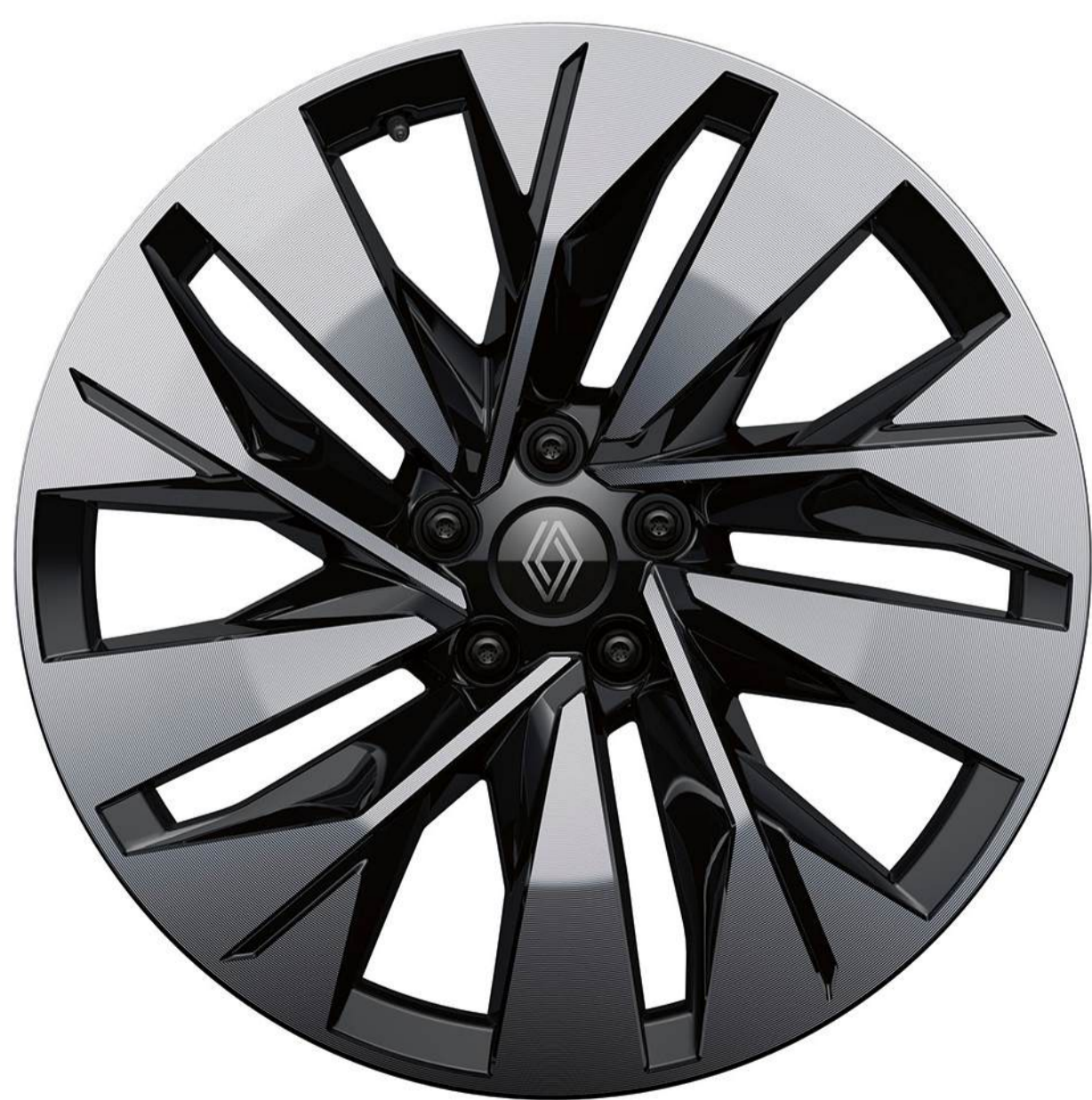
jante din aliaj sonic de 20" diamond-cut negre