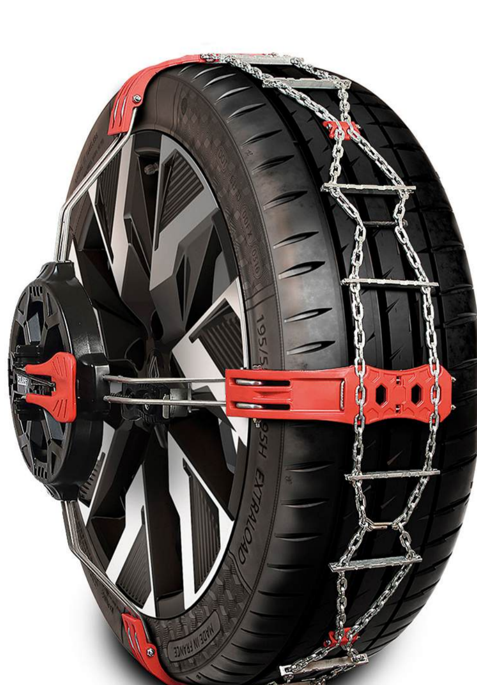
lanțuri antiderapante din oțel