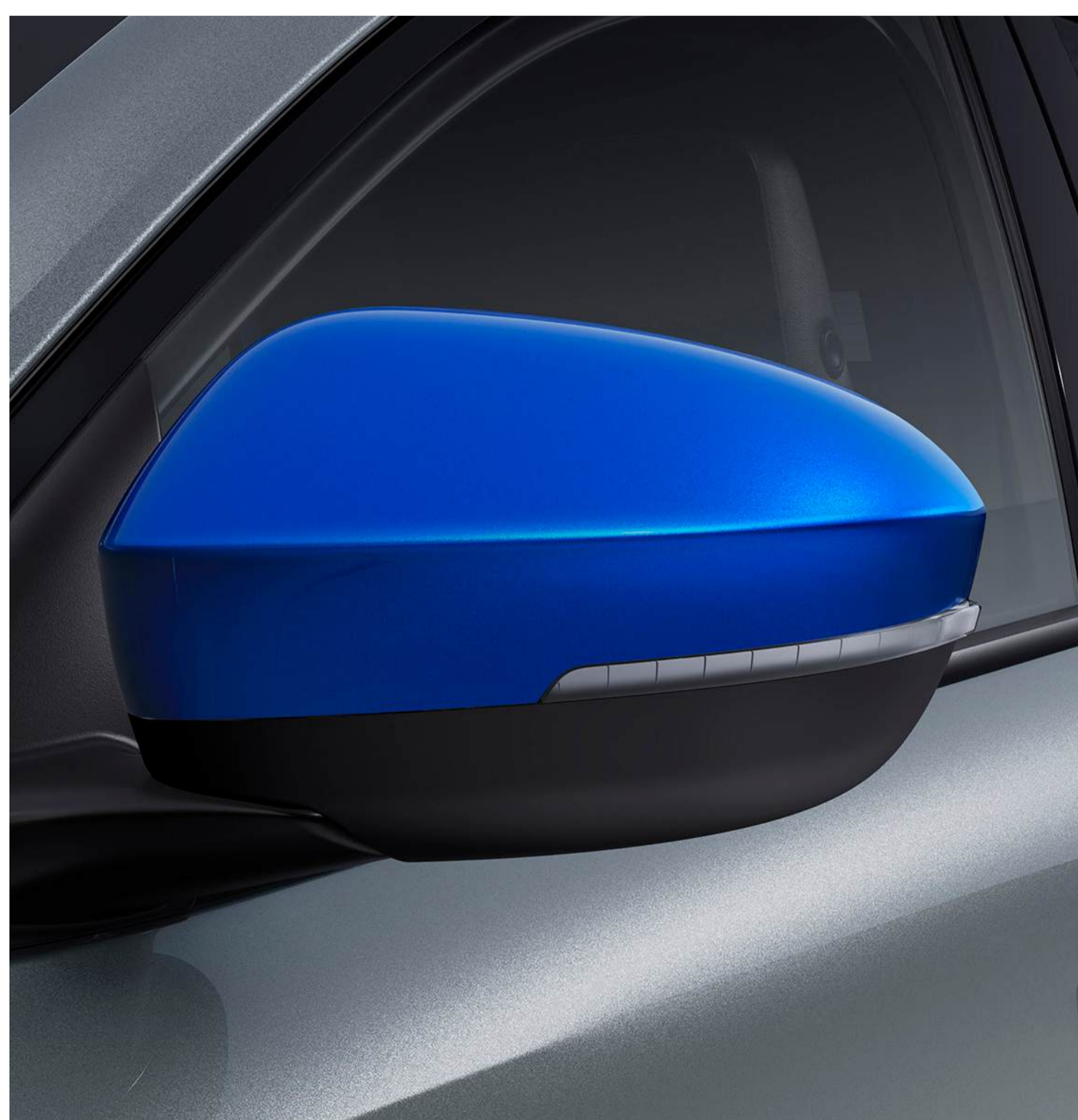
capace oglinzi exterioare albastru summit