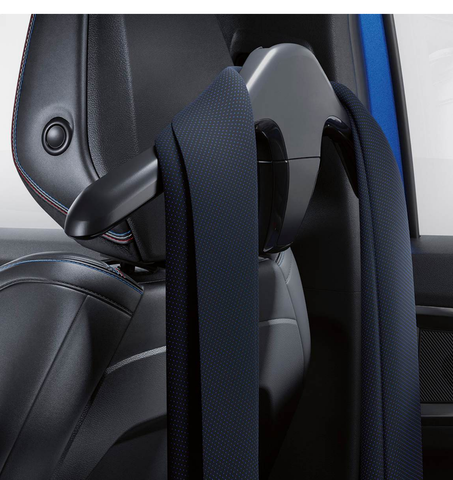
umerăș pe sistemul multifuncțional

Atașează cu ușurință un umerăș pe una dintre tetiere pentru a-ți păstra jacheta sau haina fără cute în timpul deplasării. Este practic și poate fi înlocuit ușor cu un cârlig de depozitare sau un raft suplimentar.