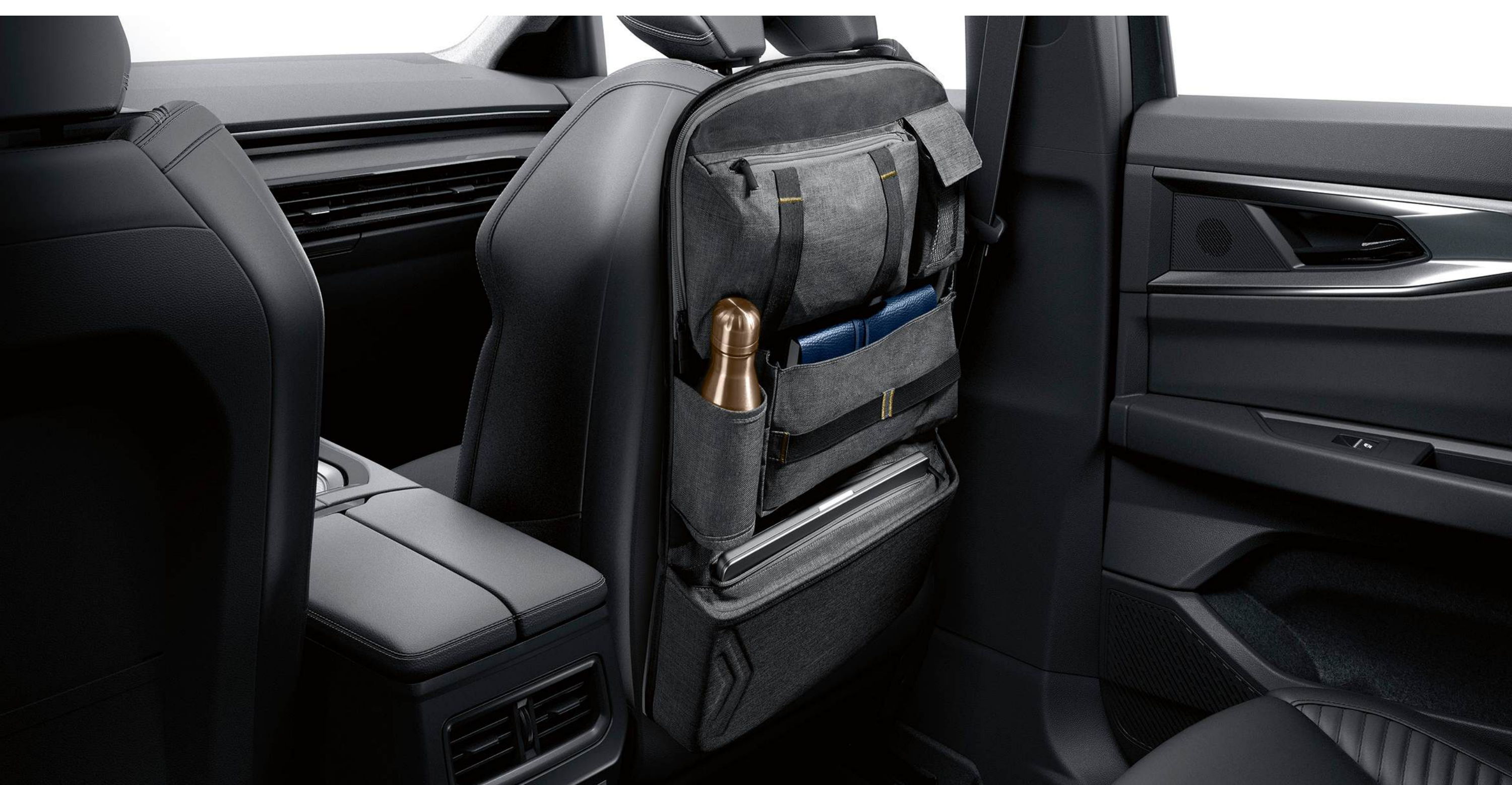
organizator multifuncțional pe spătarul scaunului din față

Atașat de spătarul scaunului din față, organizatorul multifuncțional dispune de cinci compartimente pentru depozitarea obiectelor uzuale și include un spațiu dedicat pentru o tabletă. Având culoarea gri „mottled”, organizatorul este decorat cu cusături aurii și sigla Renault.