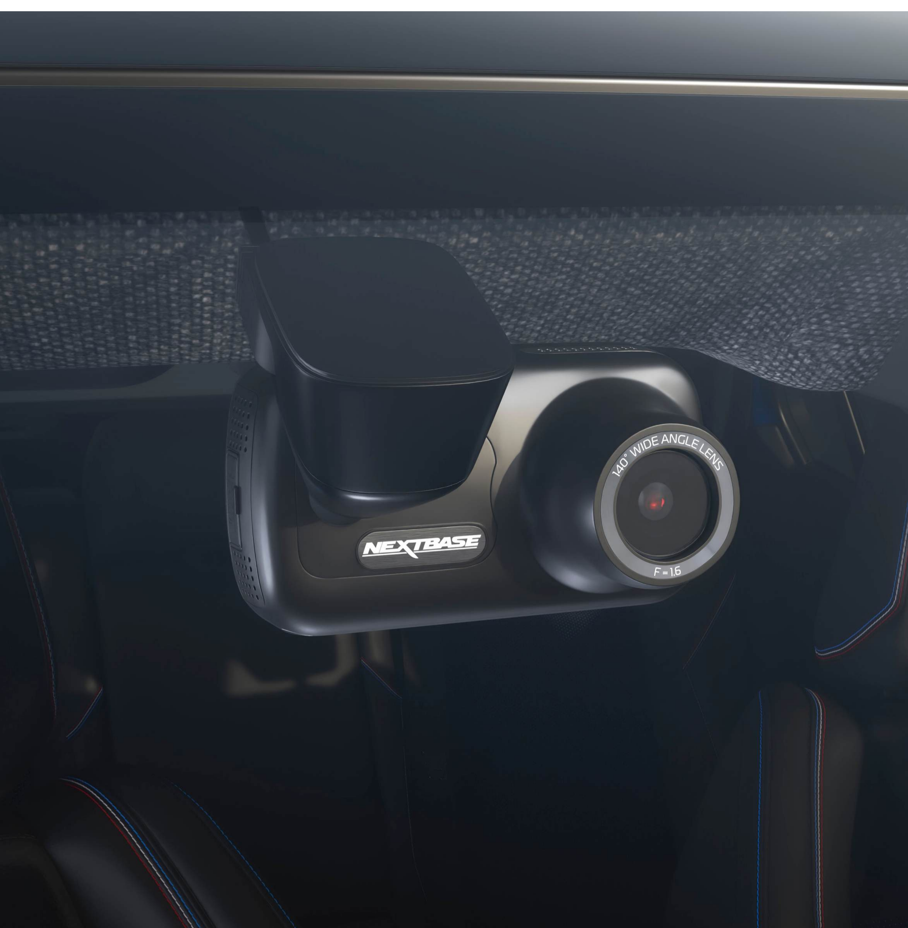
cameră de bord

Discretă și perfect integrată în habitacul, camera de bord înregistrează toate călătoriile, furnizând astfel probe incontestabile în caz de nevoie.