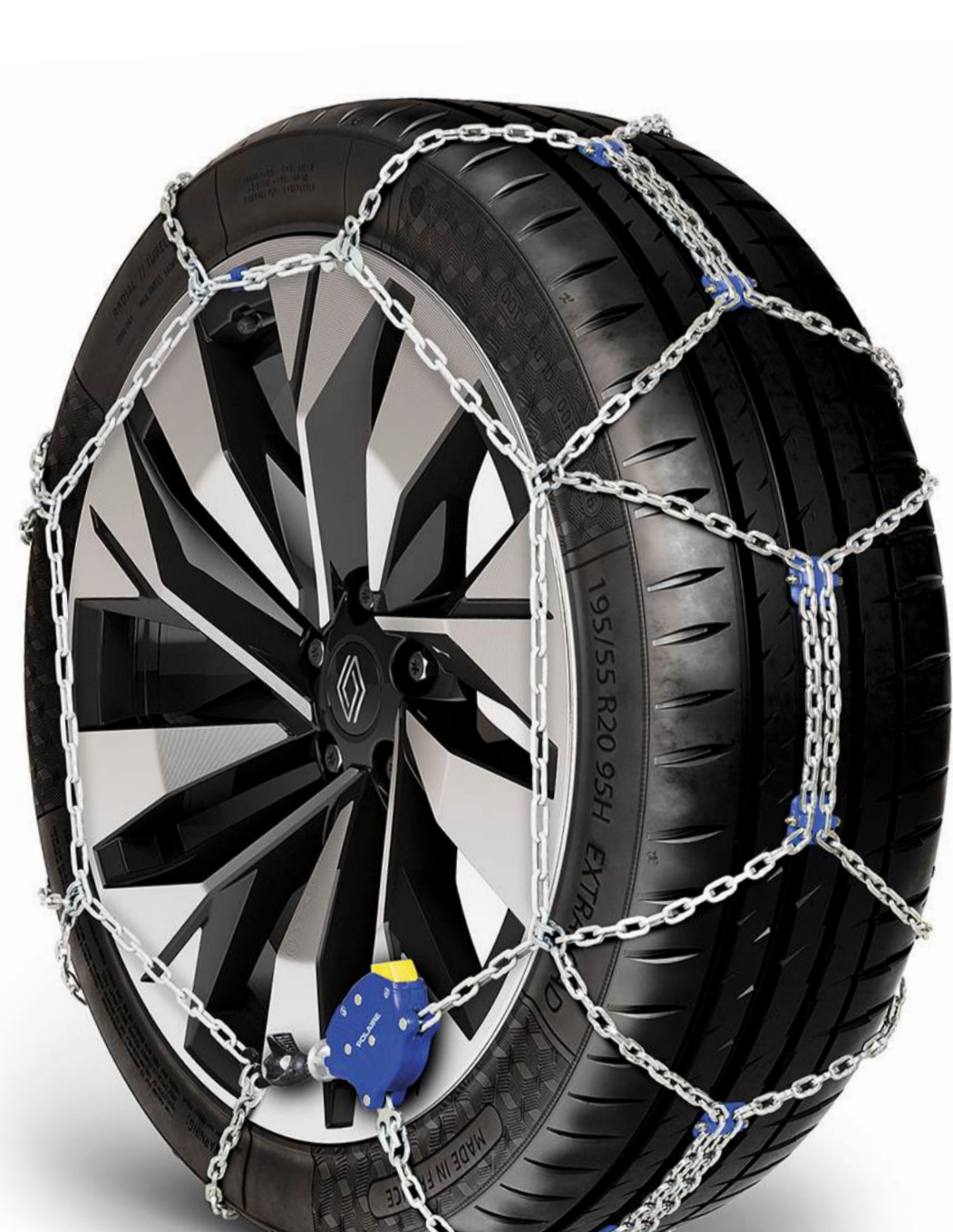
lanțuri antiderapante standard

Echipează vehiculul Renault Rafale cu lanțuri antiderapante adaptate; foarte ușor de montat, acestea asigură o aderență optimă pe suprafețe dificile.