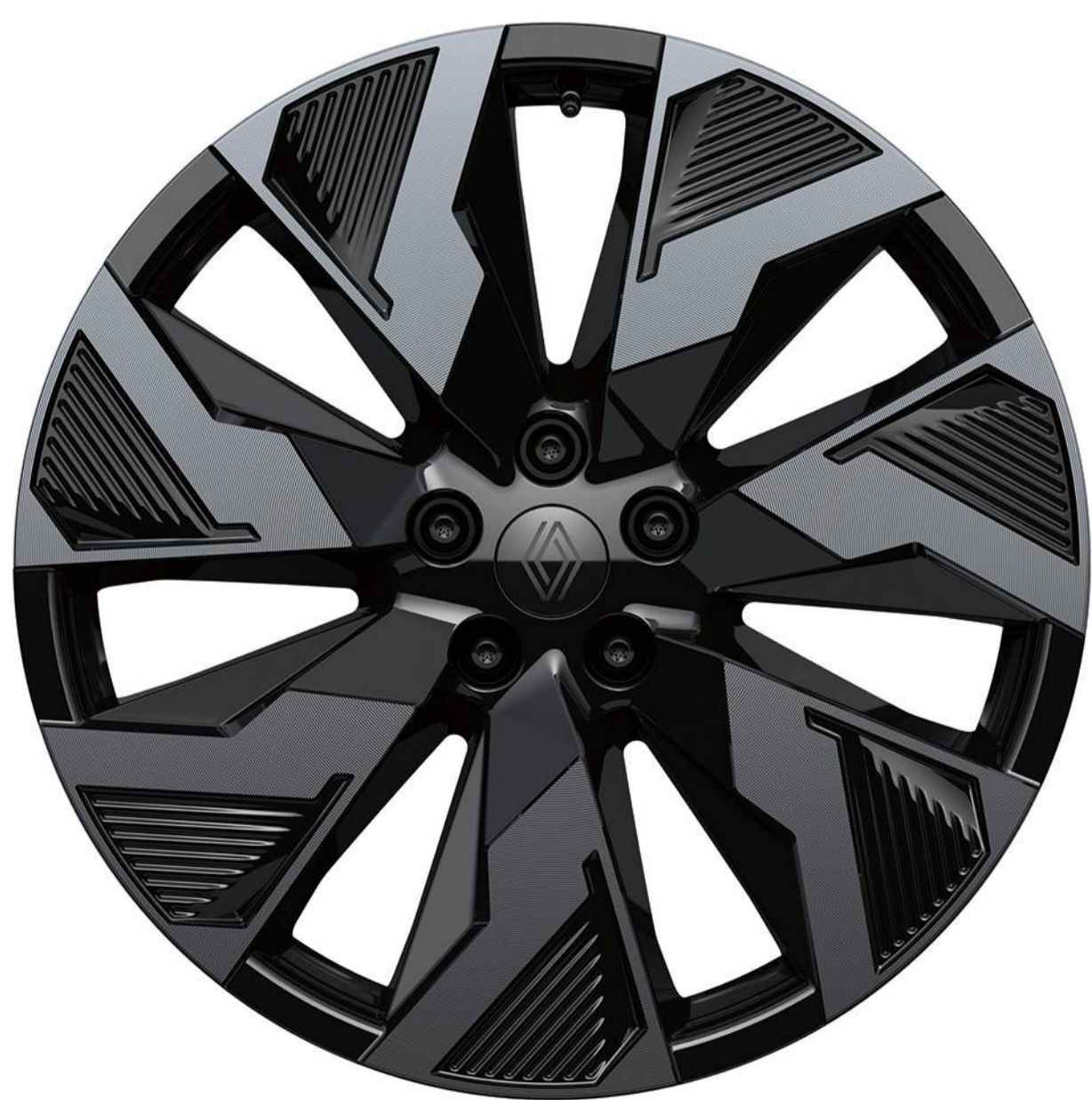
jante din aliaj castellet de 20" diamond-cut negre cu lac gri fumuriu

Prezoanele antifurt din oțel asigură o protecție sporită a jantelor.