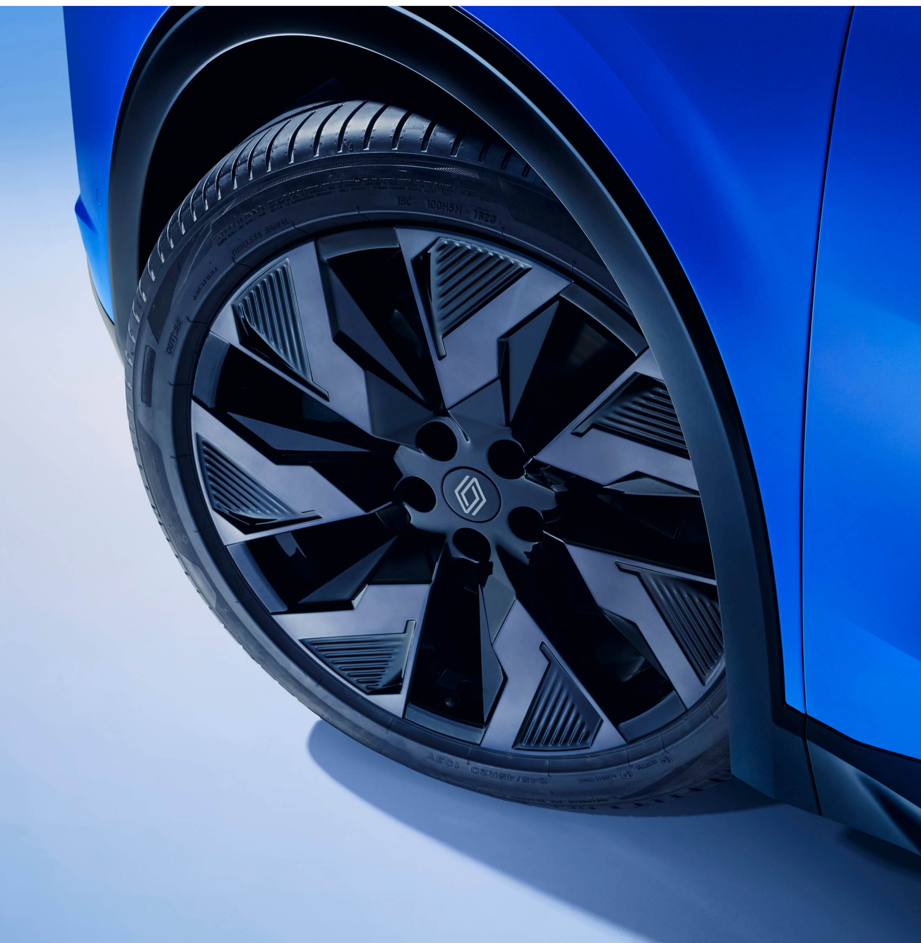
jante din aliaj sonic de 20" diamond-cut negre și sistem antifurt

Pentru un aspect mai personalizat, alege din gama de jante din aliaj elegante: sonic de 20" sau castellet de 20".