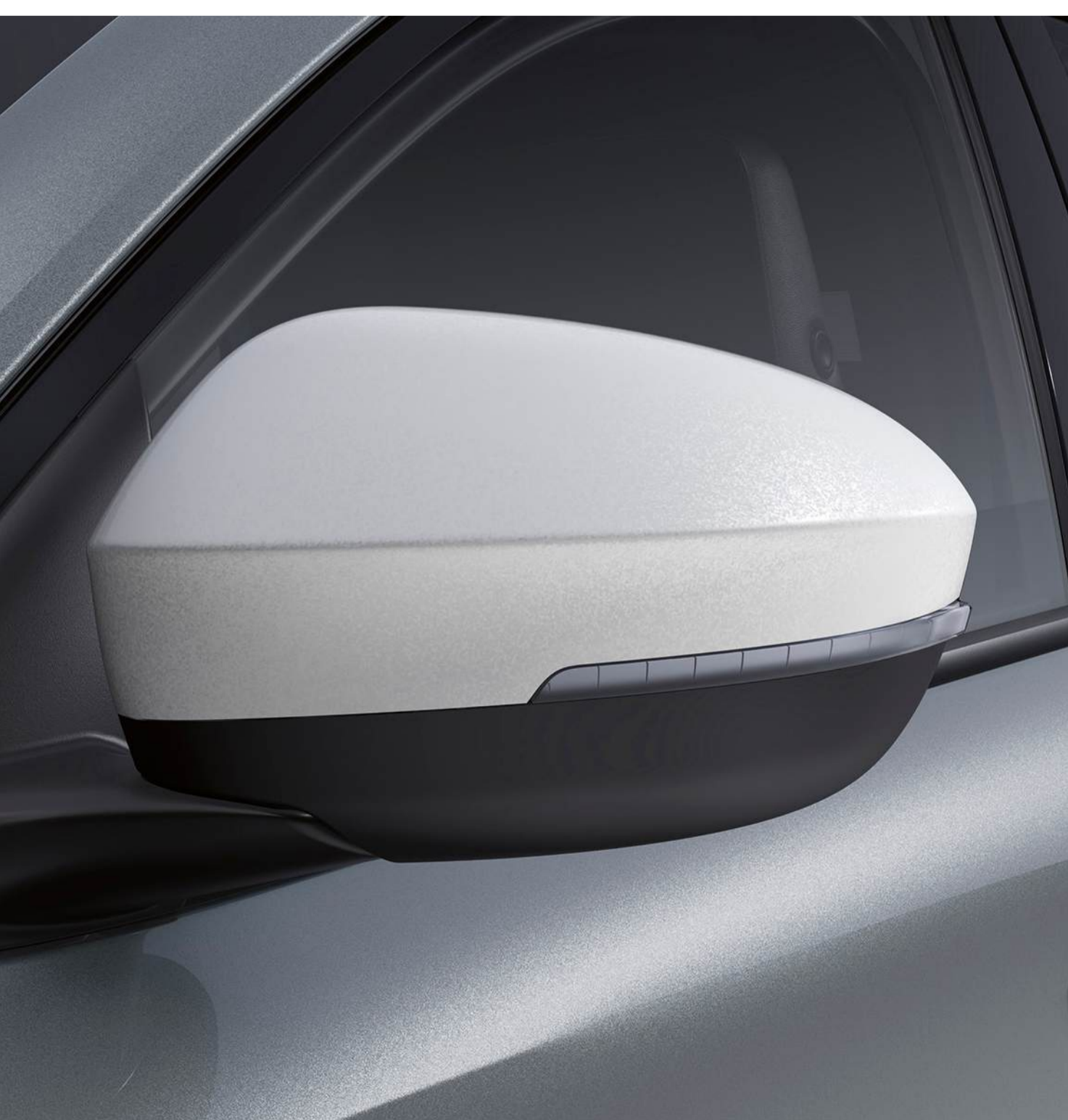
capace oglinzi exterioare cu finisaj alb pearl satinat

Cu finisaj alb sau albastru, capacele oglinzilor exterioare adaugă o notă de rafinament.