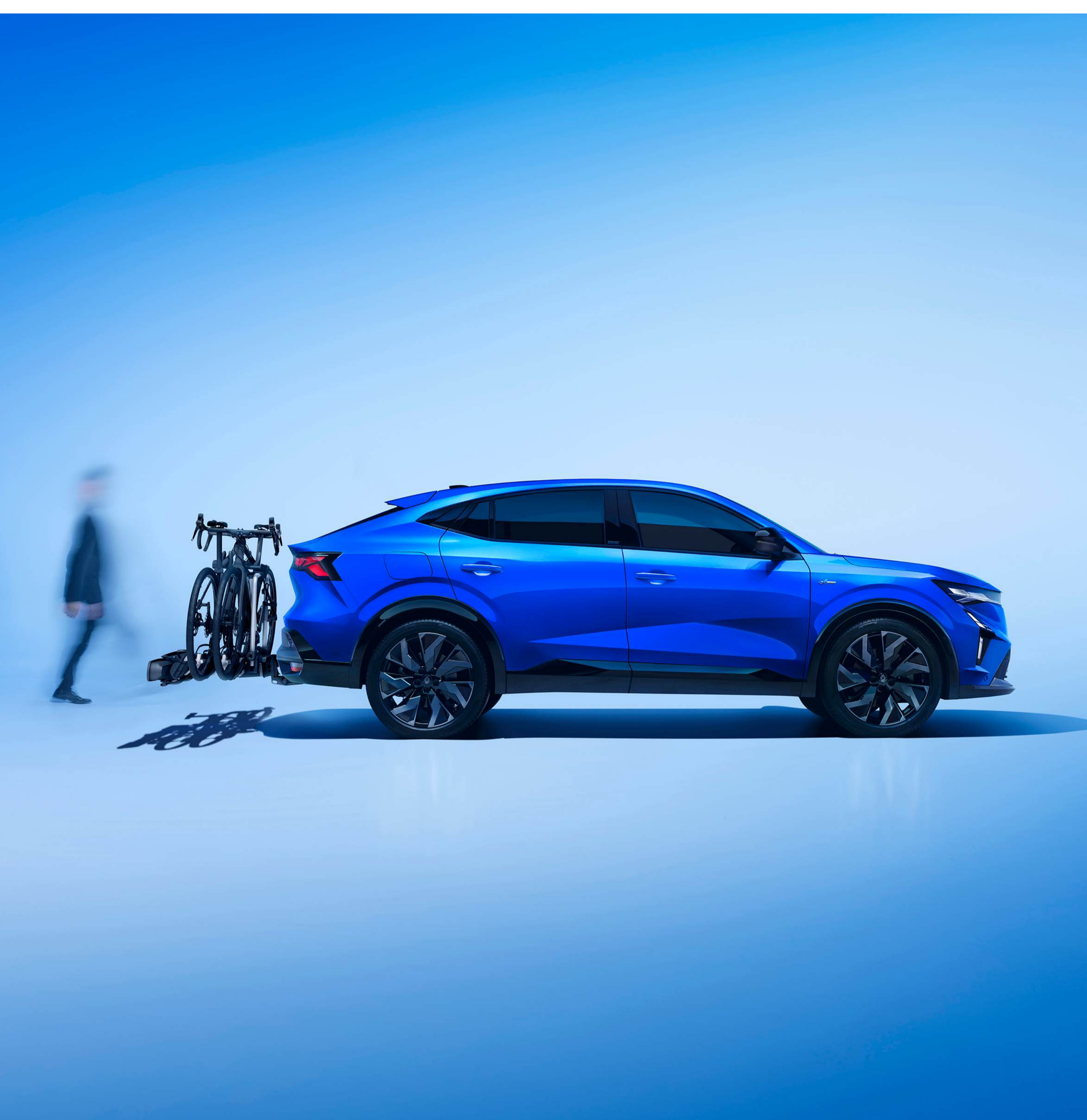
cârlig de remorcare retractabil electric pe care este montat un suport pentru 3 biciclete

Profită de gama de cârlige de remorcare special dezvoltate pentru Renault Rafale.