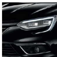
Noir Etoilé (GNE)