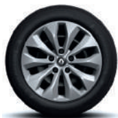
Jante oțel 16", design Florida