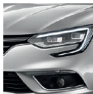
Gris Platine (D69)