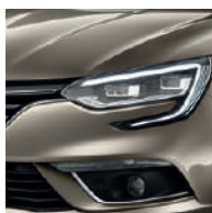
Beige Dune (HNP) Indisponibilă pentru pachetul GT Line