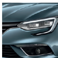
Bleu Berlin (RQE)