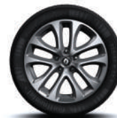
Jante aliaj 17" specific GT, design Decaro