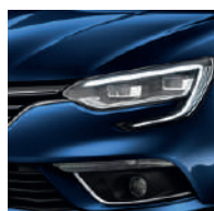
Bleu Cosmos (RPR) Indisponibilă pentru pachetul GT Line