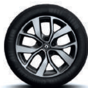
Jante aliaj 17", design Celsius