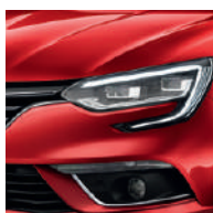
Rouge Flamme (NNP)