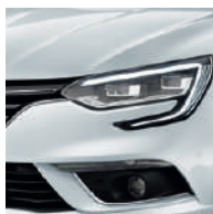
Blanc Glacier (369 - opacă)