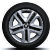
Jante oțel 16" Flexwheel, design Complea