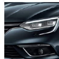
Gris Titanium (KPN)