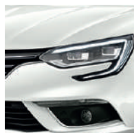
Blanc Nacré (QNC)