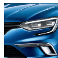
Bleu Iron (RQH) Disponibil doar în combinație cu pachetul GT LINE