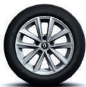
Jante aliaj 16", design Silverline