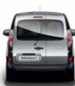
OSTAKLJENA ASIMETRIČNA ZADNJA VRATA SA GREJANIM STAKLOM I BRISAČEM STAKLA

*Kangoo Z.E. je dostupan samo u verziji sa jednim bočnim kliznim vratima.