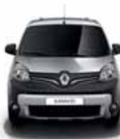
PREDNJI ODBOJNIK STYLE: DVOBOJNI ODBOJNIK MAT CRNE BOJE I U MAT HROMU, DODATNA SVETLA I CRNA KUĆIŠTA SVETALA