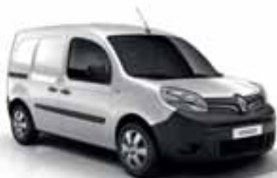
MINERALNO BELA (JB QNG)

ČAK SU I BOJE KANGOO EXPRESS-A PRILAGOĐENE VAŠIM POTREBAMA. OSIM SERIJSKIH BOJA PRIKAZANIH U NASTAVKU, MOŽEMO ISPUNITI I VAŠE POSEBNE ZAHTEVE U POGLEDU BOJA.