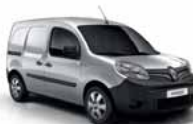
SIVA HIGHLAND (KQA)