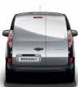
NEOSTAKLJENA ASIMETRIČNA ZADNJA VRATA