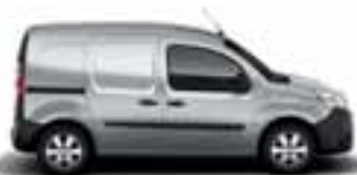
KANGOO EXPRESS & KANGOO Z.E.