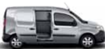
1 ILI 2 NEOSTAKLJENA BOČNA KLIZNA VRATA