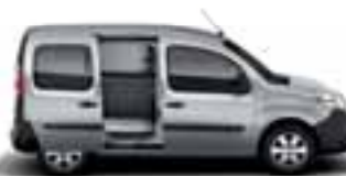
1 ILI 2 OSTAKLJENA BOČNA KLIZNA VRATA*