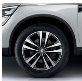
Platišča iz lahke litine 46 cm (18") Argonaute