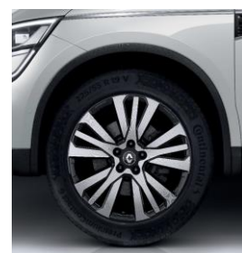
Platišča iz lahke litine 48 cm (19") Initiale Paris