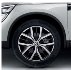
Platišča iz lahke litine 48 cm (19") Proteus