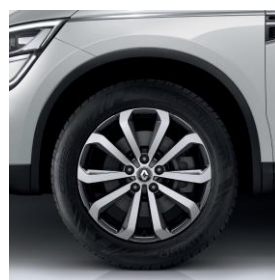
Platišča iz lahke litine 46 cm (18") Taranis