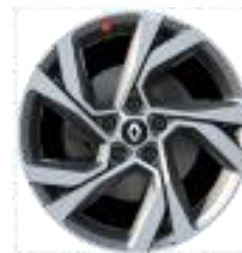
Platišča iz lahke litine 18" Magny Cours