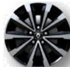
Platišča iz lahke litine 17" Monthlery