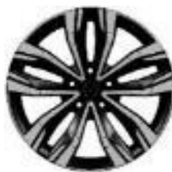
Platišča iz lahke litine 18" Hightek