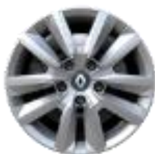
Okrasni pokrovi Flexwheel 16"

S = Serija O = Opcija - = Ni na voljo P = Paket