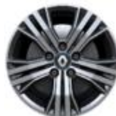
Platišča iz lahke litine 16" Siva Impulse