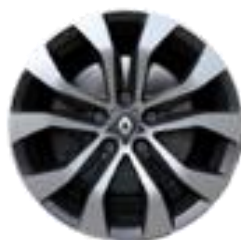
Platišča iz lahke litine 17" Allium