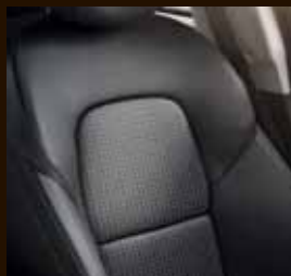
Oblazinjenje v tkanini - Titanium črna