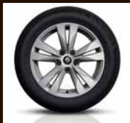
Platišča iz lahke litine 43 cm (17") Bayadere