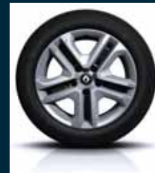
Jeklena platišča 41 cm (16") Flexwheel z okrasnimi pokrovi Complea