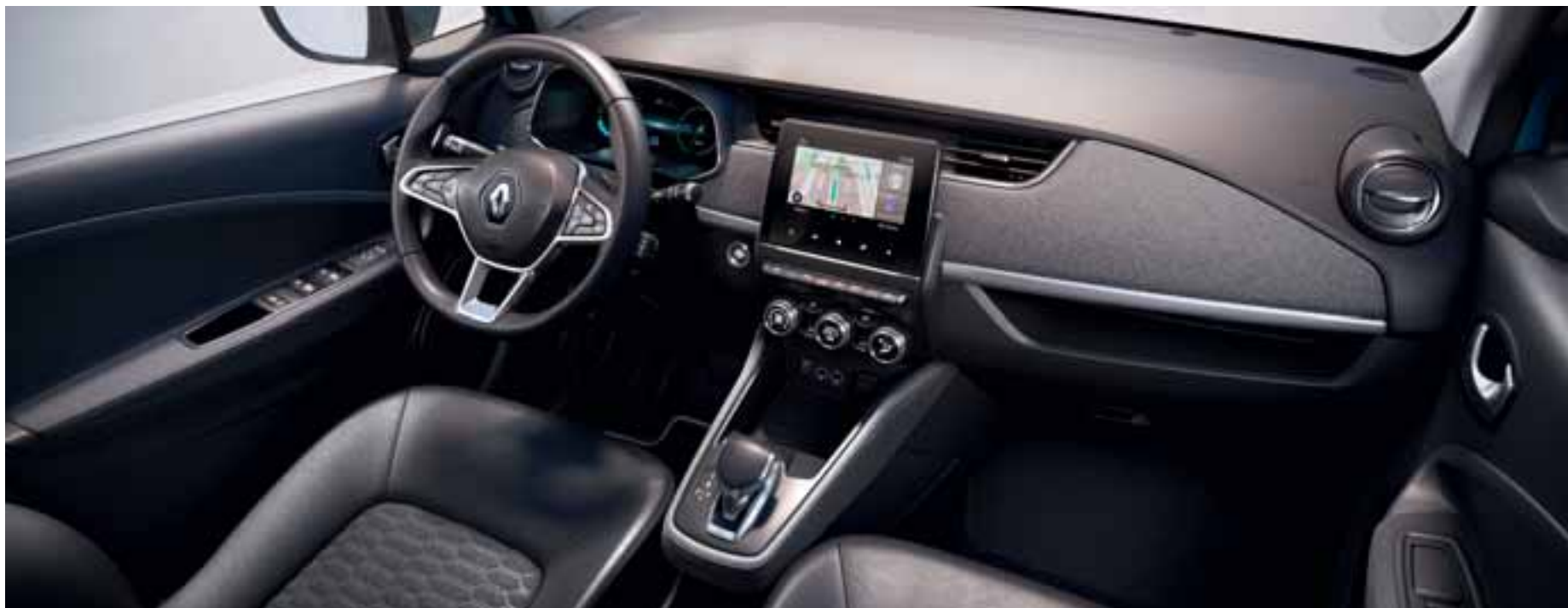
Slika je simbolna.