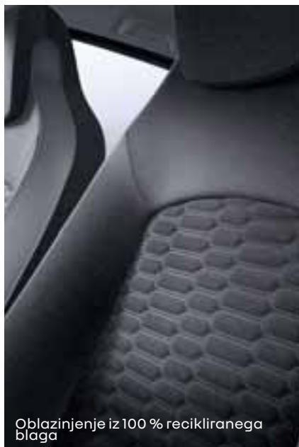
Oblazinjenje iz 100 % recikliranega blaga