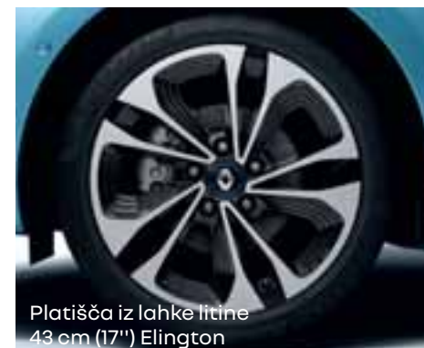
Platišča iz lahke litine 43 cm (17") Elington