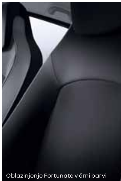
Oblazinjenje Fortunate v črni barvi