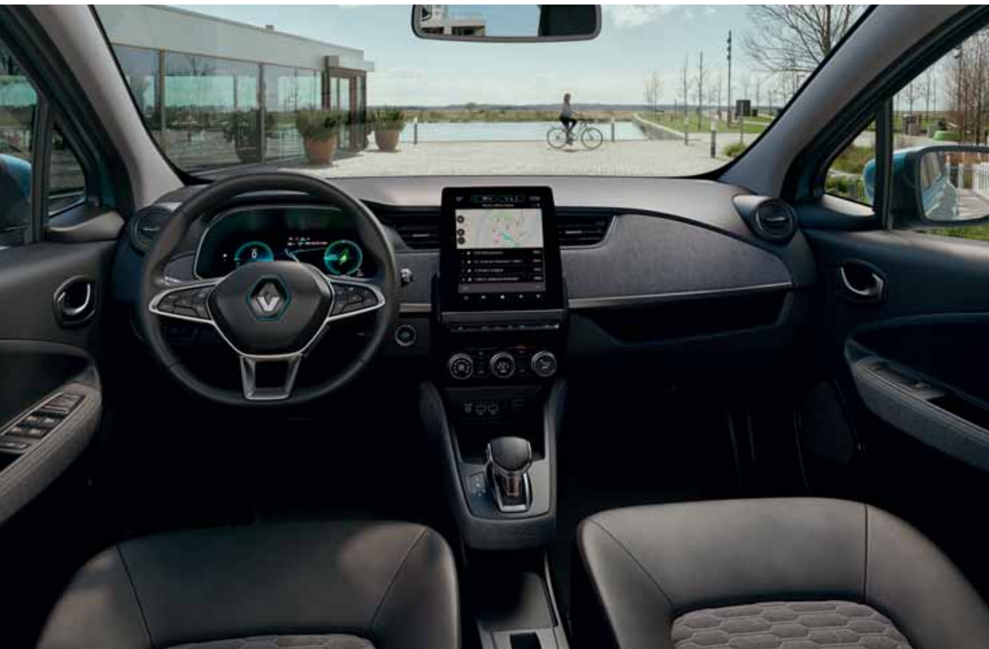
Multimedijjski sistem EASY LINK s 24-centimetrskim (9,3") zaslonom je na voljo z doplačilom kot opcija na verziji Intens.