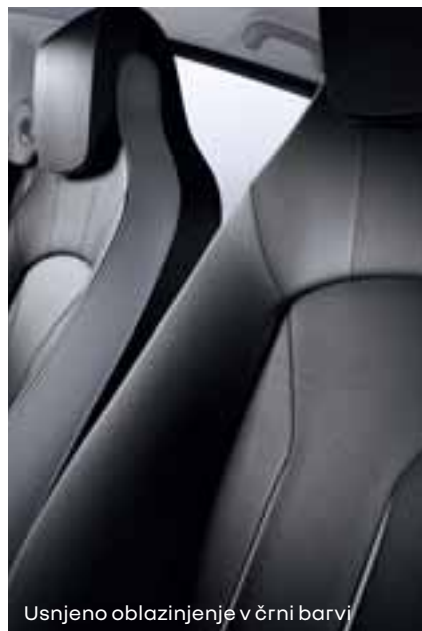
Usnjeno oblazinjenje v črni barvi