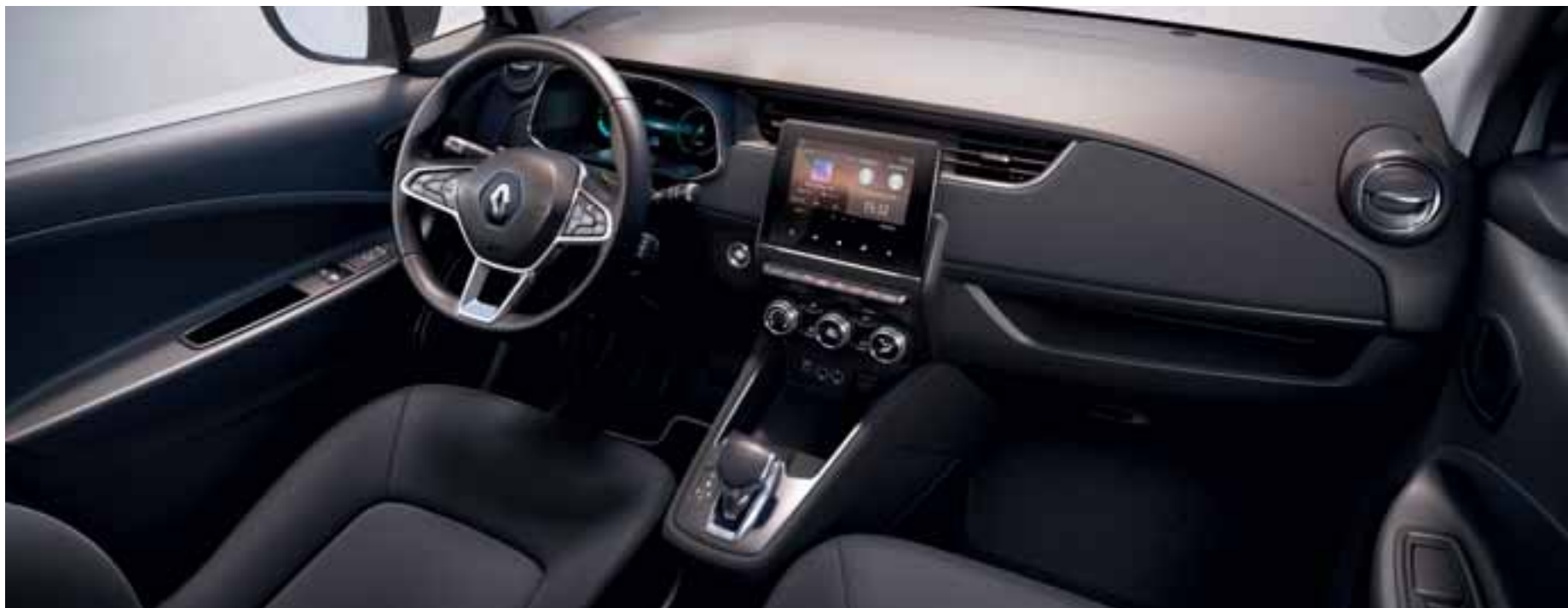
Slika je simbolna. 18-centimetrski (7") zaslon je na voljo z doplačilom.