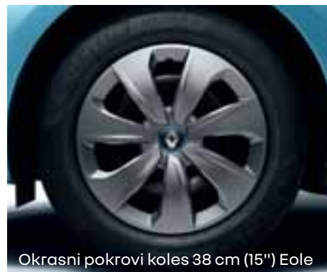
Okrasni pokrovi koles 38 cm (15") Eole