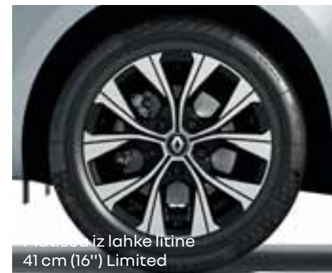
Platišča iz lahke litine 41 cm (16") Limited