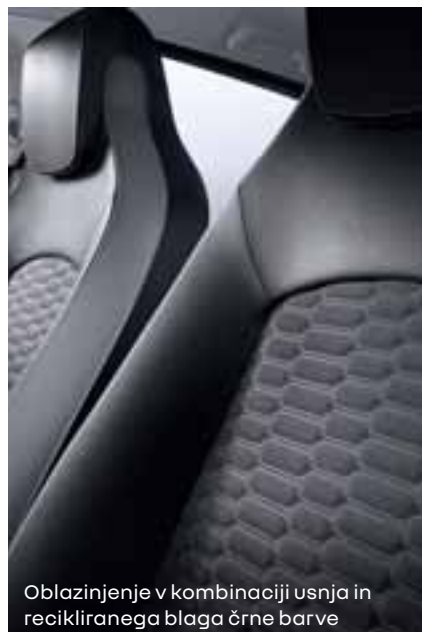
Oblazinjenje v kombinaciji usnja in recikliranega blaga črne barve