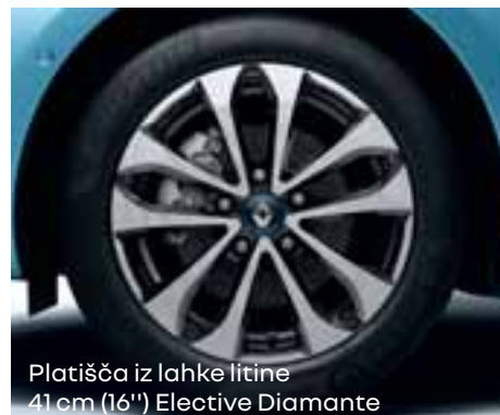
Platišča iz lahke litine 41 cm (16") Elective Diamante