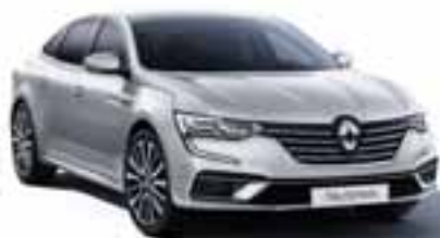
Siva Highland (KQA)*