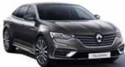
Siva Cassiopee (KNG)*