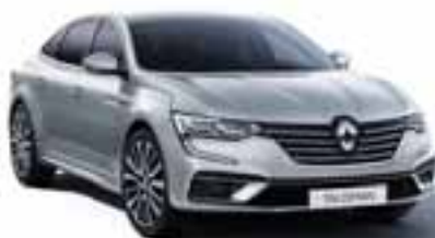
Siva Baltique (KQD)*