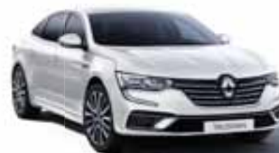
Biserno bela (QNC)*