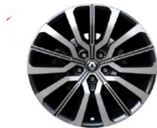
Platišča iz lahke litine 48cm (19") Sato