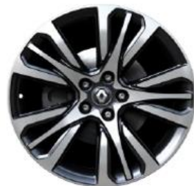
Platišča iz lahke litine 48cm (19") Initiale Paris