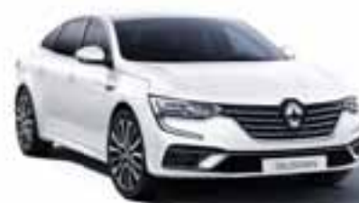
Ledeniško Bela (369)