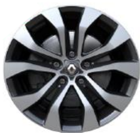
Platišča iz lahke litine 43cm (17") Pierre

S = Serija O = Opcija - = Ni na voljo P = Na voljo v paketu