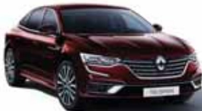
Rdeča Millesime (NPN)*