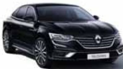
Črna Etolie (GNE)*