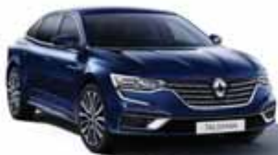
Modra Cosmos (RPR)*