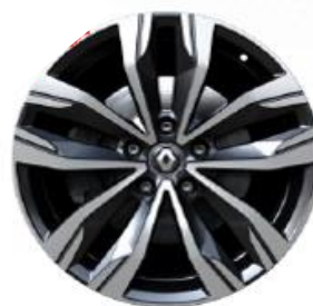
Platišča iz lahke litine 46cm (18") Stellar