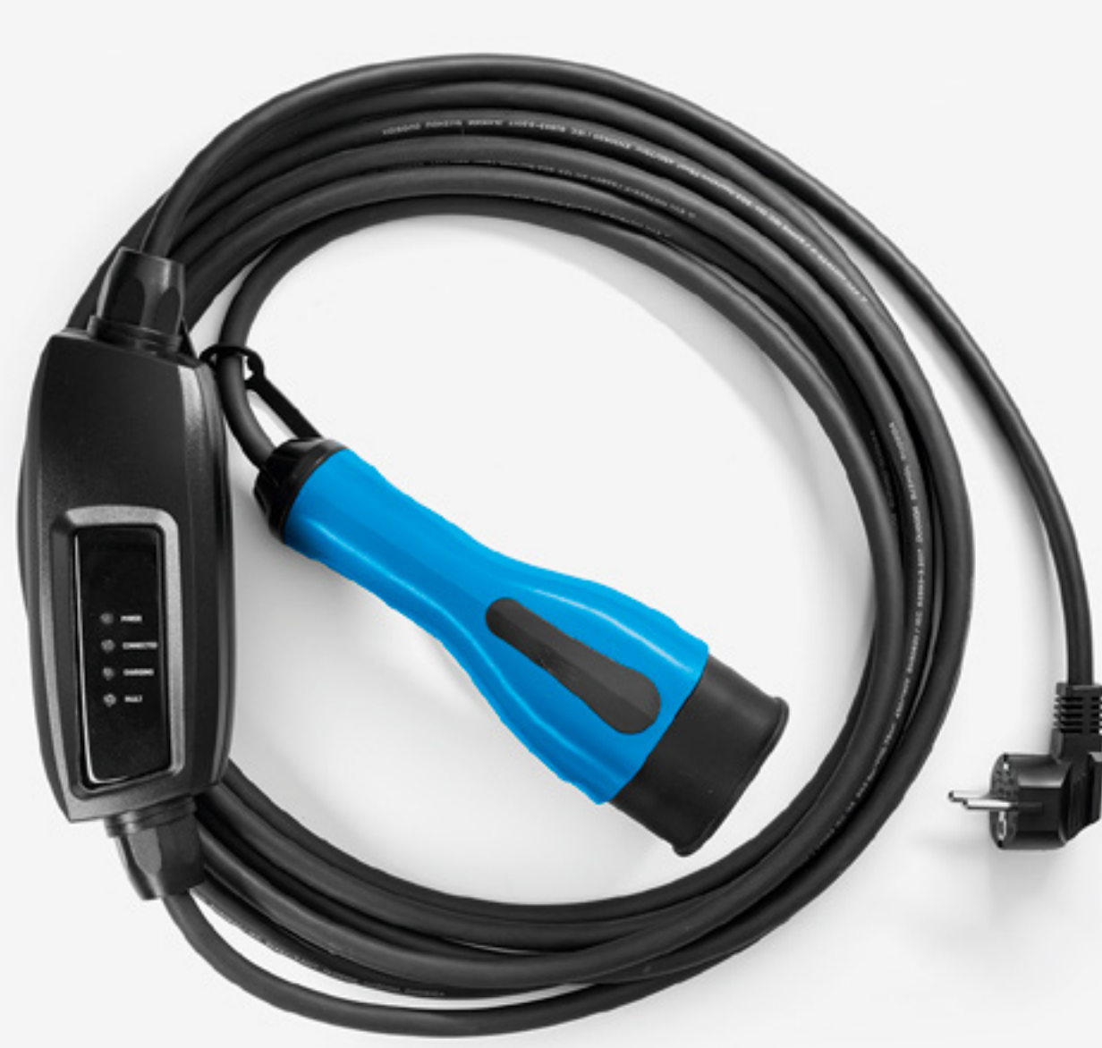
kábel na domáce nabíjanie