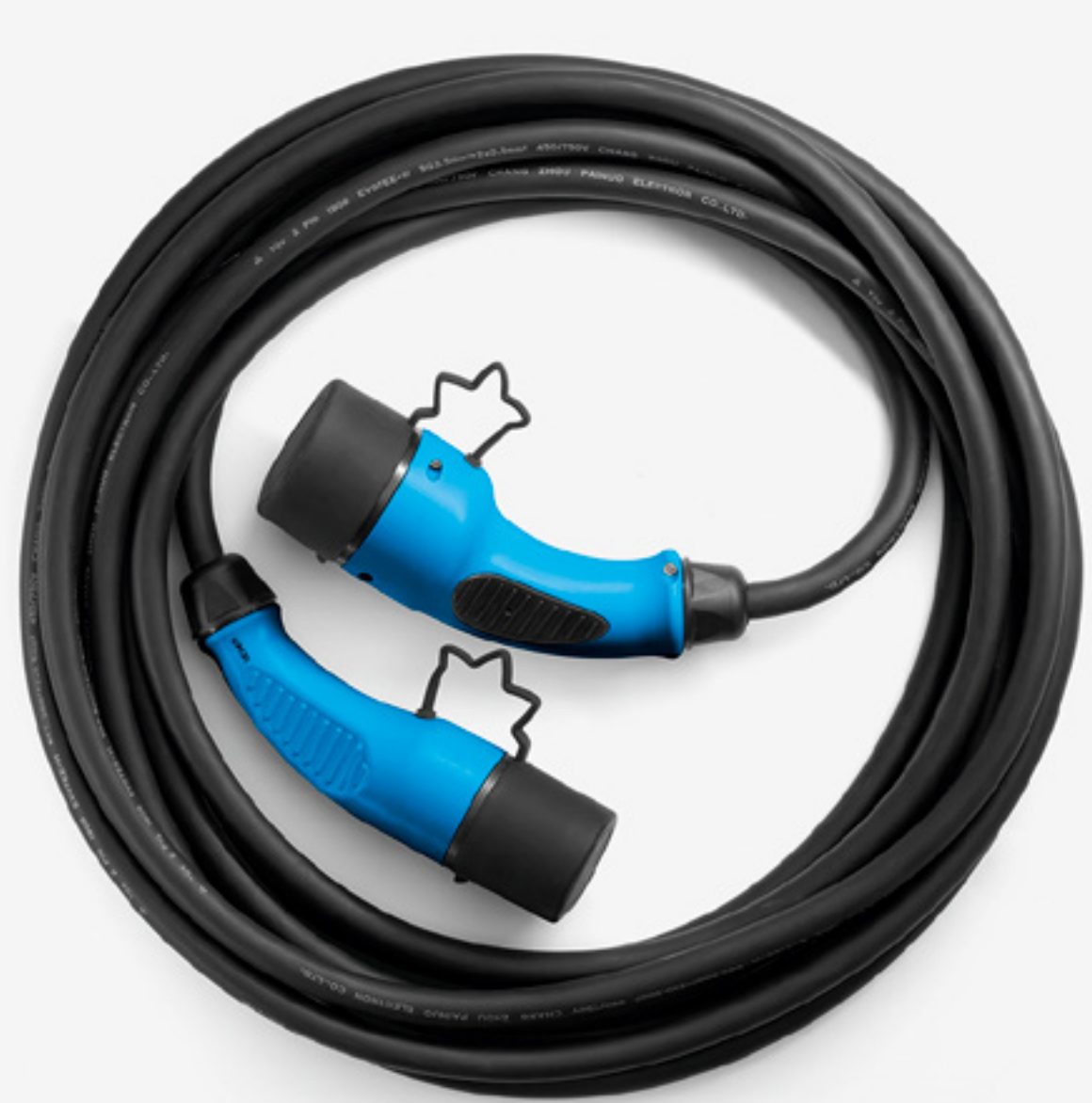
nabíjací kábel pre wallbox

Využite kábel Flexicharger na použitie so zosilnenou domácou zásuvkou (až 50 km za 3 hodiny a 55 minút) alebo príležitostný domáci kábel na použitie so štandardnými zásuvkami (až 50 km za 6 hodín a 28 minút). Nabíjací kábel typu 2 (T2), určený na dlhé cesty, možno použiť na verejných aj domácich nabíjacích miestach.