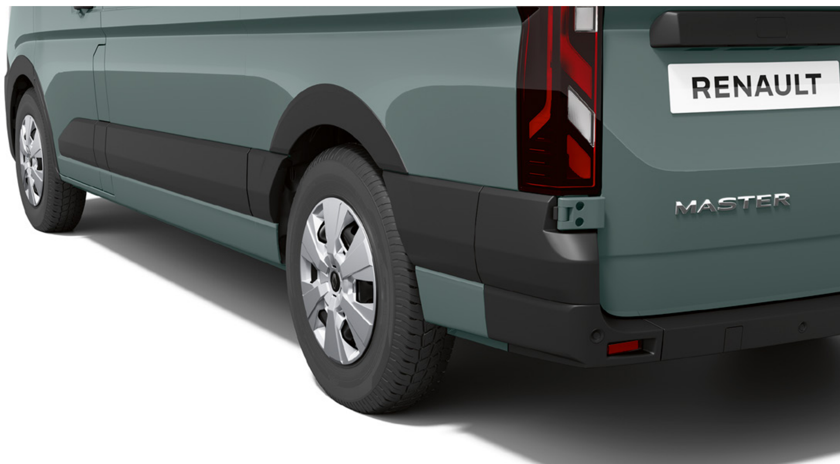
sada vonkajších ochrán podbehov kolies - predné a zadné