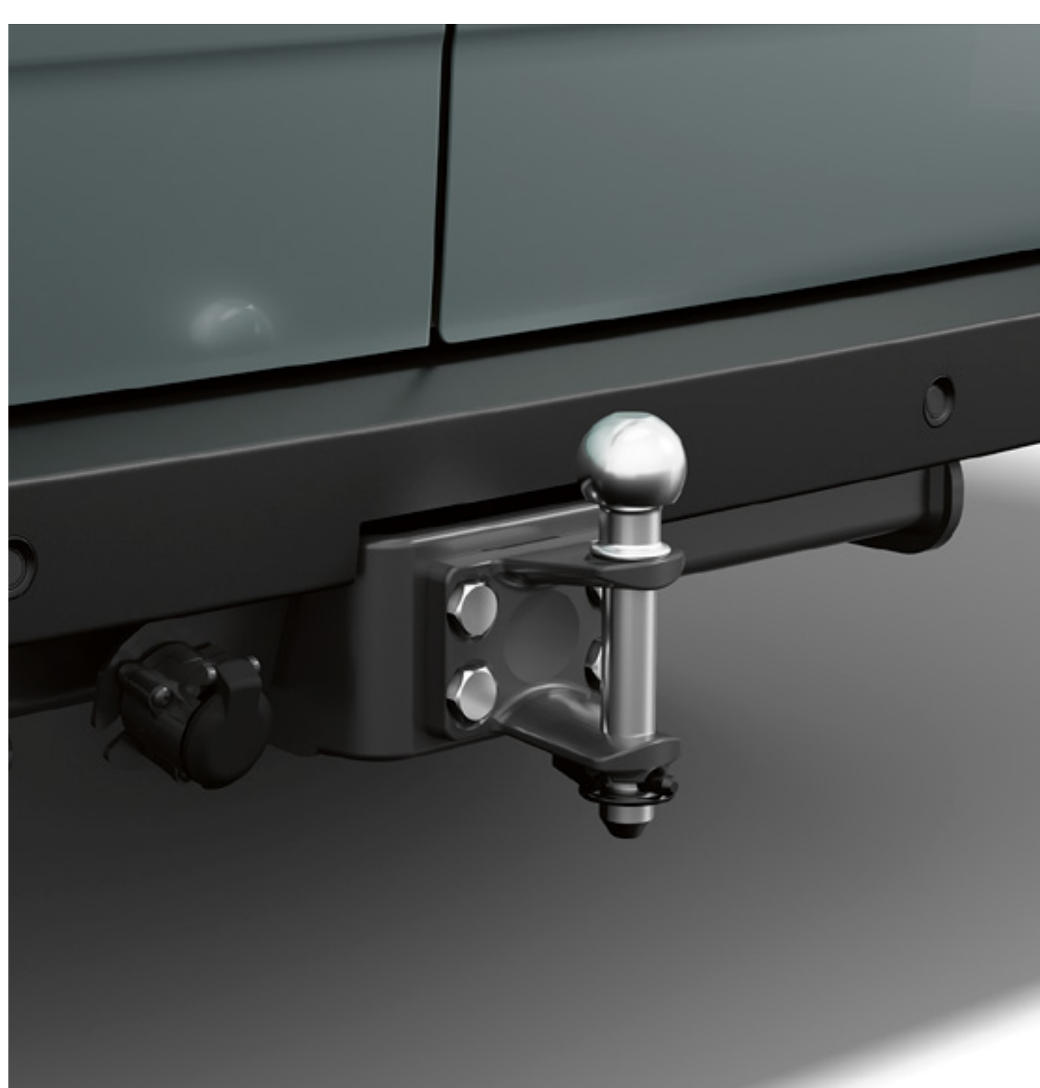
Ťažné zariadenie Standard s ťažným strmeňom