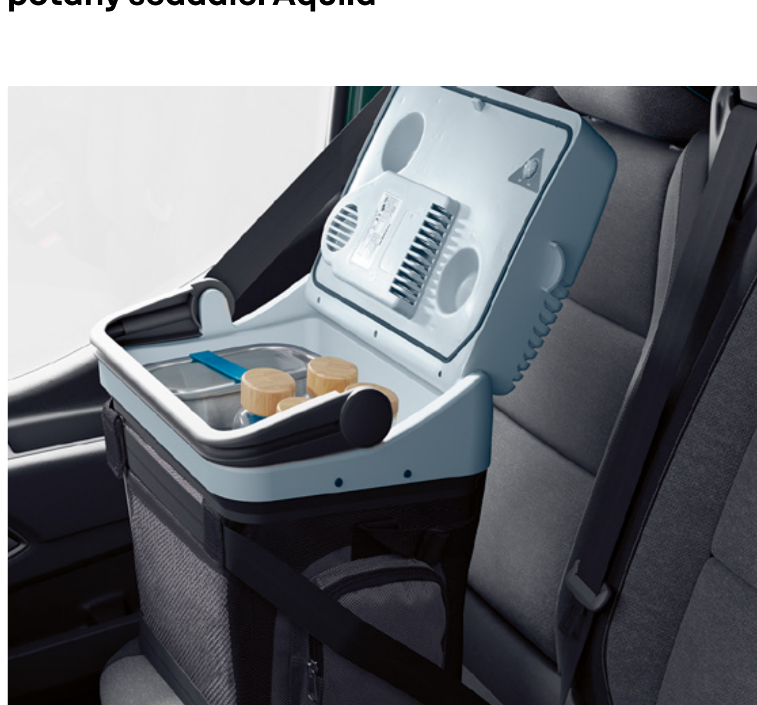
chladiaci box 24 litrov (42 x 42 x 30 cm)