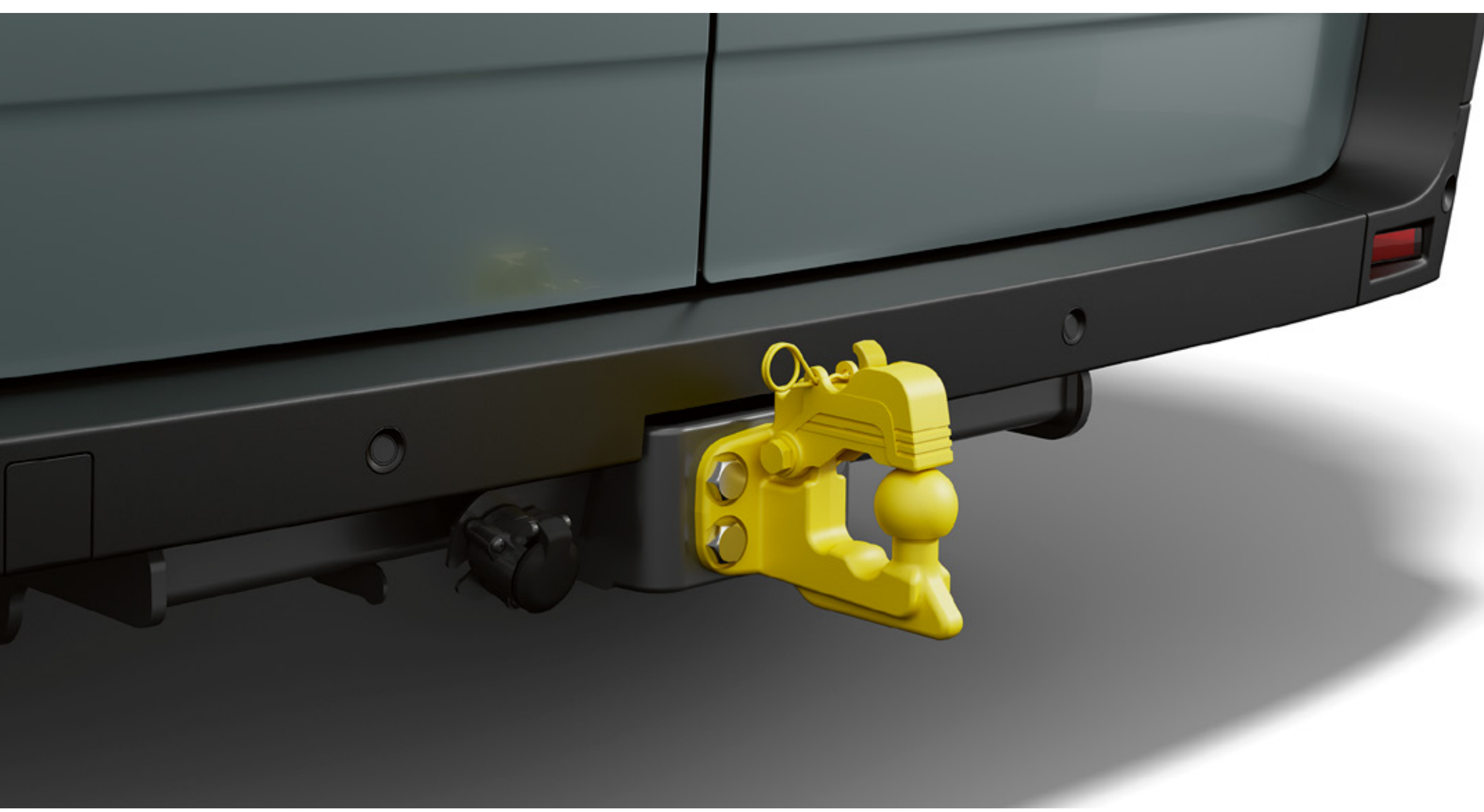
Ťažné zariadenie Standard s fixnou spojkou so 4 otvormi

Paket ťažného zariadenia Standard s guľovým kĺbom, guľovou fixnou spojkou alebo ťažným strmeňom je praktickým a bezpečným riešením pre ťahanie všetkých nákladov.