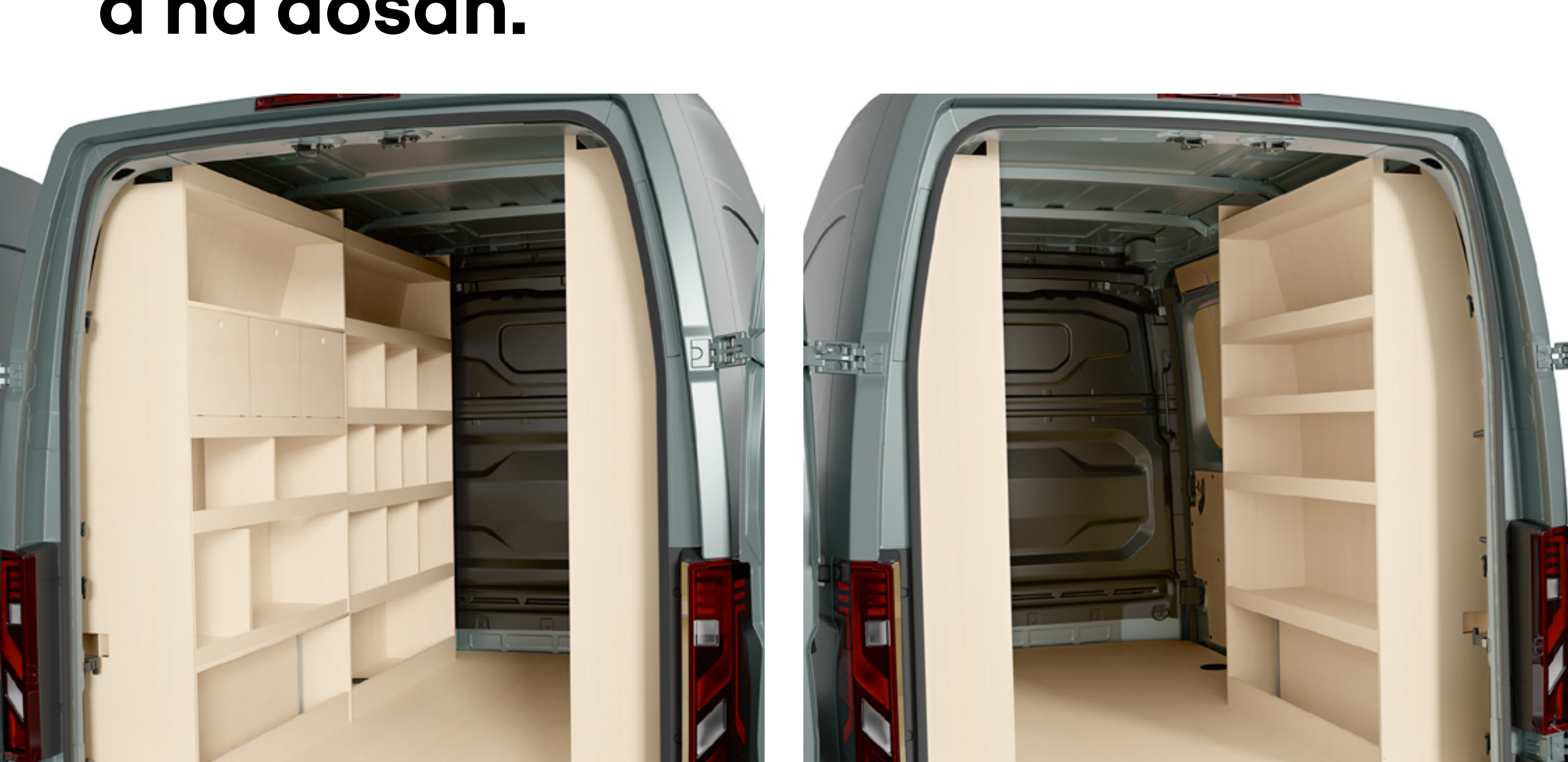
drevené regály - ľavé predné a zadné

Prispôbte si nakladací priestor pomocou regálov a otvorených alebo uzavretých skriniek. Tieto prvky sú praktické a pomáhajú udržiavať vaše vybavenie v poriadku a na dosah.