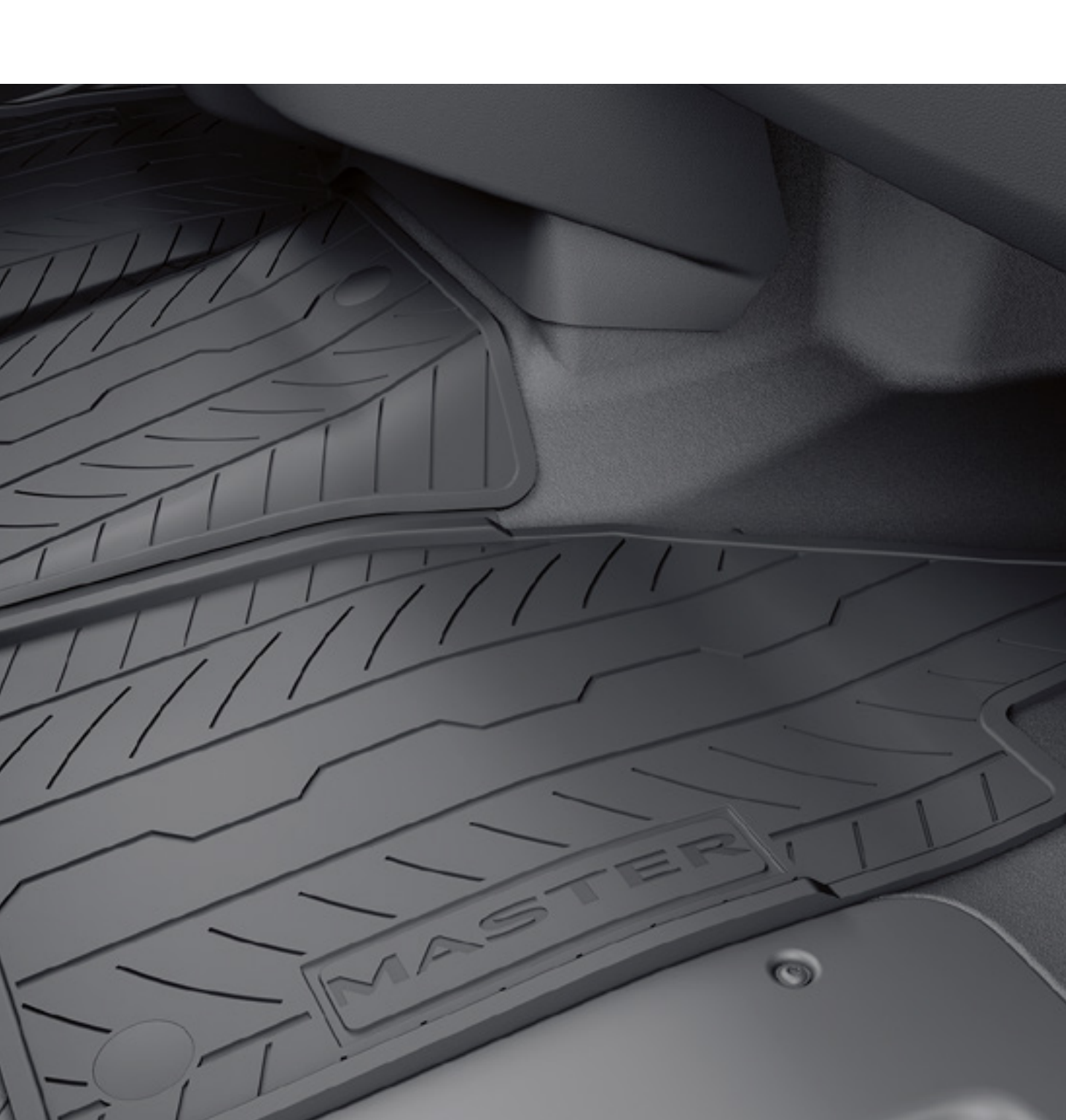
gumové koberce - sada 2 kusov

Podlahové koberce vyrobené na mieru poskytujú ochranu a pohodlie. Zaisťujú sa bezpečnostnými sponami a vďaka ich odolnosti proti nečistotám sú nenáročné na údržbu. Sú k dispozícii v gumovom alebo textilnom vyhotovení.