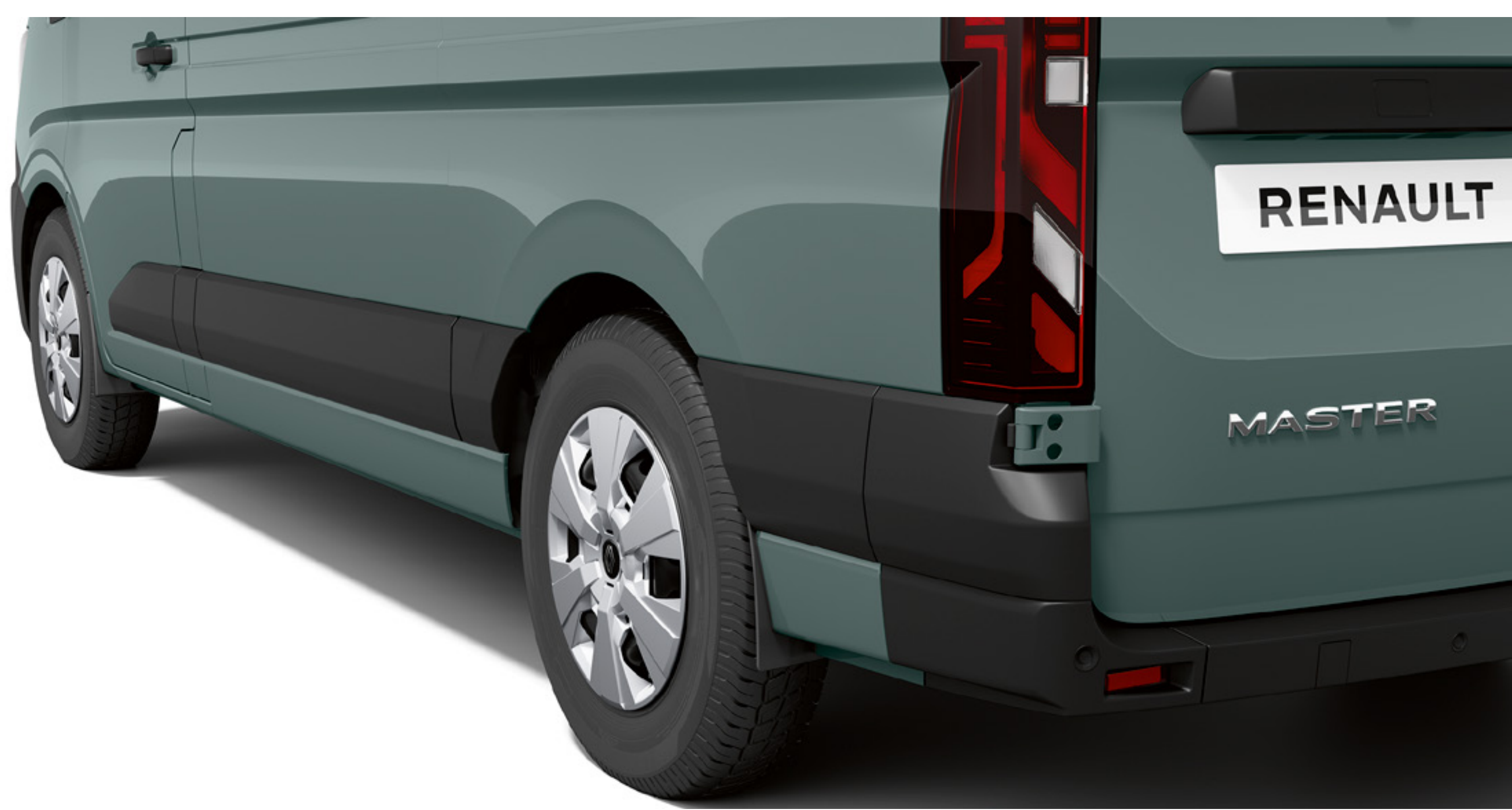
zásterky - predné a zadné

Montážou zásteriek a/alebo vonkajších ochrán podbehov kolies môžete predísť poškodeniu podvozka spôsobenému štrkom a blatom.