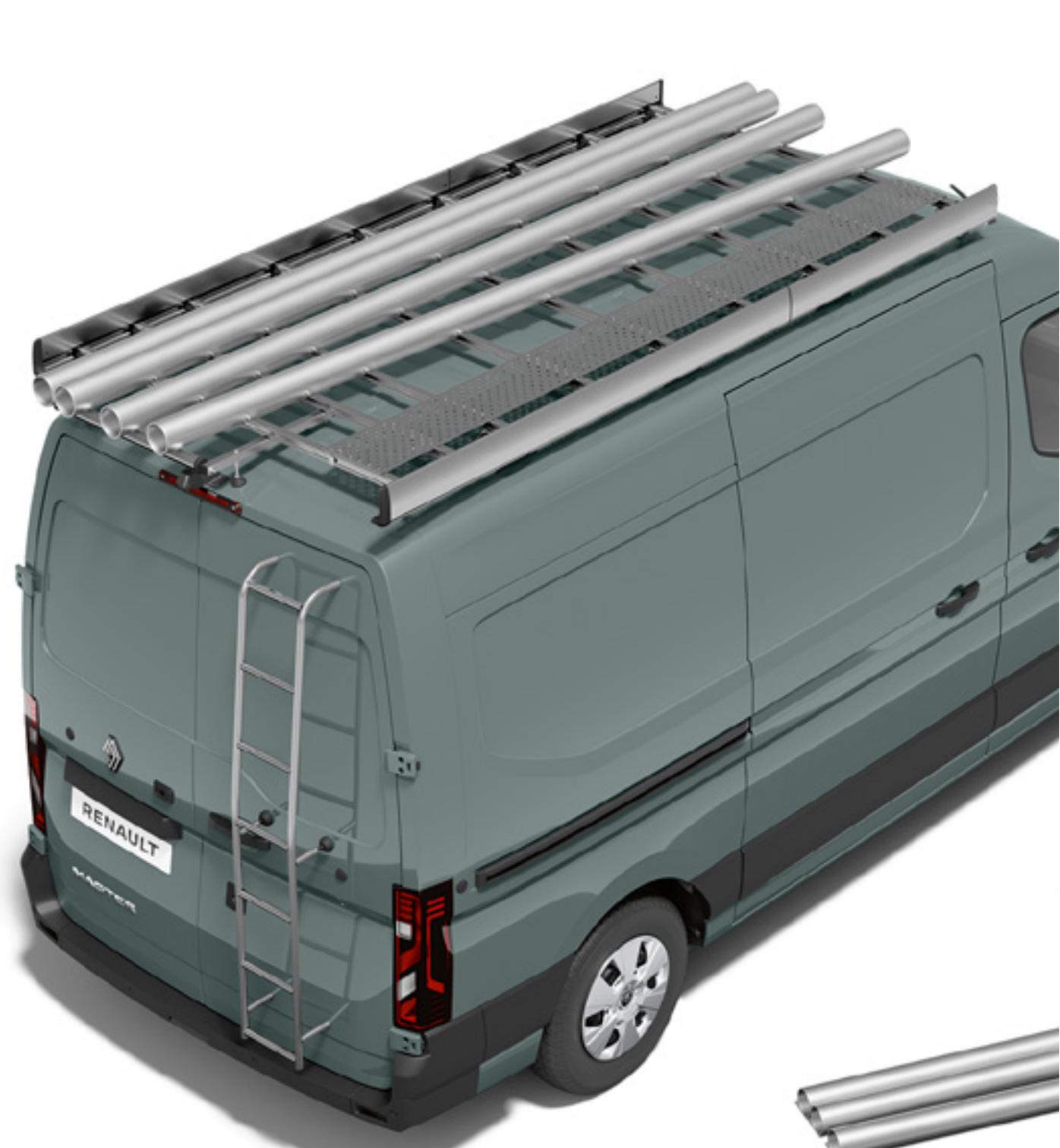
strešná galéria, rebrík a manipulačná plošina

Namontujte až päť strešných nosičov 2 a zväčšíte tak prepravnú kapacitu svojho vozidla. Môžete prevážať profesionálne vybavenie, ako sú signalizačné súpravy a rebríky.