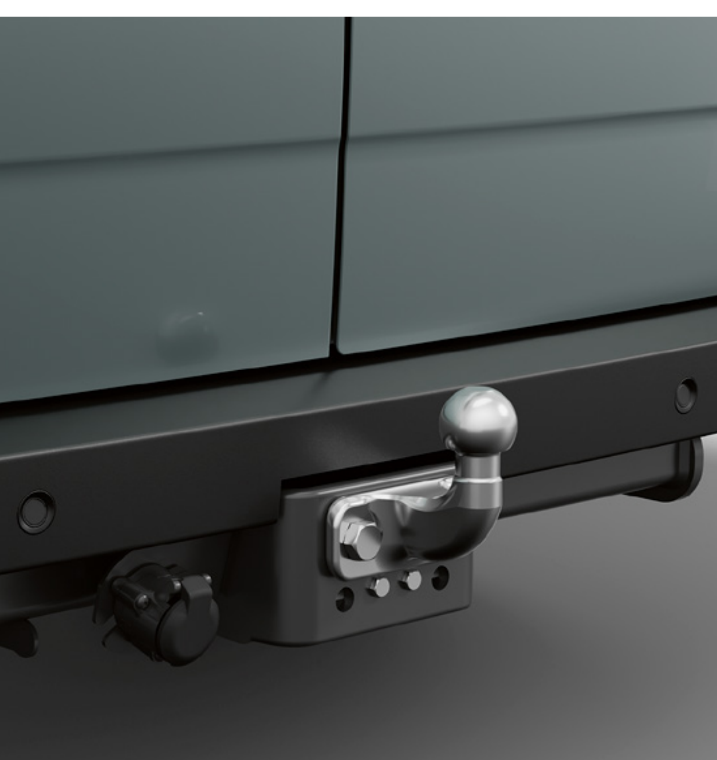
Ťažné zariadenie Standard s guľovým kĺbom

Ťažné zariadenia Standard s guľovým kĺbom alebo s ťažným strmeňom vám zaručujú 100 % kompatibilitu s vozidlom a tým aj bezrizikové použitie bez poškodenia vozidla. Pre maximálnu flexibilitu si vyberte ťažný strmeň, ktorý vám umožní pripojiť príves so závesným okom alebo s guľovým kĺbom.