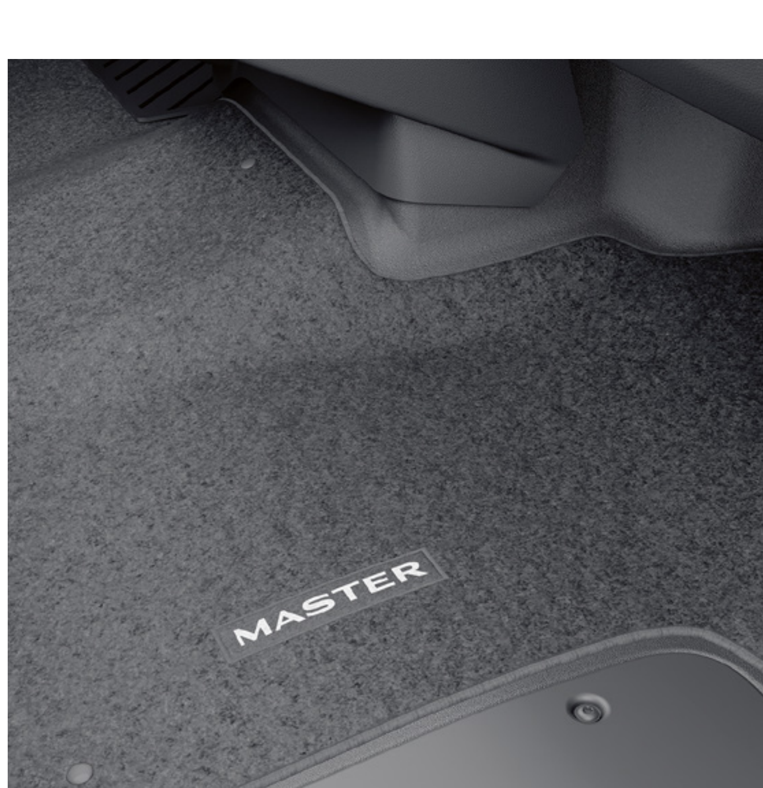
textilný koberec - celý prvý rad

Potáhy sedadiel chránia pôvodné čalúnenie pred opotrebením a nečistotami. Odnímateľný držiak smartphonu vám umožní bezpečne používať telefón na cestách. A v neposlednom rade chladiaci box udržuje jedlo a nápoje v správnej teplote.