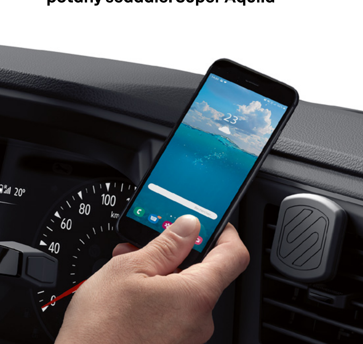
magnetický držiak telefónu