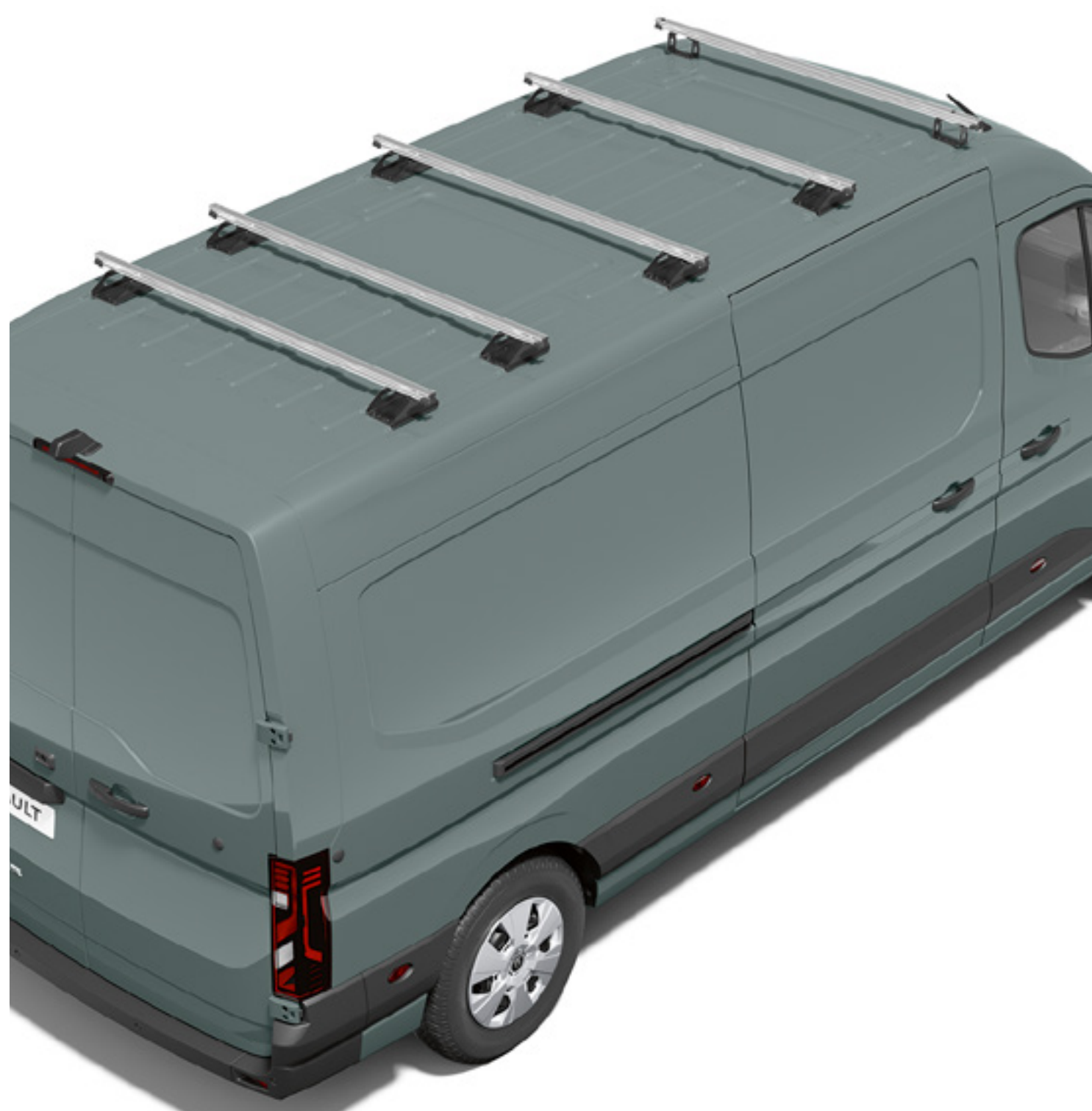
strešné nosiče 2