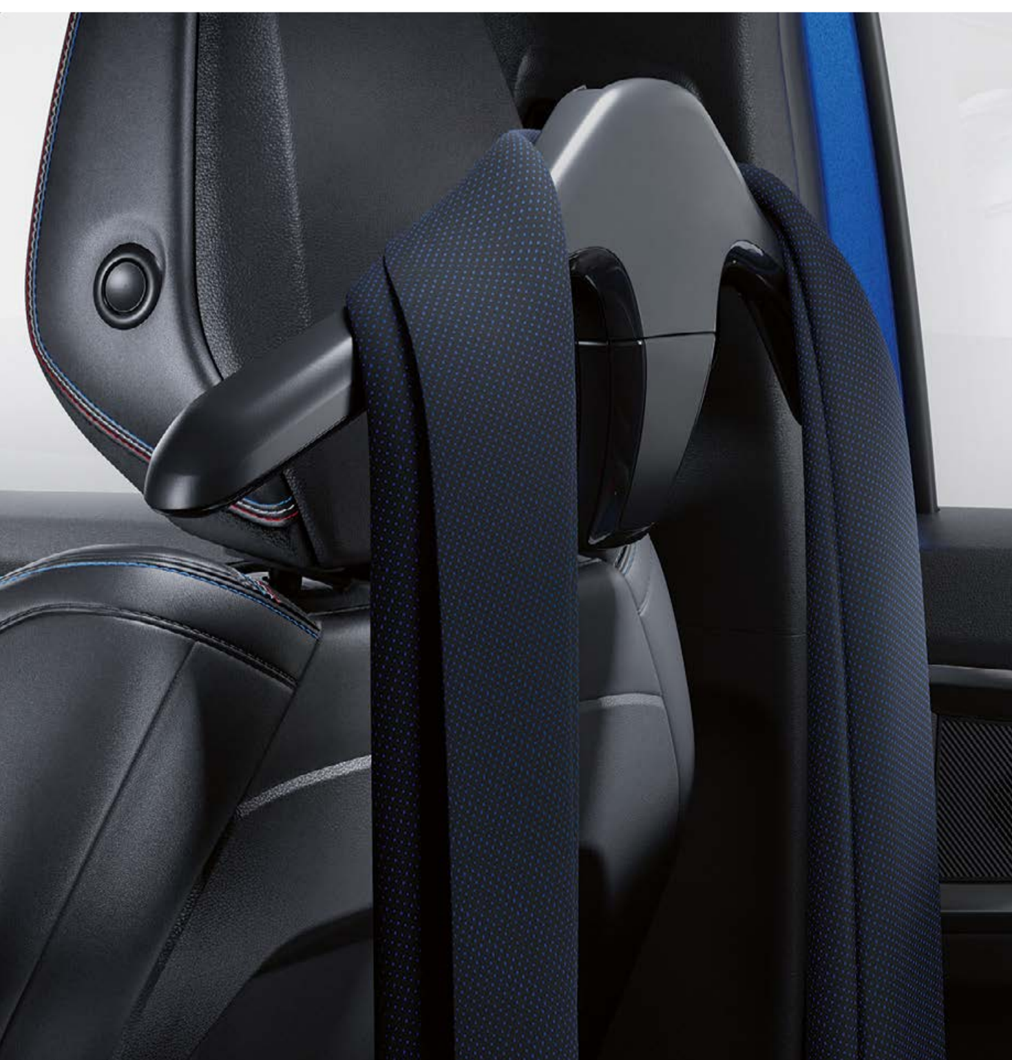
vešiak na oblečenie (obsahuje univerzálny nadržavec za opierku hlavy)

Na univerzálny nadstavec za opierku hlavy môžete pripevniť elegantný vešiak na bundu či kabát, rafinovaný držiak na tašku či kabelku alebo praktický sklopný stolík.