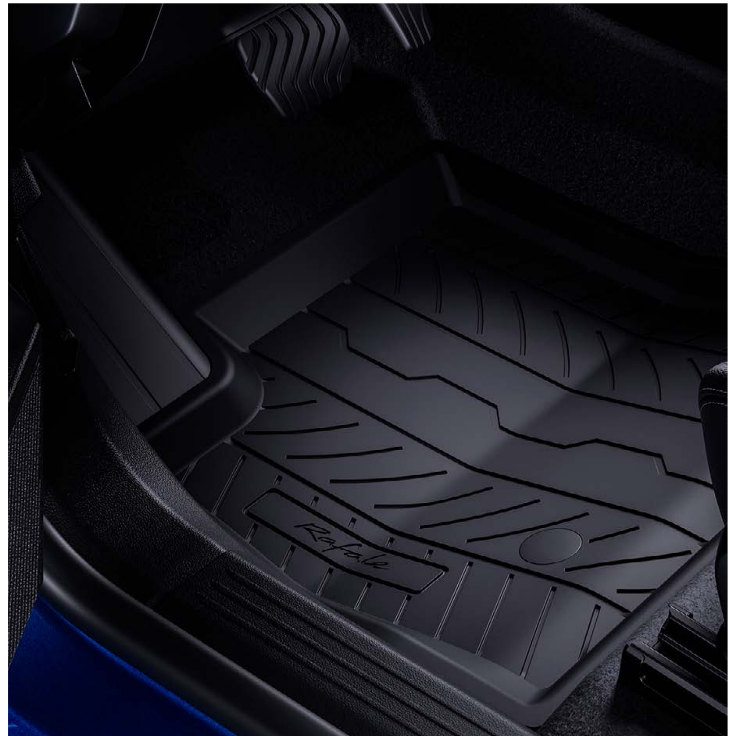
gumové koberce – sada 4 kusov