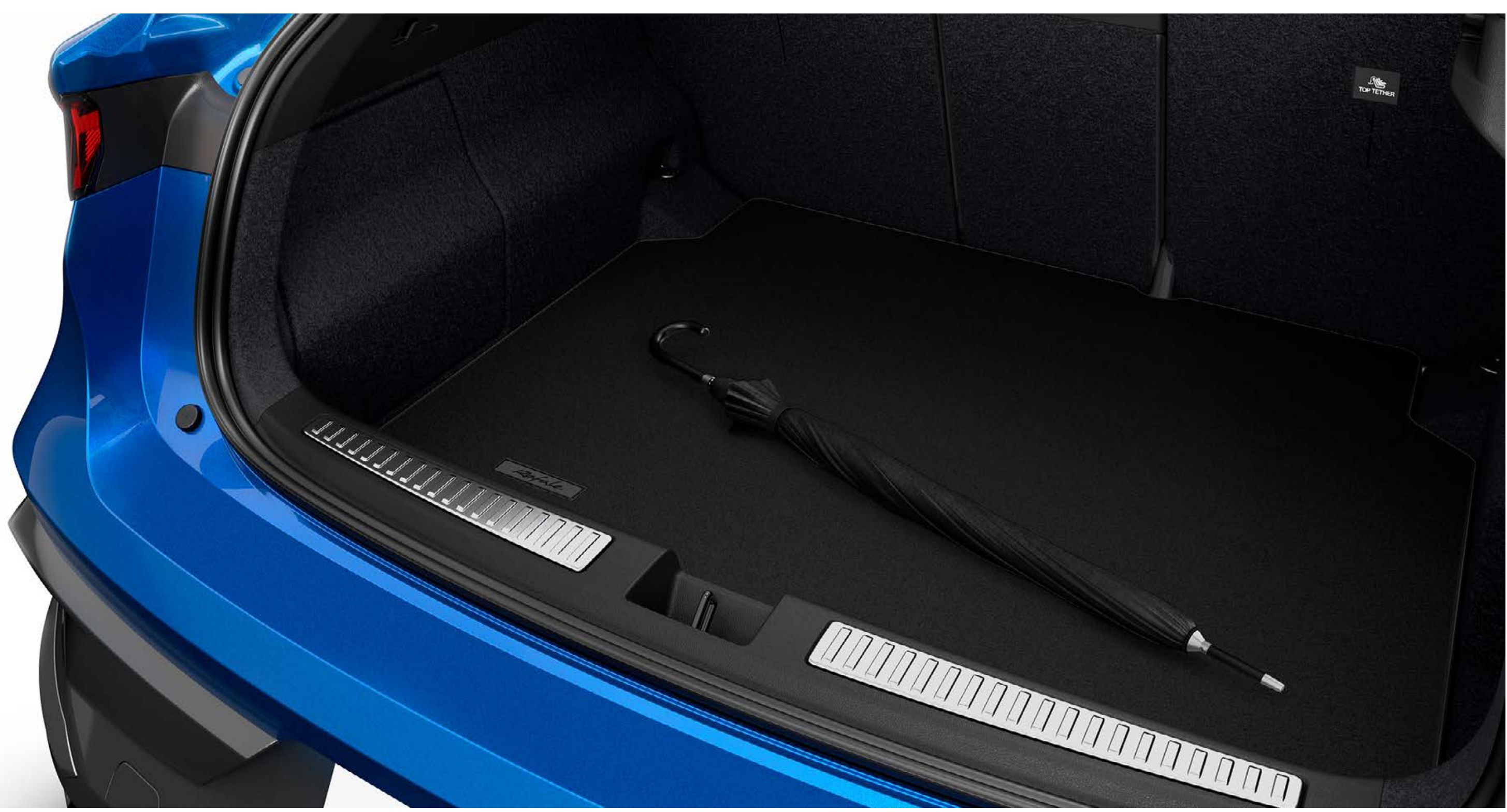
koberec batožinového priestoru

Prémiový a na mieru vyrobený koberec elegantne zdobí a chráni pôvodný koberec batožinového priestoru.