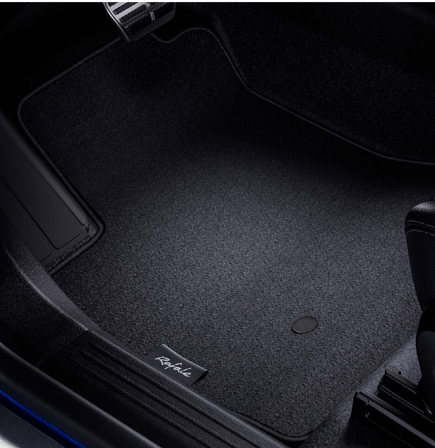
textilné koberce Comfort – sada 4 kusov

Komfort, alebo ochrana? Máme pre vás oboje! Textilné koberce Comfort sú pohodlné a elegantné, zatiaľ čo gumové koberce s vysokým okrajom poskytujú nekompromisnú ochranu pred vodou a nečistotami.