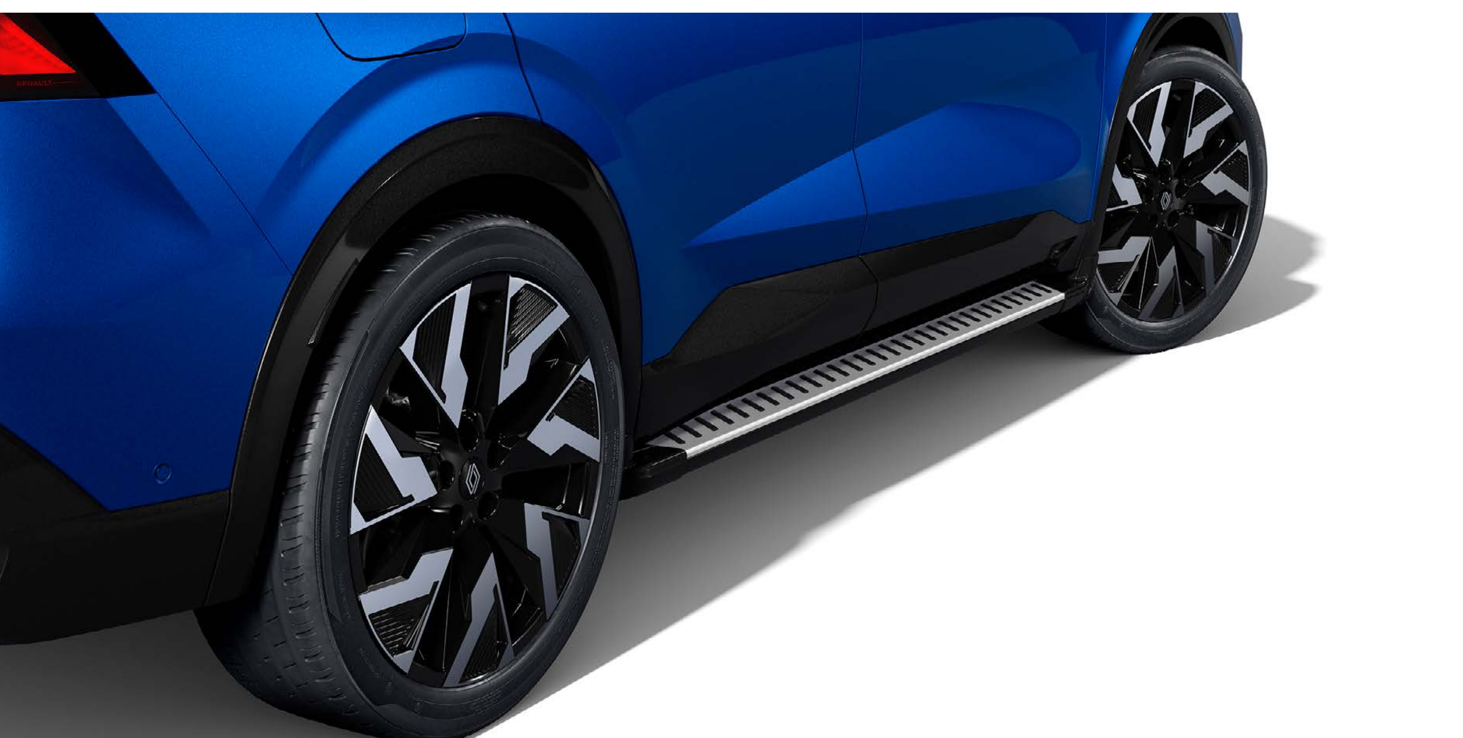
bočné nášlapy – pravý a ľavý

Prémiové bočné nášlapy umocňujú asertívny štýl vozidla Renault Rafale. Uľahčujú prístup na strechu a chránia karosériu pred drobnými každodennými nárazmi.