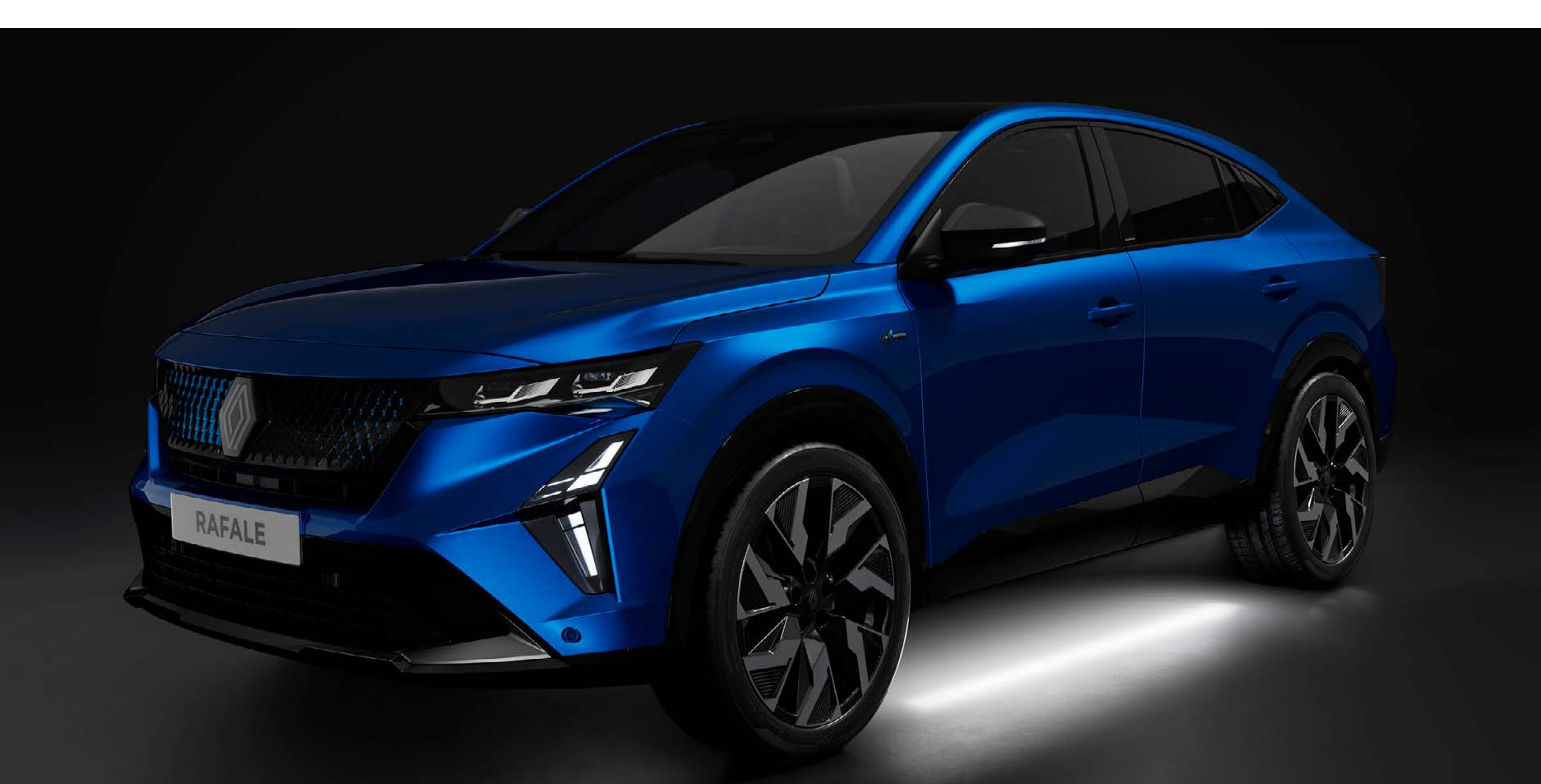
uvítacie osvetlenie pod podvozkom

Uľahčíte si hľadanie svojho vozidla na parkoviskách za šera alebo za tmy. Uvítacie osvetlenie pod podvozkom je elegantným a praktickým doplnkom.