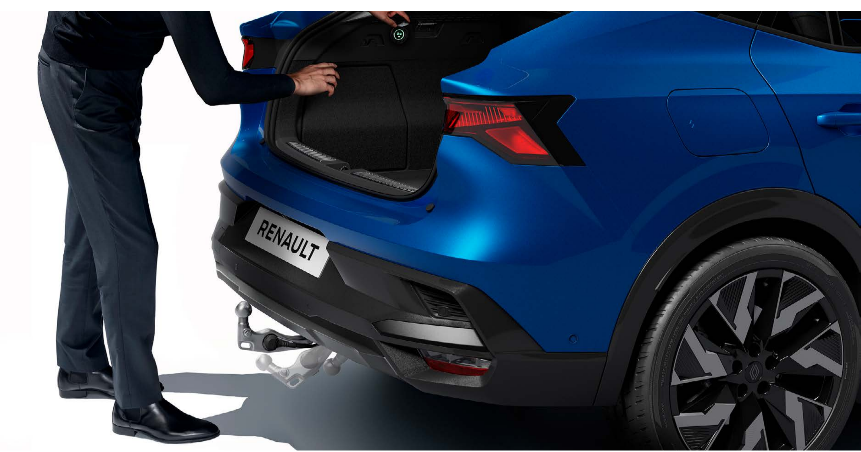
elektricky výklopné ťažné zariadenie

Chráňte dizajn svojho vozidla pomocou elektricky výklopného ťažného zariadenia; guľový kĺb sa zasunie v priebehu niekoľkých sekúnd iba stlačením ovládača umiestneného v batožinovom priestore.