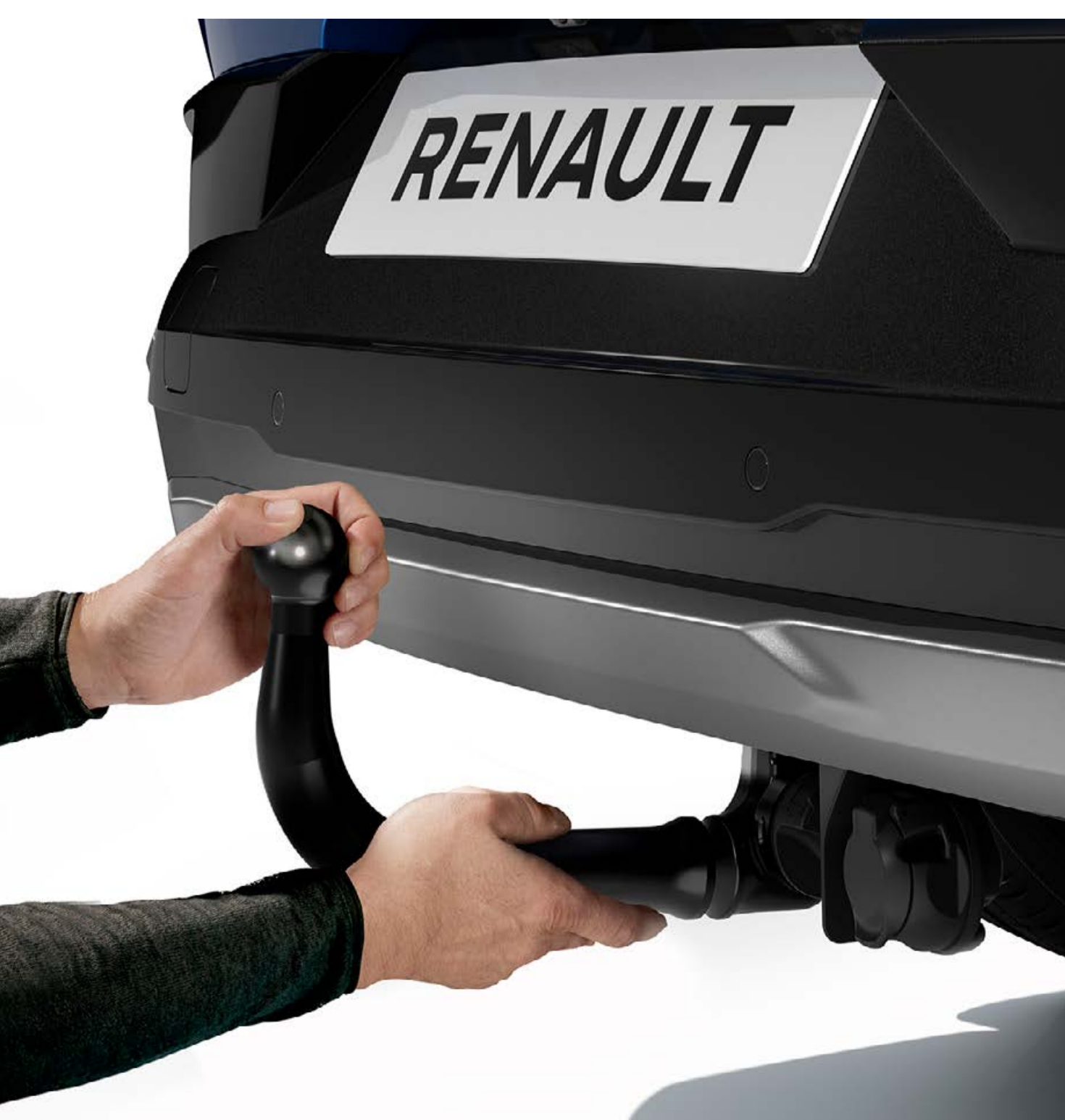
ťažné zariadenie demontovateľné bez náradia

Na občasné použitie si vyberte ťažné zariadenie, ktoré možno demontovať bez použitia náradia. Pre časté používanie zvolte jednoduché a účinné ťažné zariadenie typu „labutí krk“.