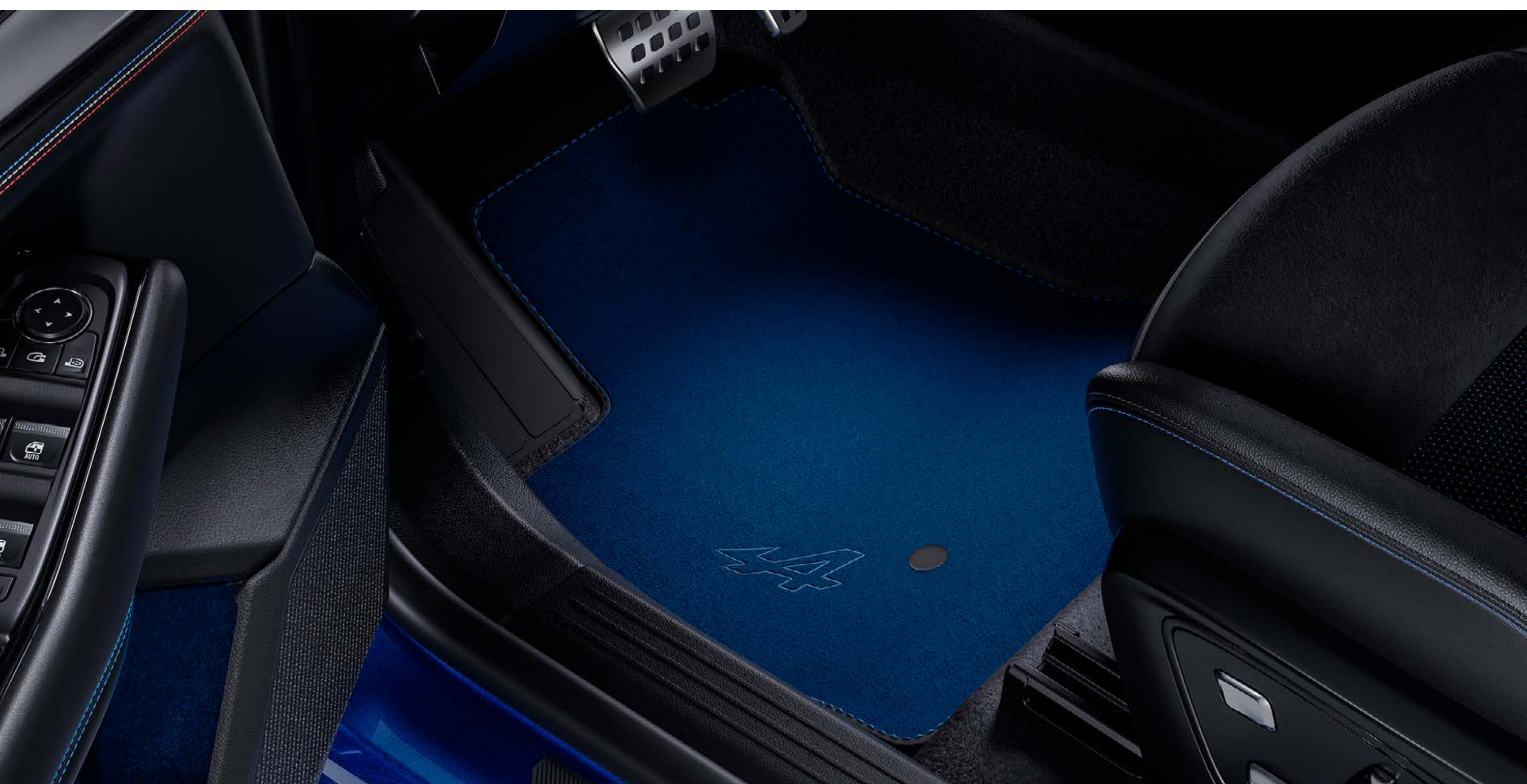
textilné koberce Alpine – sada 4 kusov

Dodajte aj interiéru športový nádych sadou prvotriednych kobercov s vyšívaným logom športovej značky Alpine.