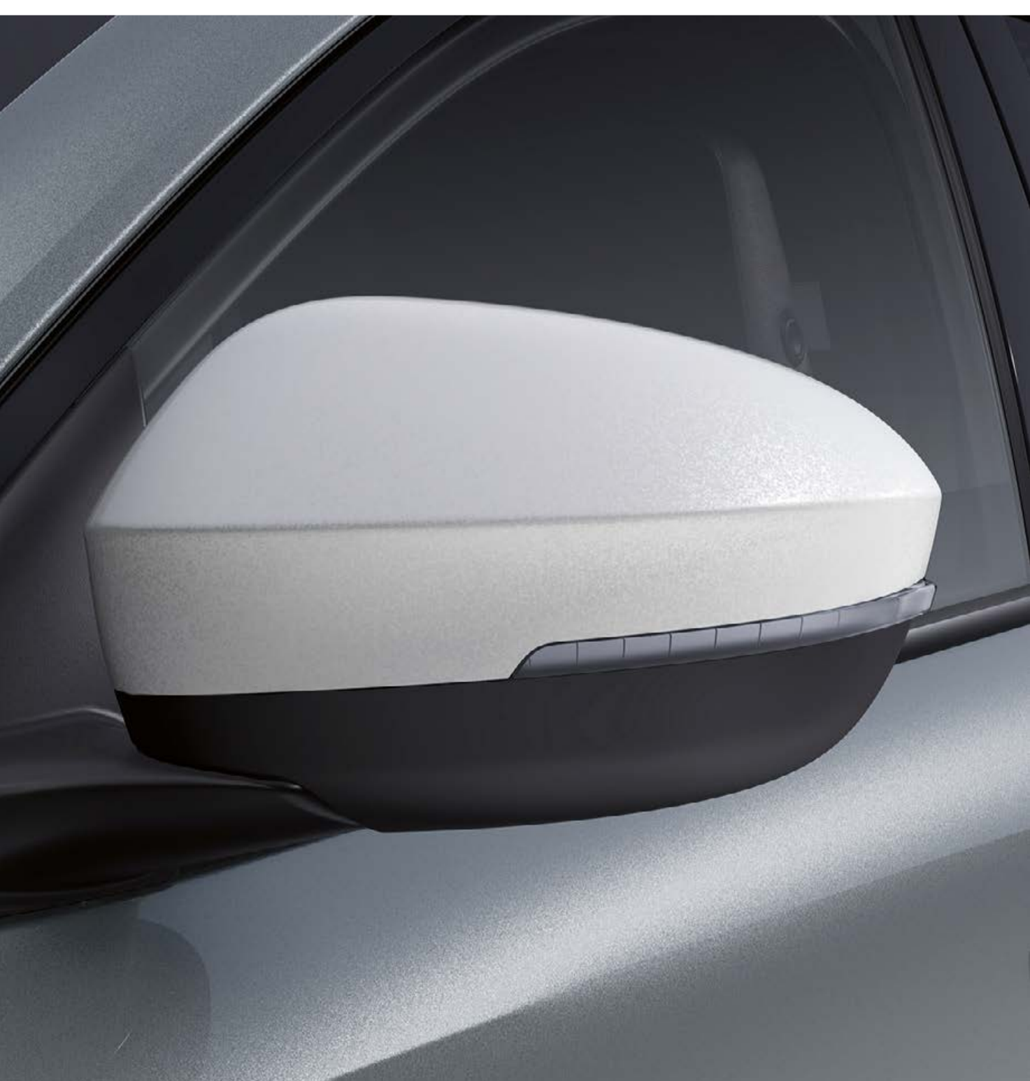
kryty spätných zrkadiel – saténovobiela

Kryty zrkadiel v saténovobielej alebo alpskej modrej dodajú nádych rafinovanosti.