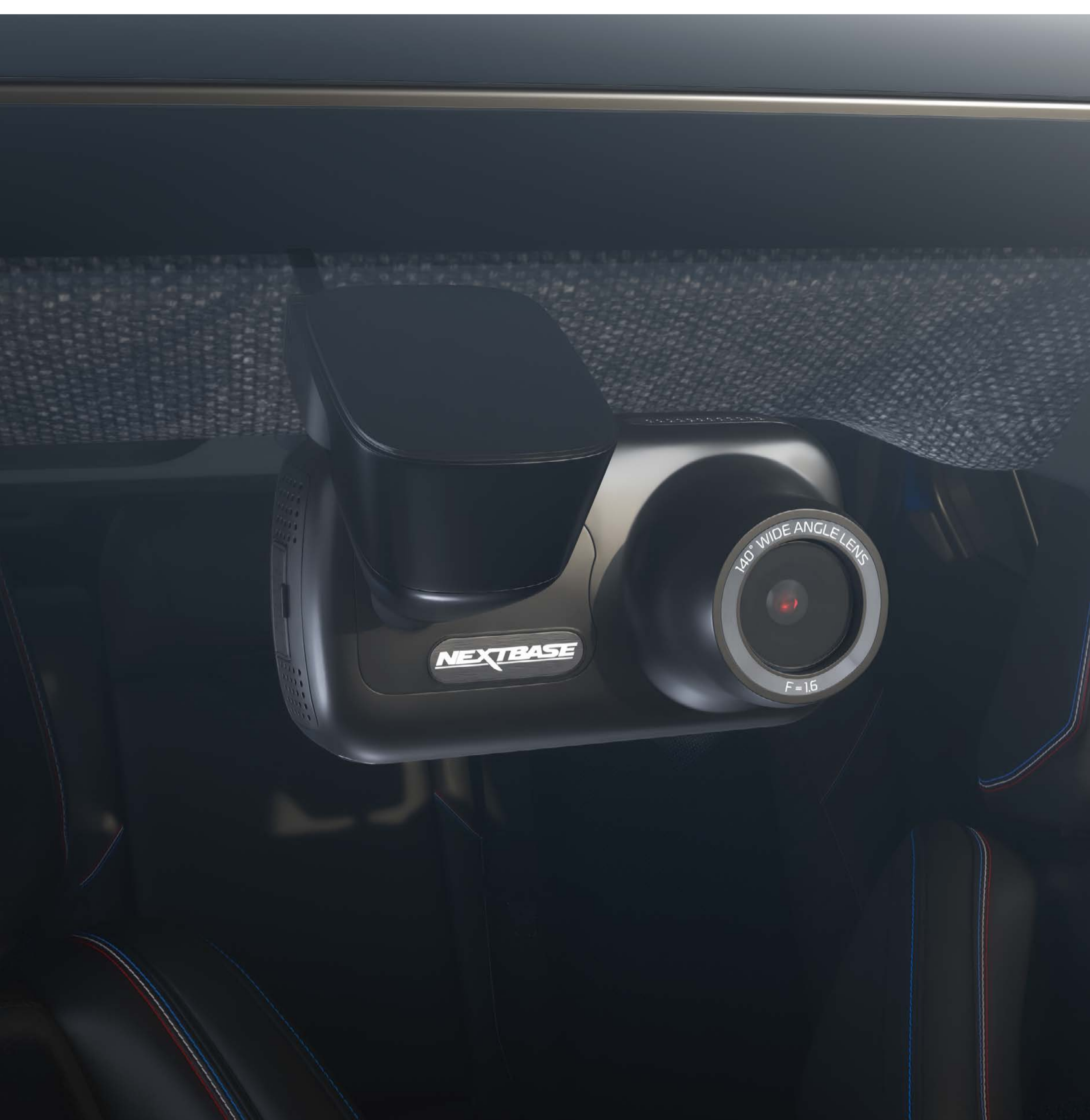
kamera na nahrávanie premávky

Palubná kamera na nahrávanie premávky je diskkrétne a prirodzene integrovaná do priestoru pre cestujúcich. Sleduje všetky vaše cesty a v prípade potreby poskytne to najlepšie svedectvo.