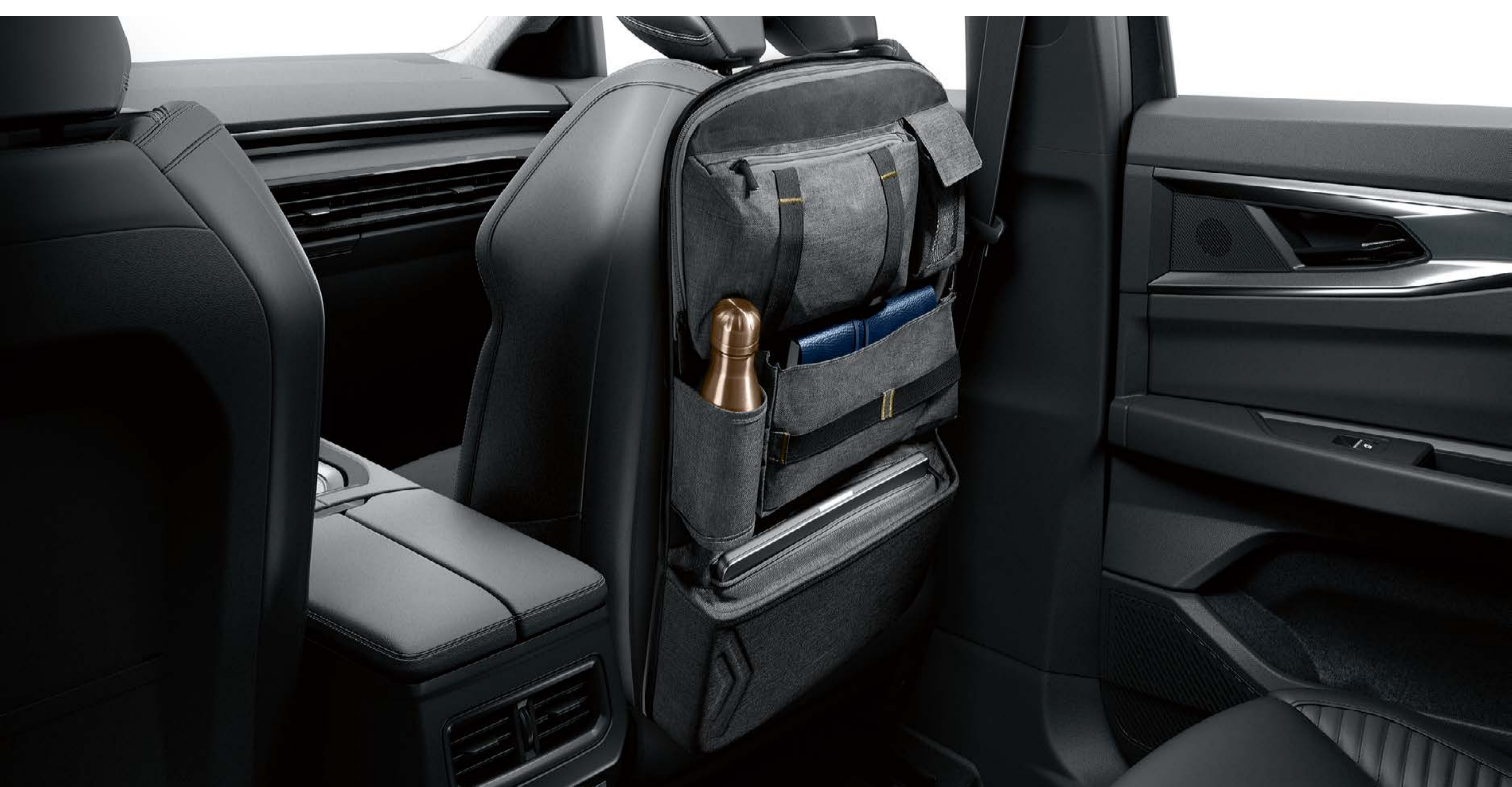
osobný organizér pre 2. rad sedadiel

Osobný organizér pre 2. rad sedadiel disponuje piatimi vreckami na uchovanie všetkého, čo pravidelne potrebujete. Skrýva tiež inteligentnú priehradku s popruhmi pre tablet na dlhšie cesty.