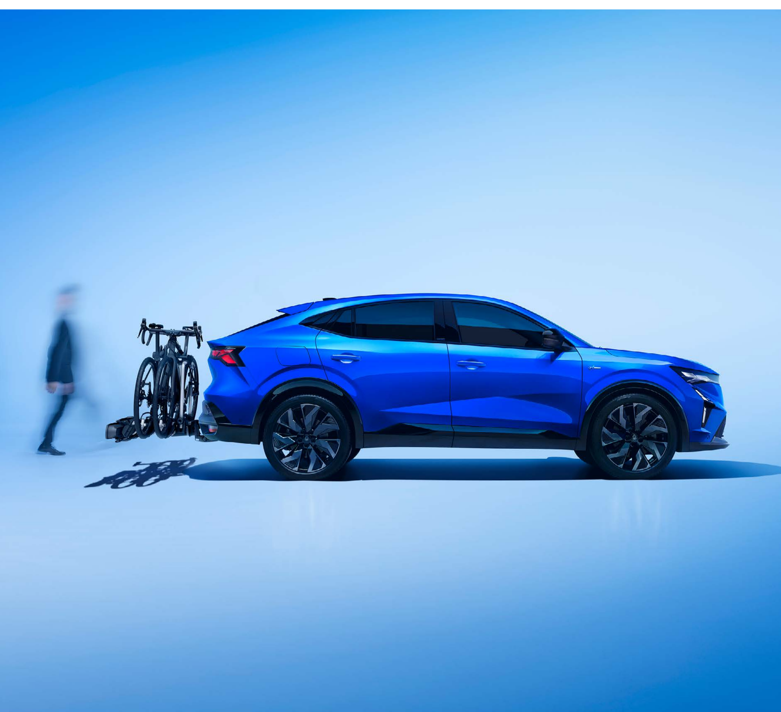
nosič bicyklov na elektricky výklopnom ťažnom zariadení

Vyberte si zo širokej ponuky ťažných zariadení vyvinutých exkluzívne pre Renault Rafale.