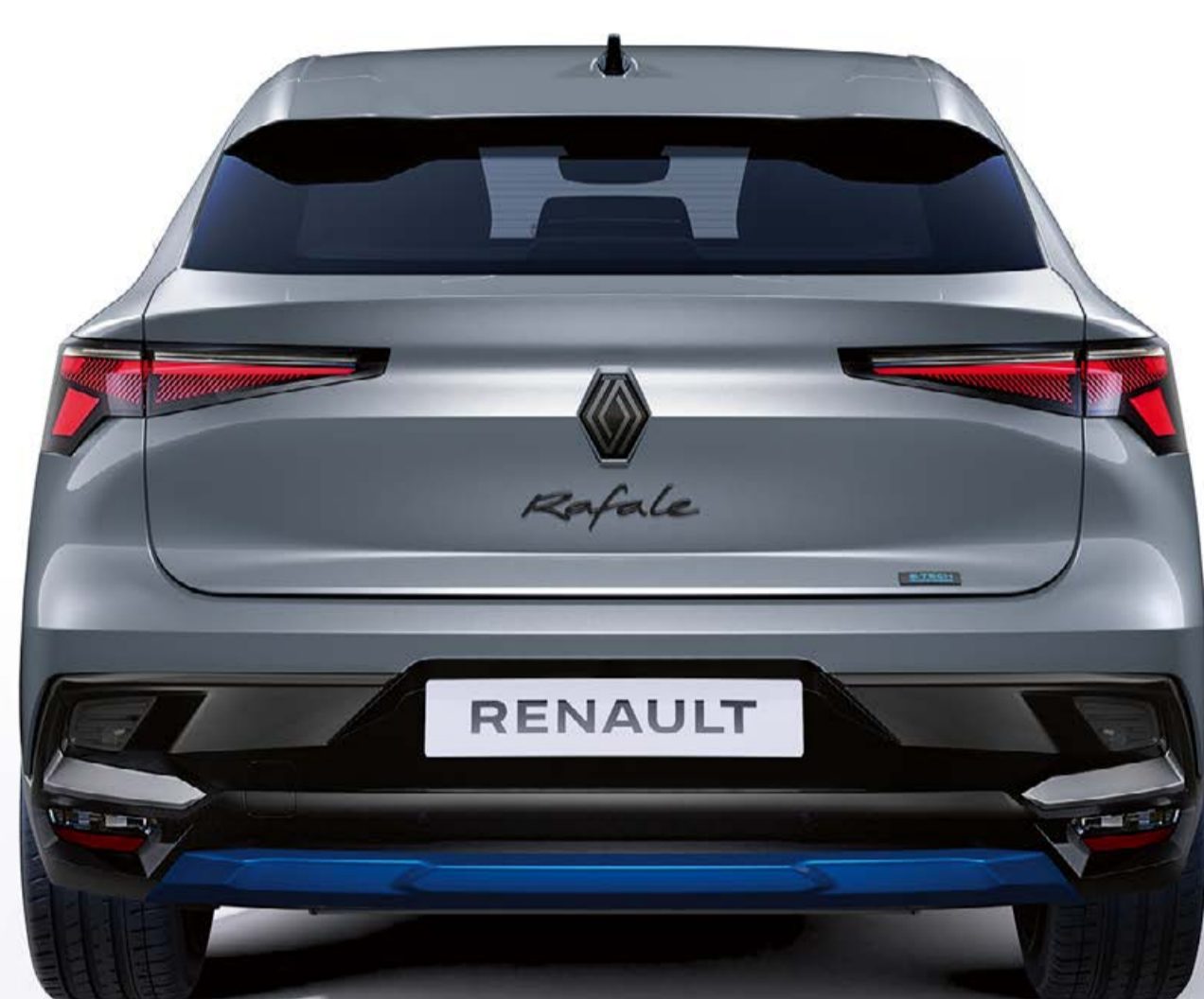
sada dizajnových prvkov na personalizáciu exteriéru – alpská modrá