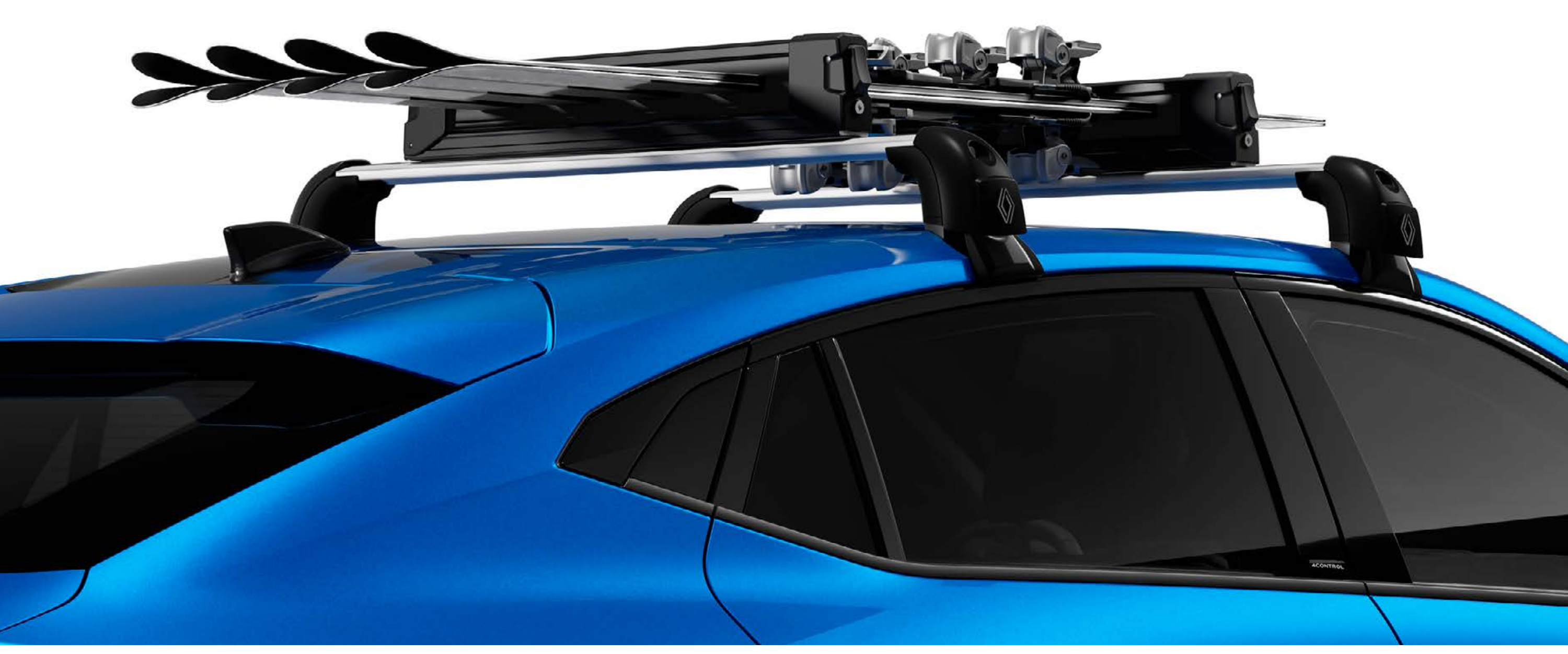
nosič lyží na strešných tyčiach QuickFix

Veďte si lyže so sebou – prepravujte ich bezpečne pomocou nosiča lyží na strešných tyčiach.