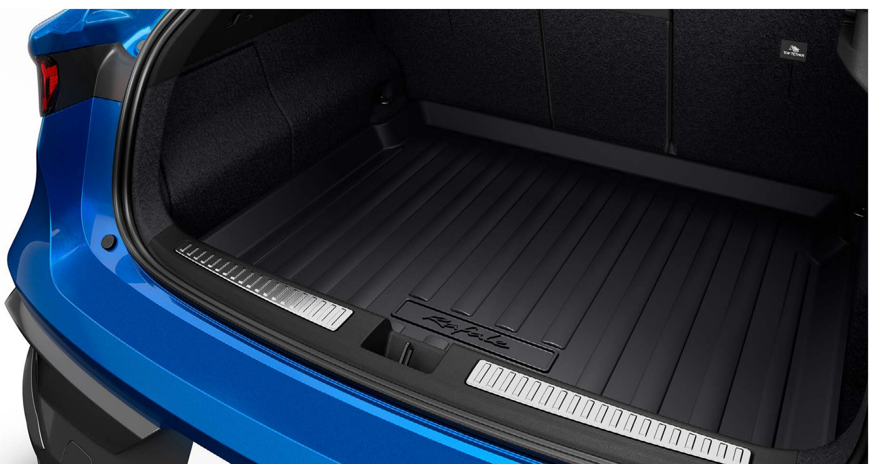
vaňa batožinového priestoru

Špinavé topánky alebo mokré predmety prevádzajte v utesnenej polotuhej vani do batožinového priestoru. Zvýšené okraje účinne ochránia pôvodný koberec batožinového priestoru.