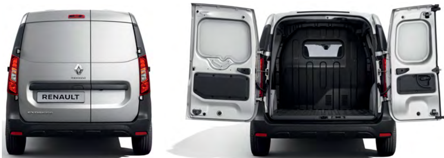
nákladový priestor vozidla Express Van