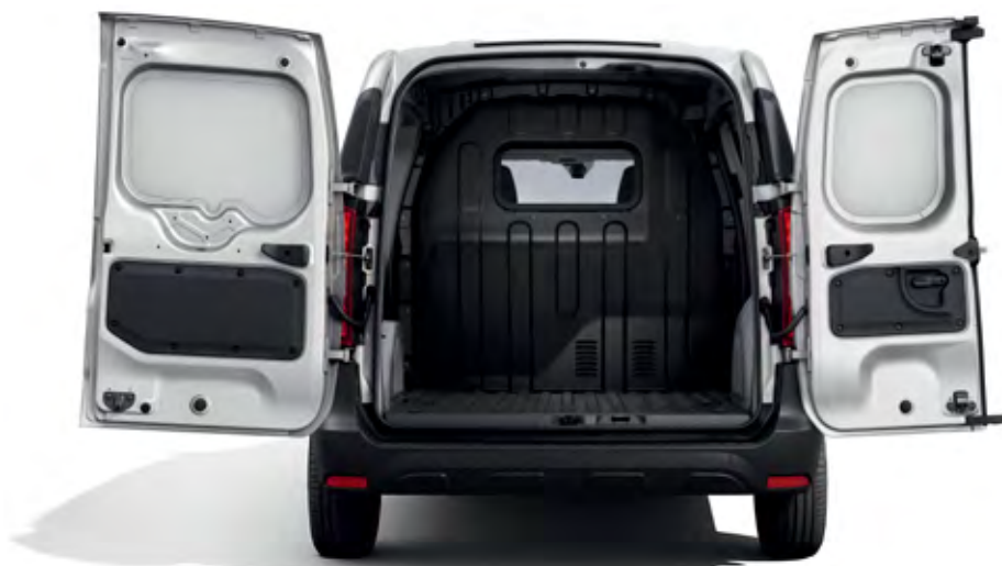
nákladový priestor vozidla Express Van