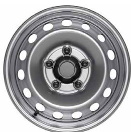
16" oceleové disky kolies