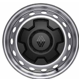
16" oceleové disky kolies s okrasnými krytmi vango