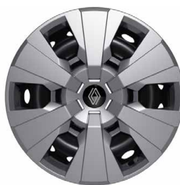
16" oceleové disky kolies s okrasnými krytmi airna