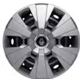
16" oceleové disky kolies s okrasnými krytmi airna