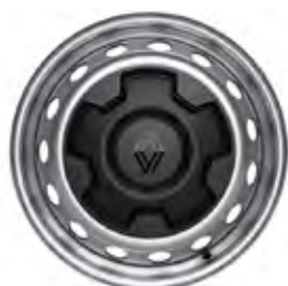
16" oceleové disky kolies s okrasnými krytmi vango