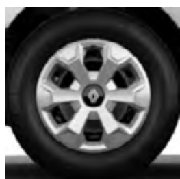
16" oceleové disky kolies s okrasnými krytmi kolies celoplošné