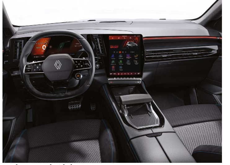
techno esprit Alpine

*broşürde yer alan Renault Austral görselleri temsilidir. görseller ile Türkiye'de satılan model üzerindeki aksesuar ve ekipmanlar farklılık gösterebilir.