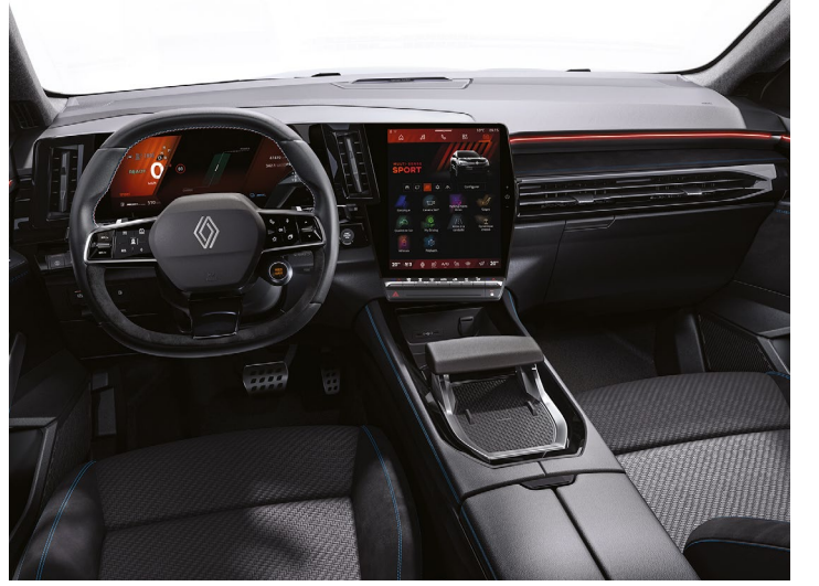
techno esprit Alpine

*broşürde yer alan Renault Austral görselleri temsilidir. görseller ile Türkiye’de satılan model üzerindeki aksesuar ve ekipmanlar farklılık gösterebilir.