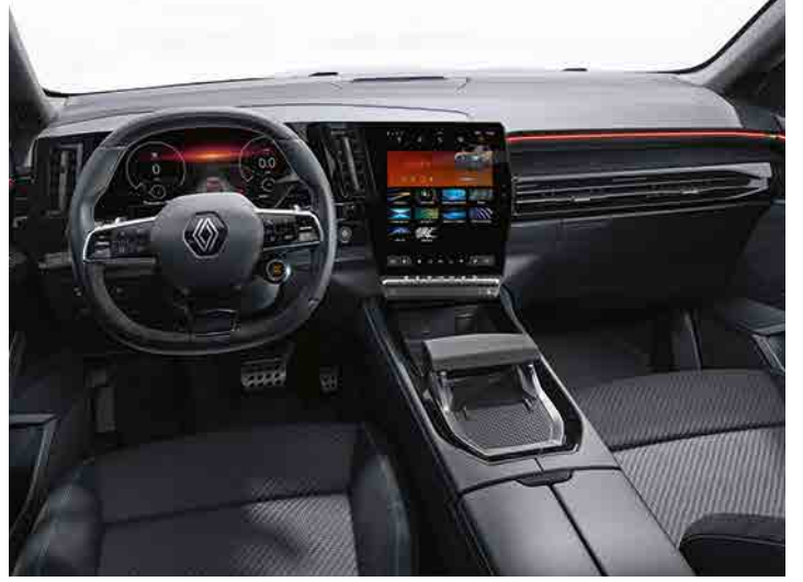
techno esprit Alpine

*broşürde yer alan Renault Austral görselleri temsilidir. görseller ile Türkiye'de satılan model üzerindeki aksesuar ve ekipmanlar farklılık gösterebilir.