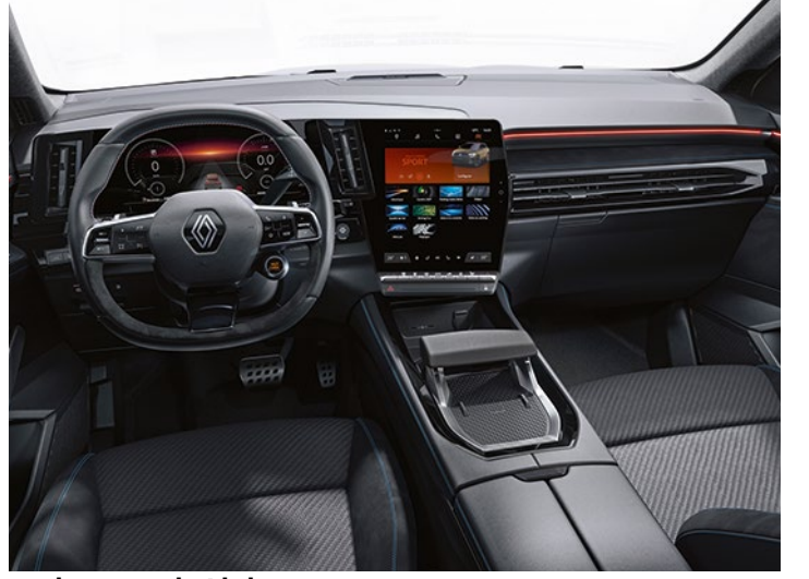
techno esprit Alpine

*broşürde yer alan yeni Renault Austral görselleri temsilidir. görseller ile Türkiye’de satılan model üzerindeki aksesuar ve ekipmanlar farklılık gösterebilir.