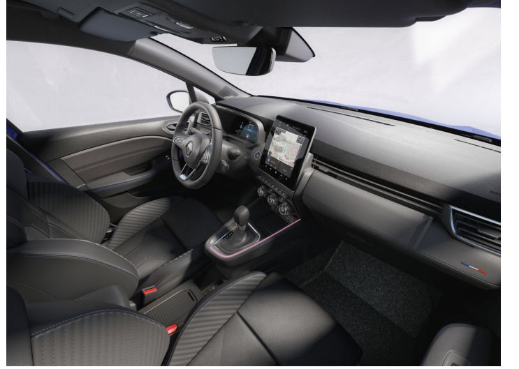
techno esprit Alpine

Görseller temsilidir, satılan versiyonlar ile farklılık gösterebilir.