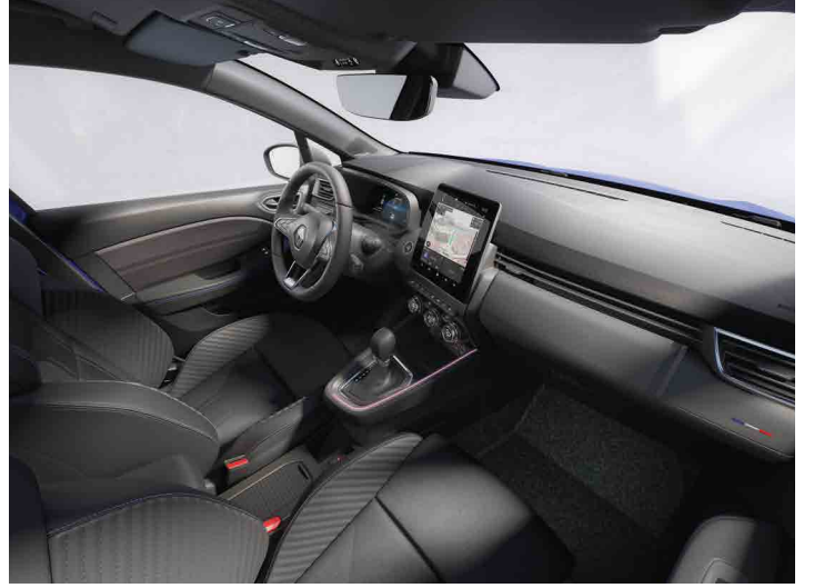
techno esprit Alpine

Görseller temsilidir, satılan versiyonlar ile farklılık gösterebilir.