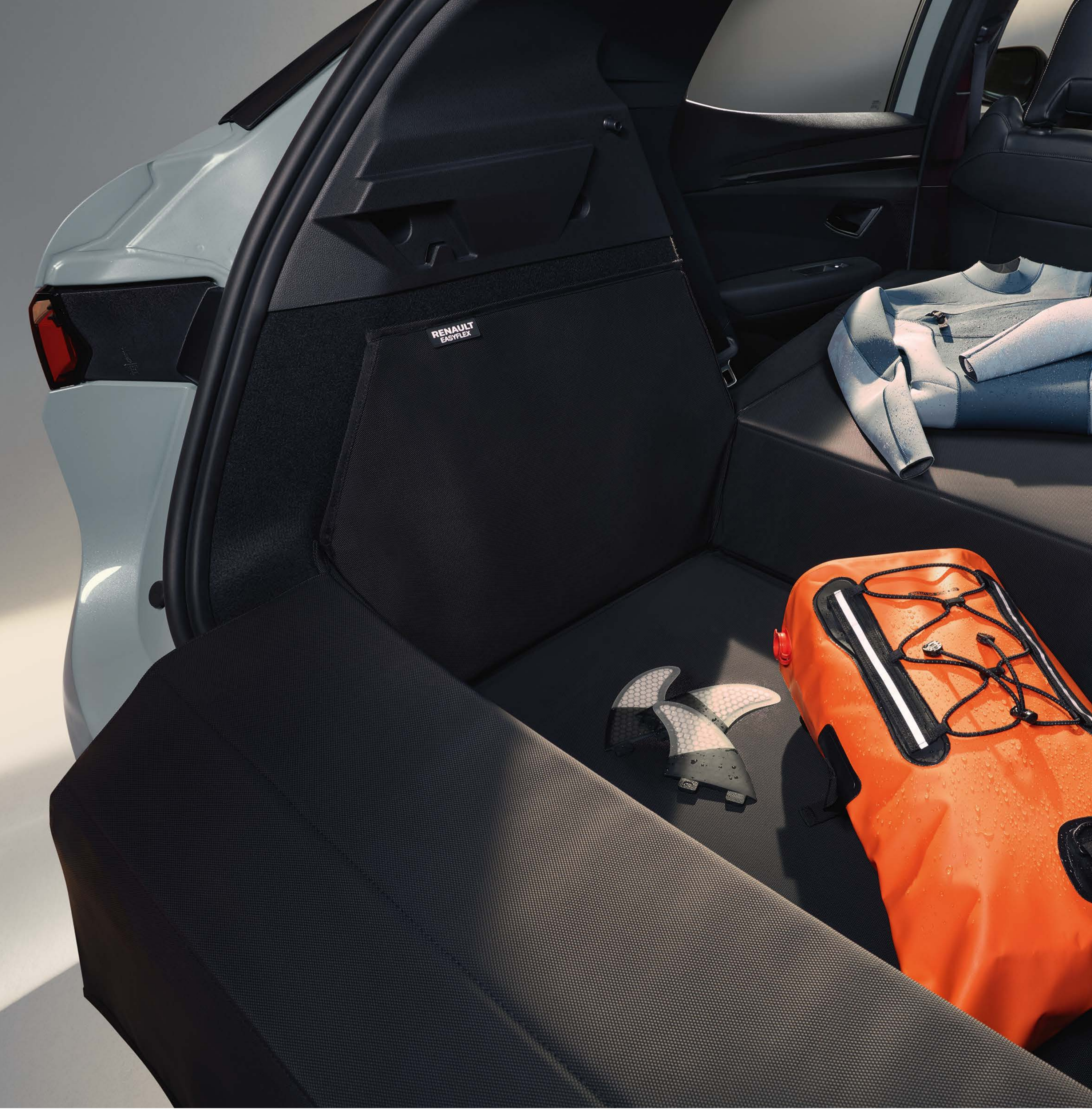
easyflex modüler bagaj koruması (82 01 740 236)

Sağanak yağışlar, kirli nesnelerin taşınması... Kaymaz ve su geçirmez easyflex modüler bagaj koruyucu, konfigürasyonu ne olursa olsun yük alanını kaplamak için katlanır ve açılır.