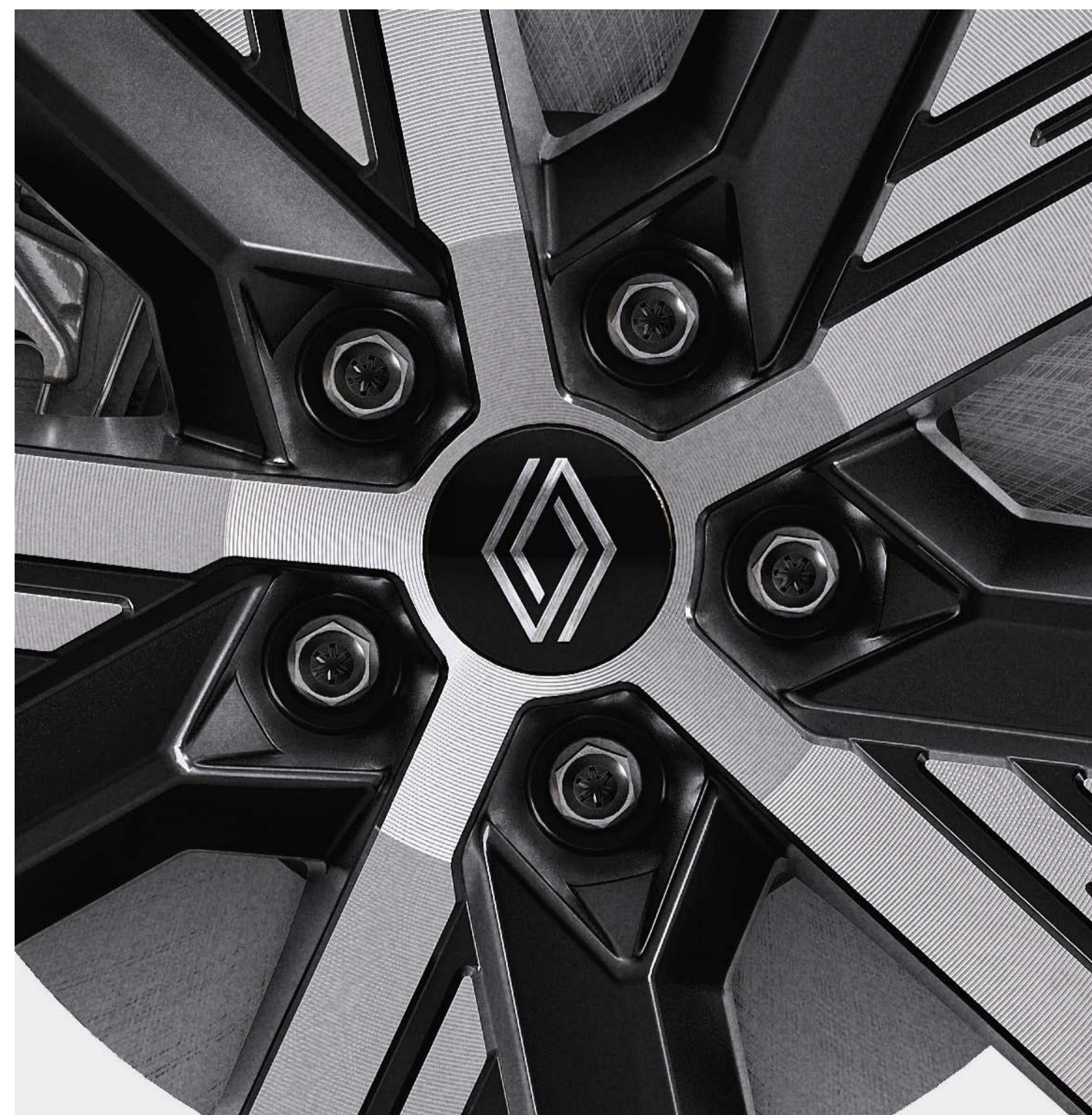
Renault novelR jant ve tekerlek kilitleri (40 31 535 00R) (82 01 724 186)