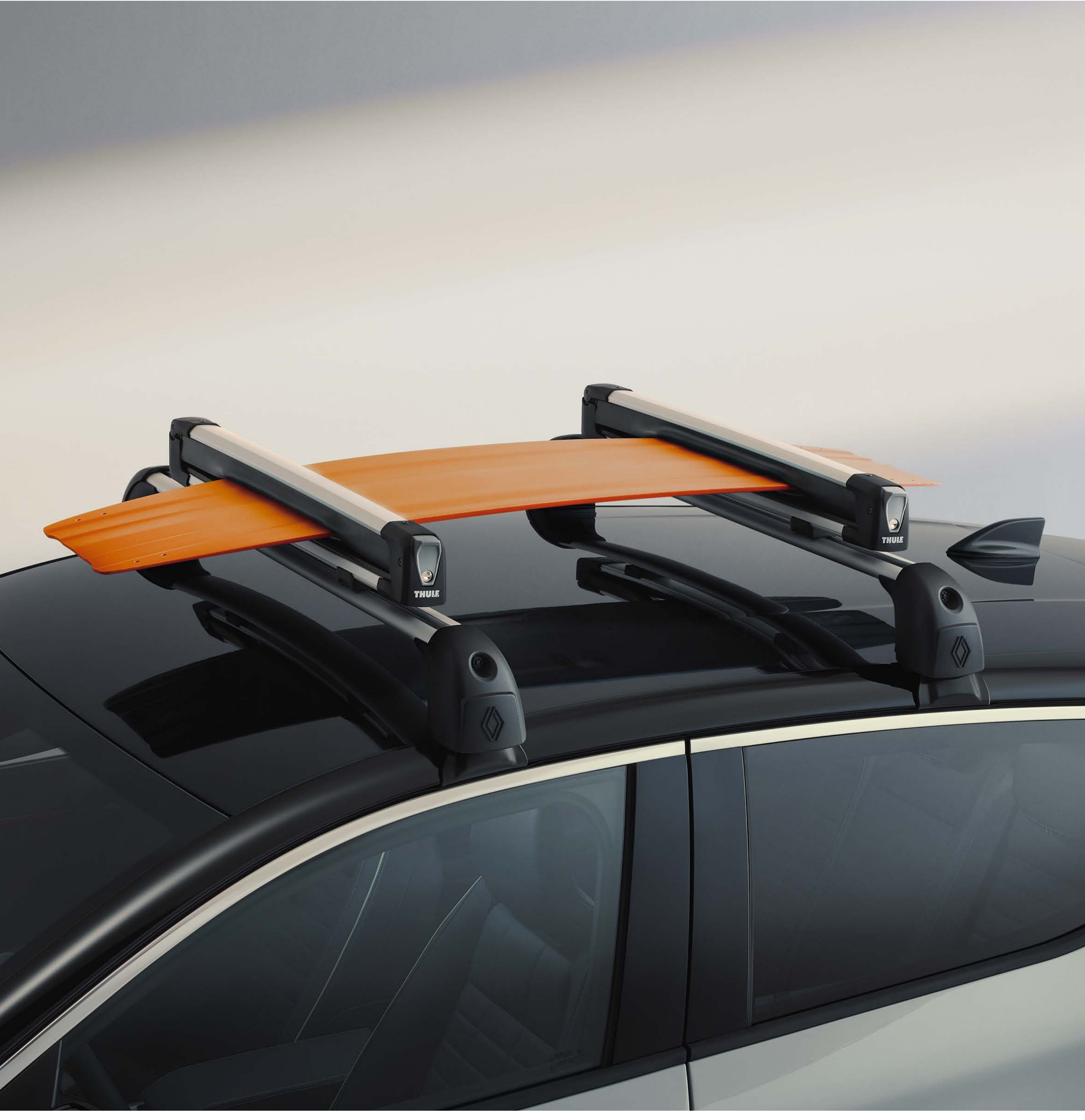
quickfix tavan barları ve thule snowpack kayak rafı 6 çift (73 21 017 89R) (77 11 940 001)

Aracınızın taşıma kapasitesini artırmak için ideal olan quickfix tavan barları 75 kg'a kadar destek olabilir.