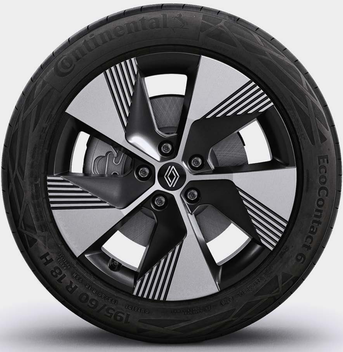
18" oston jant (40 30 020 15R)