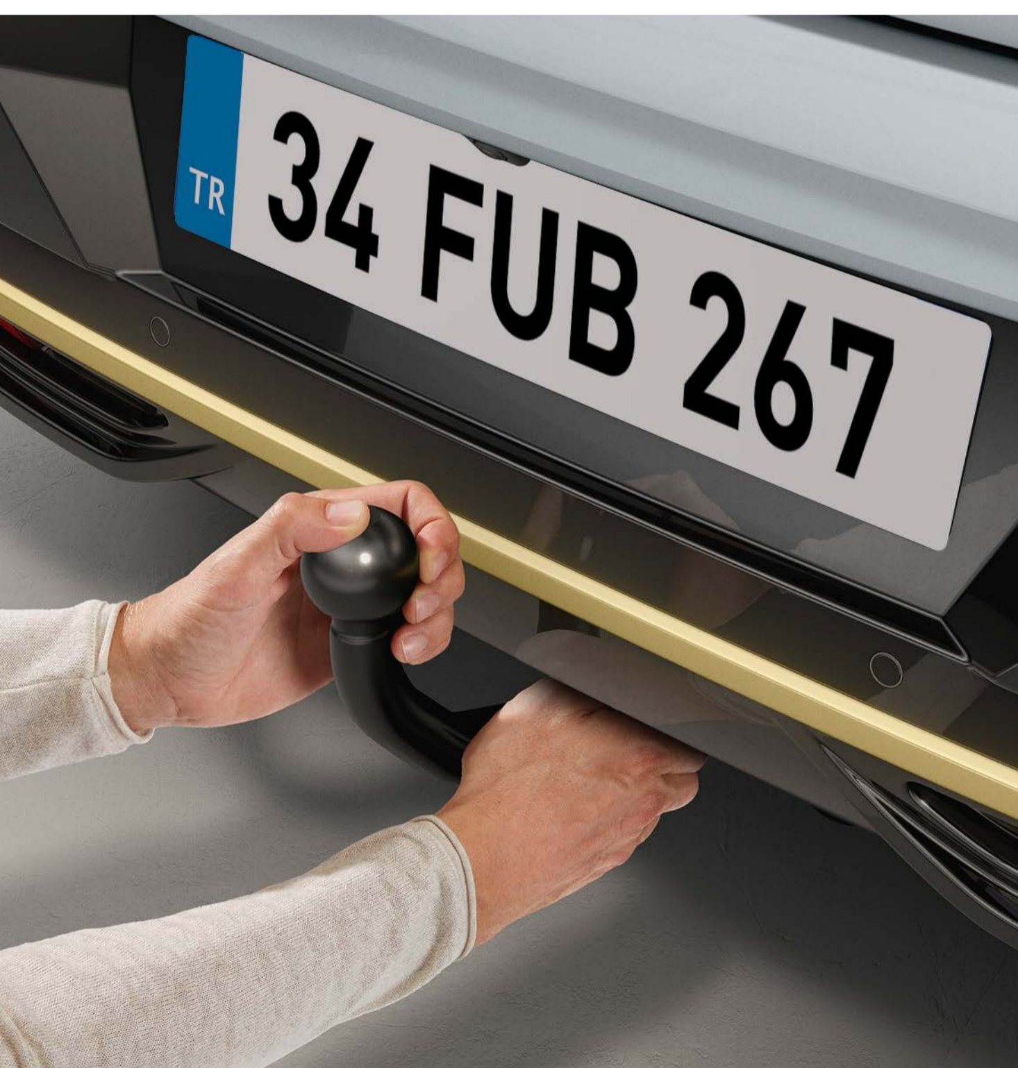
aletsiz çıkarılabilir çeki demiri paketi (77 11 948 076)