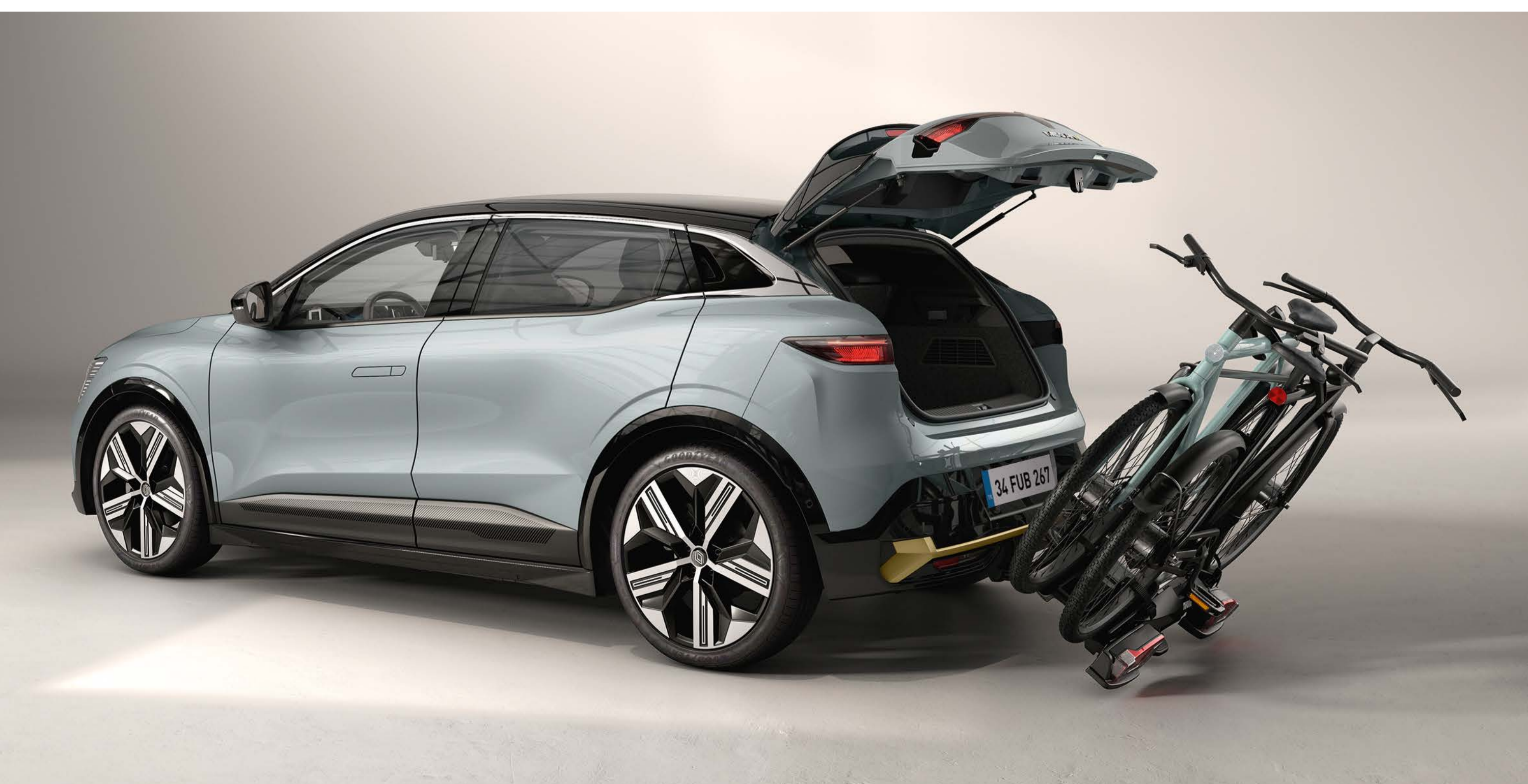
aletsiz çıkarılabilir çeki demiri ve 3 bisikletli bisiklet taşıyıcı paketi (77 11 948 076) (77 11 780 885)

Renault çeki demirleri 75 kg taşıma kapasitesine sahiptir, böylece ihtiyaçlarınız için doğru bisiklet taşıyıcısını seçebilirsiniz.