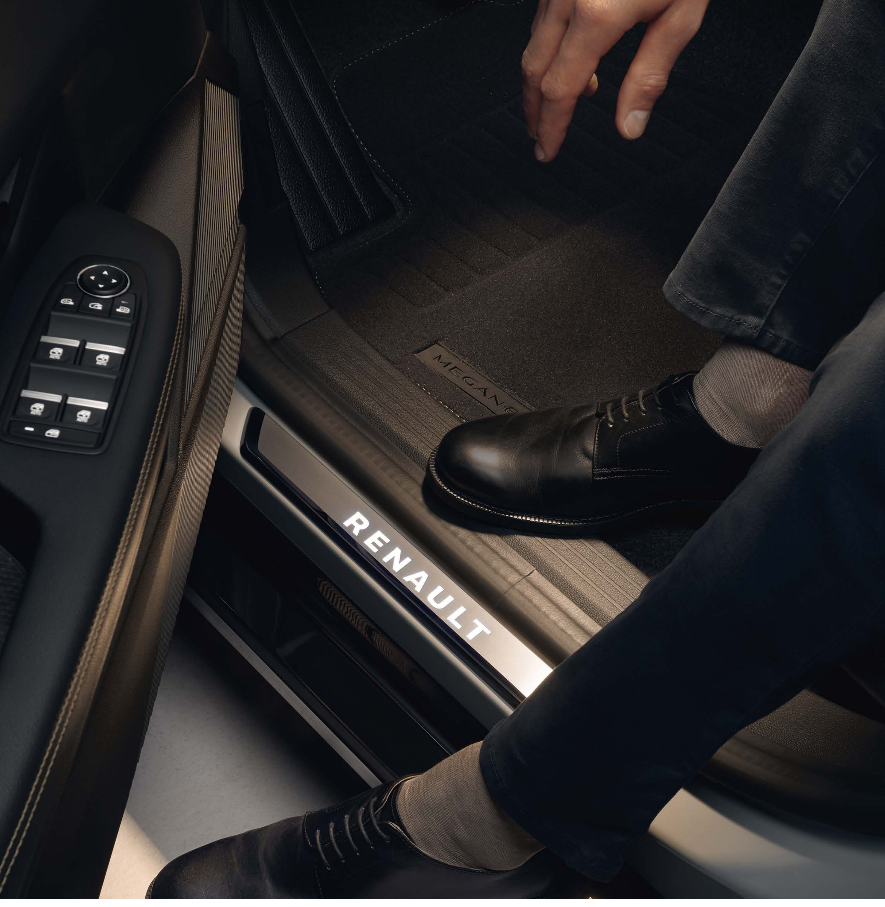
aydınlatmalı kapı eşikleri ve premium altın renkli kumaş paspaslar (882 01 731 140) (82 01 740 264)

Çelik kaplama ve zaman ayarlı ışıklı kapı eşikleriniz, koruyucu olduğu kadar kullanışlıdır.