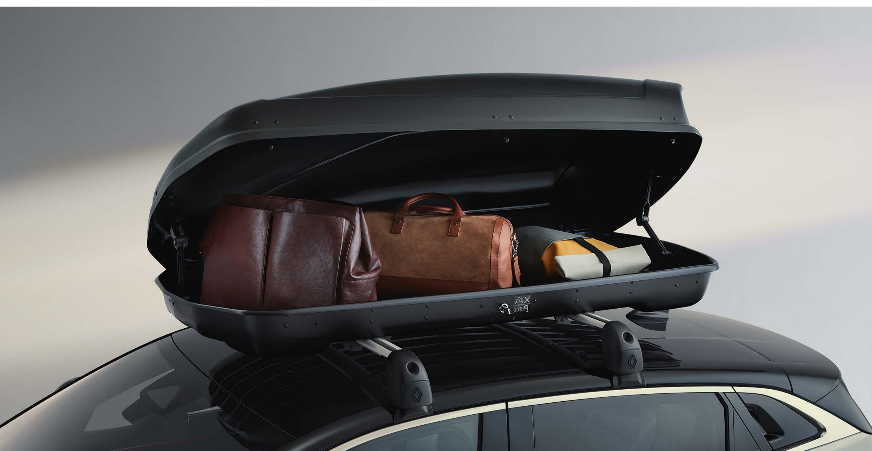
quickfix tavan barları ve Renault nouvelR 480 litre portbagaj (73 21 017 89R) (77 11 948 972)

Renault'nun 380 litre ile 630 litre arasında değişen kapasitelere sahip sabit portbagajları güvenli ve kilitlenebilir ek bir yük alanı sağlar.