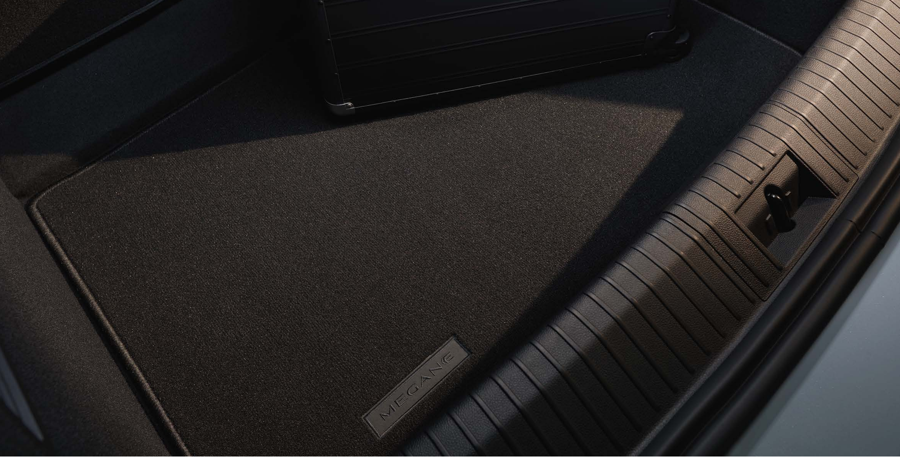
premium bagaj paspası (82 01 740 267)

Altın veya gümüş-gri dikişli premium paspaslarınızı seçin. Bagajınızı kir ve aşınmadan koruyan yüksek kaliteli bir bagaj havuzu ile tamamlayın.