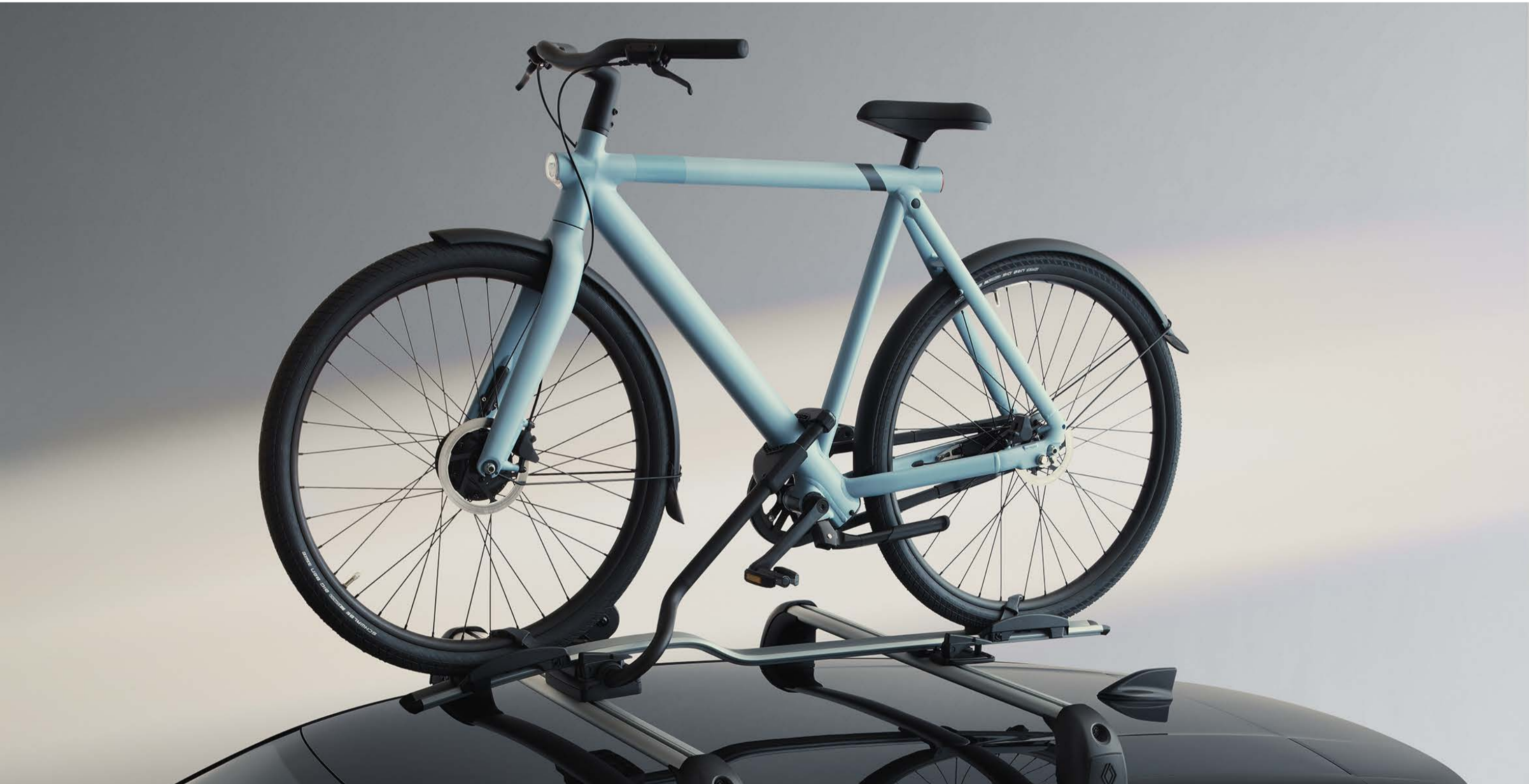
quickfix tavan barları ve uzman bisiklet taşıyıcı (73 21 017 89R) (77 11 780 147)

Görünürlüğünüzü azaltmadan ekipmanınızı kolay ve güvenli bir şekilde taşımak amacıyla 6 çifte kadar kayak için bir kayak askısı veya bir bisiklet askısı takabilirsiniz.