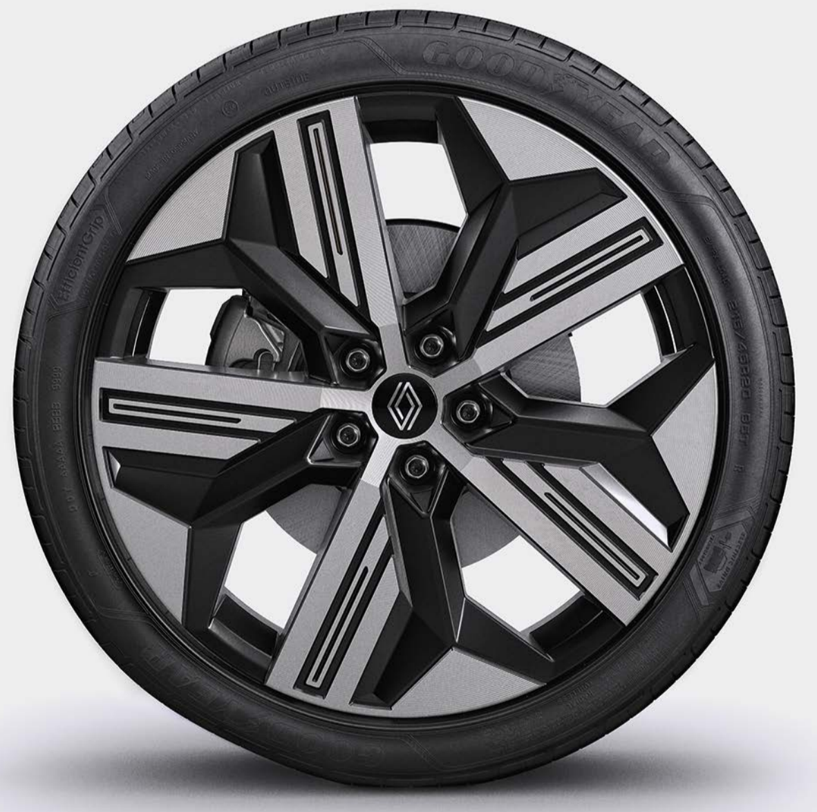
20" enos jant (40 30 085 08R)