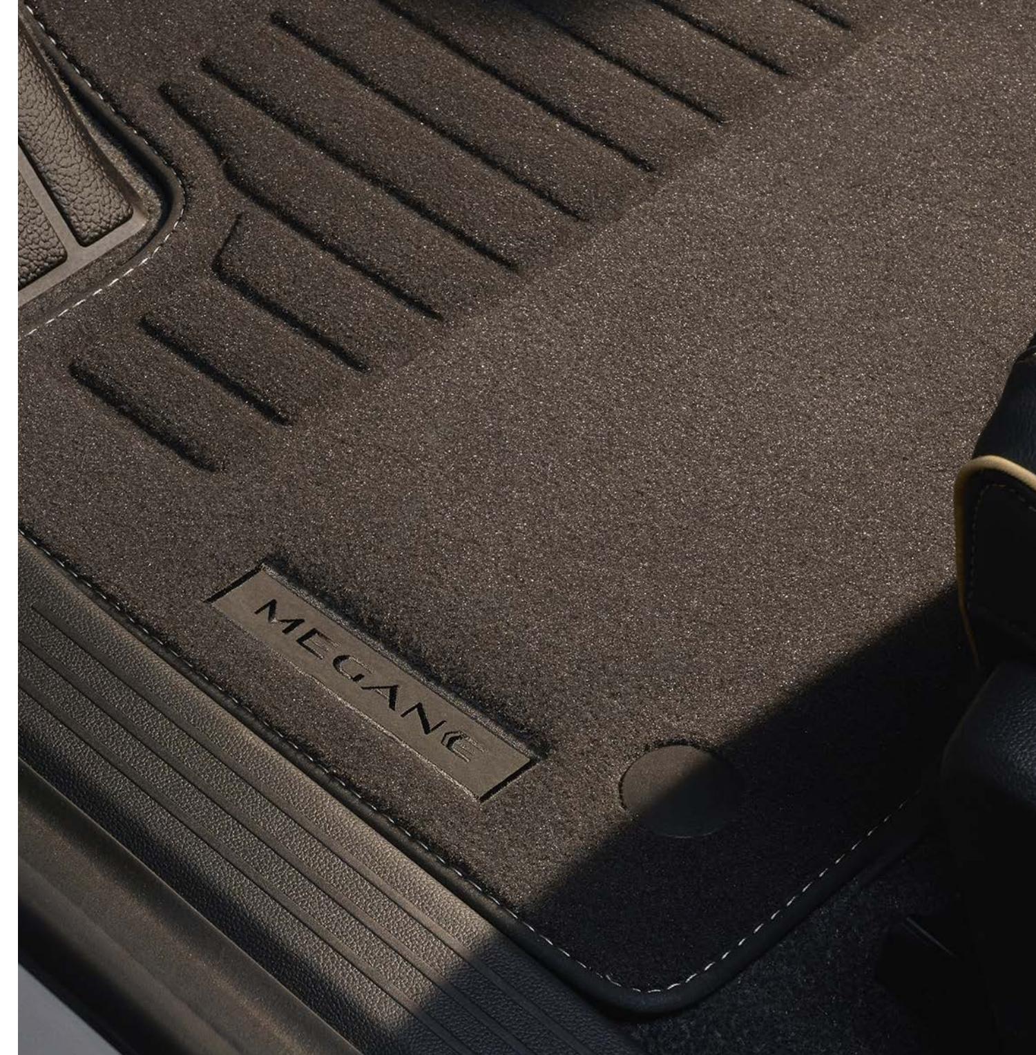
premium halı paspaslar (820 174 02 62)