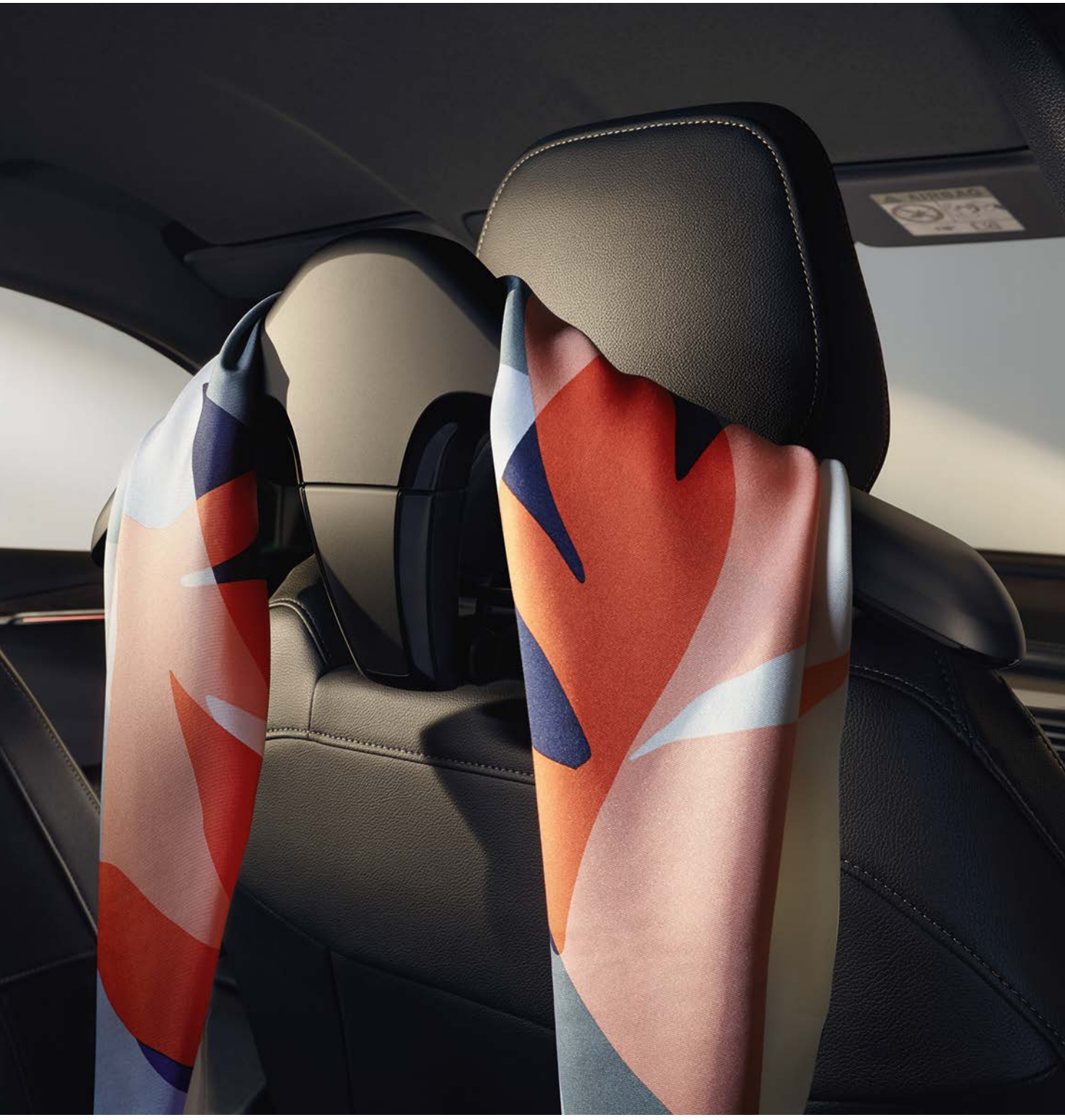
çok işlevli askı (77 11 785 946)