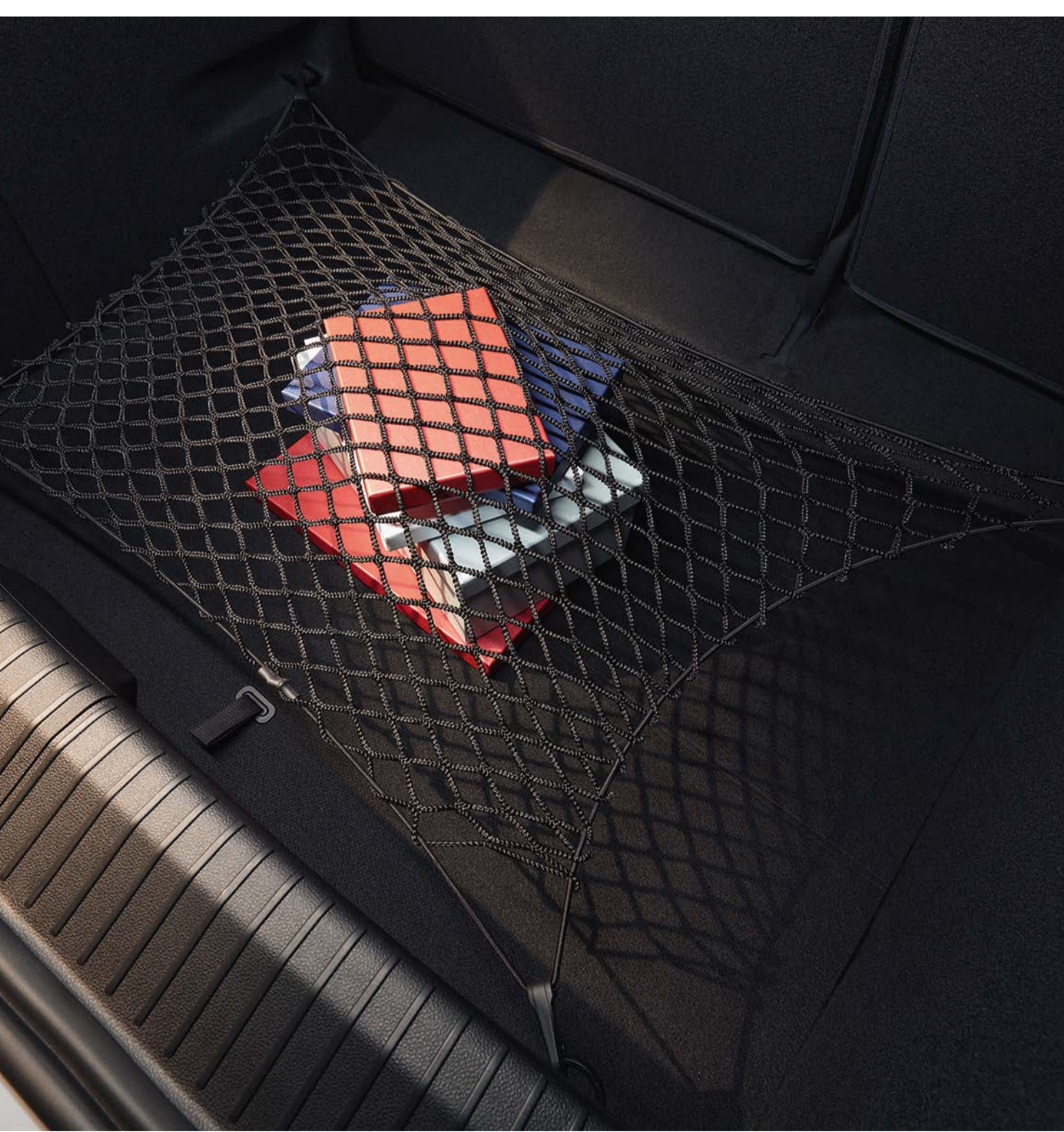
yatay bagaj saklama filesi (77 11 227 501)

Dikey veya yatay depolama ağı sayesinde kişisel eşyalarınız güvenle muhafaza edilir.