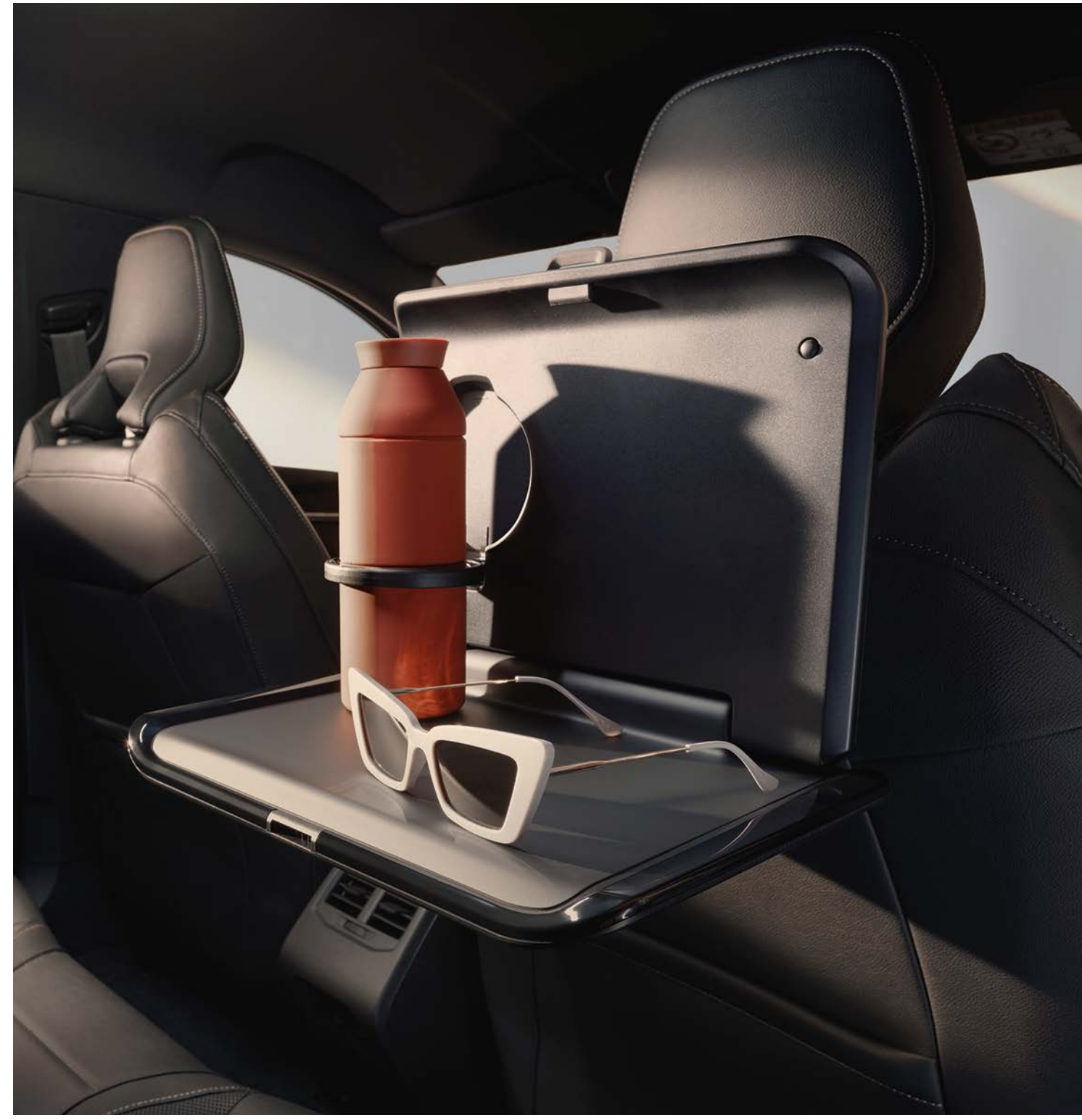
çok işlevli arka raf (77 11 785 947)