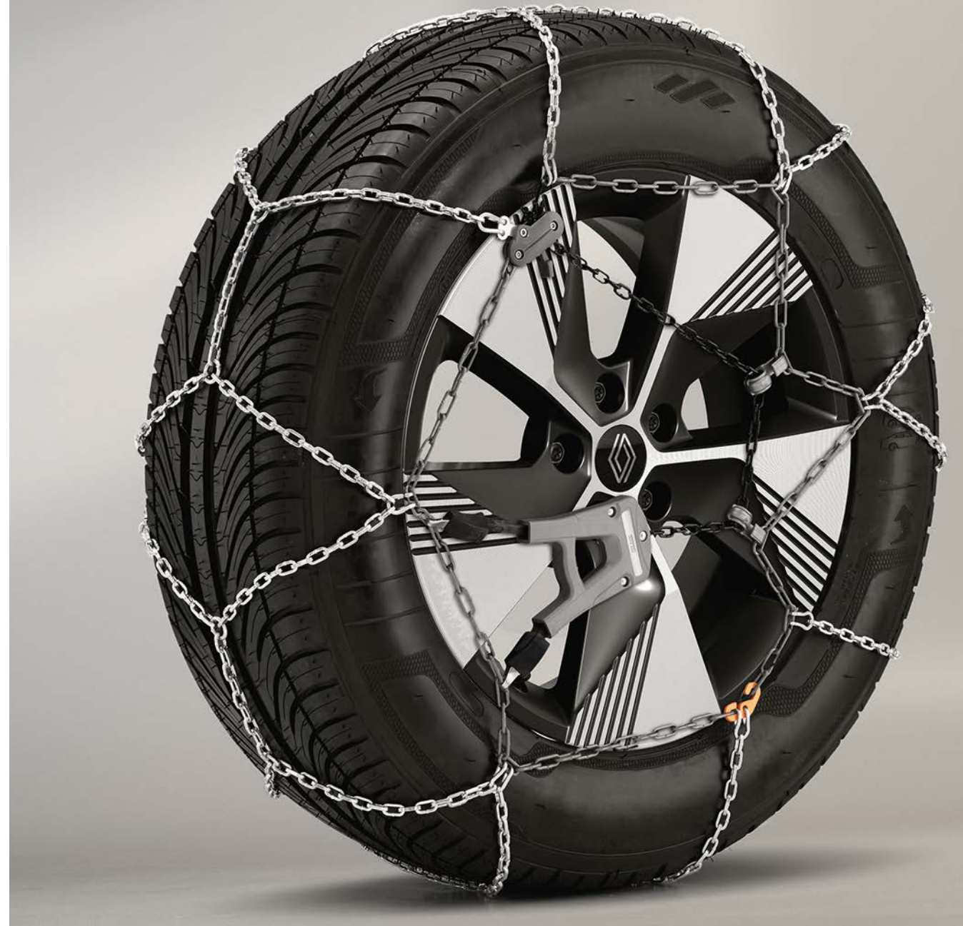
standart kar zincirleri 9 mm (77 11 578 472)