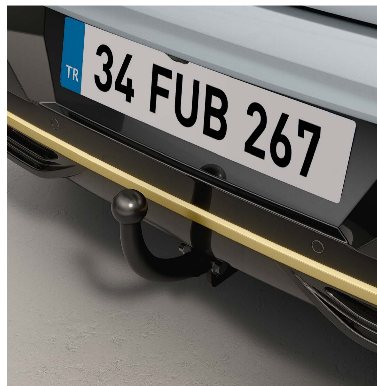
kaz boynu çekme paketi (77 11 948 077)

Renault çeki demirleri 75 kg taşıma kapasitesine sahiptir, böylece ihtiyaçlarınız için doğru bisiklet taşıyıcısını seçebilirsiniz.