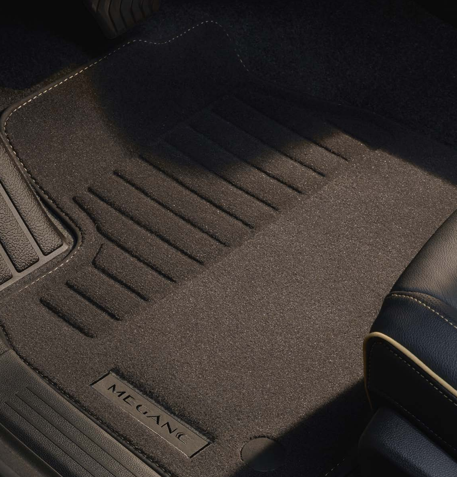
premium altın rengi halı paspaslar (82 01 740 264)