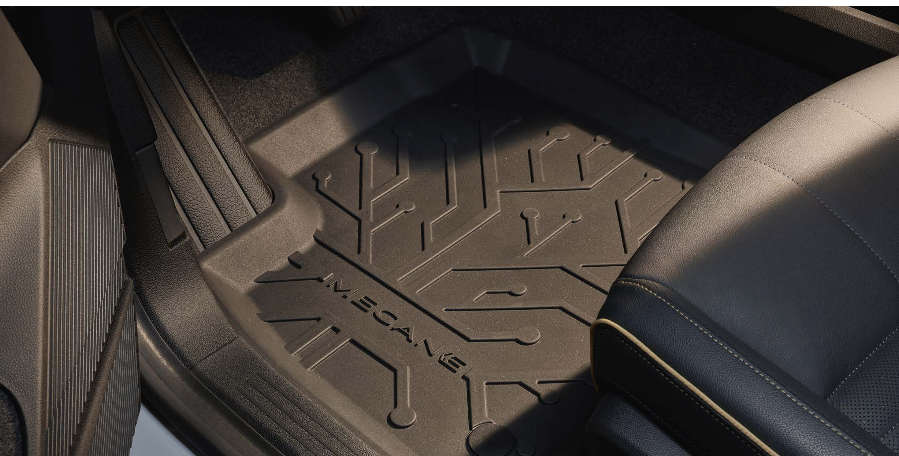
kauçuk paspaslar (82 01 738 743)