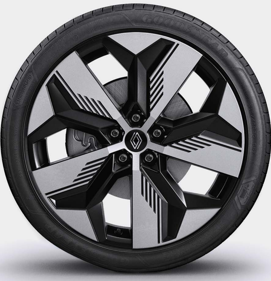
20" soren jant (40 30 066 32R)

Kar zincirine mi ihtiyacınız var? 18" jantları tercih edin. Kendinizi 20" jantlarla şımartın.