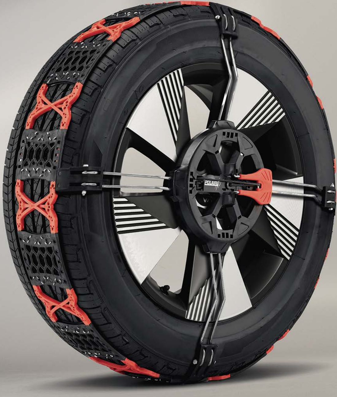
premium grip kar zincirleri (77 11 780 259)

Premium grip* kar zincirlerinin sezgisel otomatik montajı sayesinde kurulumu kolaydır, kar ve buz üzerinde optimum tutuş sağlar.