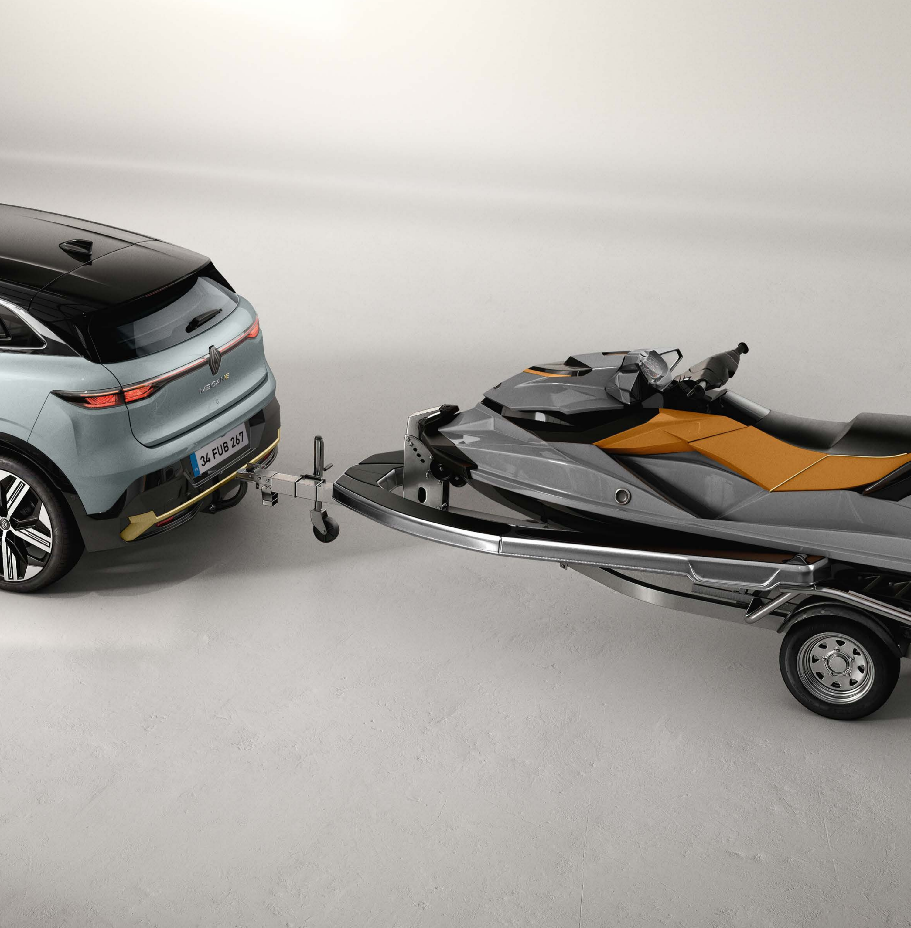
aletsiz çıkarılabilir çeki demiri paketi (77 11 948 076)

elektrikli Megane E-Tech olağanüstü bir çekme kapasitesi sunuyor: 220 hp model için 900 kg'a kadar, bir jet-ski veya küçük bir tekne almaya yetecek imkân sunar.