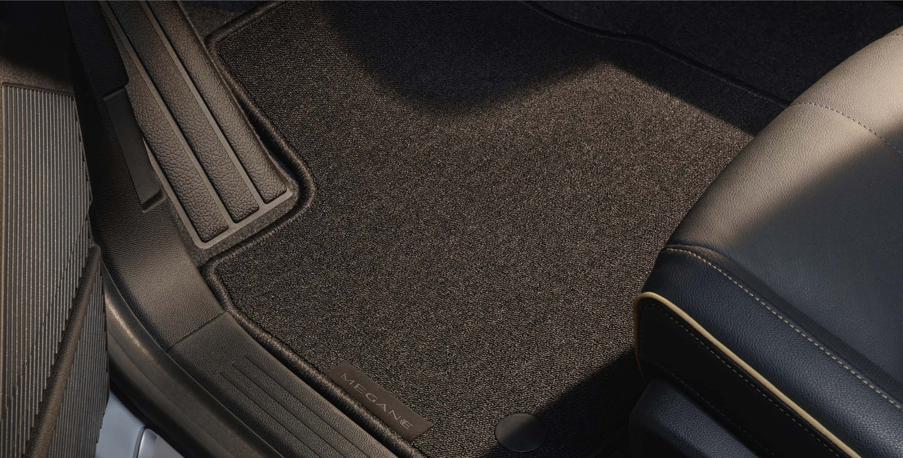
konfor halı paspas (82 01 740 259)

Aracınızın iç mekânını güvenli klipslerle hızlıca sabitlenebilen bir dizi bireysel paspasla koruyun. Ultra sağlam tokalı paspasın ve yüksek kenarlı su geçirmez kauçuk paspasların bakımı kolaydır.