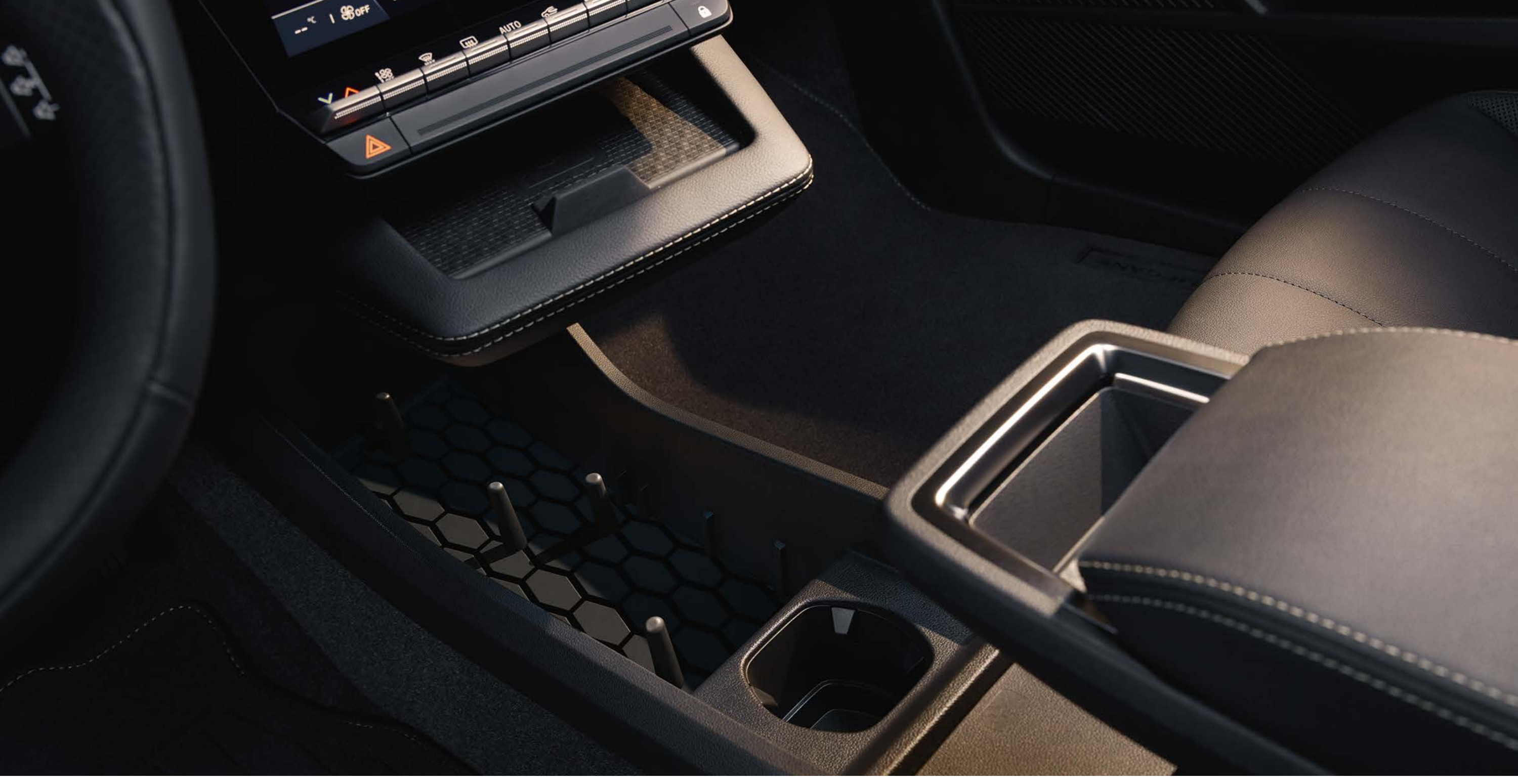
modüler orta konsol düzenleyici (98 49 004 73R)

Basit ve yenilikçi orta konsol düzenleyici; defter, günlük, telefon, cüzdan vb. kişisel eşyalarınızı elinizin altında tutmak için serbestçe konumlandırılabilen pimler sayesinde modüler bir yapıya sahiptir.