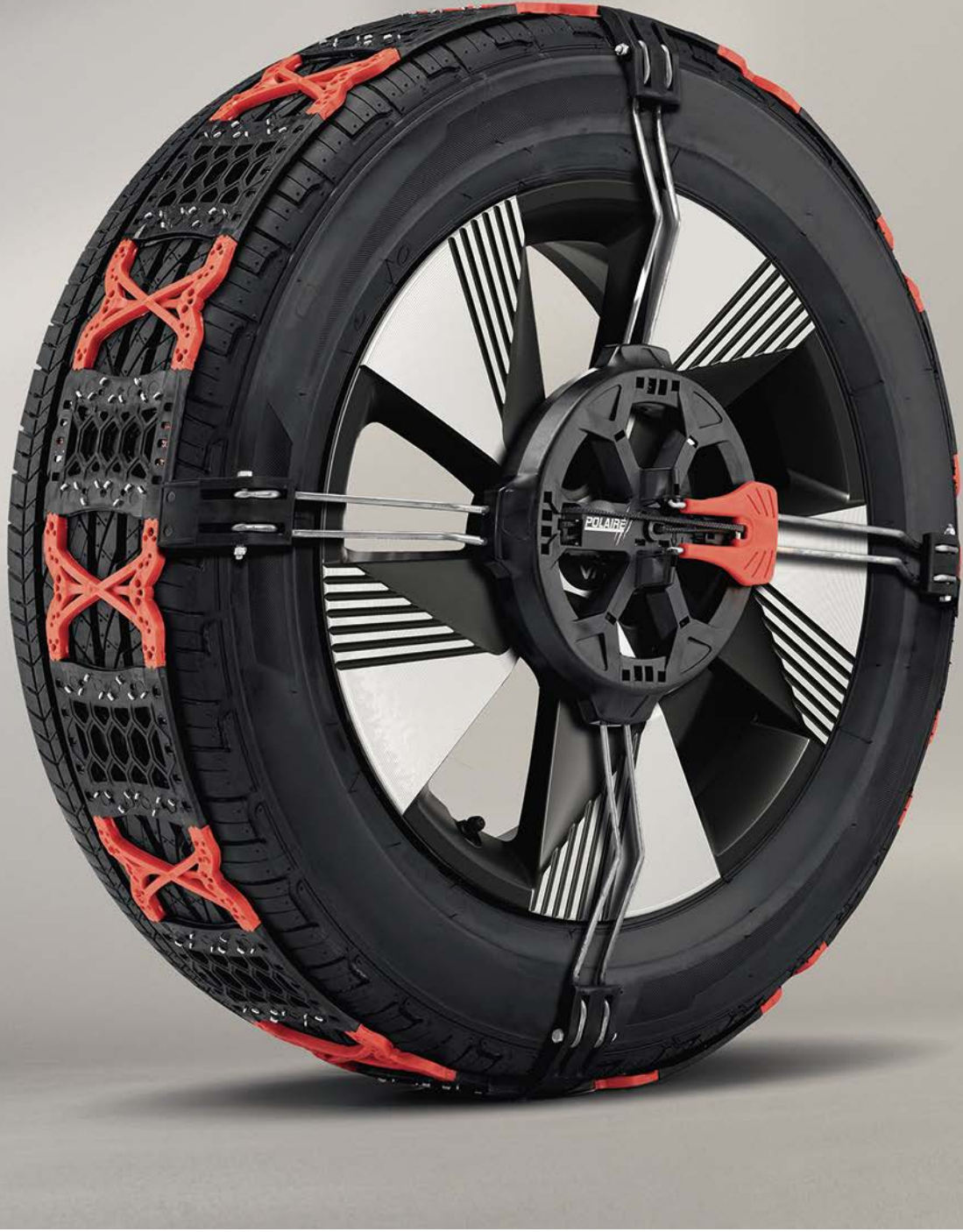
premium grip kar zincirleri (77 11 780 259)

Premium grip* kar zincirlerinin sezgisel otomatik montajı sayesinde kurulumu kolaydır, kar ve buz üzerinde optimum tutuş sağlar.