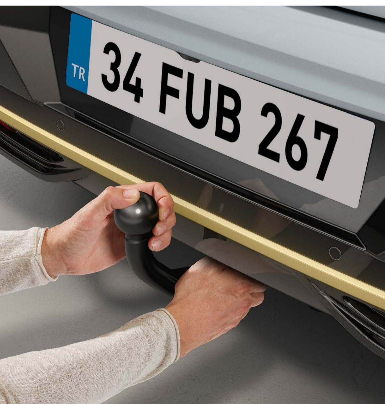
altsiz çıkarılabilir çeki demiri paketi (77 11 948 076)