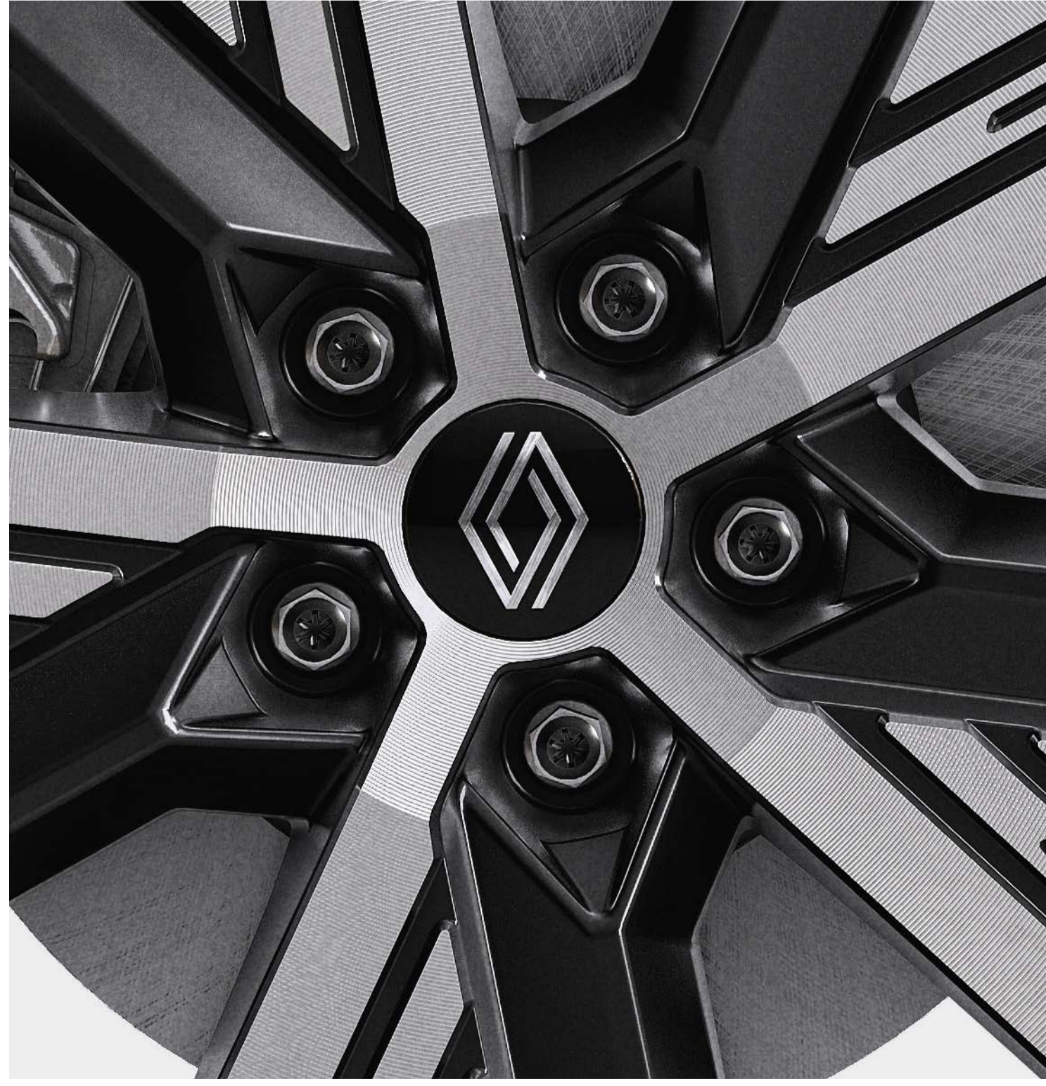
Renault nouvelR jant ve tekerlek kilitleri (40 31 535 00R) (82 01 724 186)