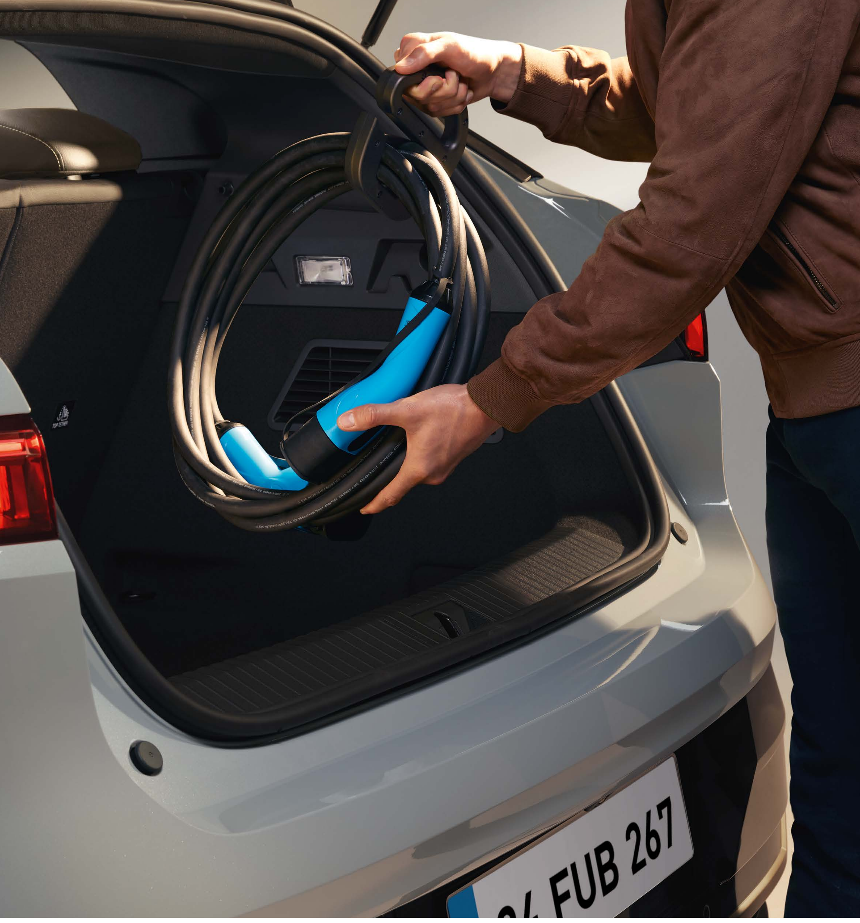
řarj kablosu iin aparat (82 01 738 553)

Standart olarak, 5 m mod 3 řarj kablosu ev ve halka aık řarj noktalarında kullanılabilir. Daha fazla olanak iin bu kablounun aksesuar olarak 6,5 m'lik versiyonu da mevcuttur.