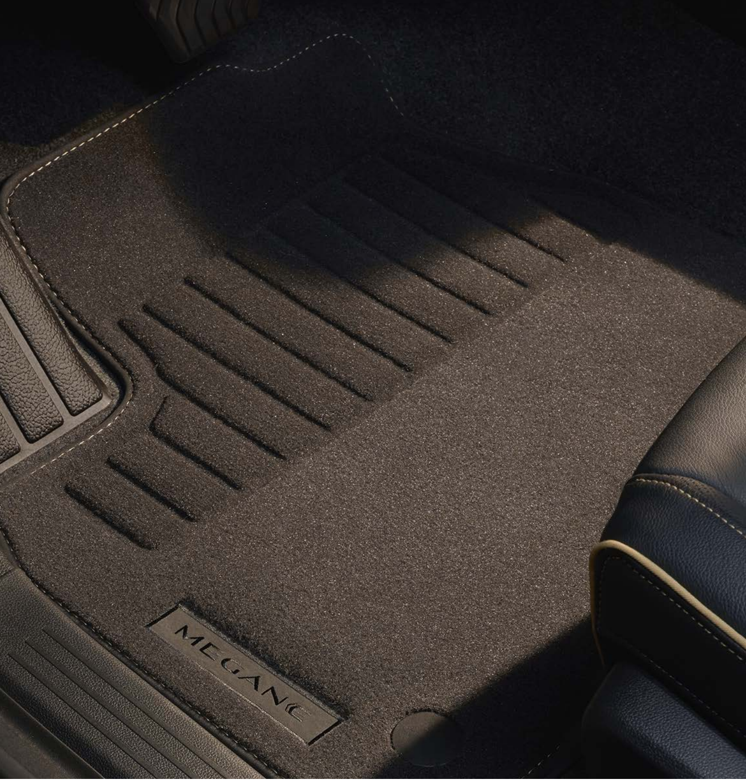
premium altın rengi halı paspaslar (82 01 740 264)