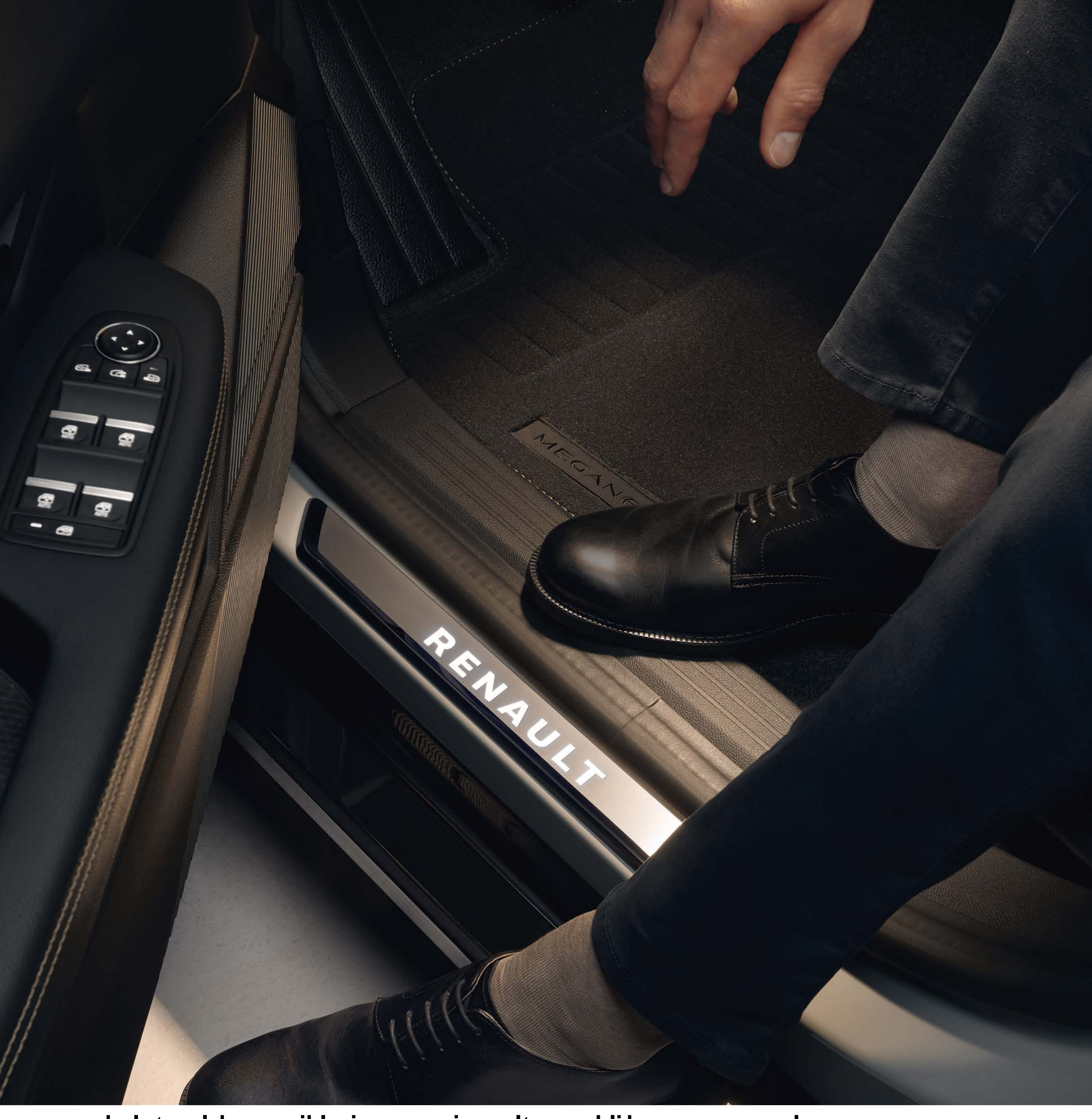
aydınlatmalı kapı eşikleri ve premium altın renkli kumaş paspaslar (882 01 731 140) (82 01 740 264)

Çelik kaplama ve zaman ayarlı ışıklı kapı eşikleriniz, koruyucu olduğu kadar kullanışlıdır.