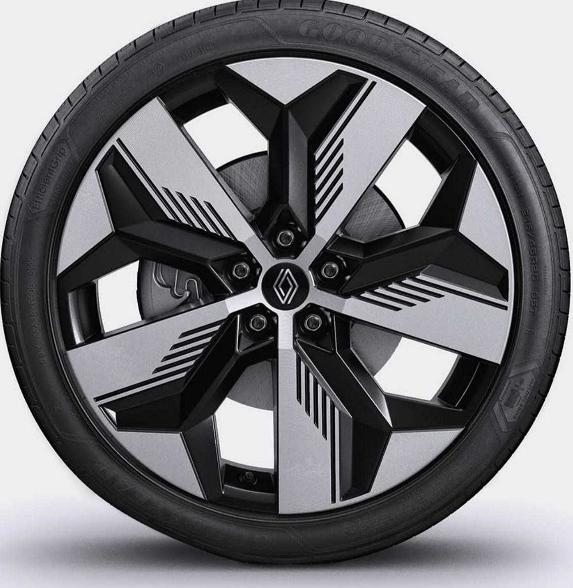
20" soren jant (40 30 066 32R)

Kar zincirine mi ihtiyacınız var? 18" jantları tercih edin. Kendinizi 20" jantlarla şımartın.