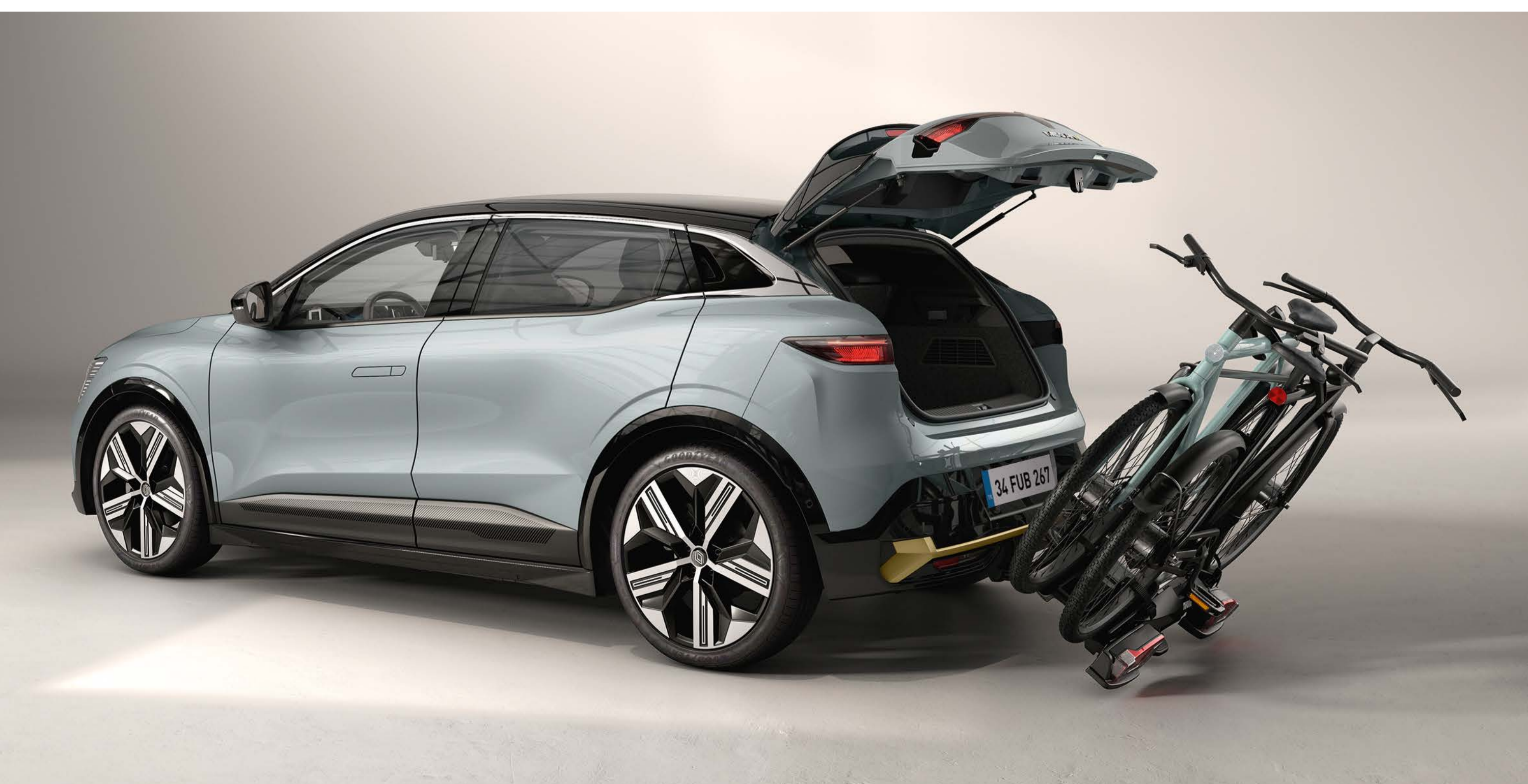
altsiz çıkarılabilir çeki demiri ve 3 bisikletli bisiklet taşıyıcı paketi (77 11 948 076) (77 11 780 885)

Renault çeki demirleri 75 kg taşıma kapasitesine sahiptir, böylece ihtiyaçlarınız için doğru bisiklet taşıyıcısını seçebilirsiniz.