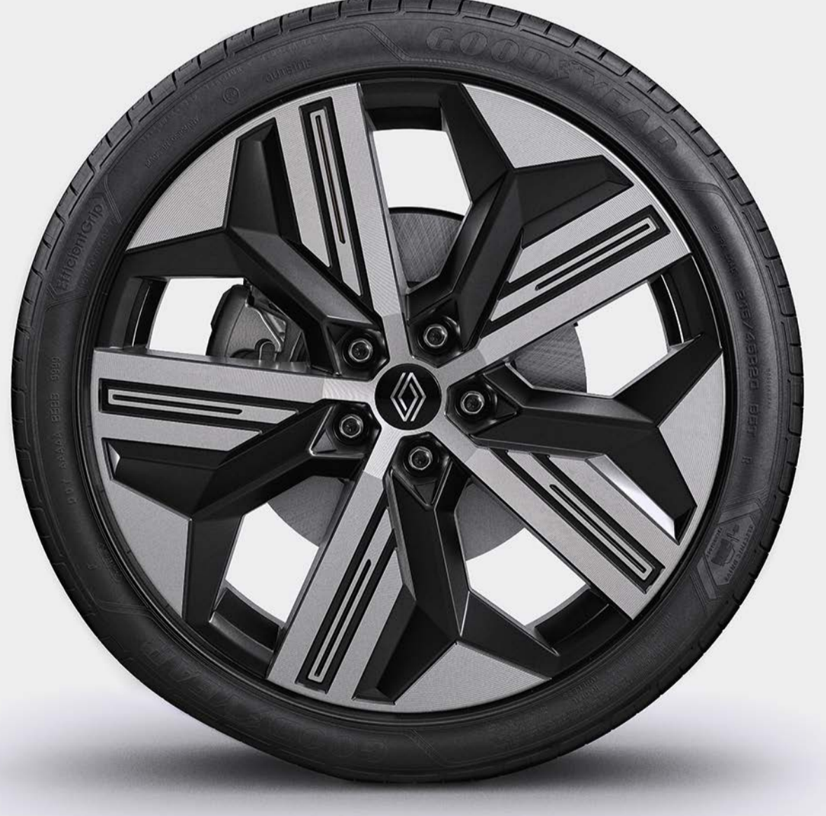
20" enos jant (40 30 085 08R)