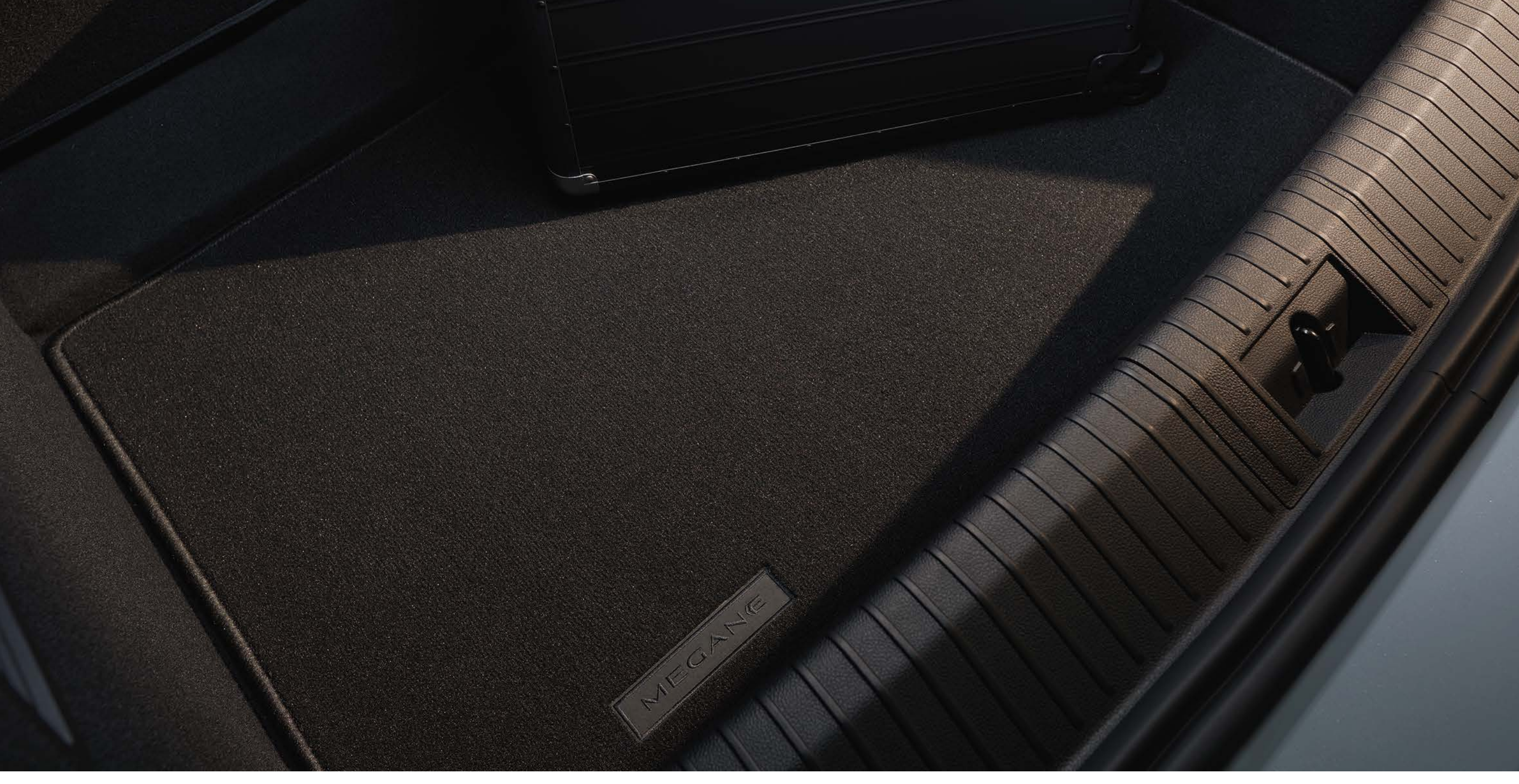
premium bagaj paspası (82 01 740 267)

Altın veya gümüş-gri dikişli premium paspaslarınızı seçin. Bagajınızı kir ve aşınmadan koruyan yüksek kaliteli bir bagaj havuzu ile tamamlayın.