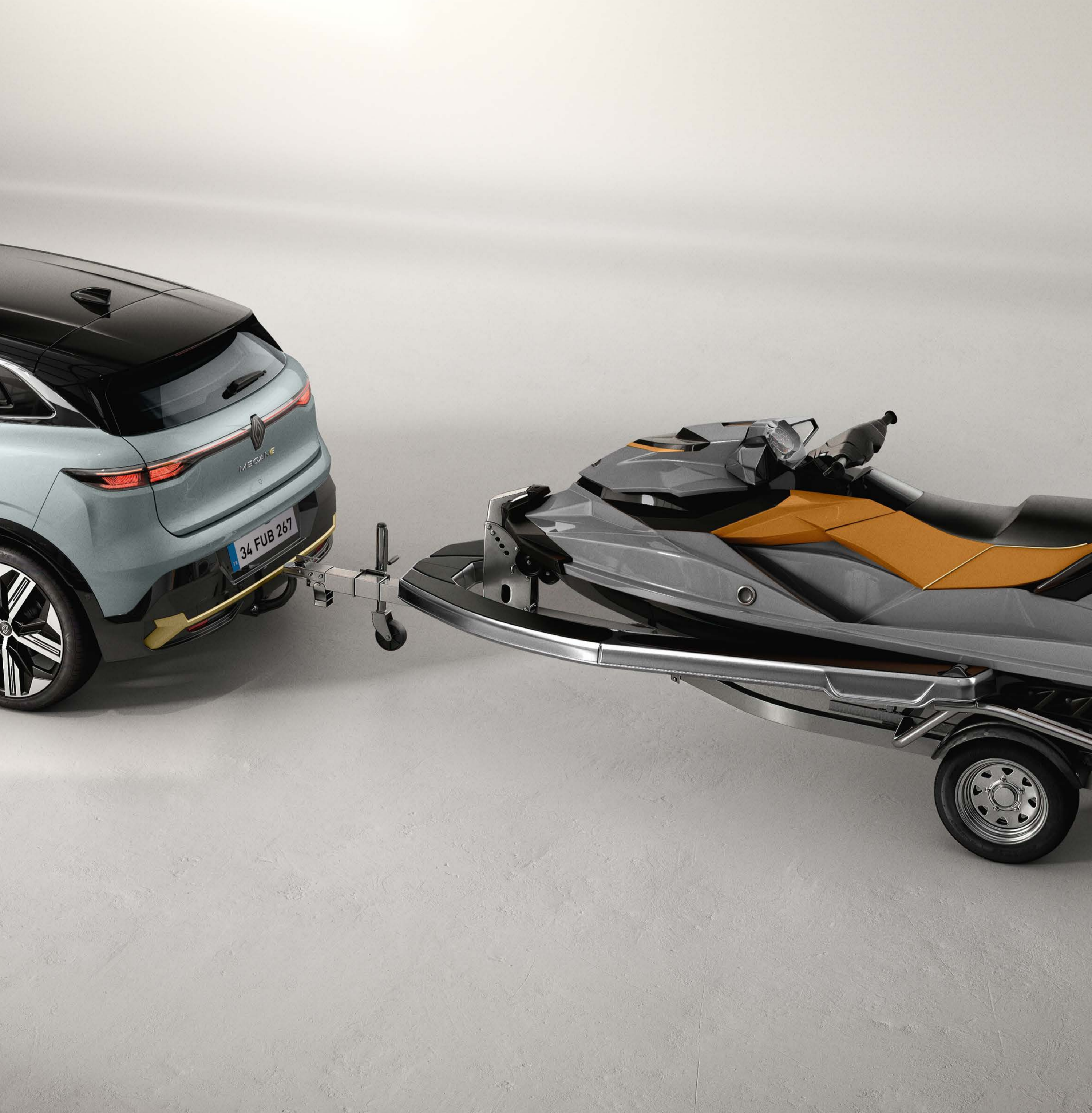
altsiz çıkarılabilir çeki demiri paketi (77 11 948 076)

%100 elektrikli Megane E-Tech olağanüstü bir çekme kapasitesi sunuyor: 220 hp model için 900 kg'a kadar, bir jet-ski veya küçük bir tekne almaya yetecek imkân sunar.