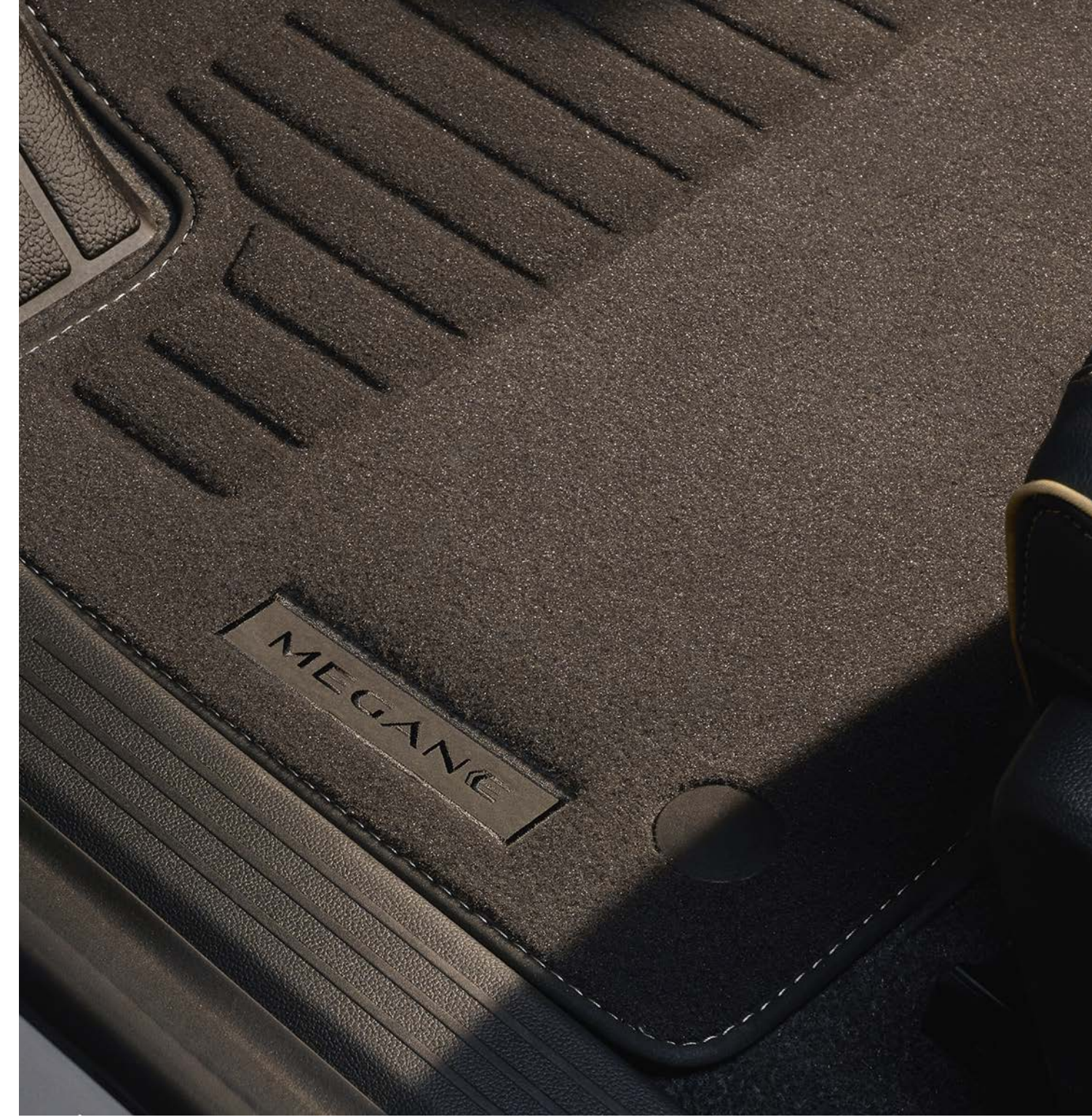
premium halı paspaslar (820 174 02 62)