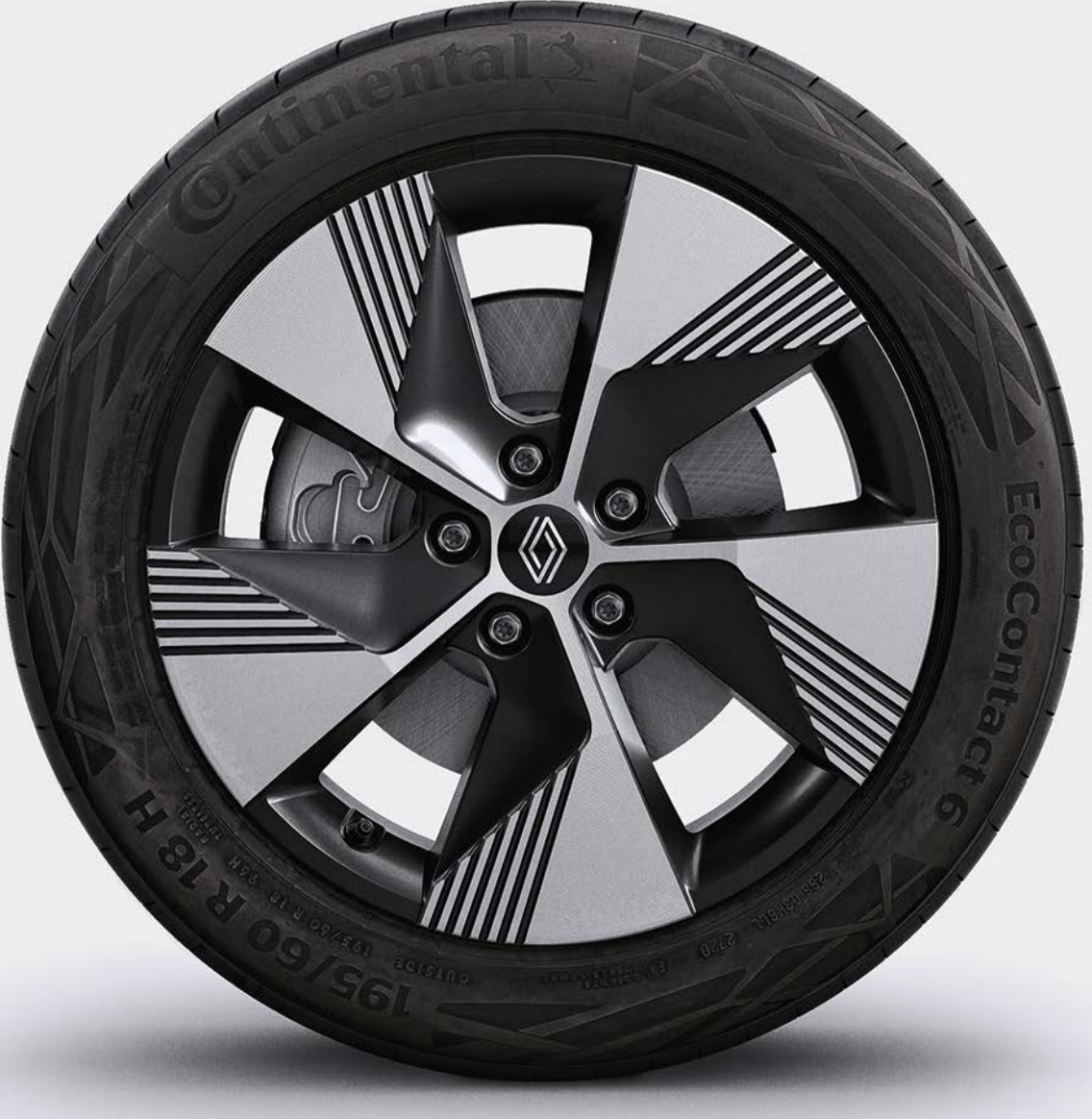
18" oston jant (40 30 020 15R)