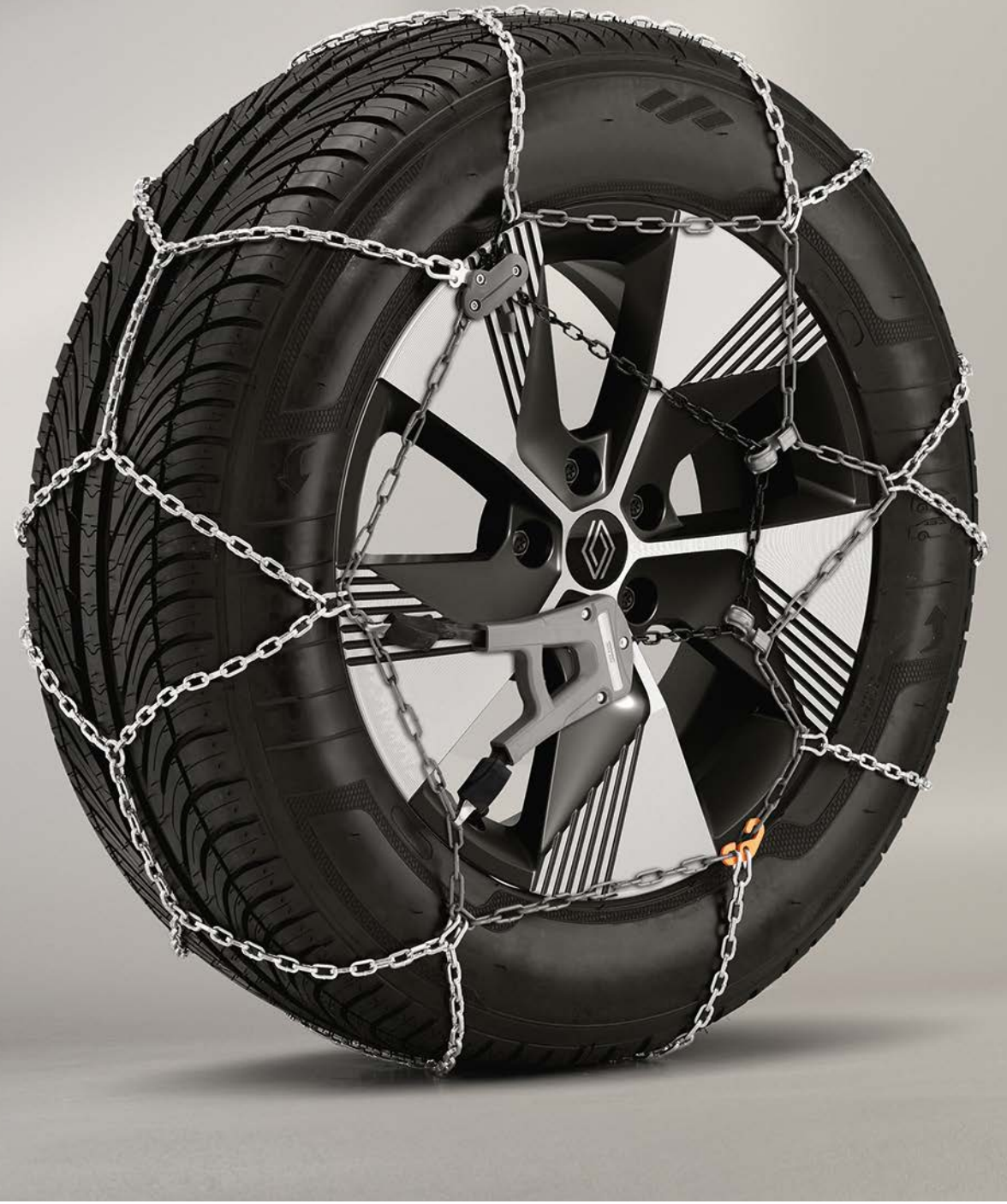
standart kar zincirleri 9 mm (77 11 578 472)