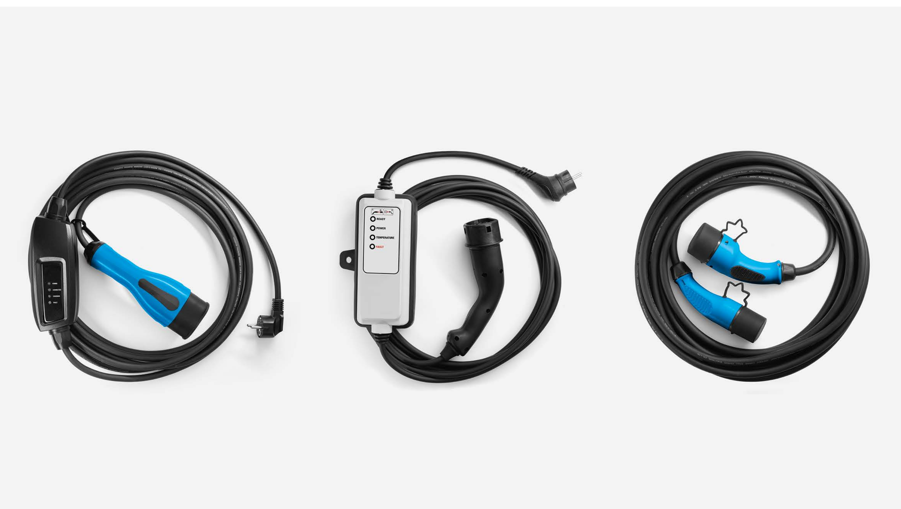
mod 2 ev tipi řarj kablosu, mod 2 esnek řarj kablosu, mod 3 kablosu (77 11 943 515) (29 69 097 51R) (77 11 943 517)

Güçlendirilmiş ev tipi prizle kullanım iin esnek řarj kablosunu (2 saat/50 km) ve/veya standart prizlerle kullanım iin ev tipi kabloyu (3 saat/20-50 km) tercih edin. Ve daha fazla rahatlık iin kablo tařıma aparatını kullanın.