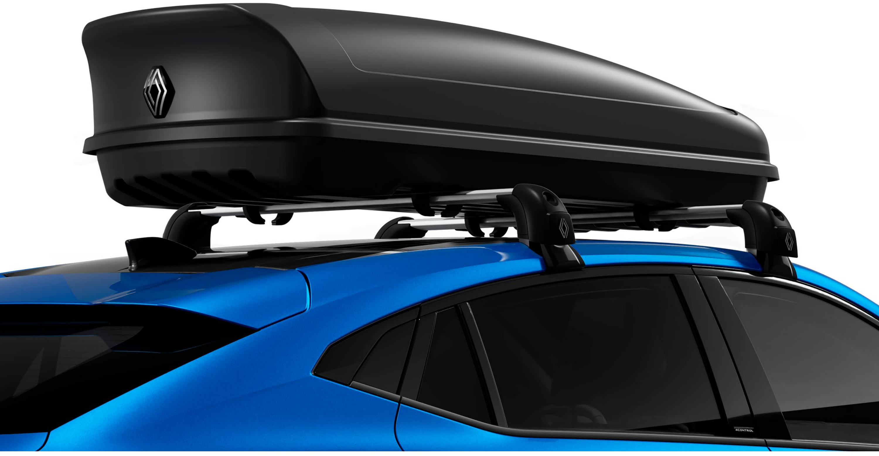
480-litre Renault roof locker on roof bars

Renault portbagaj yelpazesi 630 litreye kadar taşıma kapasitesine sahiptir. Sert ve kilitlenebilir olan bu portbagajlar, ek bagajlar için saklama alanı sunarak aracın içindeki premium atmosferi korur.