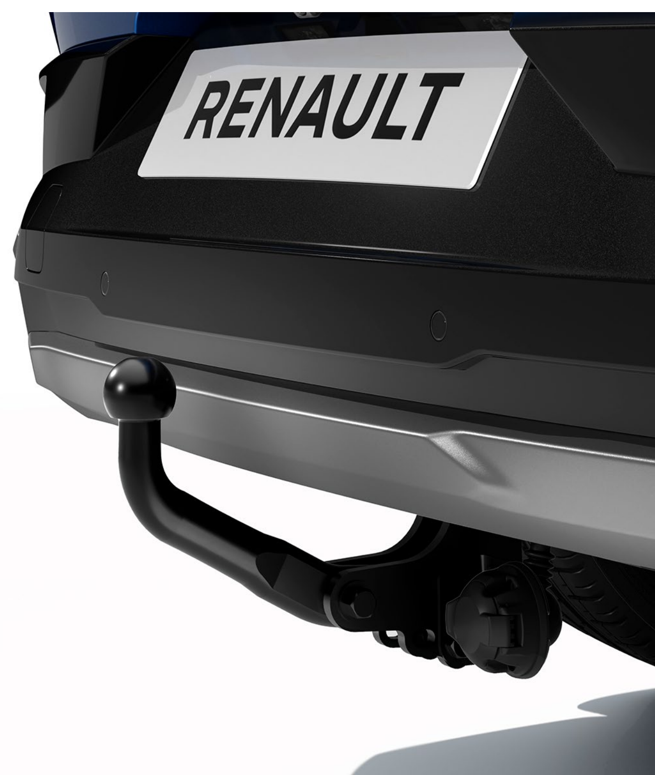
kuğu boyunlu çeki demiri