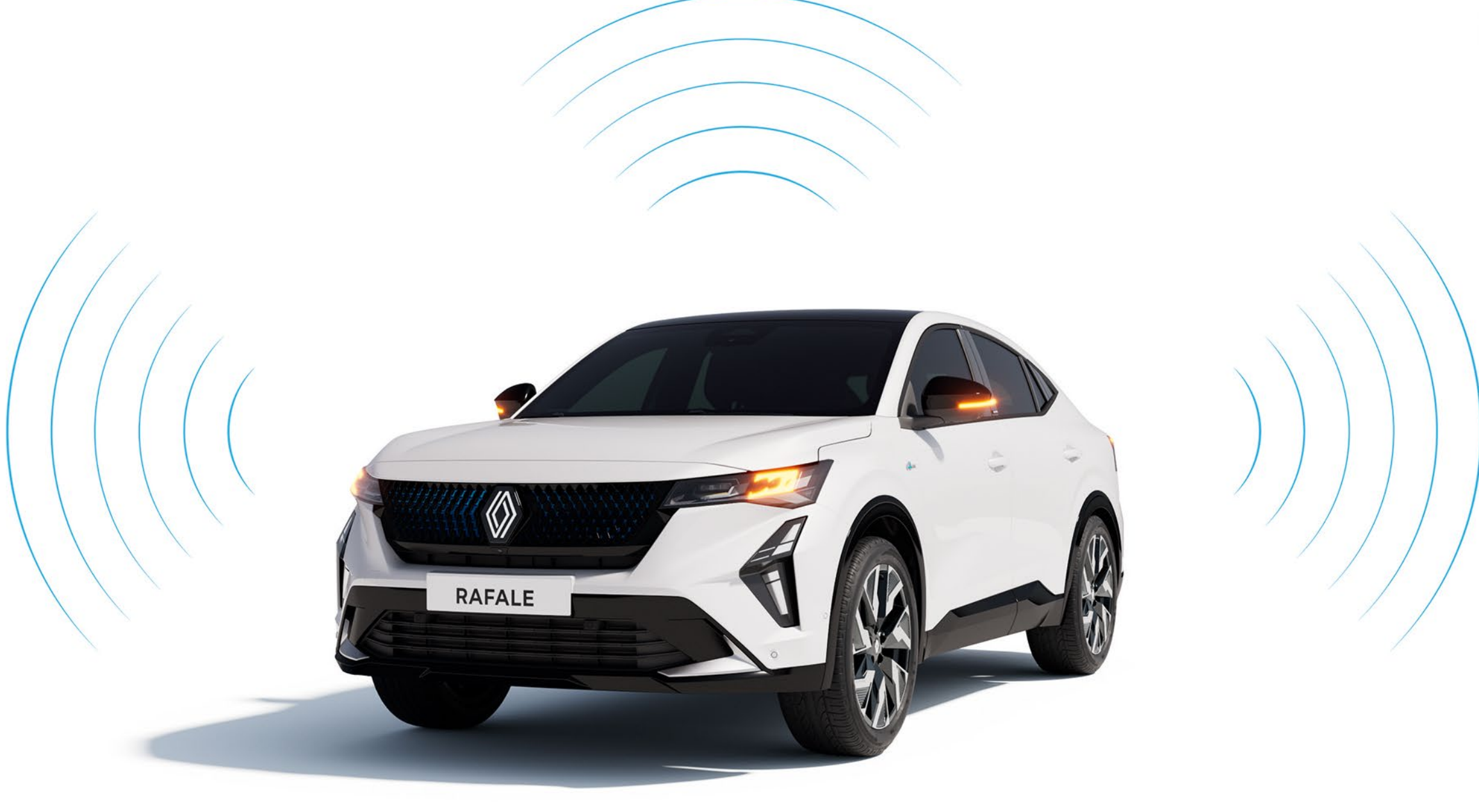
çevresel ve hacimsel alarm

Her türlü açma, zorla girme veya hareket ettirme girişimini algılayan bir alarmla aracınızın güvenliğini sağlayın. Kokpite, gerektiğinde hızlıca erişip etkinleştirebileceğiniz bir yangın söndürücü yerleştirerek güvenliğinizi sağlayın.