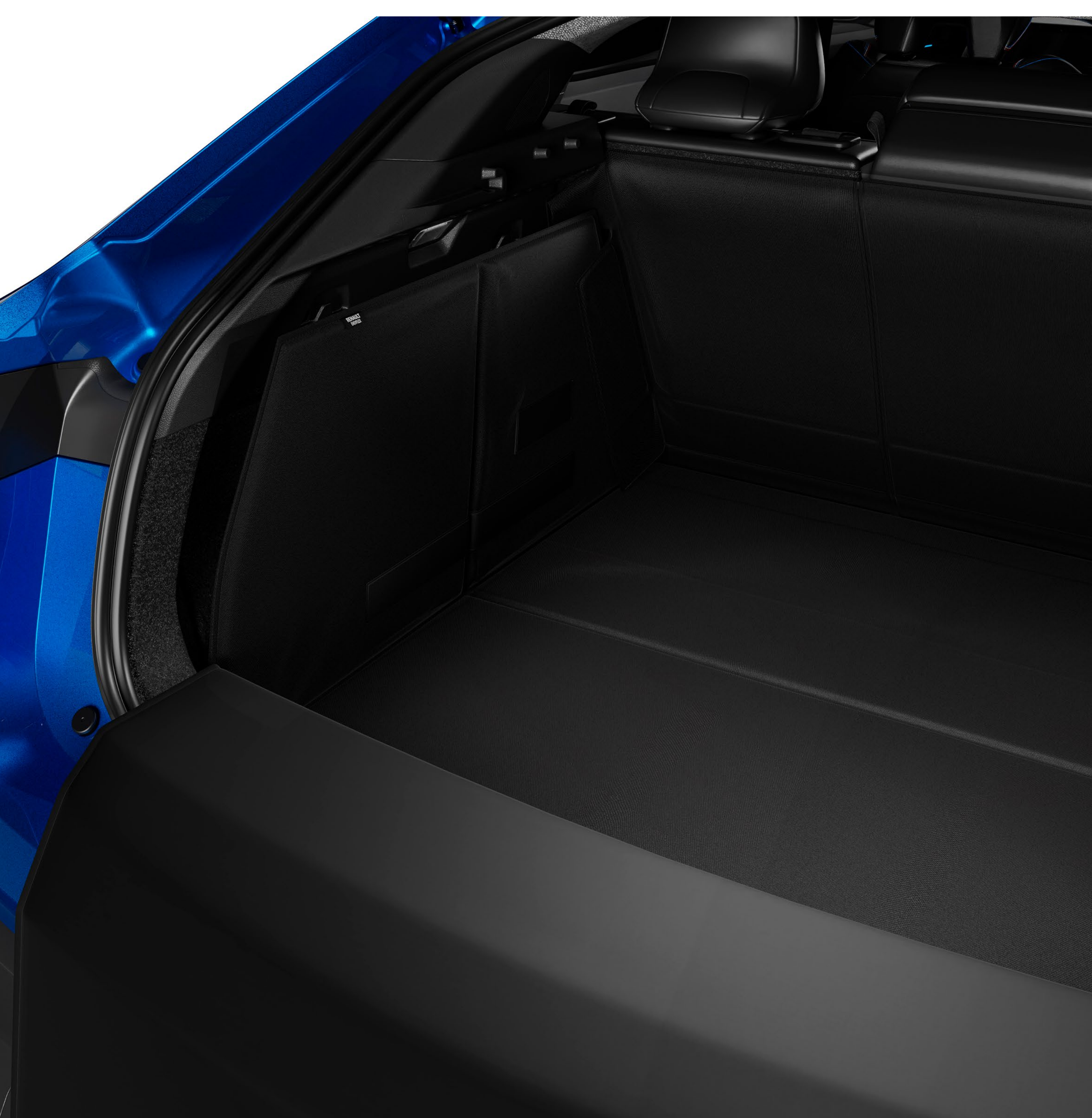
easyflex modüler bagaj koruması

Easyflex katlanabilir, su geçirmez ve kaymaz çizme koruması ile açık hava aktivitelerinizin keyfini çıkarın. Modüler yapısı sayesinde arka koltuk sırasının farklı konfigürasyonlarına uyum sağlayarak büyük ve kirli eşyaların taşınmasına olanak tanır.