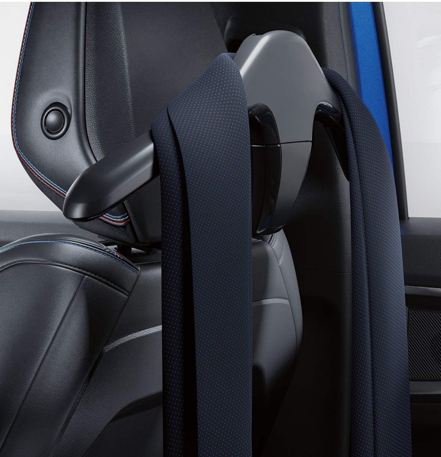
çok işlevli sistem üzerinde askı

Koltuk baş dayanaklarına kolayca takılabilen askı, yolculuk sırasında ceketinizi veya montunuzu tutabilir. Oldukça pratik olan bu parça, kolaylıkla çanta askısı veya ekstra bir raf ile değiştirilebilir.