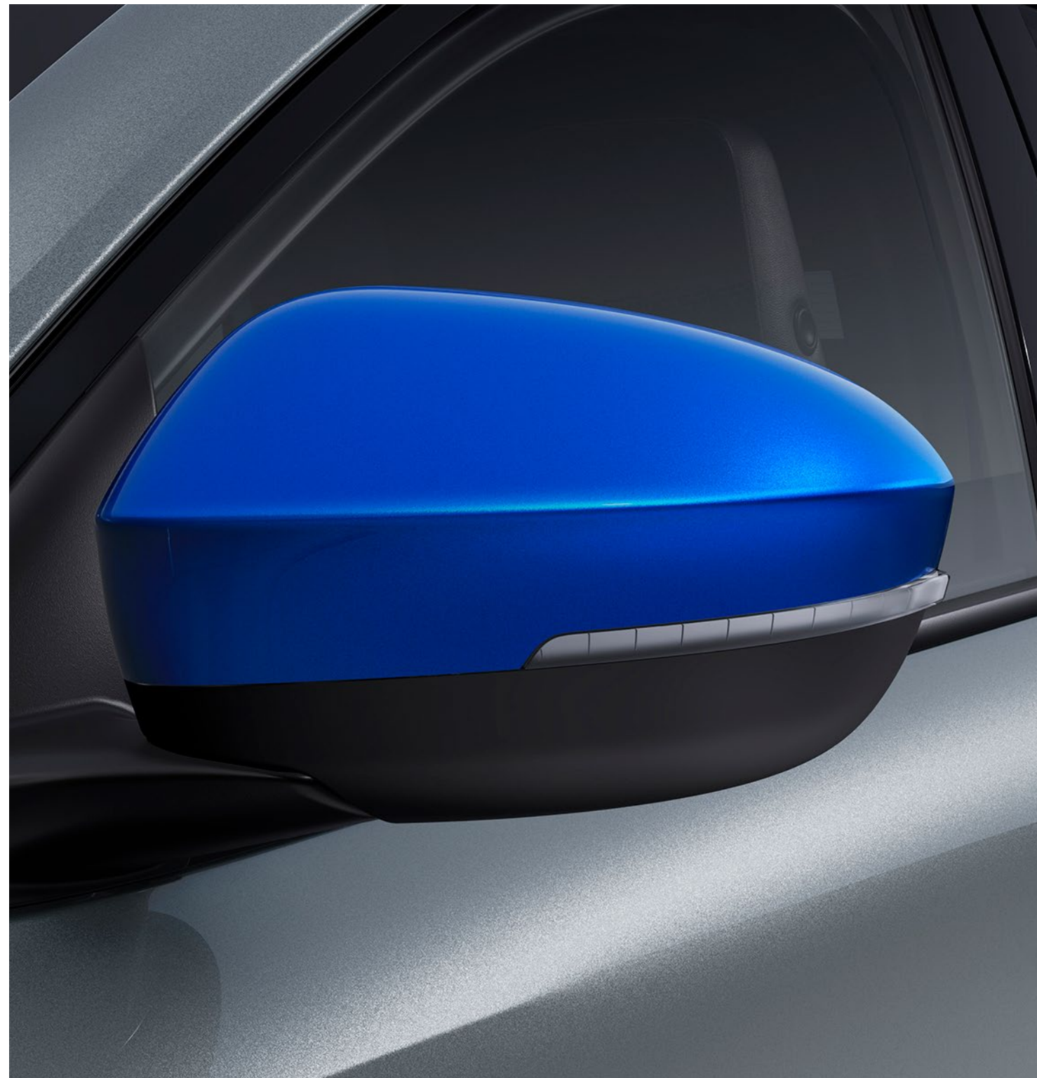
zirve mavisi ayna gövdeleri