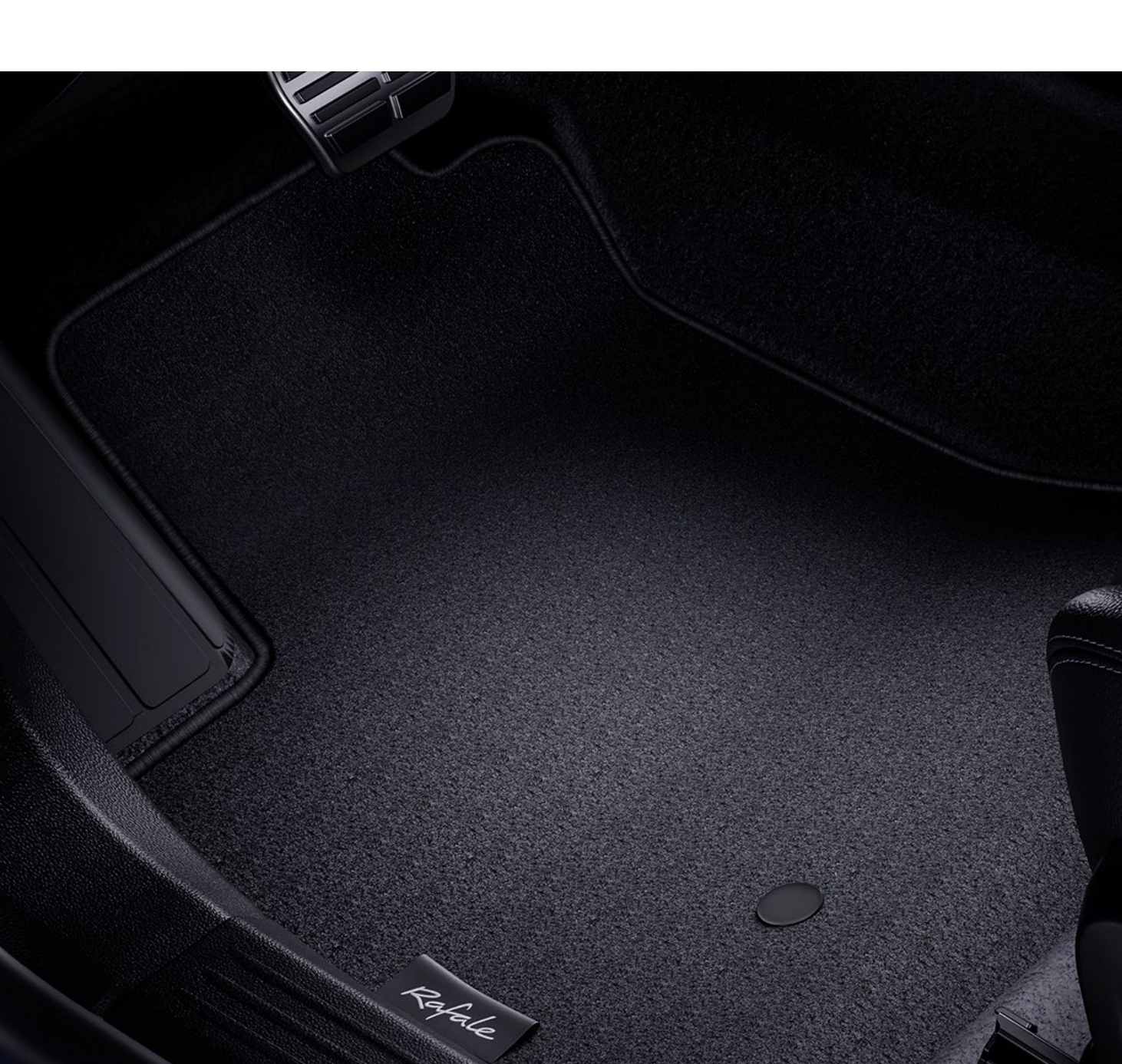
comfort kumaş paspaslar

Su geçirmez ve bakımı kolay ön ve arka kauçuk paspaslar zemini nem ve kirden korur. Şık bir koruma için kumaş paspasları tercih edin.