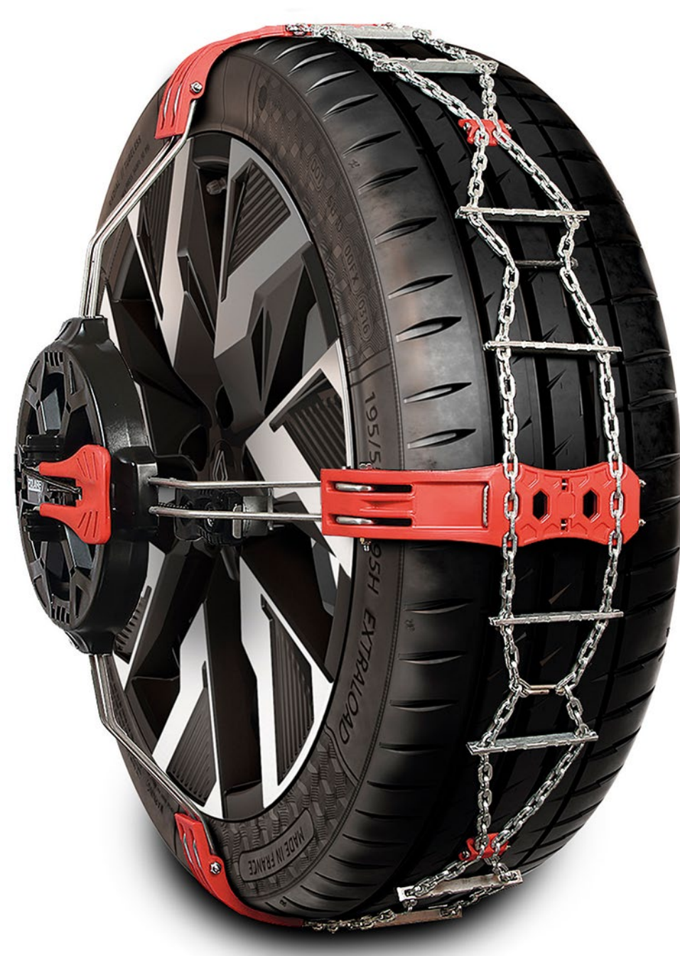
steelgrip kar zincirleri