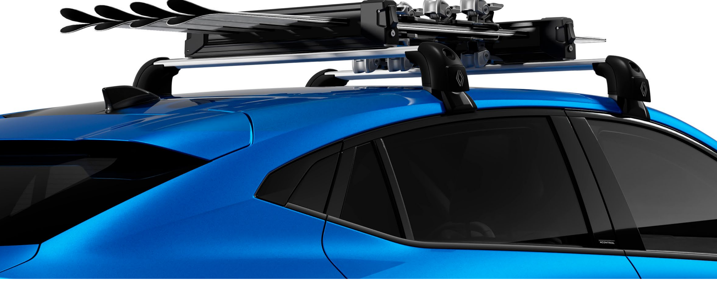
QuickFix tavan çıtaları ve dört çift kayak taşıyıcı

Kayaklarınızı yanınıza alın, tavan çıtası kayak askısı ile güvenle taşıyın.