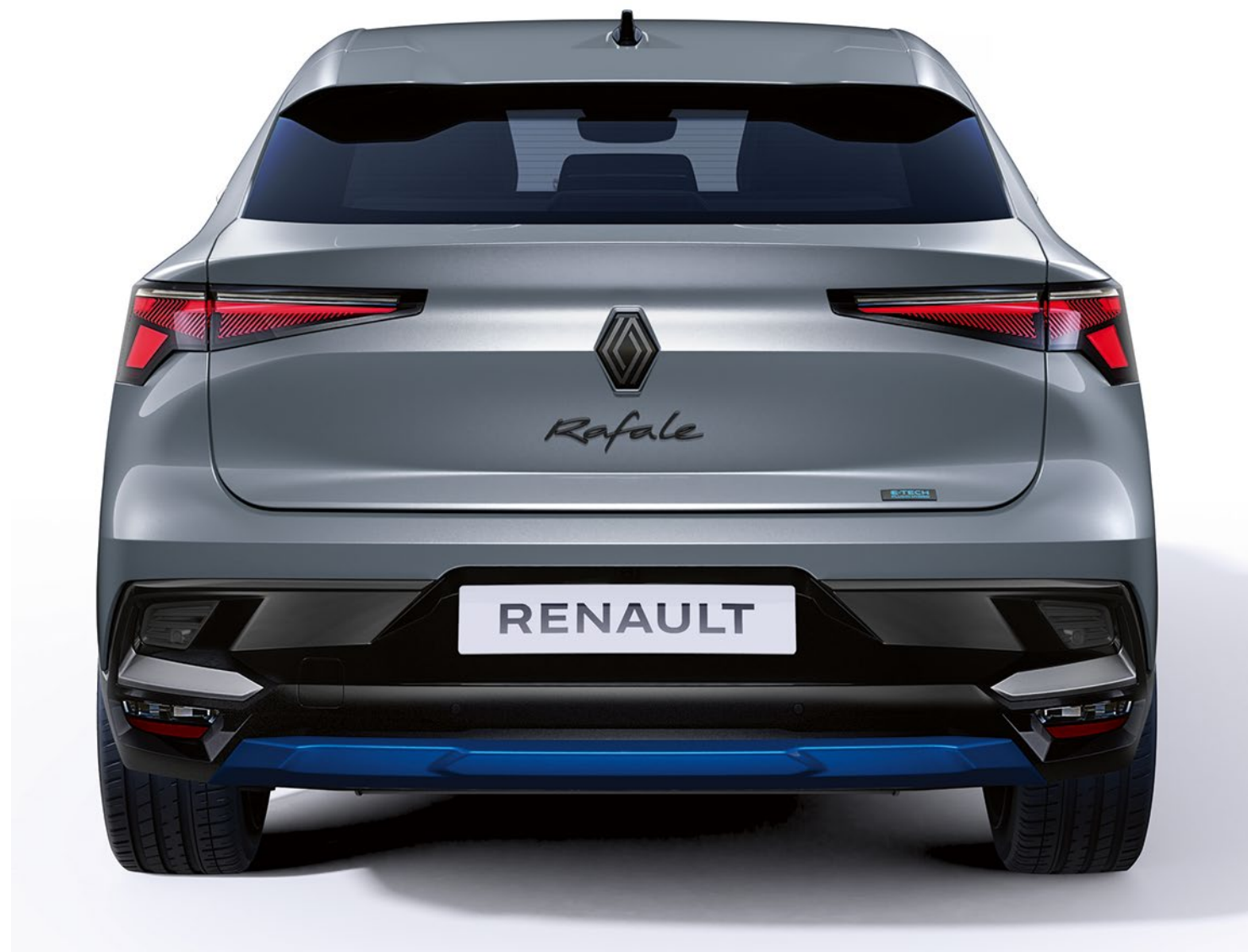
summit blue kişiselleştirme paketi, ön ve arka görünüm