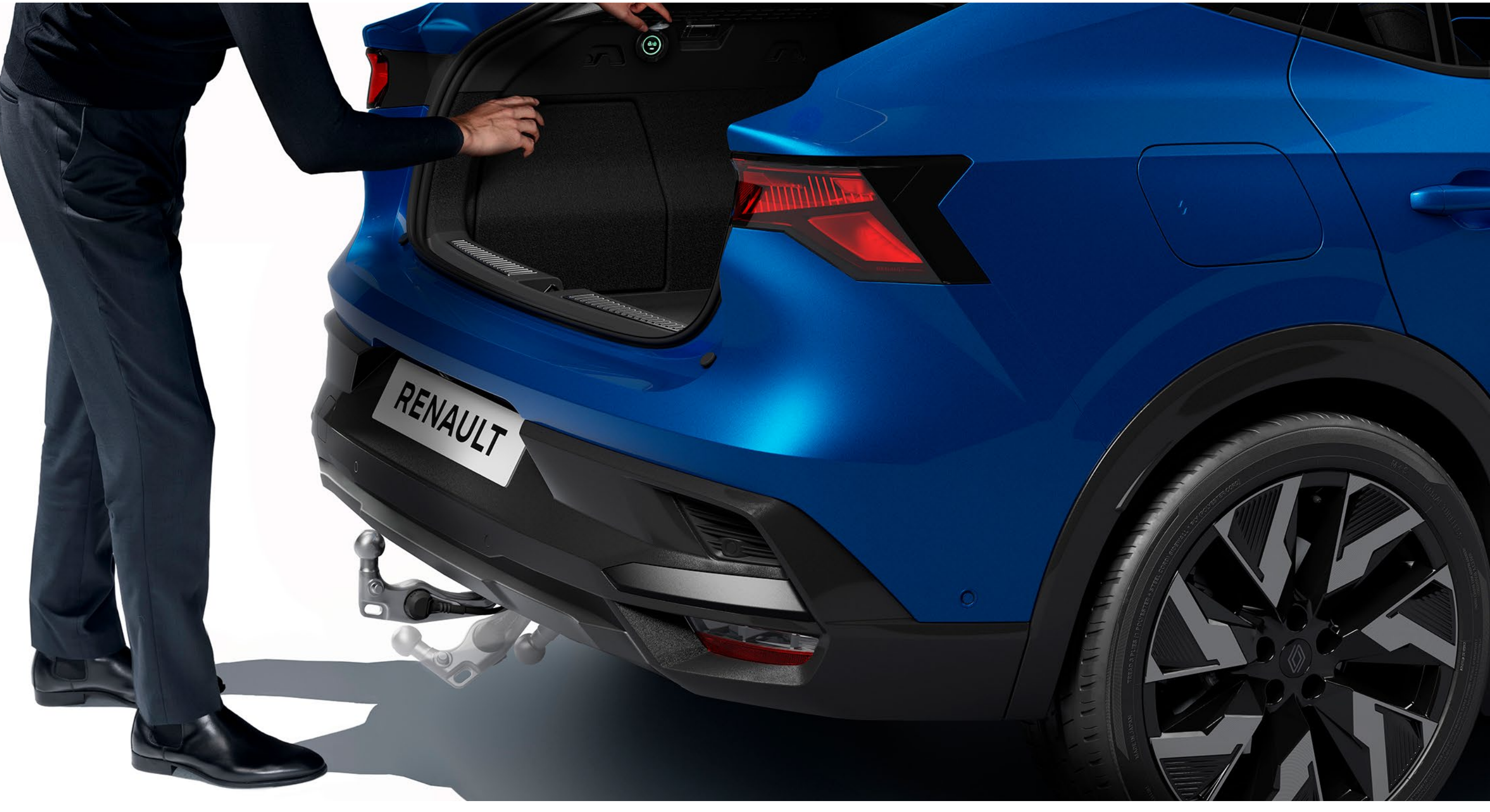
elektrikli geri çekilebilir çekme çubuğu

Elektrikli geri çekilebilir çeki demiri ile aracınızın tasarımını koruyun. Bagajda bulunan bir kumandaya basıldığında, bilyeli mafsal birkaç saniye içinde geri çekilir.