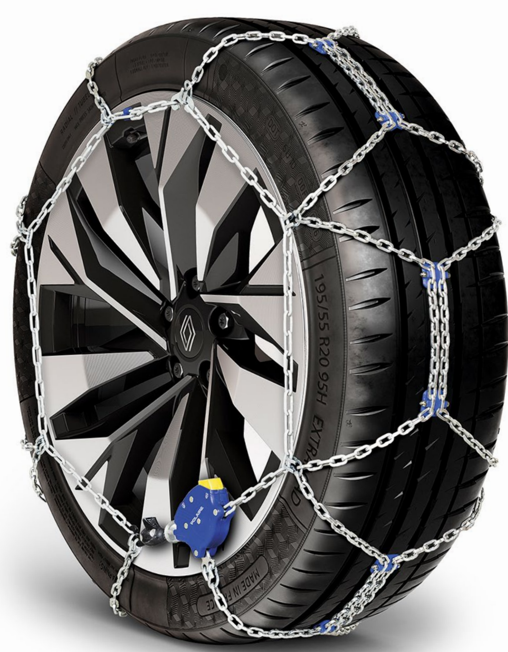
standart kar zincirleri

Renault Rafale'inize uyarlanmış kar zincirleri takın. Sezgisel olarak anlaşılabilir şekilde kolayca takılabilen bu zincirler, zorlu yüzeylerde optimum tutuş sağlar.