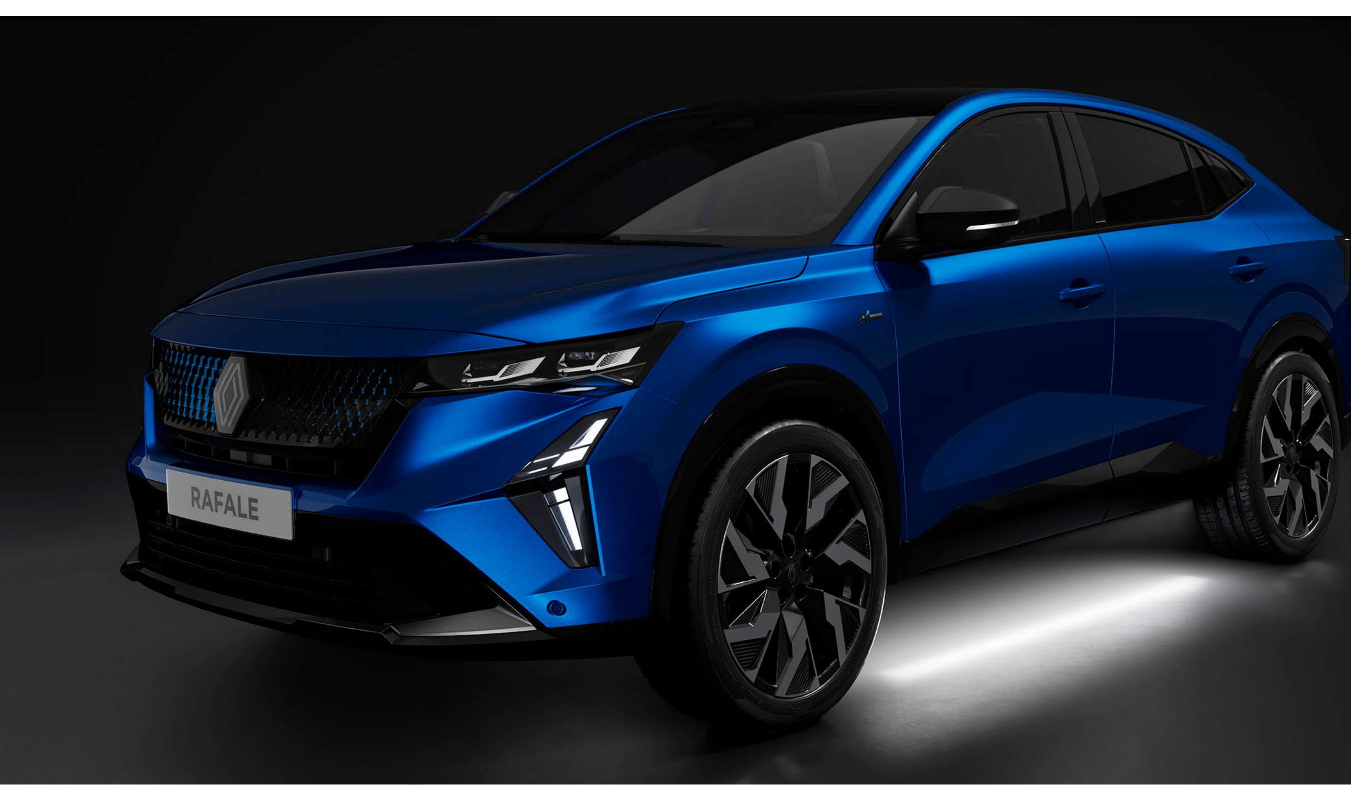
gövde altı aydınlatması

Karanlık otoparklarda aracınızı kolayca bulun. Marşpiye panelinin altındaki LED aydınlatma siz yaklaştığınızda devreye girer ve sizi şık bir şekilde selamlar.