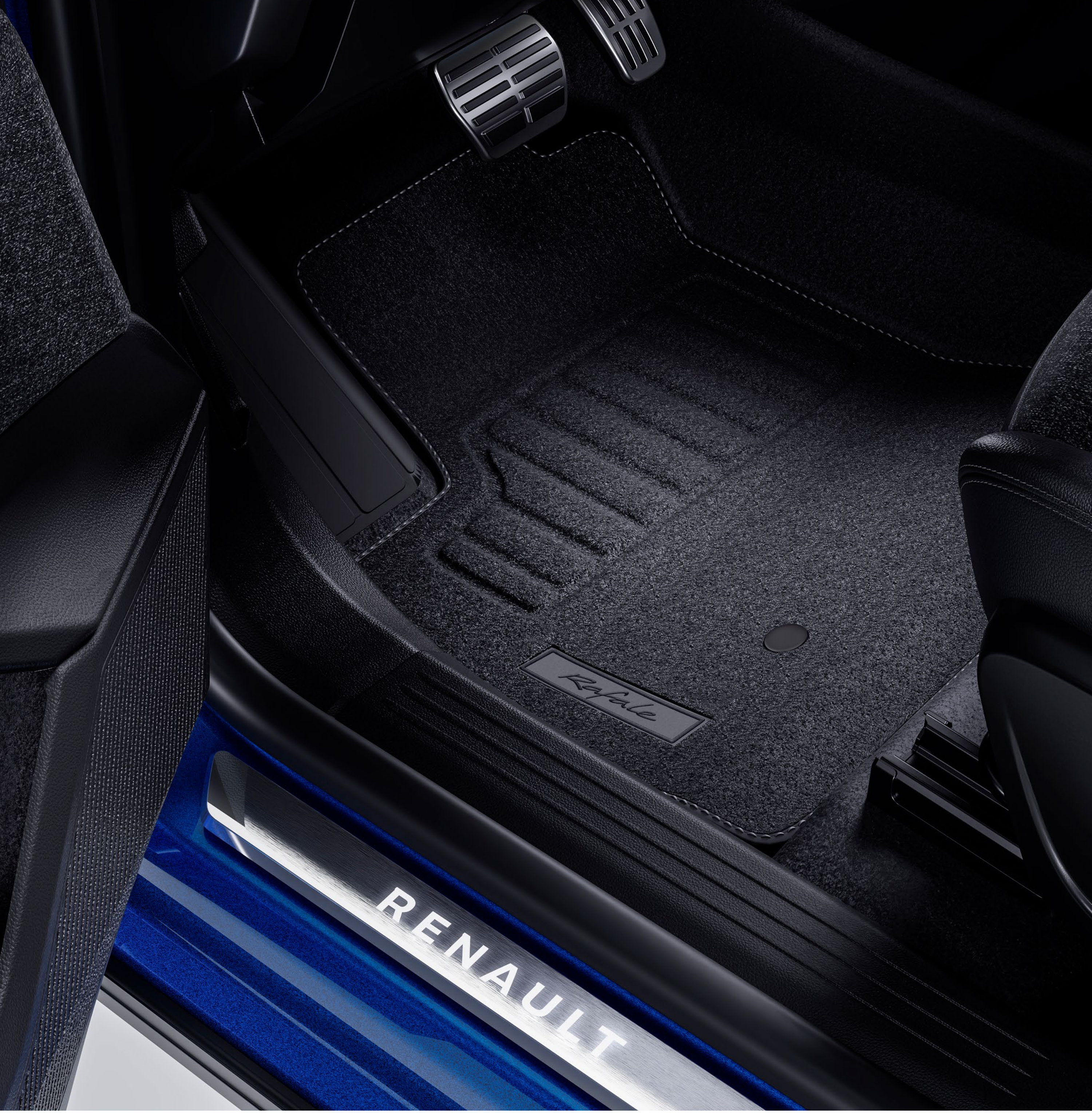
aydınlatmalı Renault ön kapı eşikleri, spor pedal ünitesi ve premium kumaş paspaslar

Renault logolu eşikler, ön kapı altlarını şık bir şekilde süsler ve kapılar açıldığında aydınlanır. Kokpitte, alüminyum pedal ünitesi sportif bir dokunuş katar.