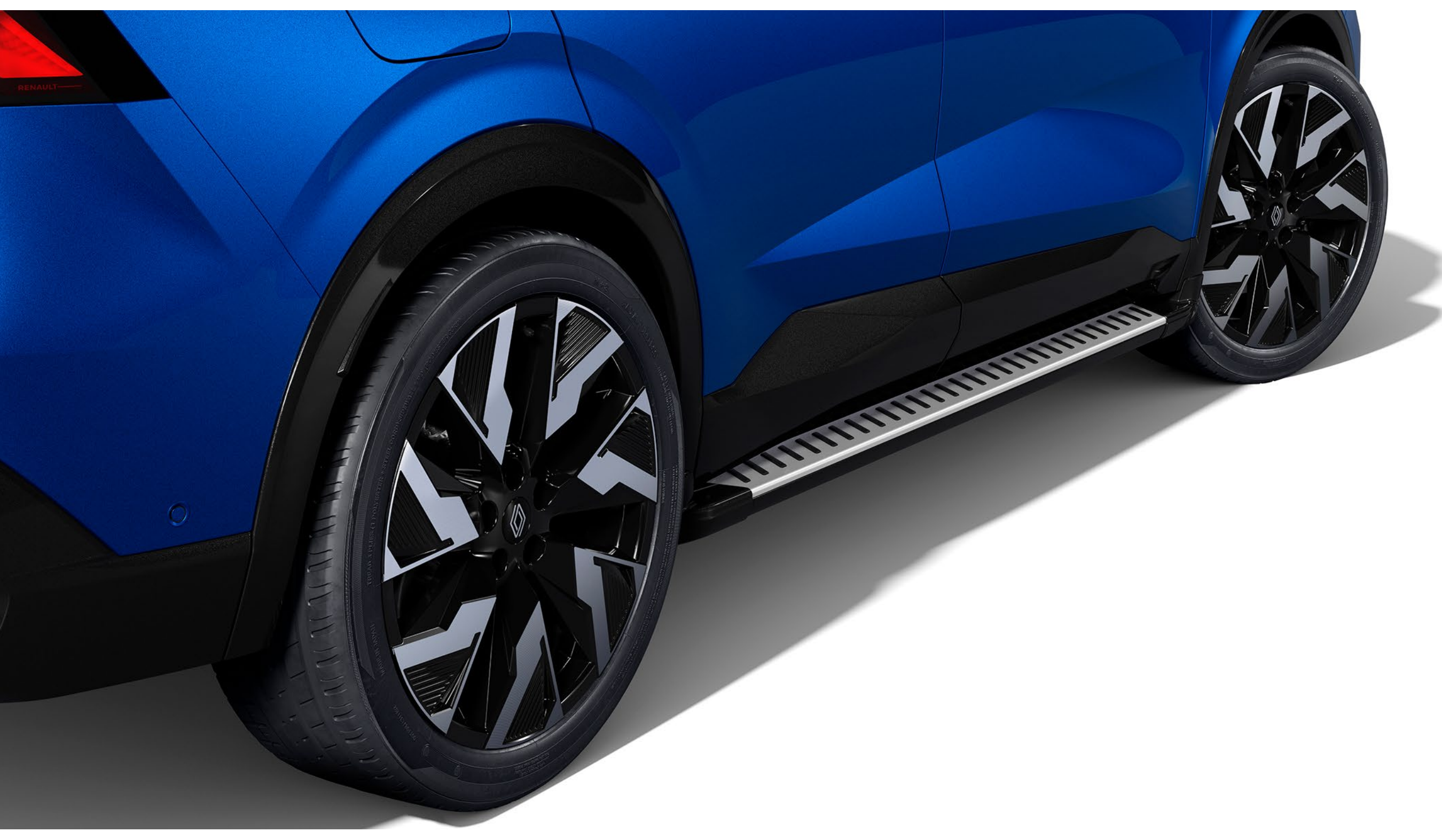
premium yan eşik paketi

Özel olarak tasarlanmış yan eşikler Renault Rafale'in iddialı stilini güçlendiriyor. Tavana erişimi de kolaylaştıran bu parça, aynı zamanda aracın karoserini koruyor.