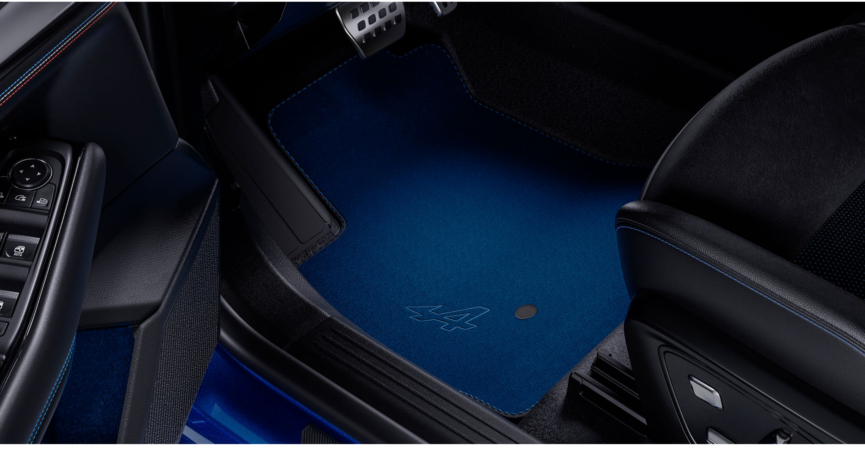
esprit Alpine kumaş paspaslar

Mavi üst dikişli premium Alpine işlemeli paspaslar, kabini Alpine ruhuyla doldurur.