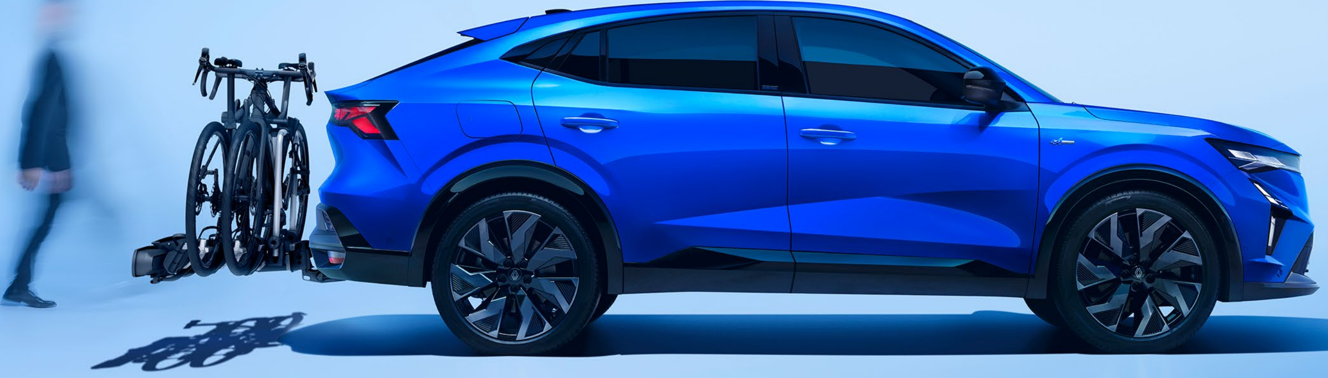
elektrikli geri çekilebilir çeki demiri ve çeki demiri üzerinde 3 bisiklet taşıyıcı

Renault Rafale için özel olarak geliştirilen çeki demiri seçeneklerinden yararlanın.