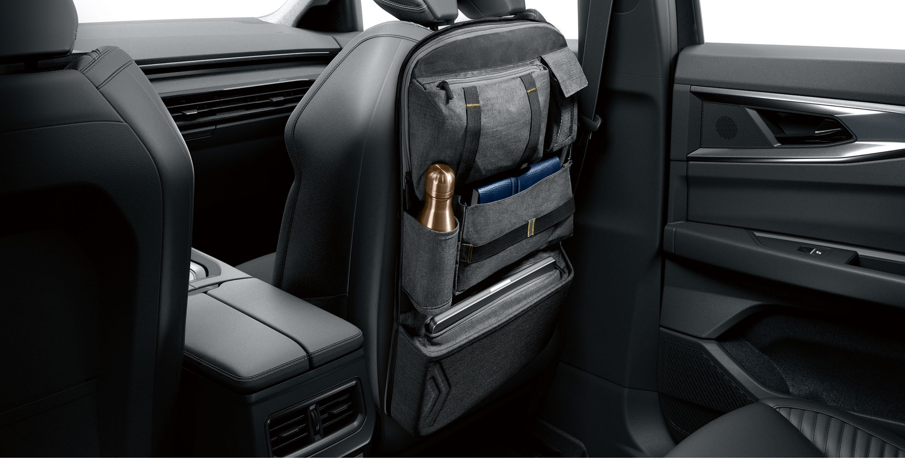
ön koltukta çok işlevli düzenleyici

Ön koltuğun arkasındaki çok işlevli düzenleyici, günlük eşyaları saklamak için beş cebe ve dijital tablet için özel bir alana sahiptir. Benekli gri renk olan bu aksesuar, altın rengi üst dikişlerle süslenmiştir ve Renault logosu taşır.