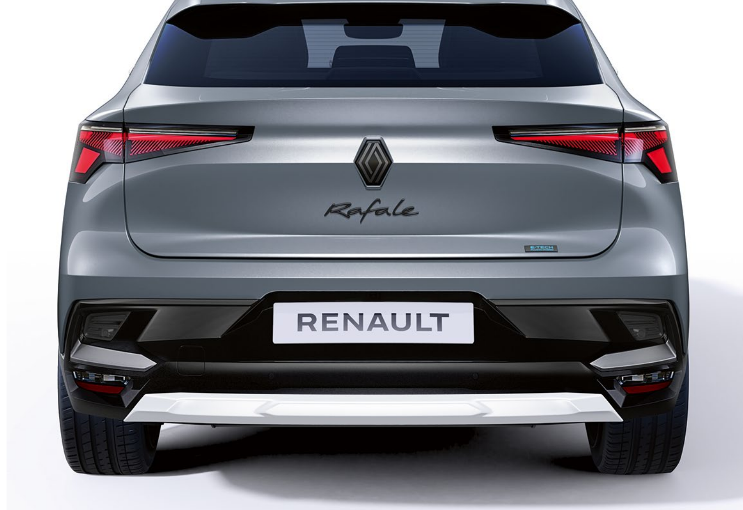
saten inci beyazı özelleştirme paketi, ön ve arka görünüm

Beyaz veya mavi kaplamalı ayna gövdeleri zarif bir dokunuş katar.