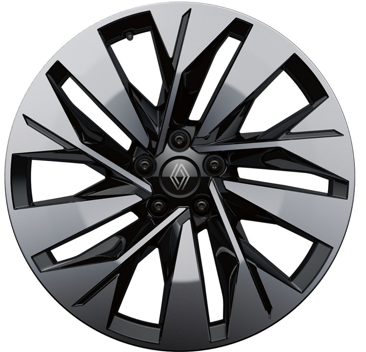
20" sonic siyah elmas kesim alaşım jantlar