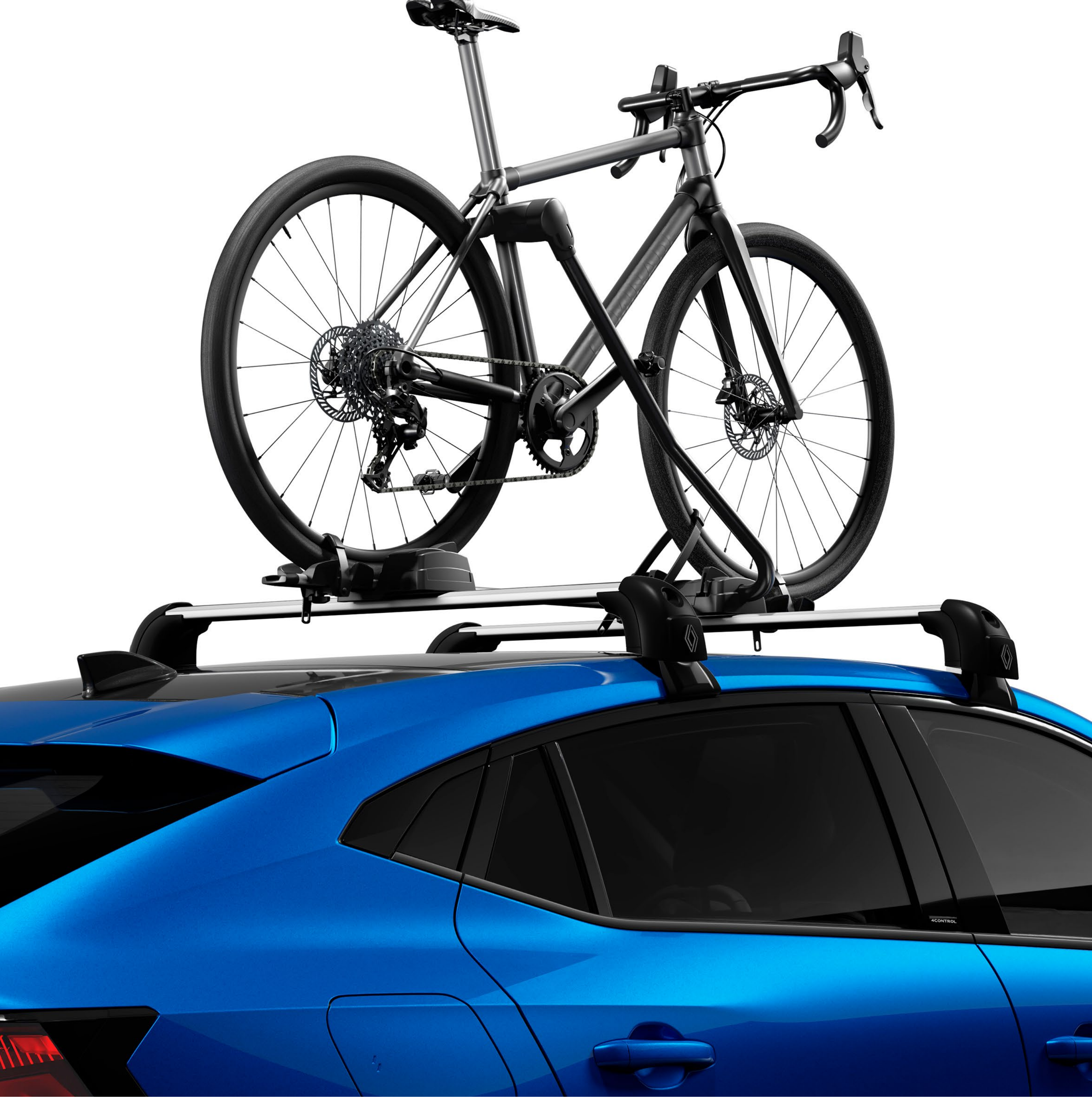
tavana monte edilen bisiklet taşıyıcı çıtaları

Şehir dışında geçireceğiniz hafta sonlarının keyfini çıkarın veya daha uzak maceralara atılın. Bisiklet, uçurtma sörfü, snowboard veya kayakla güvenli bir şekilde seyahat edin ve bunları tavan çıtalarına kolayca takın.