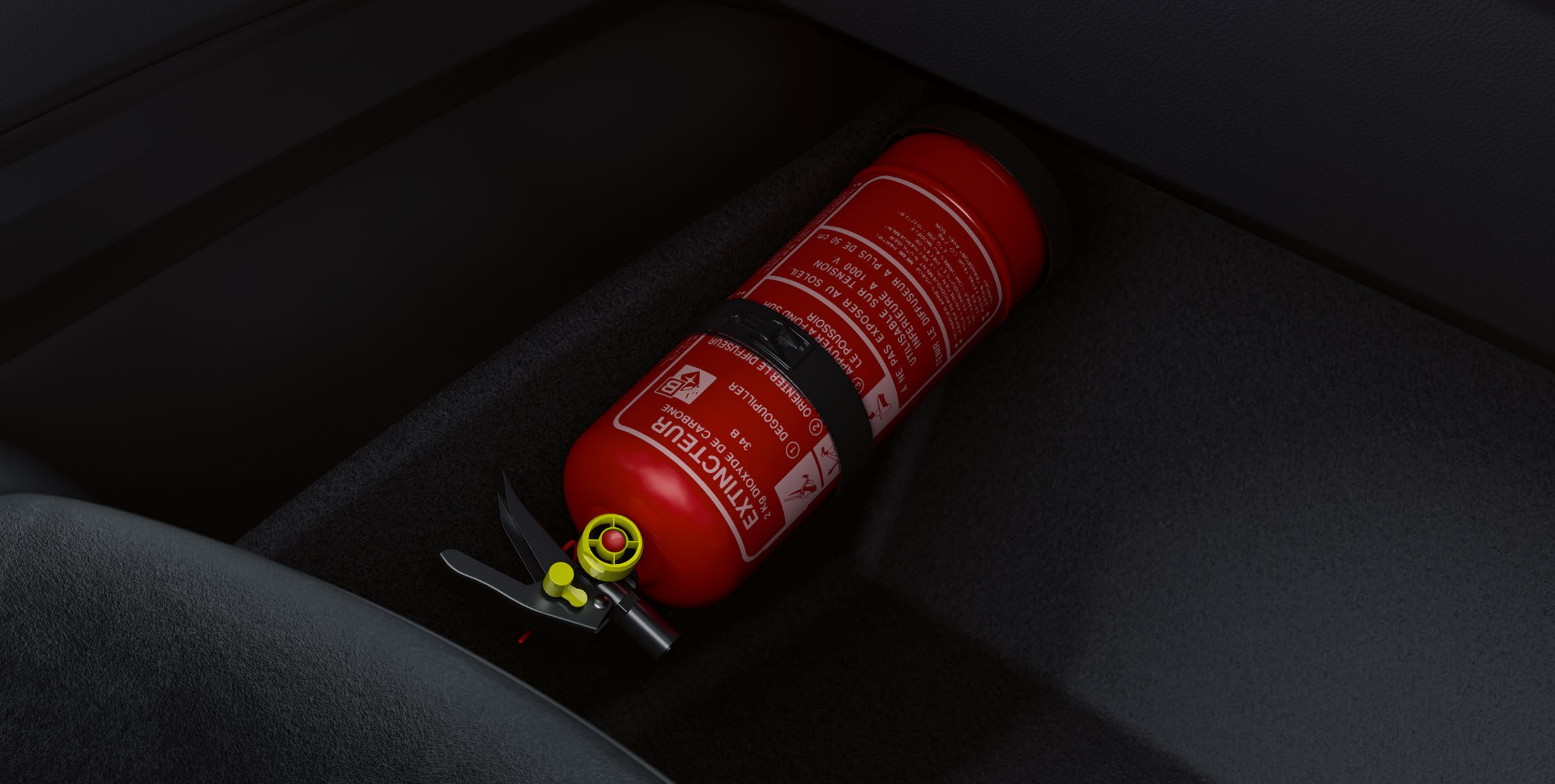
basınç göstergeli 1 kg yangın söndürücü

Renault Rafale'inize uyarlanmış kar zincirleri takın. Sezgisel olarak anlaşılabilir şekilde kolayca takılabilen bu zincirler, zorlu yüzeylerde optimum tutuş sağlar.