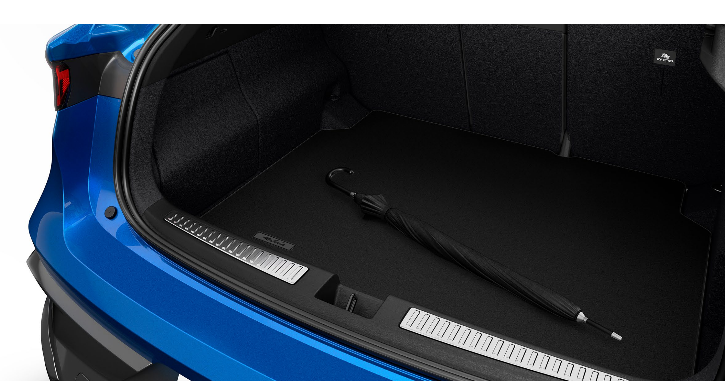
premium bagaj paspası

Premium kumaş bagaj paspası, bagaj döşemesi için şık bir koruma sağlar, Rafale logosuyla özelleştirilmiştir.