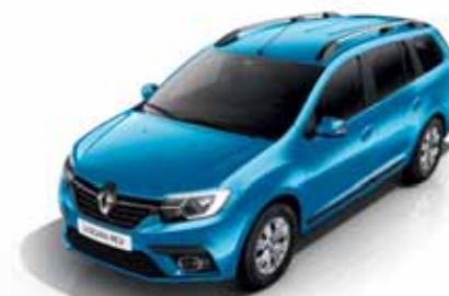
RPL Блакитний азурит**