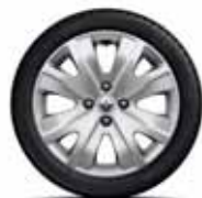
Сталевий диск з декоративним ковпаком Decade R15