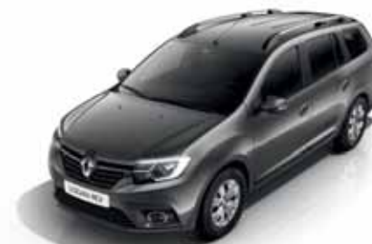
KNA Сіра комета