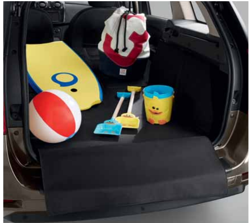
Килимок пропонується як аксесуар

Renault Logan MCV пропонує простір, в якому Ви зможете перевезти будь-кого та будь-що. Цей 5-місний автомобіль подарує Вам комфортну подорож всією родиною у теплій атмосфері його інтер'єру. Logan MCV має неймовірні можливості для трансформації простору завдяки заднім сидінням, що складаються у пропорції 1/3 та 2/3, і величезному багажному відділенню. Він легко адаптується до Ваших потреб та буде ідеальним партнером у всіх Ваших справах.