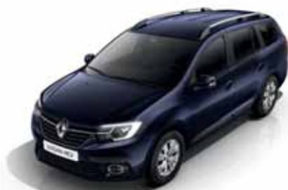
D42 Синій Navy (лак)*