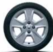
Легкосплавний диск Nepta R15