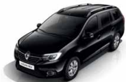
676 Чорна перлина