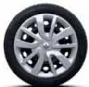
Сталевий диск з декоративним ковпаком Magiceo R15