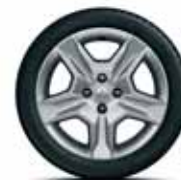
Сталевий диск з декоративним ковпаком Stepway R16*