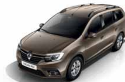
CNM Коричневий попіл