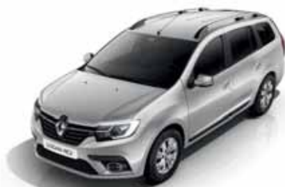
KQA Сіра скеля