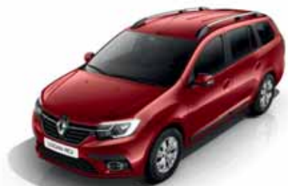
NPI Червоний гранат