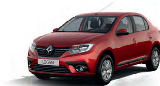
NPI Червоний гранат