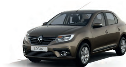
CNM Коричневий попіл