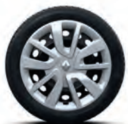
Декоративний ковпак Magiseo R15*