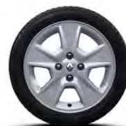
Легкосплавний диск Nepta R15*

* Доступний для версій Life та Life+. ** Доступний для версій Zen.