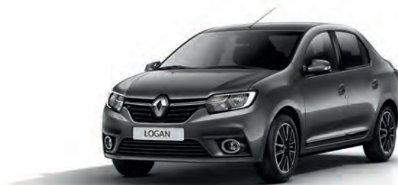
KNA Сіра комета