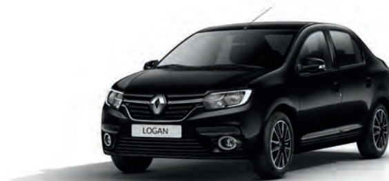
676 Чорна перлина