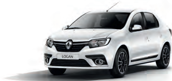
369 Білий лід, лак