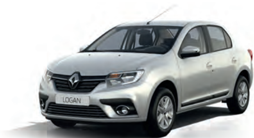
KQA Сіра скеля