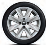
Легкосплавний диск Symphonie R15**